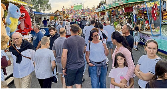
Volle Budengassen: Viehmarkt-Bummel in Bad Wildungen.

Viehmarkt vom 17. bis 20. Juni auf dem Schützenplatz in Bad Wildungen