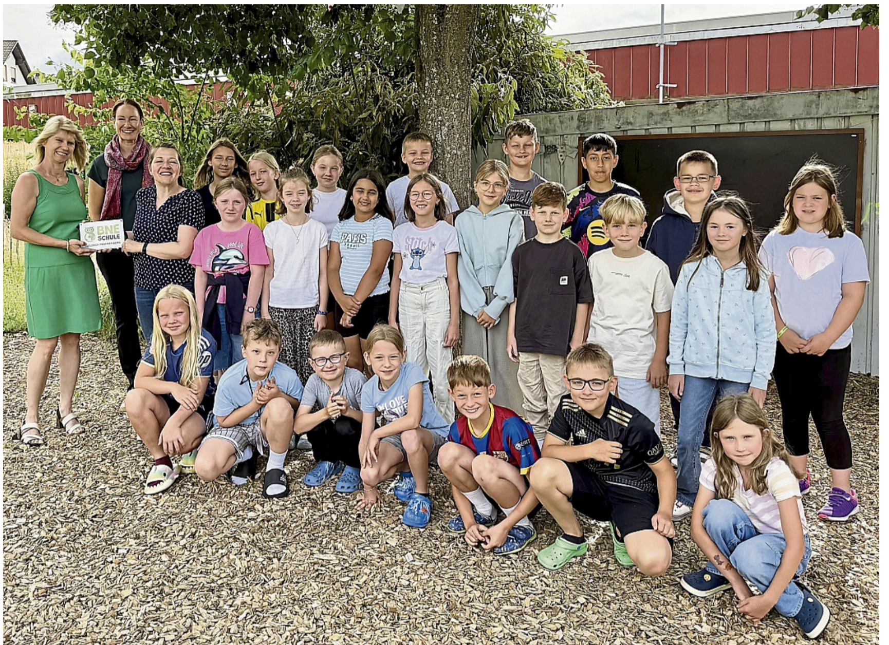
Freuen sich gemeinsam über die Zertifizierung als BNE-Schule: Die Schulgemeinde der Kellerwaldschule Frankenau und Vertreterinnen des Schulträgers Landkreis Waldeck-Frankenberg.

Zwei Projekte wurden durch die Kellerwaldschule im Zertifizierungszeitraum aufgebaut und weiterentwickelt: „17 Nachhaltigkeitsziele“ und „Lebensraum für Tiere im Schulumfeld verbessern“. Bei den Nachhaltigkeitszielen wird monatlich im Rahmen der sogenannten „Vollversammlung“ der Kellerwaldschule (wöchentlich stattfindende Zusammenkunft aller Schulkinder und Lehrkräfte in der Aula) eines der Nachhaltigkeitsziele vorgestellt und kindgerecht erklärt.