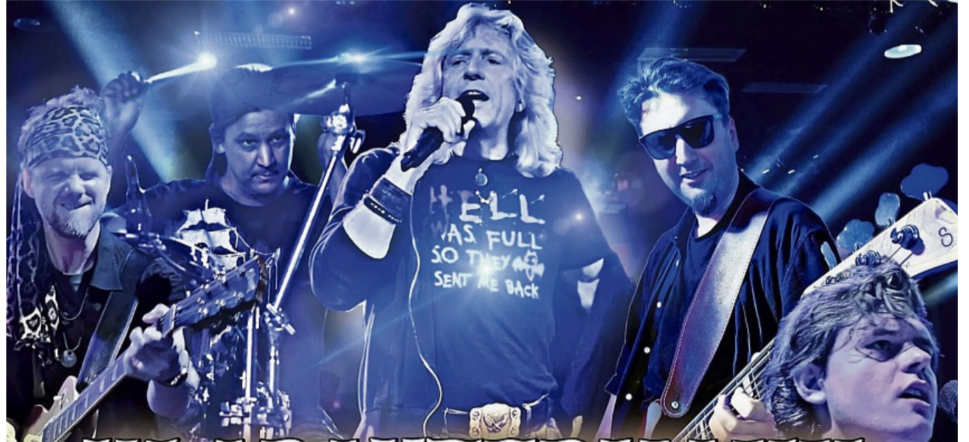
Auch die Band „Klabautermann“ tritt am 25. Oktober in Battenberg auf.

Battenberg – Der nächste Konzertabend des Cultur-Clubs Battenberg ist am Samstag, 25. Oktober, in der Burgberghalle. Fans von Livemusik bekannter Coverbands dürfen sich auf Tribute-Bands von Santiano (Klabautermann) und Marius Müller-Westernhagen („Mariuzz“) freuen.