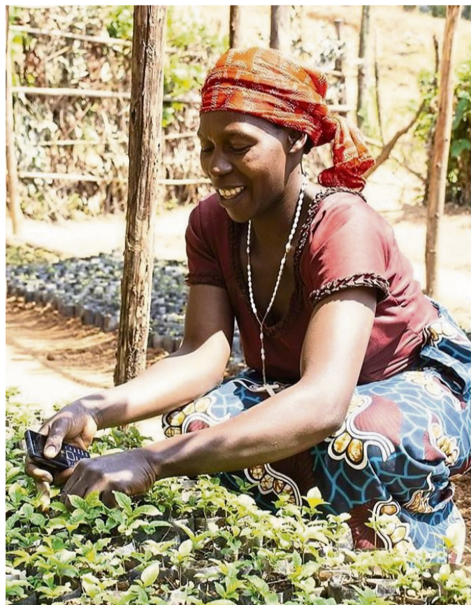
Eine Million Euro spendet die Viessmann Generations Group dem One Acre Fund, der afrikanische Kleinbauern unterstützt. (Symbolbild)

Die Viessmann Generations Group konzentriert sich auf zentrale Themenfelder für eine nachhaltige Zukunft, darunter die Reduktion von Treibhausgasen, Verbesserung der Luftqualität, Verfügbarkeit und der Zugang zu sauberem Wasser sowie die Stärkung nachhaltiger Ernährungssysteme. One Acre Fund leistet durch die Steigerung landwirtschaftlicher Produktivität und Resilienz für Millionen von Kleinbauern laut der Pressemitteilung einen substanziellen Beitrag zu diesen Themenfeldern. „One Acre Fund ist ein mutiges Unternehmen mit einer starken Vision. Wir schätzen ihr Engagement. Armut zu lindern und nachhaltige Lösungen dort umzusetzen, wo sie am dringendsten gebraucht werden“, sagt Max Viessmann, CEO der Viessmann Generations Group. „Wer Kleinbauern