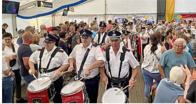
Partystimmung herrscht diesmal in der Festhalle am „Heiligen Abend“ der Wildunger.