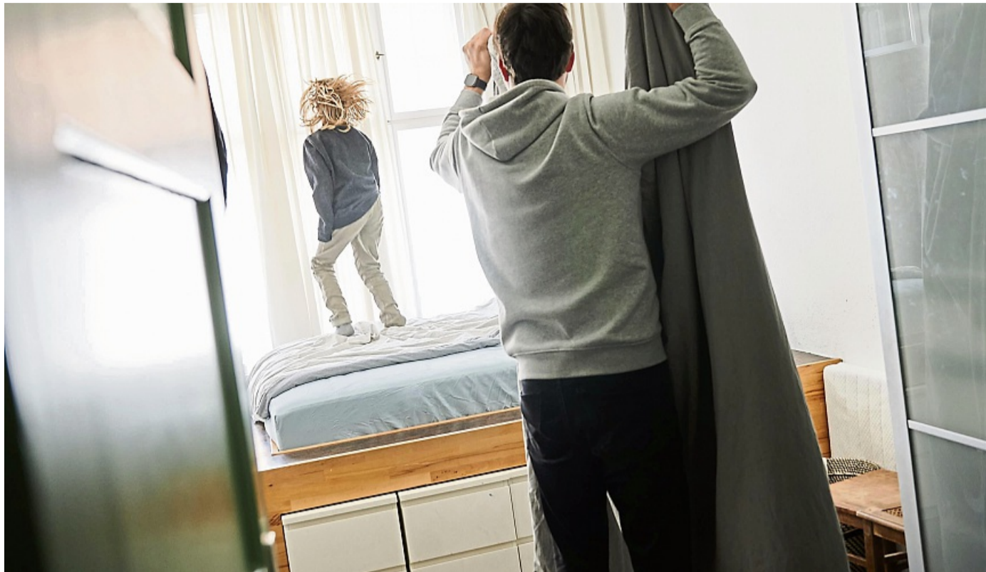
Ein Team bilden: Partnerschaften profitieren davon, wenn beide Partner Verantwortung teilen und sich gegenseitig unterstützen.