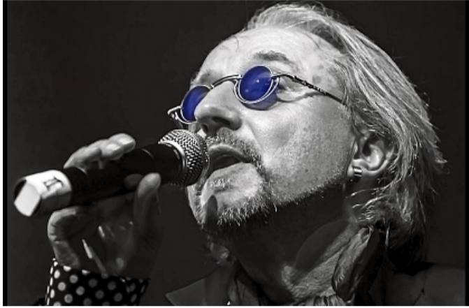
Foto Mariuzz – Westernhagen-Tribute-Band für Konzert am 25. Oktober in Battenberg AGENTUR/NH

Vorverkauf für nächstes Konzert des Cultur-Clubs Battenberg hat begonnen