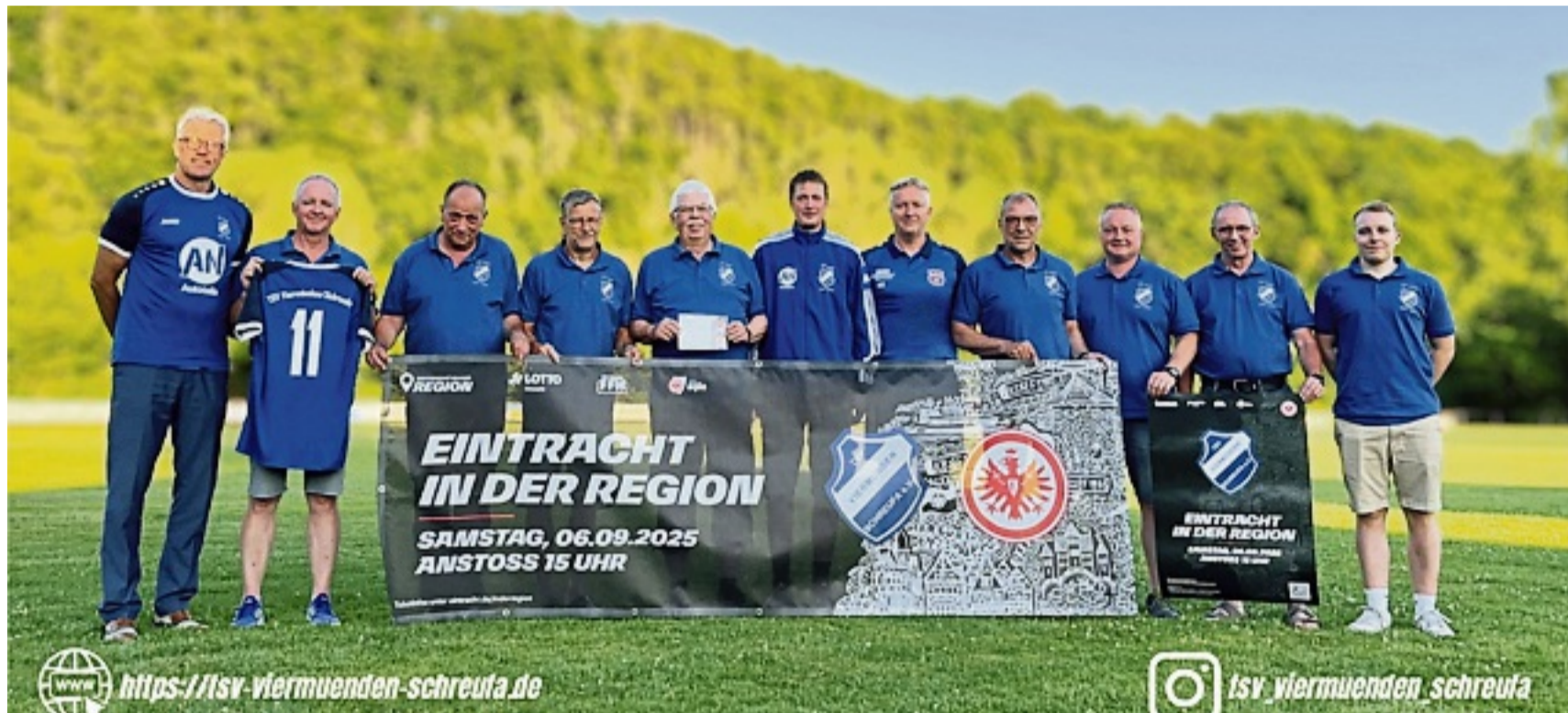
Die Arbeitsgruppe Eintracht des TSV Viermünden/Schreufa freut sich auf das Spiel gegen die Traditionsmannschaft.