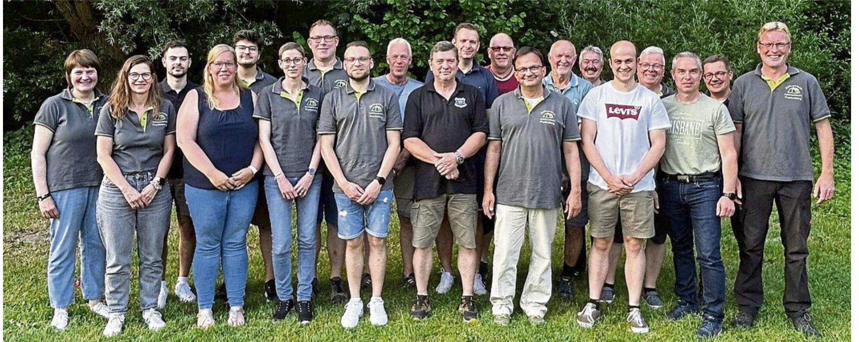
Betreuerschar: Bild zeigt einen Teil des Zeltlagerteams und die Helfer vom Gastgeber ist SV Rengershausen.

Jahreshöhepunkt: 112 Jungschützen an der Nuhne erwartet