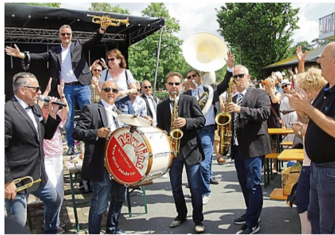
Jazzfrühschoppen mit der N'Awlins BrassBand am Rehbach.

Für das leibliche Wohl ist ebenfalls bestens gesorgt. Der Jazzfrühschoppen bietet also nicht nur Musikgenuss, sondern auch eine Gelegenheit zum gemütlichen Beisammensein direkt am Wasser.