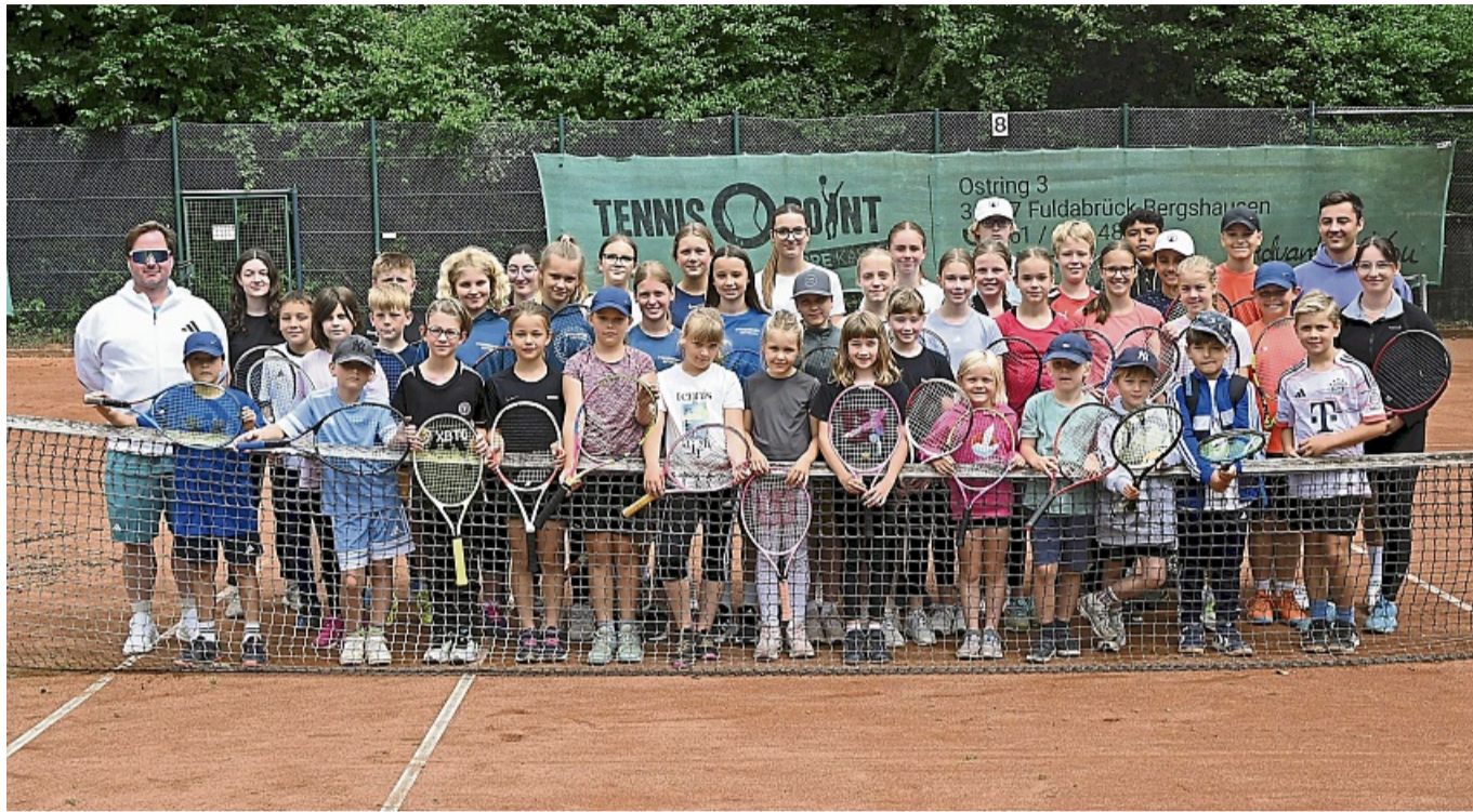
42 Kinder nehmen am Ferienlager des Tennisclubs Korbach in Lengefeld teil. Eine Woche lang informieren sie sich spielerisch zum Thema „Fake News“ – und spielen Tennis.

Acht Gruppen haben die 42 Kinder und Jugendlichen gebildet. Die gesamte Woche hindurch galt es, Punkte für das eigene Team zu sammeln. Das ging durch kreative Teamnamen, die zum Thema passten wie beispielsweise „Pinke Gurken“. Oder durch passende Schlachtrufe und – vor allem –