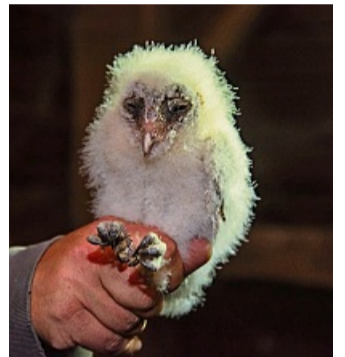
Das kleinste der drei Küken ist noch fast komplett in das flauschige Junggefieder, das sogenannte Daunenkleid, gehüllt.

chen nach dem ersten Schlüpfen. „Bei einer Hungersnot werden die kleinsten Eulen an die größeren verfüttert. Das klingt zwar brutal. Es stellt aber im Vergleich zu anderen Arten nach den Regeln der Evolution einen Überlebensvorteil in Zeiten knapper Nahrung dar“, erläutert Wimbauer. Er ergänzt, dass die Jungvögel fast ausschließlich mit Mäusen gefüttert werden.