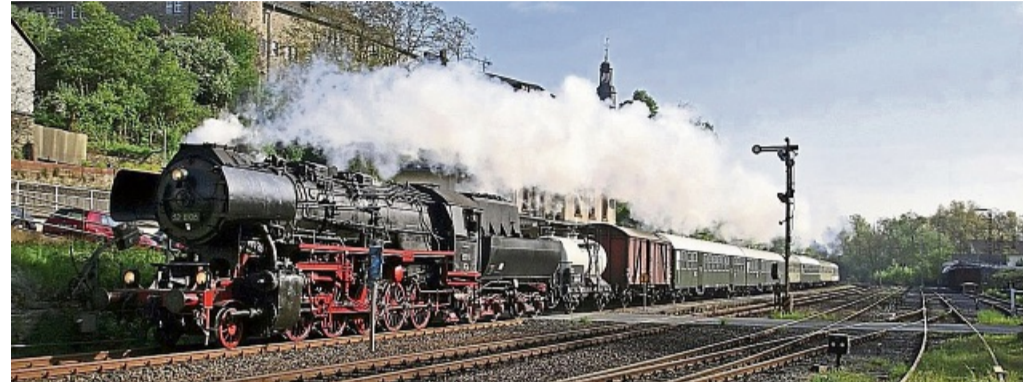
Sonderzug der Eisenbahnfreunde Treysa.

Die Fahrten können nur bei ausreichender Beteiligung stattfinden. Daher freuen sich die Eisenbahnfreunde Treysa e.V. über eine frühzeitige Buchung unter www.eftreysa.de , über das Service-Telefon 06698-9110 441 oder per E-Mail an buchung@eftreysa.de .