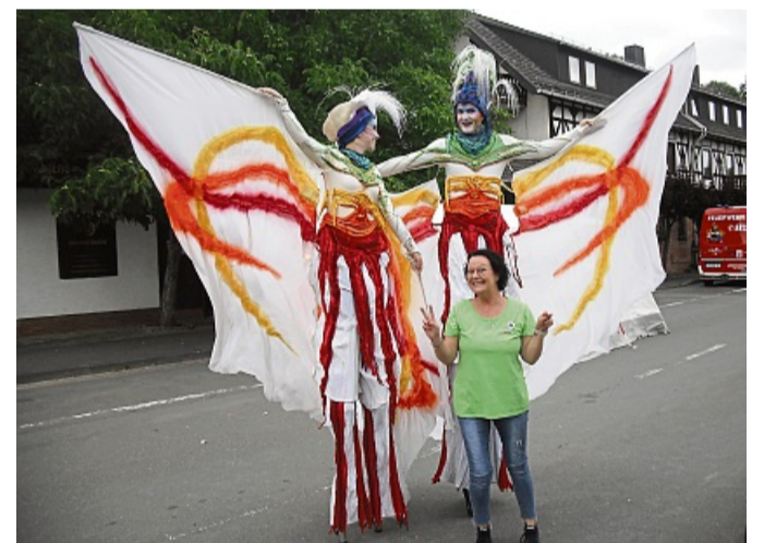
Stelzenkünstler behielten am Vorstaubecken stets den besten Überblick.