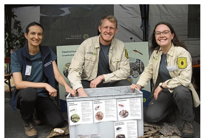
Das Team des Nationalparks informierte unter anderem über heimische Urwaldreliktarten