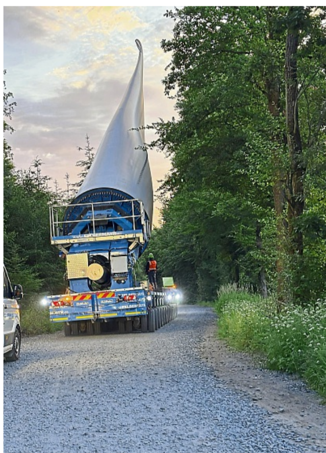
Früh morgens macht sich der Schwertransport auf den Weg vom Lagerplatz am Eidinghäuser Berge auf zur „Marke“.