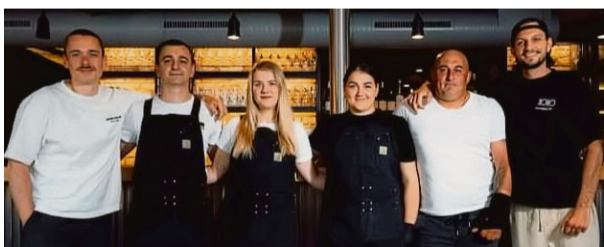
Das Team im Fachwerk 1670 bietet zum einjährigen Bestehen des Restaurants einige kulinarische Überraschungen.

Seit einem Jahr gibt es das Fachwerk 1670 als Restaurant & Weinbar in Waldeck-Sachsenhausen – ein Ort, an dem regionale Küche auf neue Ideen trifft.