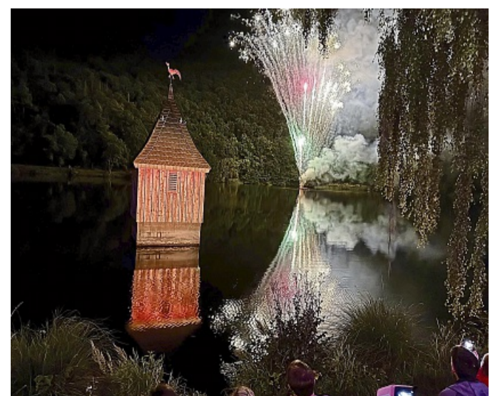
Feuerwerk: Stimmungsvoller geht's nicht. Licht und Schatten-spiel am nachgebauten Turm der untergegangenen Nieder-Werber Kirche.