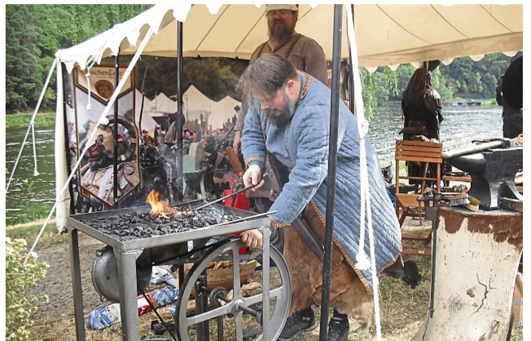
Feuer-Handwerk: Das Drachenfest-Team präsentierte sich unter anderem mit der Schmiede.

Mittelalterlich ging es an den Ständen des Drachenfestes zu, wo es einen bunten Markt von Magiern, Orks, Alchemisten und Rittern gab. Historisch war es auch am Stand der Schützen-gesellschaft 1604 Sachsenhausen, die ihre Kanone mitgebracht hatten und sich bereits auf das Freischießen freuen, welches vom 26. bis 29. Juni 2026 gefeiert werden soll.