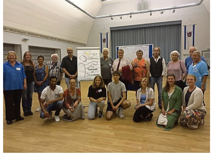
Seit Anfang dieses Jahres organisiert das Netzwerk für Toleranz monatlich ein kreisweites Treffen.