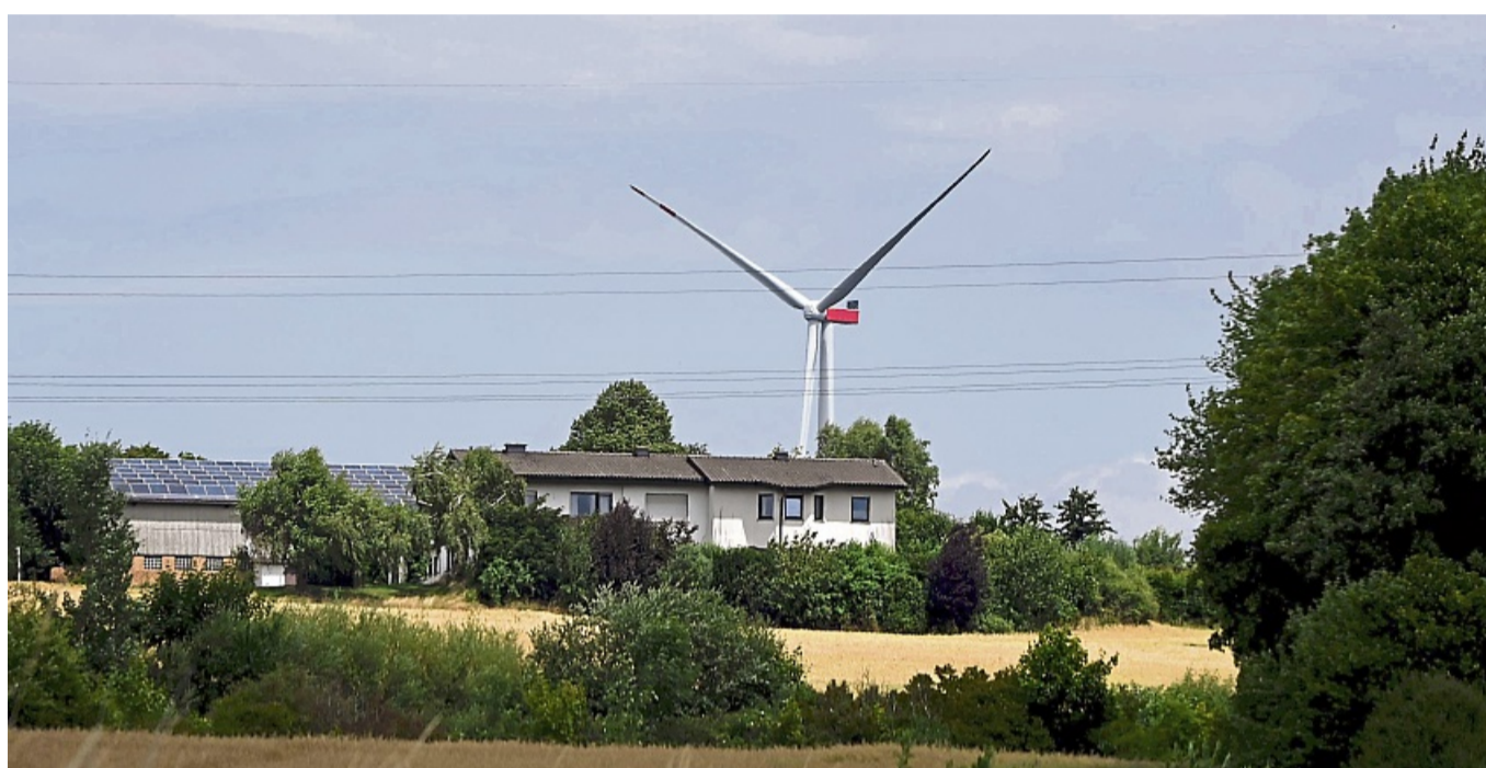
Imposante Ausmaße haben die einzelnen Elemente und fertigen Energieanlagen.

Auch wenn die Bauarbeiten im August enden sollen, gehen die Energieproduzenten noch nicht direkt ans Netz. Die Anlagen müssen dann noch im Detail abgenommen und deren Betrieb genehmigt werden. Dann folgt eine „Testbefliegung“, um zu kontrollieren, ob alle Vorgaben der Luftfahrt eingehalten worden sind. Im Ok-