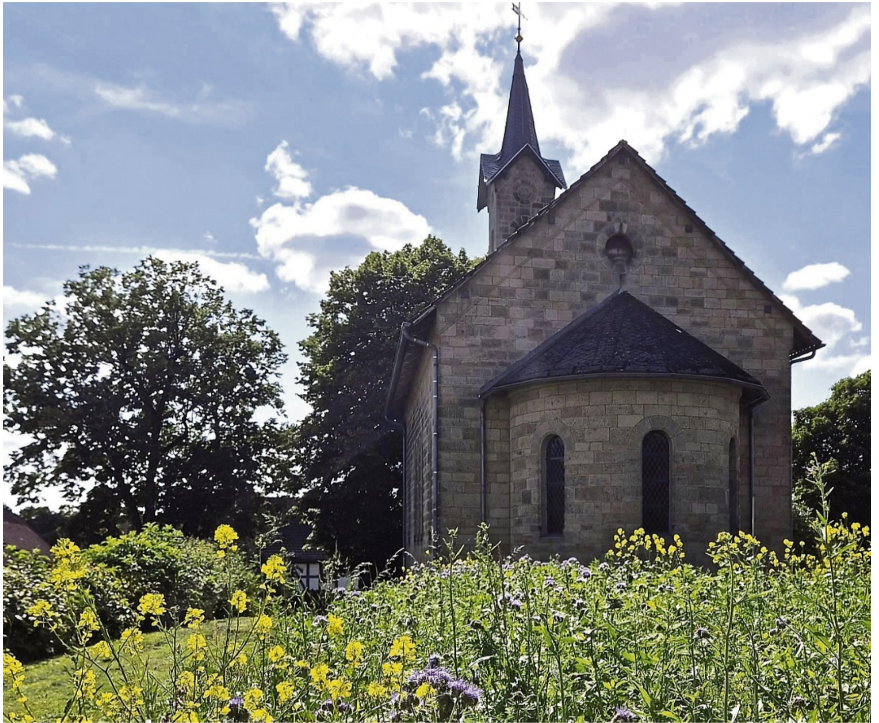
Im Blumenbeet hinter der Kirche sind seit Kurzem Schmetterlinge, Hummeln und Bienen Zuhause.

Auch möchte der Kirchenvorstand auf das im nächsten Jahr bevorstehende Kirchenjubiläum hinweisen: Die Imbser Kirche wird im Jahr 2026 165 Jahre alt und die Planungen für das Geburtstagsfest laufen. „Der Imbser Kirchgarten wird einer der Begegnungsorte für unsere gemeinsame Feier sein“, heißt es weiter. kir