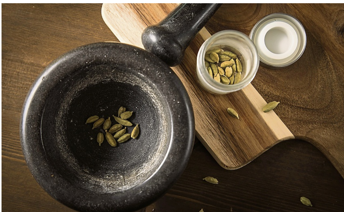
Experten empfehlen, Gewürze wie Kardamom im Ganzen zu kaufen und sie selbst zu mörsern, anstatt ein Pulver zu nehmen.