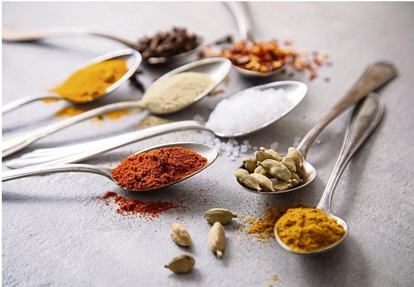
Wer gerne asiatische oder orientalische Noten in Speisen bringt, sollte neben Nelken, Chili-Flocken, weißem Pfeffer, Salz und Paprikapulver auch Kardamom, Currypulver und Kurkuma im Hause haben.

Am Beispiel des Pfeffers erklärt sie: „Eine Pfefferfrucht ist wie ein kleiner Aroma-Safe. Darin steckt ätherisches Öl, das dem Pfeffer eine feine Zitrusnote und etwas Holziges gibt“. Wer nicht nur Schärfe, sondern auch diese feinen Aromen möchte, erreicht das durch Aufspalten der Ölzellen - und