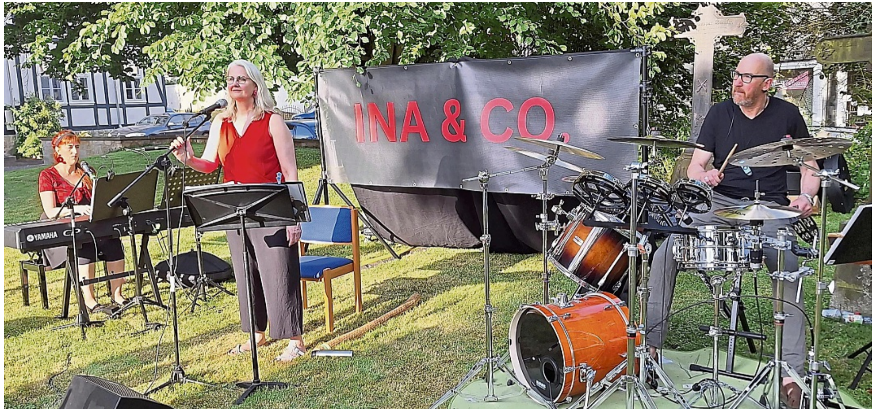
300 Jahre Kirche Uschlag: Beste Unterhaltung mit Welthits boten „Ina und Band“ auf dem Platz vor der Kirche.

Abschluss und Höhepunkt der Jubiläumsfeier waren der Festgottesdienst am Sonntag. Am Kircheneingang begrüßten Pastorin Ede und einige Kirchenvorstandsmitglieder die Besucher. Mit einem feierlichen