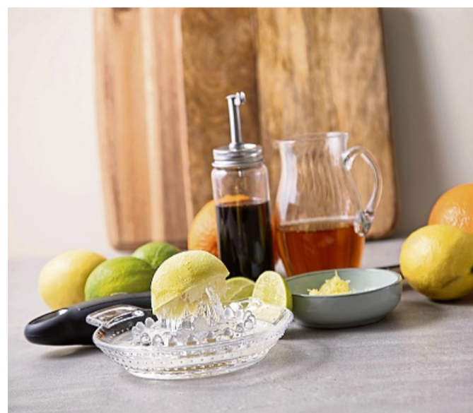
Säure bricht schwere Strukturen auf und bringt Frische: Das klappt etwa mit Apfelessig, Balsamico, Schalen und Saft von Zitrusfrüchten wie Orangen, Zitronen und Limetten.