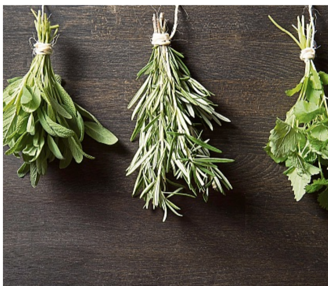
Gewürzfans sollten sich Kräutersträuße zum Trocknen in die Küche hängen. So können Salbei, Rosmarin, und Zitronenmelisse (l-r) bei Bedarf mit gemörsert werden.