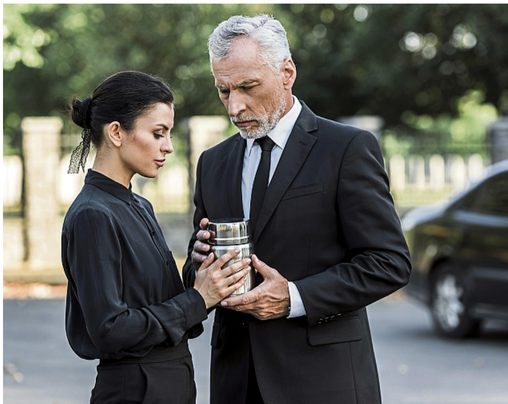
Stirbt ein liebgewonnener Mensch müssen einige wichtige Schritte erfüllt werden.

Wer sich der Kirche verbunden fühlt oder weiß, dass dies bei dem verstorbenen Angehörigen der Fall war, kann bei einem Todesfall den zuständigen