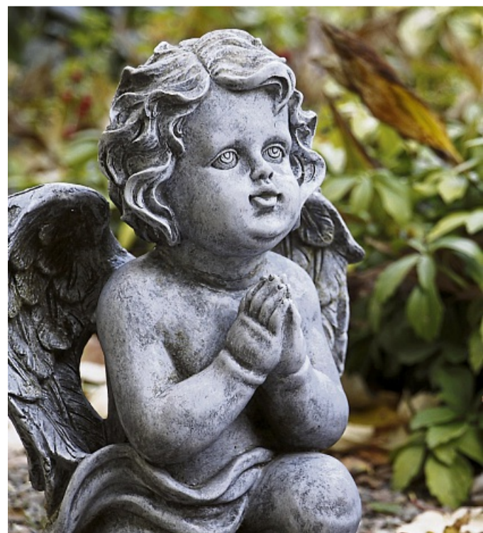
Welche Figur die passende für das Grab ist, hängt vom eigenen Geschmack sowie von den Friedhofsregeln ab.

Alternativ zu den antiken Statuen können Sie auch eine der zahlreich angebotenen Engelsfiguren wählen. Viele Steinmetze haben vorgefertigte Grabfiguren in ihrem Sortiment. Grundsätzlich können Sie sich aber auch eine passende Grabfigur von einem Bildhauer anfertigen lassen.