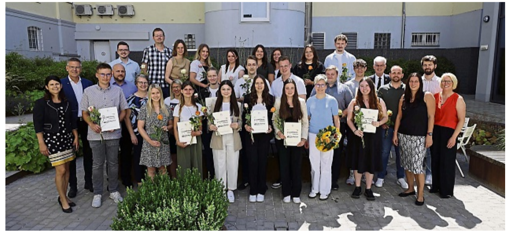
Die erfolgreichen Auszubildenden, Studierenden, Verwaltungsfachwirte und Verwaltungsbetriebswirte nach der internen Zeugnisfeier im Landratsamt.