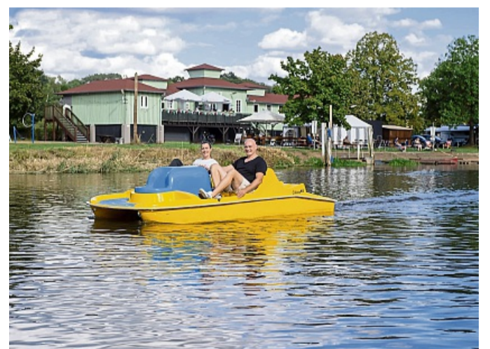
Tretbootfahren auf der Fulda.