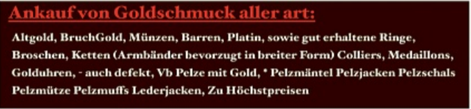
Diamanten Schmuck Zahngold