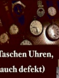
Taschen Uhren, (auch defekt)