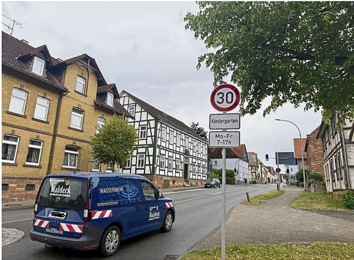
Tempo drosseln: Vor dem Kindergarten in Sachsenhausen gilt auf einem kurzen Abschnitt unter der Woche eine Tempo-30-Zone. Diese möchten die Stadtverordneten in der stark befahrenen Ortsdurchfahrt gern bis zur Fußgängerampel am Friedhof verlängern.

In Sachsenhausen soll mit der Umgestaltung des Marktplatzes demnächst ein neues Zentrum geschaffen werden, das erhöhe auch das Gefahrenpotential auf der Ortsdurchfahrt. Trietsch schlug eine Verlängerung der Tempo-30-Zone auf der B 485 über den Marktplatz bis zur Fußgängerampel