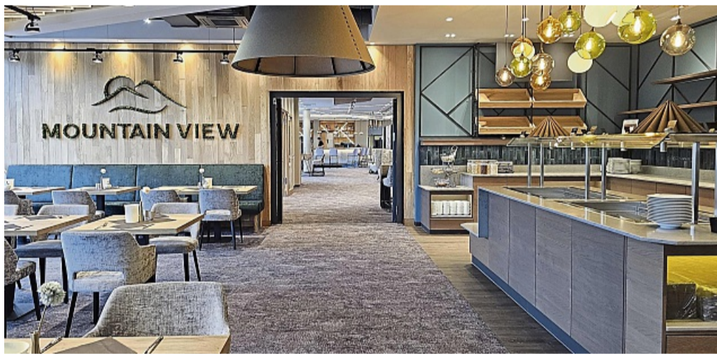
Steht den Gästen offen: das Mountain View Hotel.