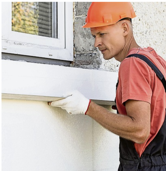
Die Dämmung der Fassade hilft, Energiekosten zu sparen.

Klamme Räume im Winter trotz voll aufgedrehter Heizung und permanente stickige Verhältnisse an heißen Tagen sind deutliche Hinweise dafür, dass man die energetische Effizienz des Zuhauses unter die Lupe nehmen sollte. Häufig liegt die Ursache in einer mangelhaften oder fehlenden Dämmung. So kann im Winter teure Heizenergie nach draußen entweichen, während in der warmen Jahreszeit die Hitze ungehindert ins Gebäude ein-