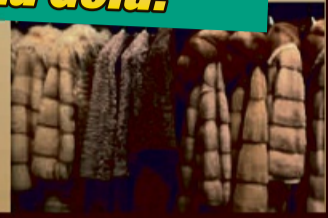
Für Pelze und nerze bis zu 12.000€

Ankauf von: Goldschmuck, Armbänder, bevorzugt in breiter Form Ketten, Ringe, auch defekt, Zahngold, mit und ohne Zähne, Weißgold, Goldmünzen, Thaler, Medaillen, auch defekte, Münzen, Goldbarren, Nuggets, Schmelzgold, Platin, Schmuck, Münzen, Schmelzplatin, Paladium Modeschmuck, vergoldet defekte Uhren Wir kaufen auch größere Mengen von Nachlässen