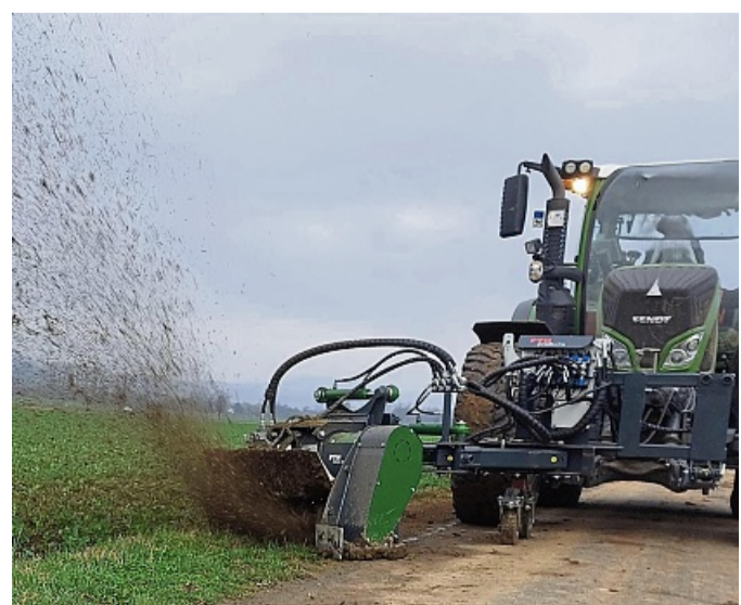
Ein Schlepper mulcht einen Feldwegrand. Feldwege sind eines von vielen Themen, über sich die Gemeinde mit Landwirten regelmäßig austauschen möchte.