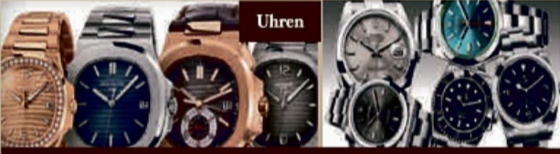
Bei patek Philippe zahlen wir 40% über den Börsen Kurs