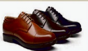
Lederschuhe - mehrere Farboptionen

Wir kaufen Goldschmuck jeglicher Art, auch defekt, ebenso wie Silberschmuck in allen Varianten 90/100/800/925