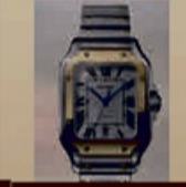
Cartier aller Art