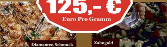
Schmuck Münzen & Barren