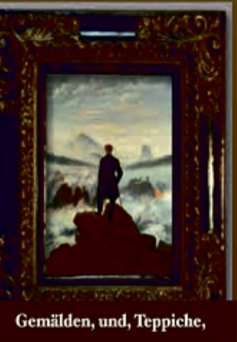
Gemälden, und, Teppiche,