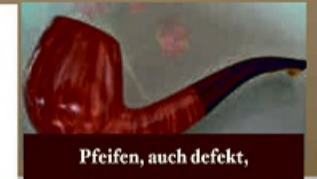
Pfeifen, auch defekt,