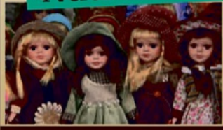
Puppen zu Höchstpreisen von 1500,-€