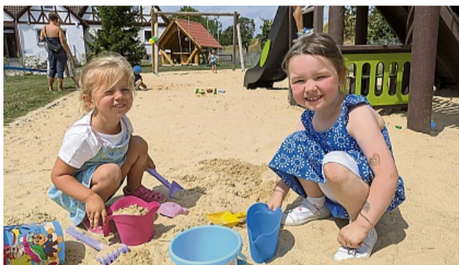
Gleich losgespielt haben diese beiden Mädchen, die sich sichtlich über den Spielplatz freuen.

Für das leibliche Wohl und den reibungslosen Ablauf der Veranstaltung sorgten die Frei-