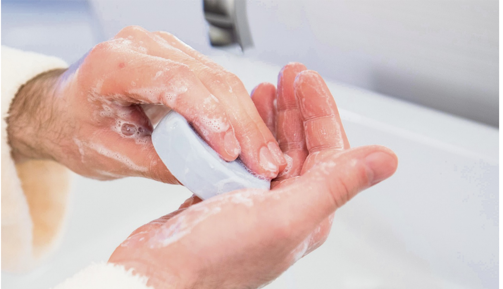
Gesunde Menschen können mit normaler Hygiene einfach vorbeugen - doch bei manchen bleibt die Angst.

Experten erklären, wann aus Vorsicht vor Keimen echte oder sogar krankhafte Furcht wird