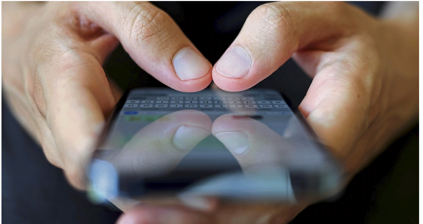
Wer Textnachrichten mit zwei Daumen tippt, macht schon einiges richtig. Diese kleine Umstellung entlastet nämlich die Daumensattelgelenke.