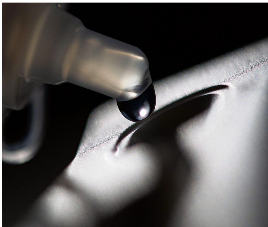
Wie es um die Qualität von Selbsttests steht - darüber gibt es meist keine Informationen.