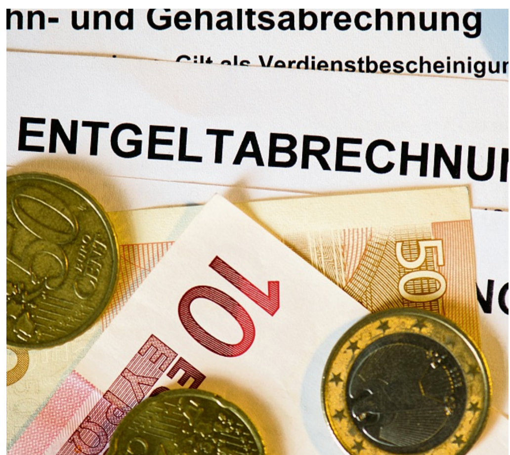
Wer in Teilzeit arbeitet, sollte seine Rechte und Ansprüche kennen - um bei Zuschlägen und Co. nicht benachteiligt zu werden.