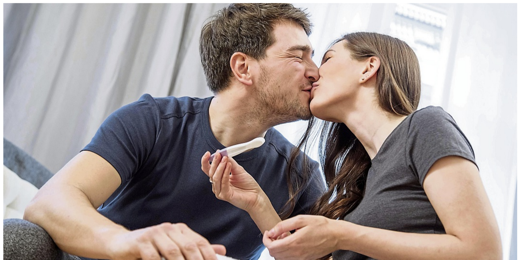
Fachleute sehen Hormon-Selbsttests skeptisch. Eine Ausnahme gibt es aber: den guten alten Schwangerschaftstest.