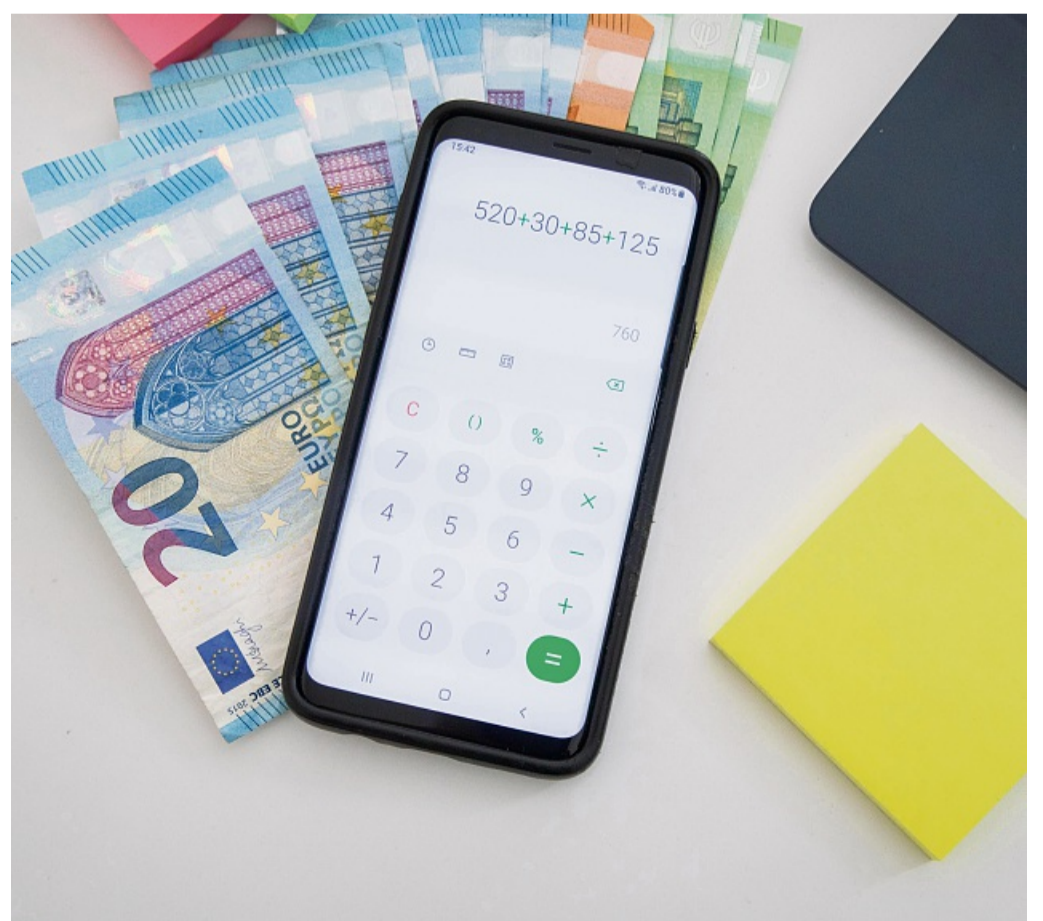
Teilzeit: Bei der Berechnung von Gehalt und Urlaub ist oft der Taschenrechner gefragt.