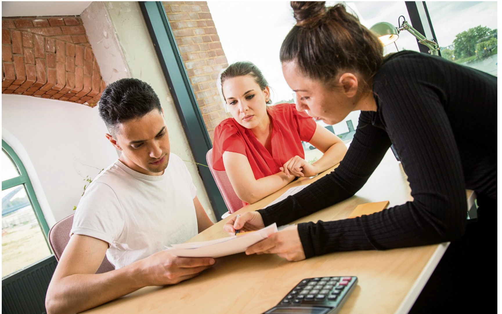
Wer in Teilzeit arbeitet, bekommt anteilig Gehalt. Doch wie werden Urlaubsgeld und andere Zuschläge berechnet?

Gibt es eine Jubiläumszulage oder einen Treuebonus für langjährig beschäftigte Mitarbeiter, steht die Zahlung einer Teilzeitkraft in gleicher Höhe zu wie einer Vollzeitkraft. „Denn die Betriebstreue eines Teilzeitbeschäftigten ist genau-