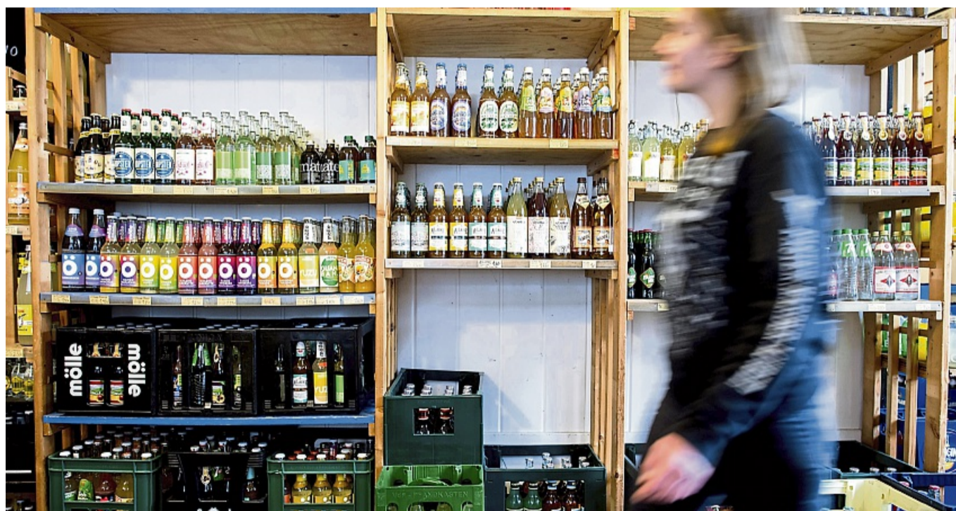
Limonade sollte nicht als Durstlöcher getrunken werden, sondern ist eine Süßigkeit - im wahrsten Wortsinn.

Nicht besser sieht es bei den acht Limos mit Süßstoffen aus. Zwar wird hier Zucker ersetzt und damit werden Kalorien eingespart. Aber die Tester kritisieren eine intensive Süße, die die klassischen, gezucker-