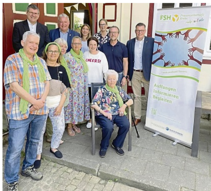
Hat ihr 40-jähriges Bestehen gefeiert: die Selbsthilfegruppe Krebs, die sich 1885 gründete.

Interessant sind im Vergleich die vielen unterschiedlichen Ansätze, wie man die Themen kreativ, informativ und künstlerisch umsetzen kann. Was schätzen die Eschweger an ihrer Stadt – früher und heute – am meisten, was halten sie für besonders erwähnenswert? Und wie schaffen sie es, ihre Gedanken so zu gliedern, dass sich ein literarischer Mehrwert daraus ergibt? Die Ergebnisse des dichterischen Schaffens werden in diesem Heft in klarer Gliederung präsentiert. Das Sonderheft 6 der Eschweger Geschichtsblätter „Eschwege – ein Gedicht“ kann im Buchhandel, beim Geschichtsverein oder der Schlaraffia für 16 Euro bezogen werden. kw