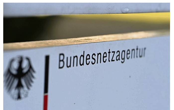
Die Bundesnetzagentur kann eine Anlaufstelle für Verbraucherinnen und Verbraucher sein, die Ärger mit Brief- oder Paket-sendungen haben. Sie ist aber nicht die einzige.