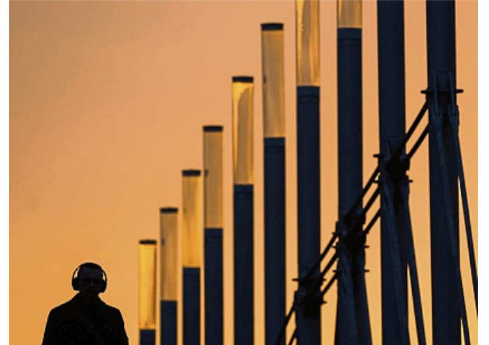
Vielfalt beim Musikstreaming: Design, Funktionen und Künstlervergütung unterscheiden sich je nach Dienst.