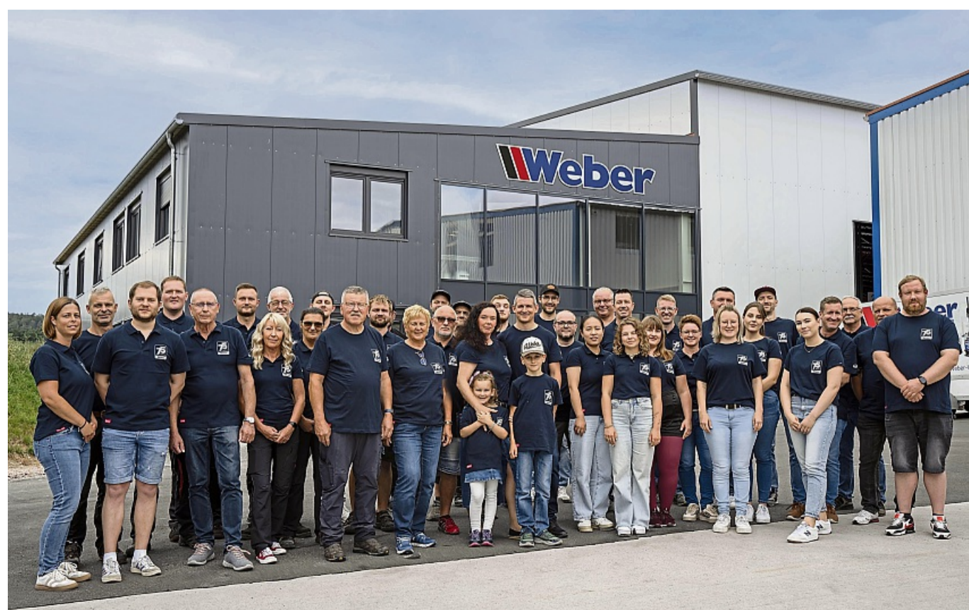
Weber wird 75: Am kommenden Wochenende (1. und 2. August) lädt das Unternehmen zu einer zweitägigen Feier ein.