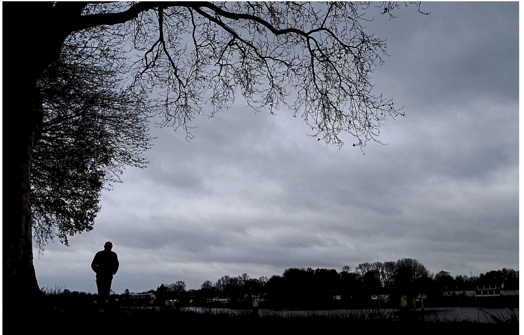
Nur noch graue Wolken? Im Alter leiden viele Menschen - auch unbewusst - unter Depressionen.

Was ist es nun? Oft lässt sich das schwer unterscheiden. Be-