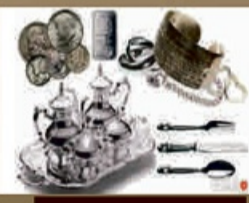
Wir kaufen Hüte!