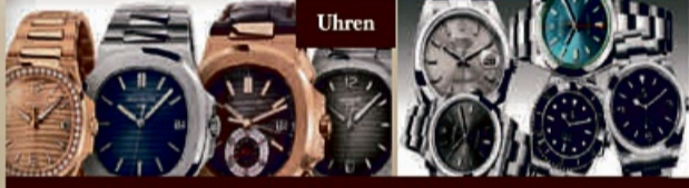
Bei patek Philippe zahlen wir 40% über den Börsen Kurs