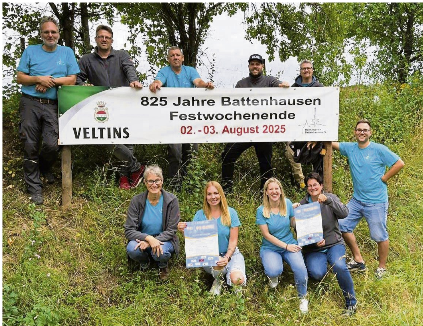
Zum Festwochenende in Battenhausen lädt der Festausschuss vor einem der Schilder am Ortseingang ein.

Nach der Kranzniederlegung am Ehrenmal ist ein gemütlicher Dämmerchoppen mit Cocktailbar und Live-Musik der Band Mitano geplant. Die Musi-