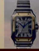
Cartier aller Art