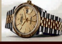
Alte Rolex Uhren ( auch defekt)