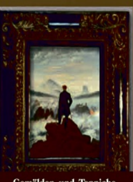
Gemälden, und, Teppiche,