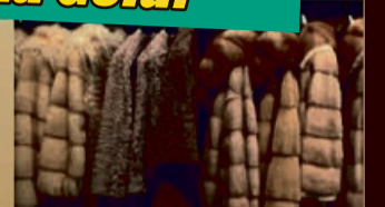
Für Pelze und nerze bis zu 12.000€

Wir kaufen auch größere Mengen von Nachlässen