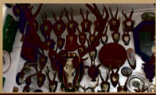
Geweihel mit Höchstpreisen von 1200,-€

Ihre Vorteile: ✓ Kostenlose Beratung ✓ Kostenlose Wertschätzung ✓ Transparente Abwicklung ✓ Bargeld sofort