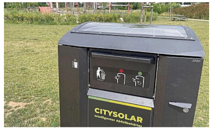
Der erste „smarte Mülleimer“ steht am Korberg.

Gerät am Spielplatz „Korberg“ verdichtet den Müll und sendet Füllstand