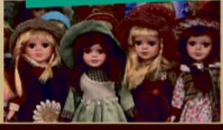
Puppen zu Höchstpreisen von 1500,-€