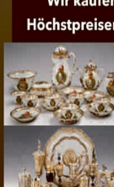
Wir kaufen Porzellan mit Höchstpreisen, bis zu 6.000,-€