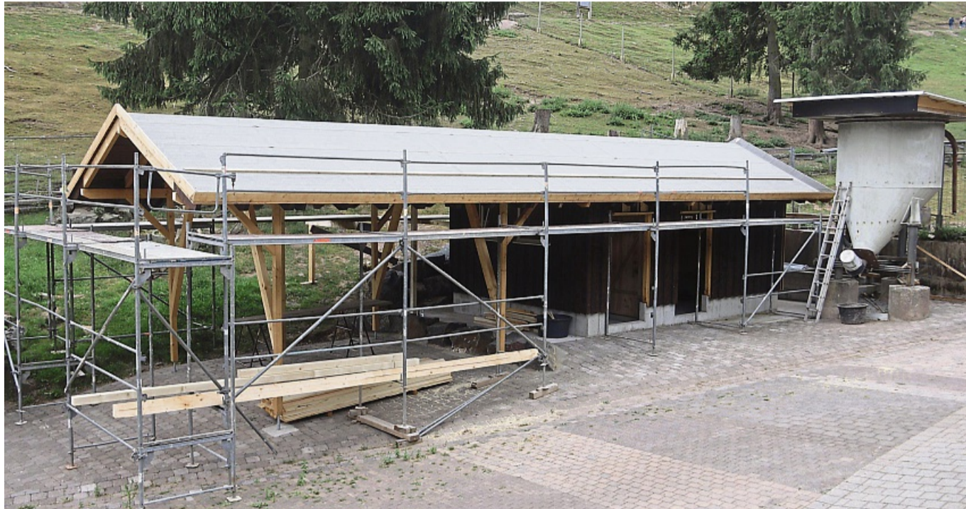
Der neue Stall für die Kamerunschafe im Frankenger Wildpark ist bereits im Bau. Zudem soll das Tiergehege auch mit weiteren Projekten weiterentwickelt werden.