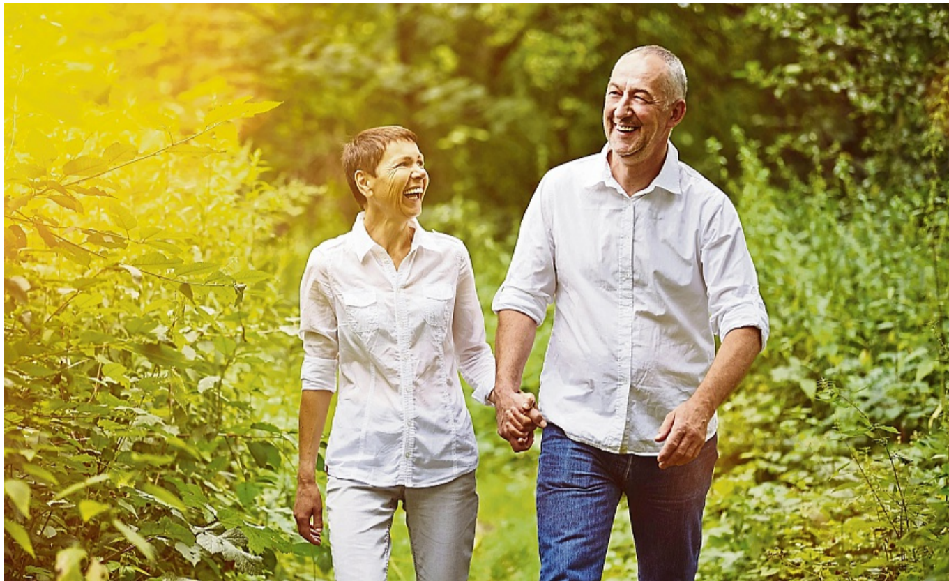
Wenn es bisher noch nicht so recht klappen wollte mit der Liebe: Werden Sie aktiv und fangen Sie an zu flirten:

Eine Scheidung kann das ganze vorherige Leben auf den