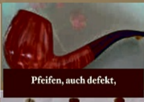
Pfeifen, auch defekt,