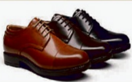
Lederschuhe - mehrere Farboptionen

Wir kaufen Goldschmuck jeglicher Art, auch defekt, ebenso wie Silberschmuck in allen Varianten 90/100/800/925