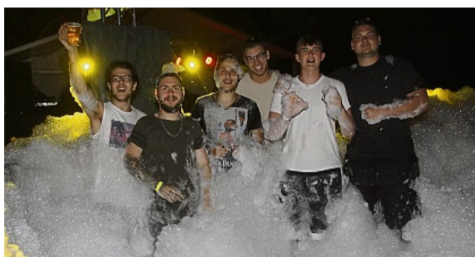
Tropical Night: Mitten im Schaumbad wird wieder so richtig die Post abgehen.

Die Musik bis weit nach Mitternacht macht DJ Vado, für den meterhohen Schaum und auch für die Lichtershow sorgt wieder das TLTH-Team aus Dautphetal. Und für die Feierfreunde gibt es zu späterer Stunde auch noch eine „Happy Hour“ in der Cocktailbar. Zu ihrer neuen Tropical-Night rechnet die Burschen- & Mädchenschaft des Dorfes wieder mit mehreren Hundert vor allem jungen Besuchern. „Wir haben alle benachbarten und befreundeten Burschenschaften