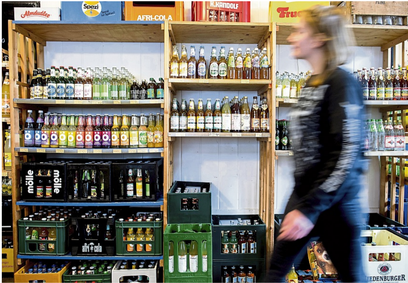
Limonade sollte nicht als Durstlöcher getrunken werden, sondern ist eine Süßigkeit - im wahrsten Wortsinn.

Nicht besser sieht es bei den acht Limos mit Süßstoffen aus.