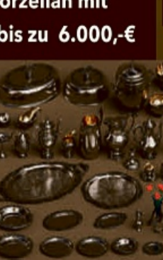
Silber und Trachten Schmuck aller Art