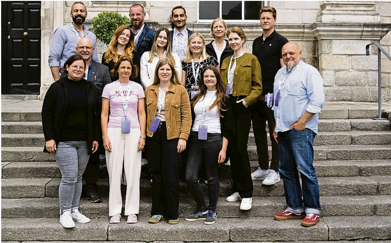
Ein interdisziplinäres Team der Vitos Kliniken für forensische Psychiatrie Gießen und Marburg hat an einer Fachtagung in Dublin teilgenommen und sich mit Experten aus der ganzen Welt über Maßregelvollzug ausgetauscht.