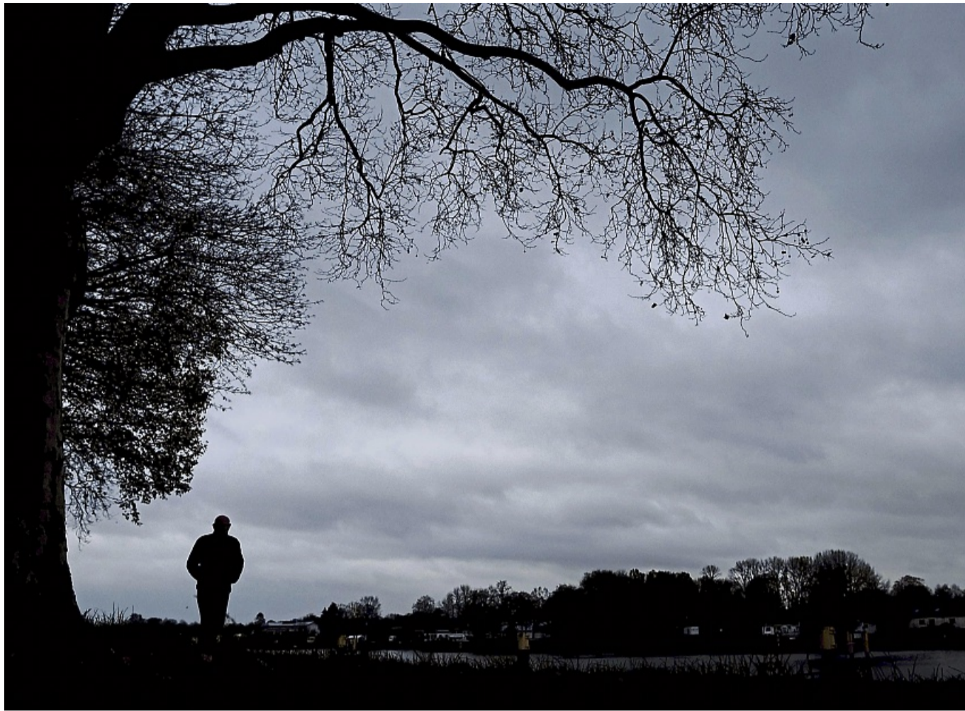
Nur noch graue Wolken? Im Alter leiden viele Menschen – auch unbewusst – unter Depressionen.

Rund 6 Prozent der 70- bis 79-Jährigen erkranken laut Robert-Koch-Institut jährlich an einer Depression. Subklinische Depressionen – also solche mit abgeschwächter oder unvollständiger Symptomatik – sind im Alter sogar zwei- bis dreimal so häufig. Und doch bleibt die Diagnose oft aus. Das liegt auch daran, dass sich Depression im Alter anders zeigt: Statt Traurigkeit stehen oft körperliche Beschwerden im Vordergrund – wie Rückenschmerzen,