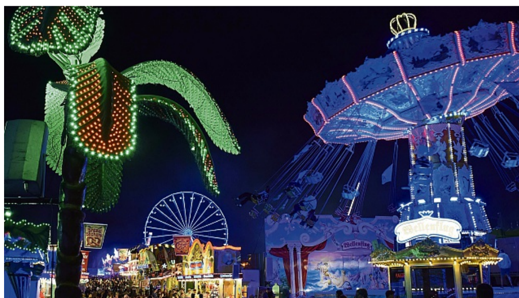
Lichter, Düfte, wummernde Bässe - All das macht das besondere Flair des Viehmarkts bei Nacht aus.

Für Familien mit kleinen Kindern gibt es erstmals bunte Kinderfinder-Armbänder. Sie sind kostenlos am Verwaltungszelt sowie an den Kinderfahrgeschäften erhältlich und werden einfach am Handgelenk des Kindes befestigt. Eltern tragen ihre Kontaktdaten und den Namen ihres Kindes auf dem Band ein. So erleichtern sie die unkomplizierte Kontaktaufnahme, wenn sie ihren Nachwuchs im Rummel verlieren. Am letzten Viehmarkttag steigt ein großes Brillant-Höhenfeuerwerk.