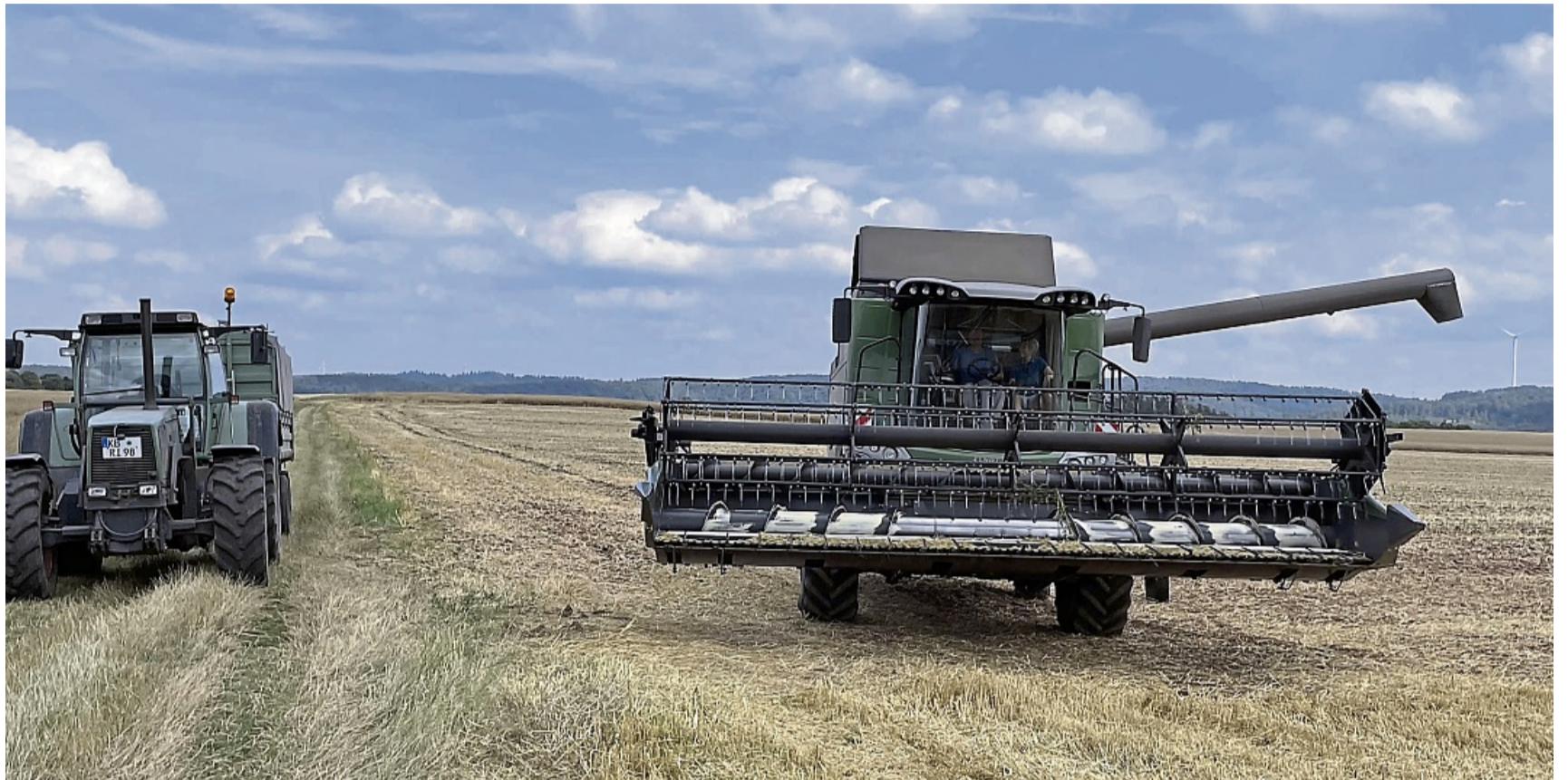
Rund um die Uhr im Ernteeinsatz: Roelof Dingel und Ivonne Steinbach fahren mit Mähdrescher und Trecker Wintergerste ein.

Pro Hektar ernten die Beiden etwa 7,5 Tonnen Wintergerste. Wenn der Korntank des Mähdreschers voll ist, wird das Korn über eine Förderschnecke durch das Auslaufrohr auf den