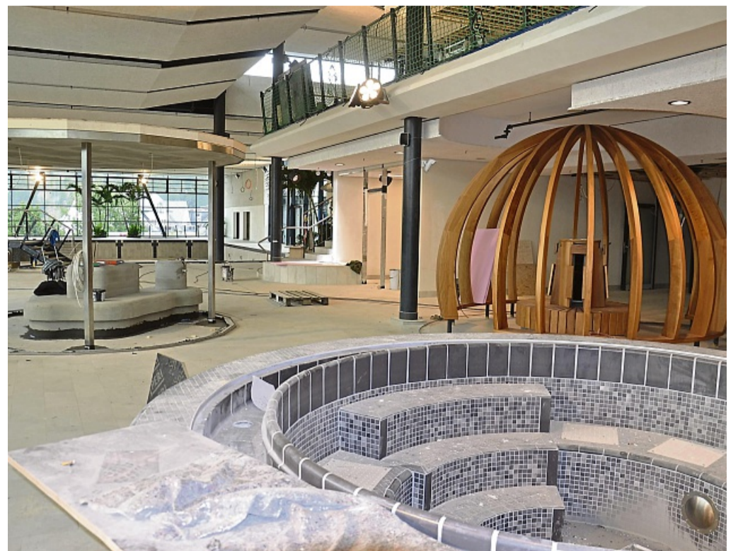
Eine kleine Attraktion ist die Infrarot-Sauna zwischen Whirlpool und Ruhezone.