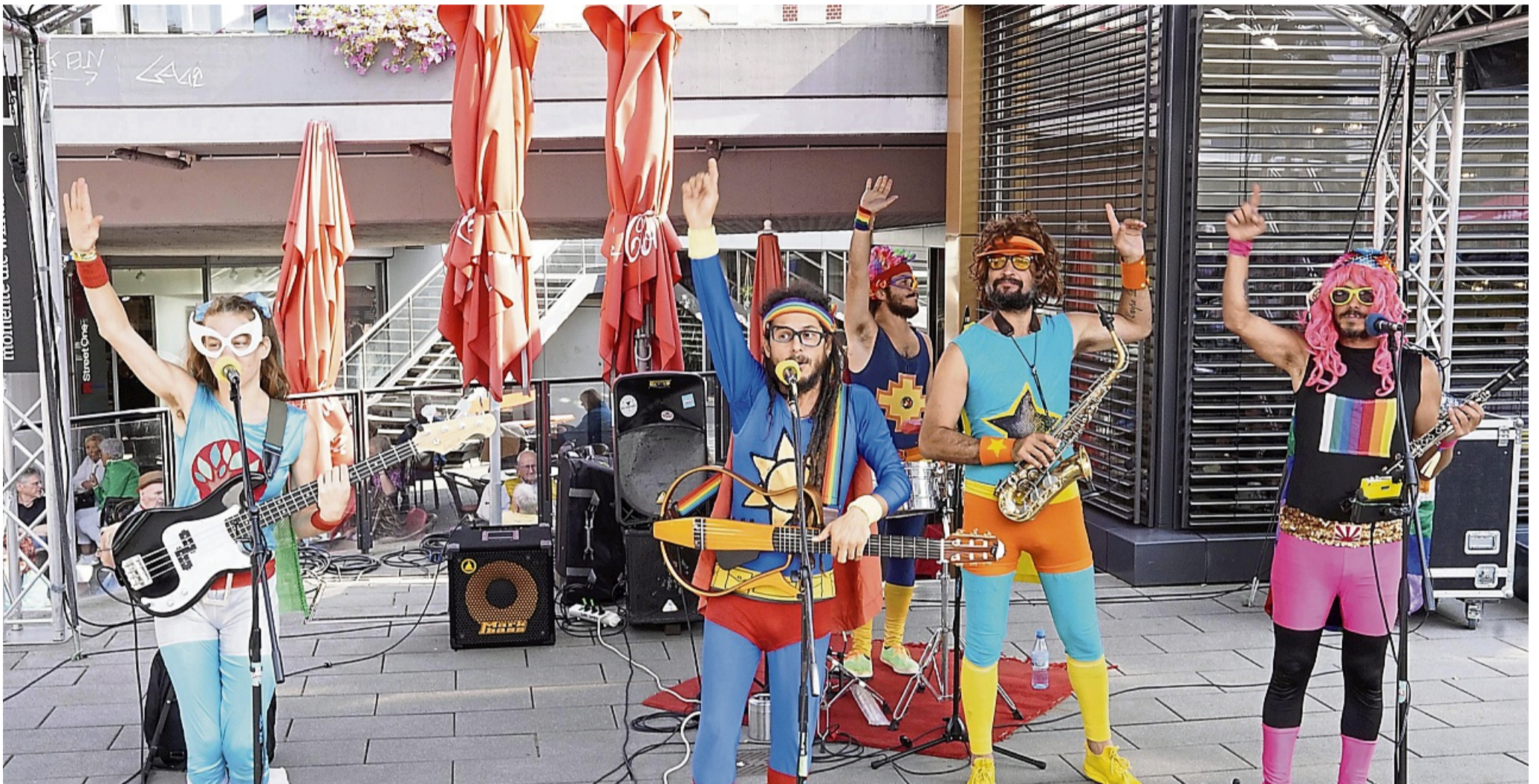
Beim Hansefestival in Korbach können sich die Besucherinnen und Besucher auch diesmal wieder auf eine bunte Mischung aus Musik, Straßentheater und Tanz freuen.