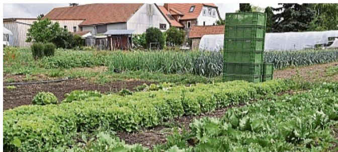
Eine von vier Stationen bei der Höfe-Rundfahrt ist der Gemüseanbau des Falkenhofs in Strothe.

bis zum Dienstag, 12. August, unter E-Mail franziska.henning@lkwaflk.de oder telefonisch unter 05631/954-2161. red