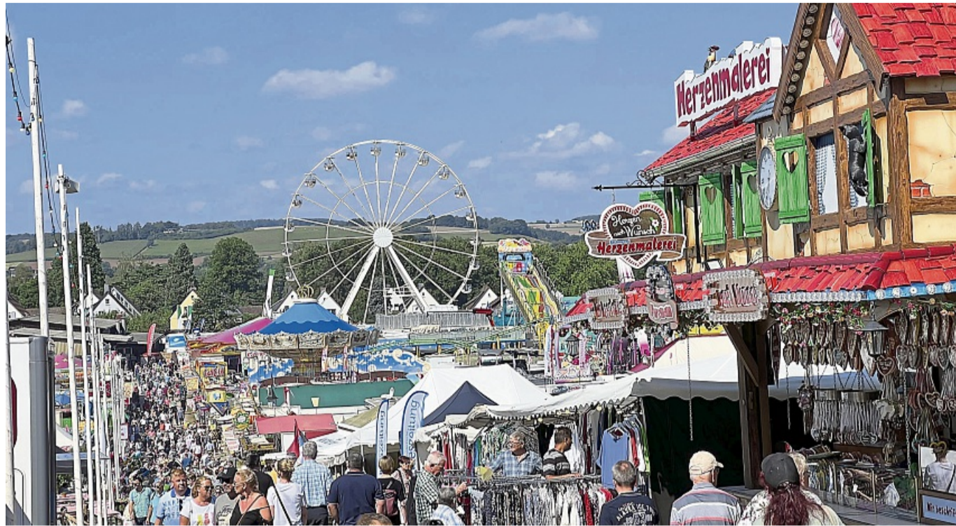
Impressionen vom Arolser Viehmarkt am Sonntagmorgen 2024.