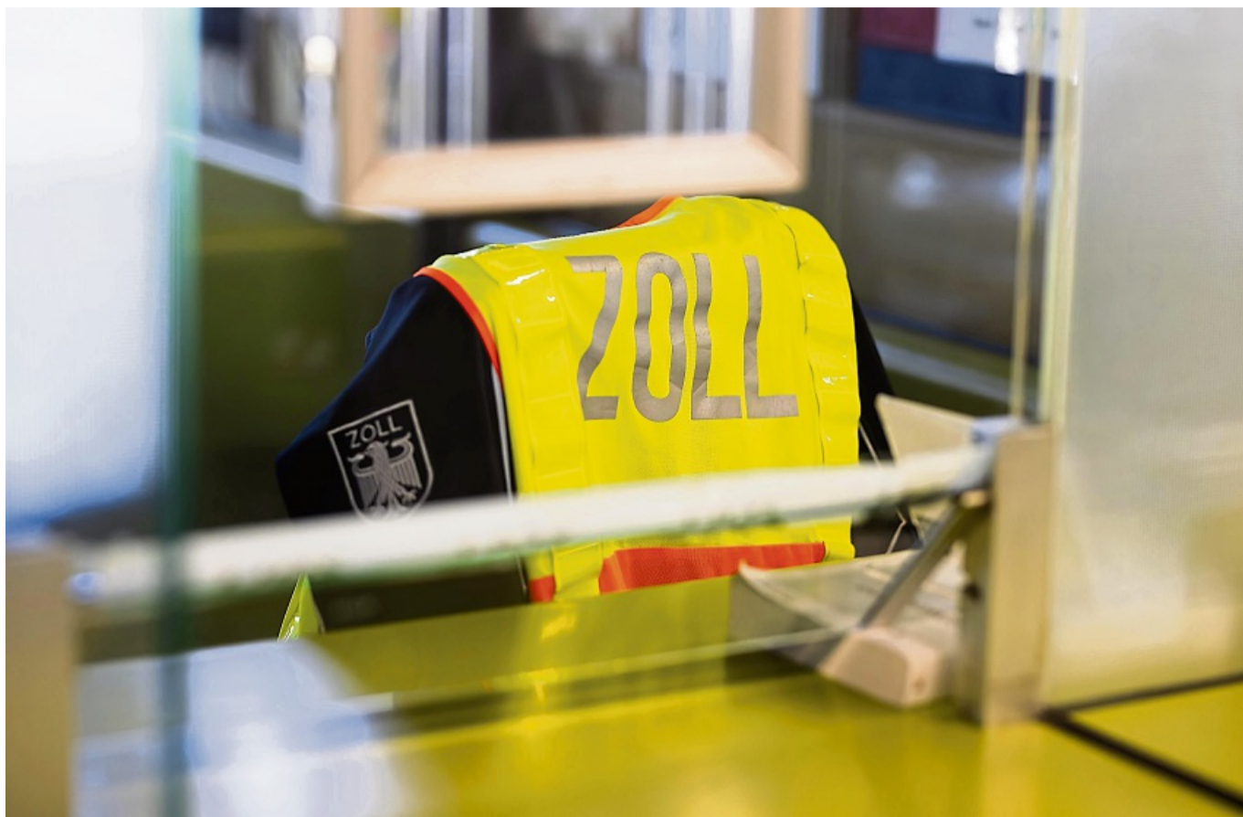
Damit es bei der Rückkehr keine unangenehmen Überraschungen beim Zoll gibt, ist es wichtig, sich rechtzeitig zu informieren.

Reisen innerhalb der EU unterliegen grundsätzlich keinen Beschränkungen. Es gibt allerdings Ausnahmen für sogenannte Genussmittel. Unter bestimmten Voraussetzungen kann man diese steuerfrei aus anderen EU-Staaten nach Deutschland mitbringen.