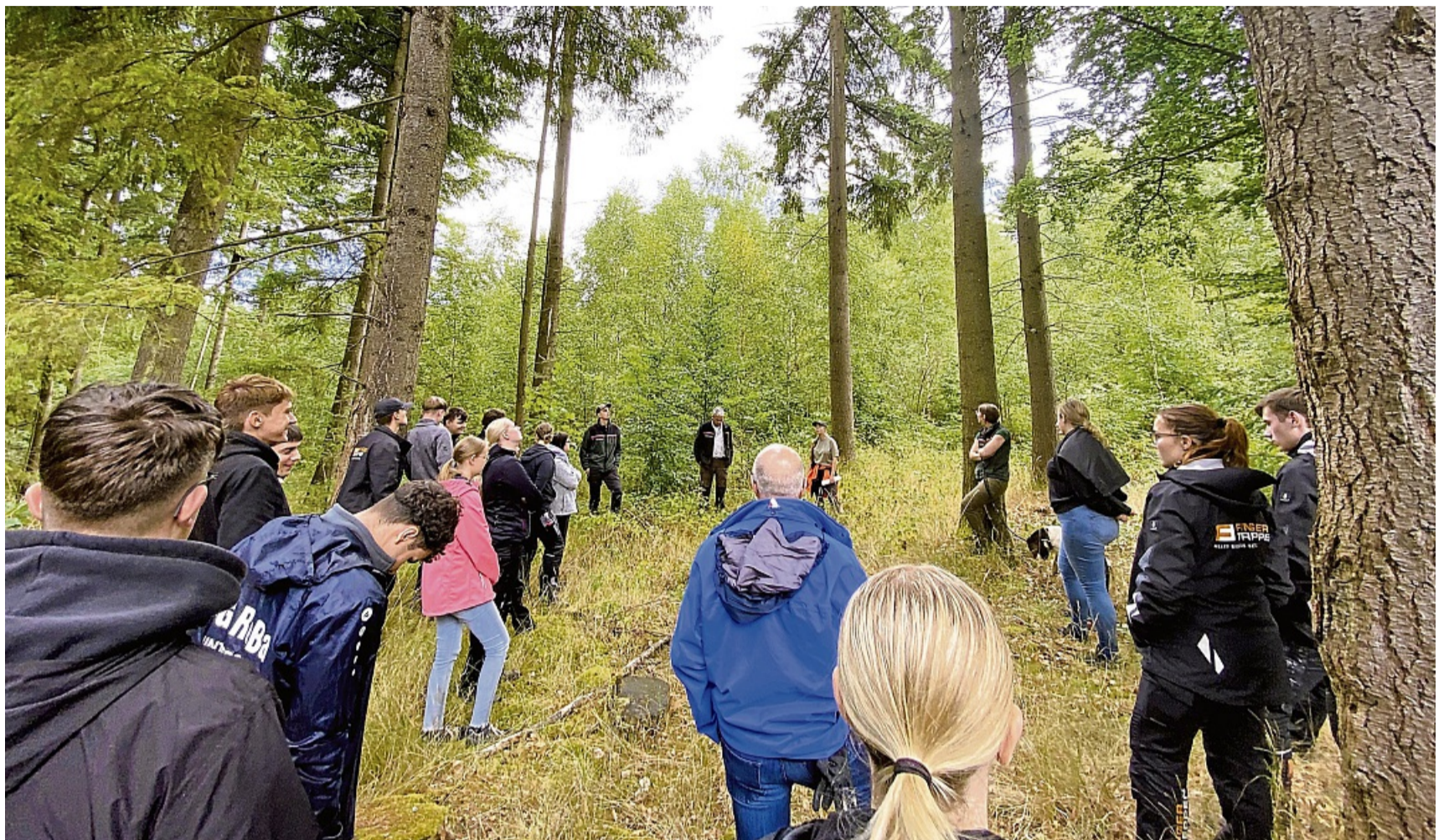
Die Auszubildenden des ersten Lehrjahrs von Finger-Haus haben kürzlich im Rahmen einer umfangreichen Pflegeaktion den Jungwald gezielt gestärkt – und dabei nicht nur Sträucher entfernt, sondern vor allem ökologische Zusammenhänge und Generationengerechtigkeit praktisch erlebt.

In neun Gruppen aufgeteilt, arbeiteten sich die Auszubildenden entlang der markierten Pflanzreihen durch das Gelände. Die Bedingungen waren