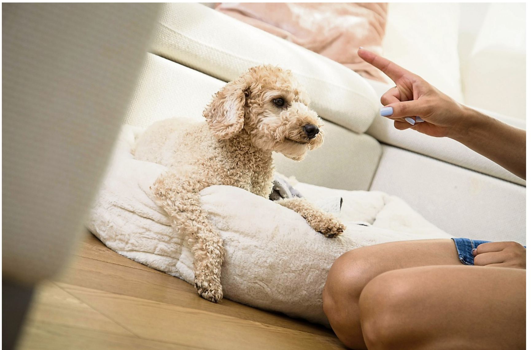
Die Grundsignale „Sitz“ und „Platz“ zu beherrschen, ist die Basis für die weitere Erziehung des Hundes.

Ist er später schon gut ausgebildet und auch in einem aufgeregten Zustand ansprechbar, kann ich ihm ein Alternativver-