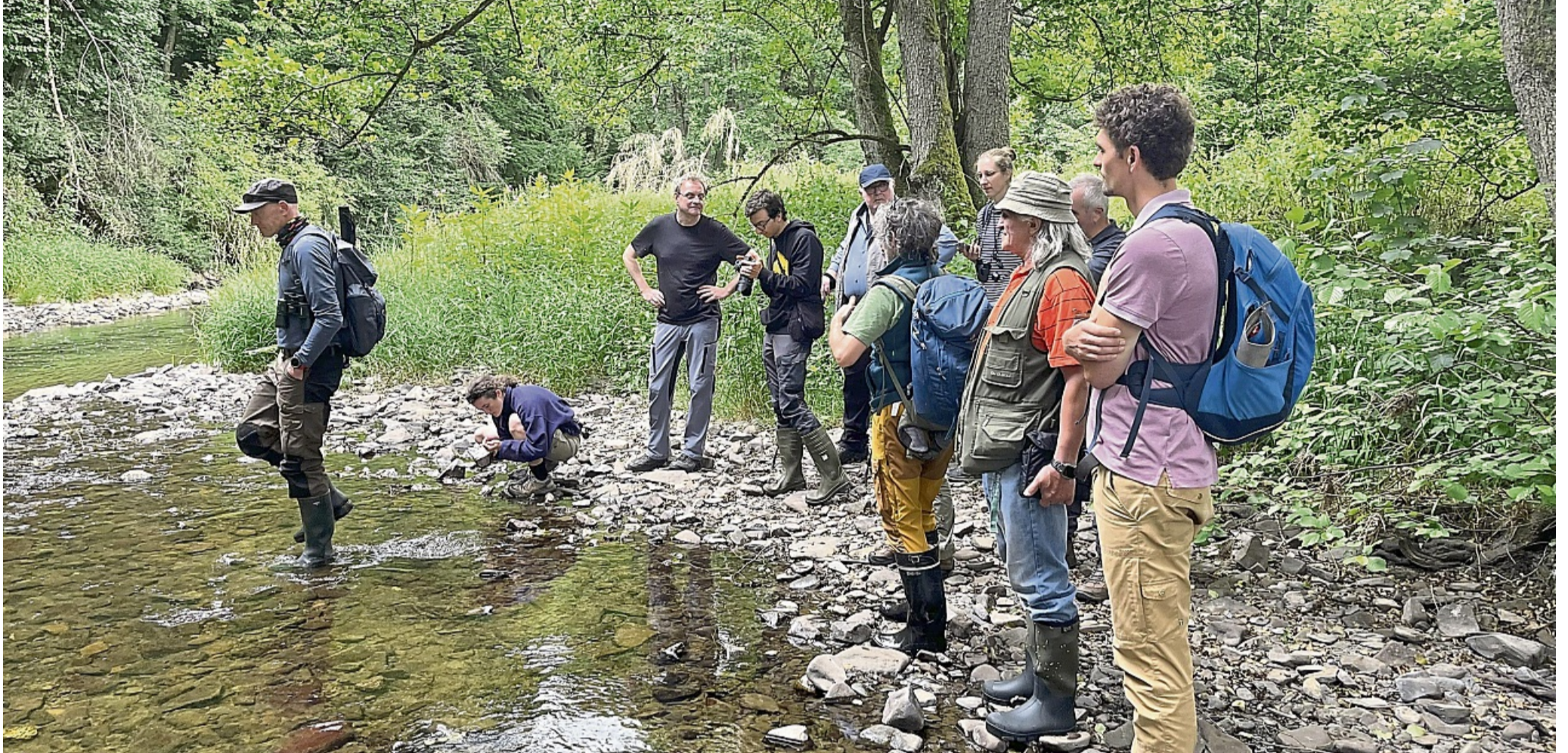
Mitarbeiter des Biosphärenreservats Rhön besuchten Orke, Eder und Nuhne bei einer Gewässerekkursion mit Fachleuten.

Mitarbeiter und Helfer des UNESCO-Biosphärenreservats Rhön besuchten Eder, Nuhne und Orke