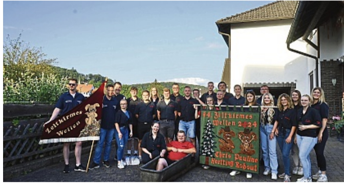
Die Kirmesburschen und Mädchen aus Wellen laden zu ihrer 45. Zeltkirmes ein.

Am Freitag, 8. August, geht die Kirmes mit einer Baustellen-Party weiter. An diesem Abend können sich alle Gäste auf einige Highlights freuen, unter anderem einen besonde-