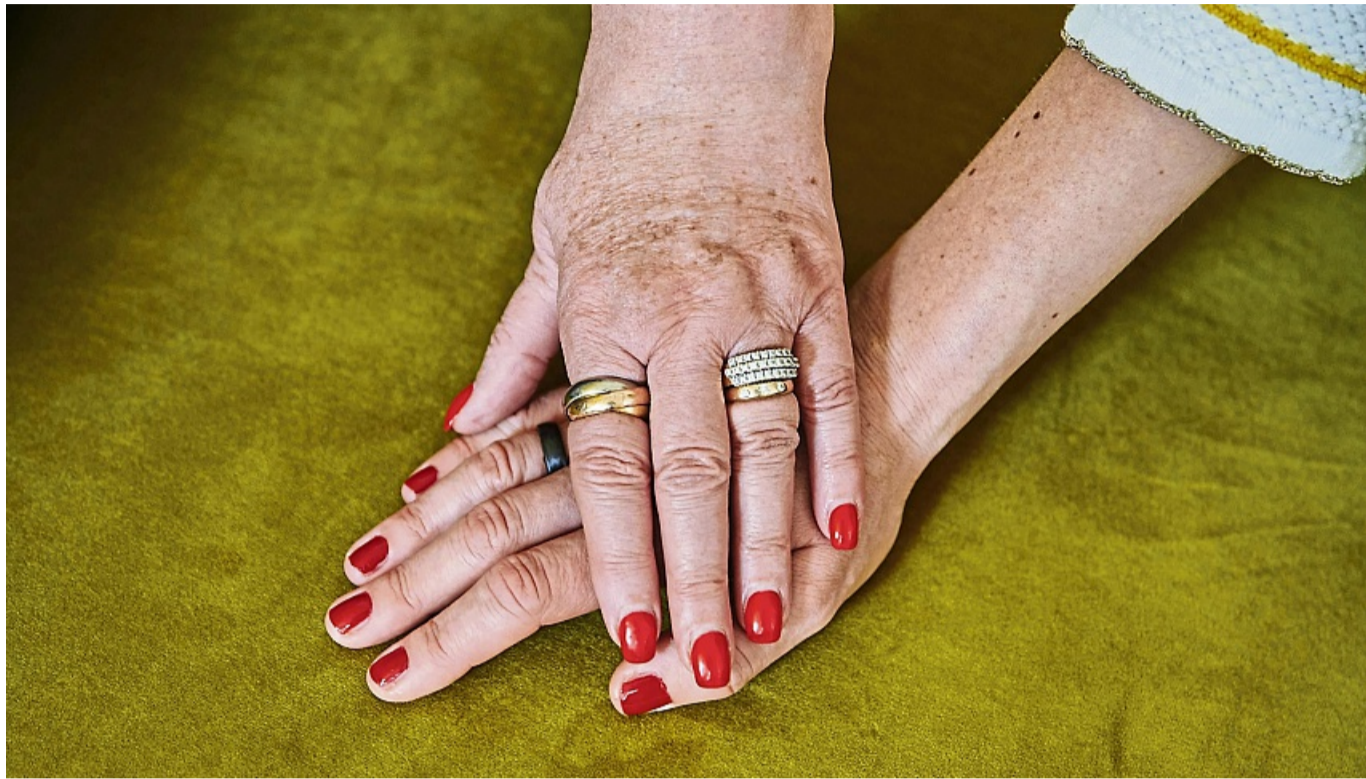
Verzeihen muss nicht zwingend Versöhnung bedeuten – je nachdem, was gut für uns ist.

Das stimme aber nicht, so LePera. Wer selbstbestimmt verzeihen will, könne sich sagen: „Ich kann jemandem vergeben und genau entscheiden, wie ich ihm erlaube, in meinem Leben vorzukommen.“ „Man kann jemandem vergeben und sich selbst schützen“, schreibt sie. „Man kann sich zurückziehen. Man kann der anderen Person sagen, dass man Frieden geschlossen hat und dass man in Zukunft das tun wird,