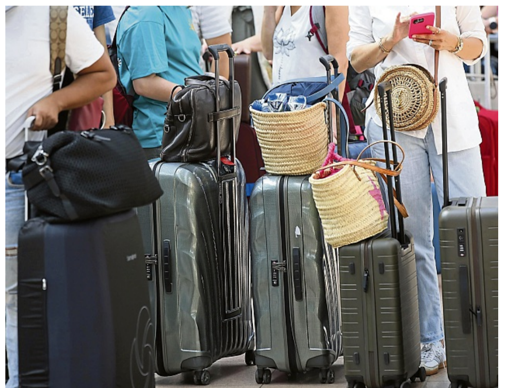
Ins Gepäck dürfen auch Souvenirs – aber eben nicht alle.