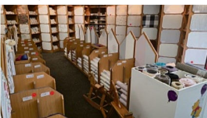
In den Geschäftsräumen von „mach Reibach“ kann man sich einen sehr guten Überblick über das Sortiment verschaffen und sich so eine gute Inspiration sowie eine fachliche Meinung einholen.

Laisa. Wer sich in den eigenen vier Wänden wohl fühlen will, wird sich sicherlich früher oder später damit befassen, was für einen Bodenbelag man haben möchte, welche Farbe die Wände haben sollen oder was für Gardinen an den Fenstern hängen sollen. Zwar kann man sich vielleicht beim Nachbarn oder im Internet Inspiration holen, doch an eine kompetente Beratung kommt einfach nichts heran. Kein Wunder also, dass es noch immer einige Fachgeschäfte gibt, bei denen man all das bekommt. Ein solches gibt es auch in Laisa. Und das bereits seit inzwischen 40 Jahren. „mach Reibach“ feiert in diesem Jahr seinen Geburtstag, denn längst nicht alle Geschäfte halten sich so lange. Das spricht durchaus für den Service, der einem hier von dem Kompetenten Team geboten wird. Finden kann man alles mögliche von Tapeten über Farben bis hin zu Teppichböden.