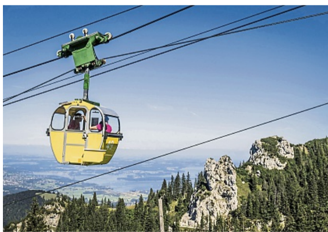
Panoramablicke aufs „Bayerische Meer“, den Chiemsee, lassen sich oft schon von der Gondel aus genießen.

Genauso sicher, dafür aber nostalgisch-stilvoll geht es dagegen mit der Predigtstuhlbahn in Bad Reichenhall in die Höhe. Die 1928 erbaute „Grande Dame der Alpen“ ist die älteste Seilbahn der Welt und steht unter Denkmalschutz. Wer auf 1.614 Metern ankommt, kann im authentischen Ambiente vom Bergrestaurant mit Kaminzimmer und Panoramaterrasse eine Zeitreise in die 1920er-Jahre un-