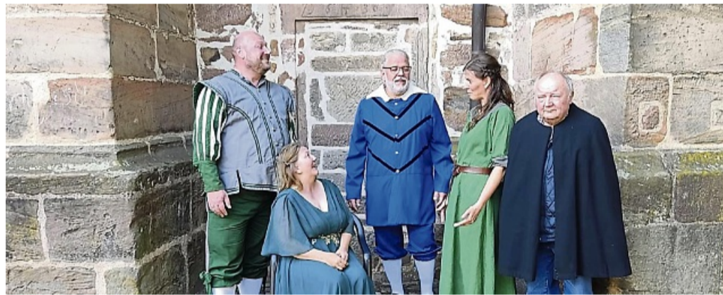
Proben für ein 100 Jahre altes Heimatspiel: Das STATT-Theater bringt „Marie, Marie, du sollst den Kasper frien“ auf den Kirchplatz in Mengerinhäuser.

Premiere ist am Freitag, 15. August, um 19 Uhr auf dem Kirchplatz. Weitere Vorstellungen sind am Sonntag, 17. August, um 18 Uhr, Sonntag, 24. August, um 15 Uhr sowie am Donnerstag, 28. August, um 19 Uhr geplant. Der Eintritt ist frei. Ensemble und Team freuen sich über eine Spende. Hintergründe zum Stück sind auf www.statt-theater.net zu finden. red