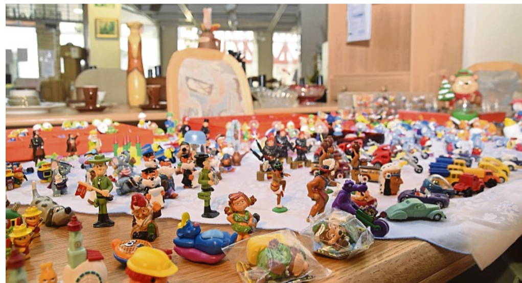
Jede Menge kleine Figuren: Happy Hippos, Zwerge und Autos sind nur ein Bruchteil der Spende.