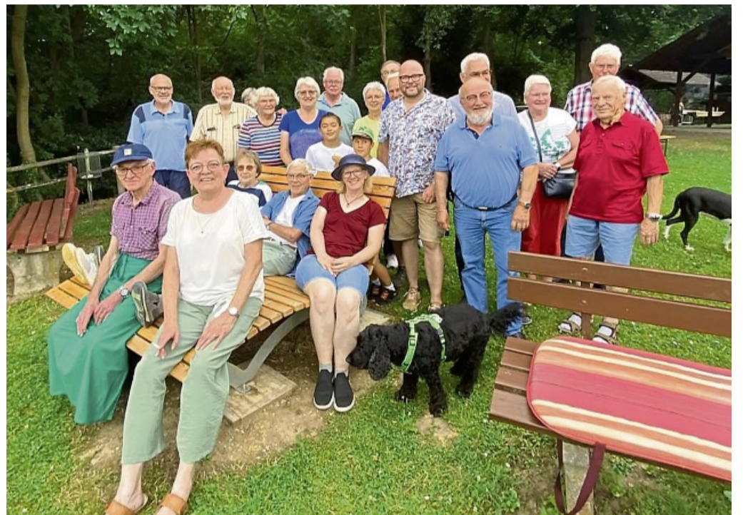
Perfekt fürs Foto: Beim Sommerfest machten die Mitglieder des Landschaftspflegevereins ein Foto an der von der EAM gespendeten Panoramabank. FOTO: URS WASSERMEIER

Dazu passe auch die Panoramabank, die sich auch bei vorbeikommenden Wanderern immer größerer Beliebtheit erfreue. kam