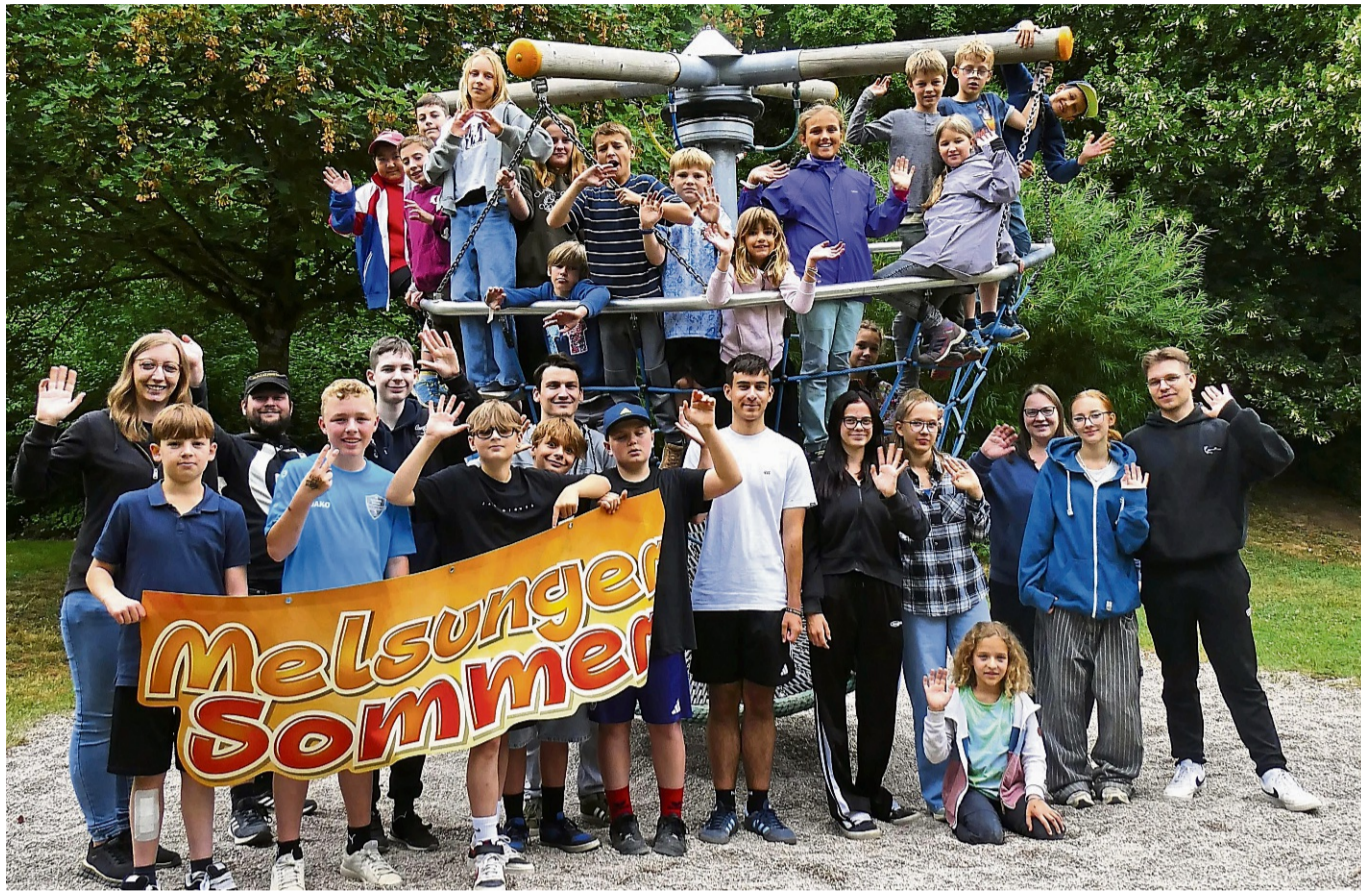
Ein gelungener Start in den Sommer: Der Melsunger Jugendtreff sorgte für ereignisreiche Ferienwochen.

In der zweiten Ferienwoche wurden unterschiedliche Tagesveranstaltungen angeboten. Unterstützt wurden einige Veranstaltungen durch den