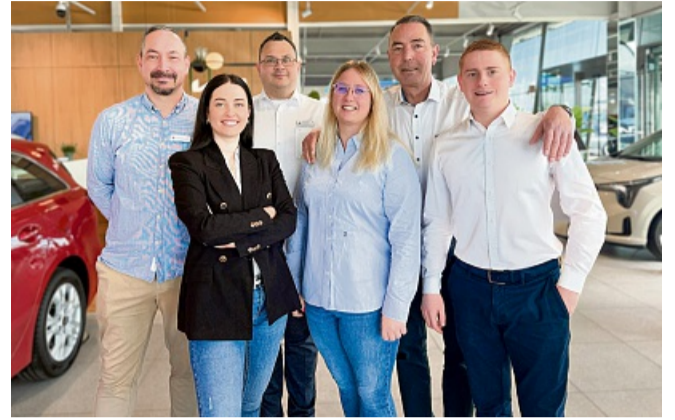
Engagiert, erfahren und serviceorientiert: ein Teil des Teams von Autohaus Range.

Auf Instagram und Facebook geben wir regelmäßig Einblicke in unseren Alltag im Autohaus, stellen neue Modelle vor, feiern Fahrzeugübergaben und zeigen, wie viel Spaß wir an unserer Arbeit haben.