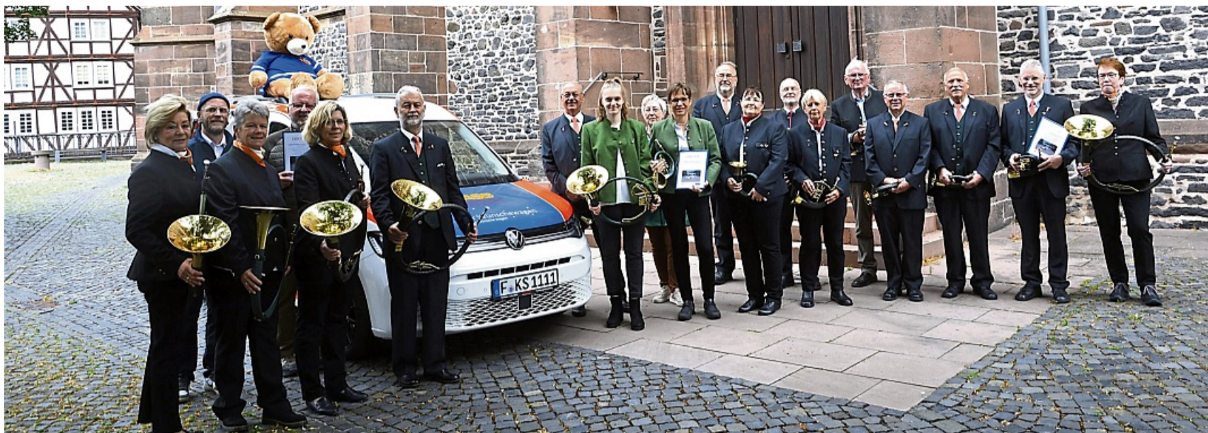
Vertreter der drei Jagdbläserkorps aus dem Schwalm-Eder-Kreis übergaben das Spendengeld vor der Stadtkirche in Homberg an das Team des Wünschewagens.