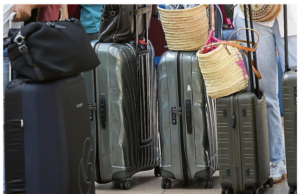
Ins Gepäck dürfen auch Souvenirs - aber eben nicht alle.