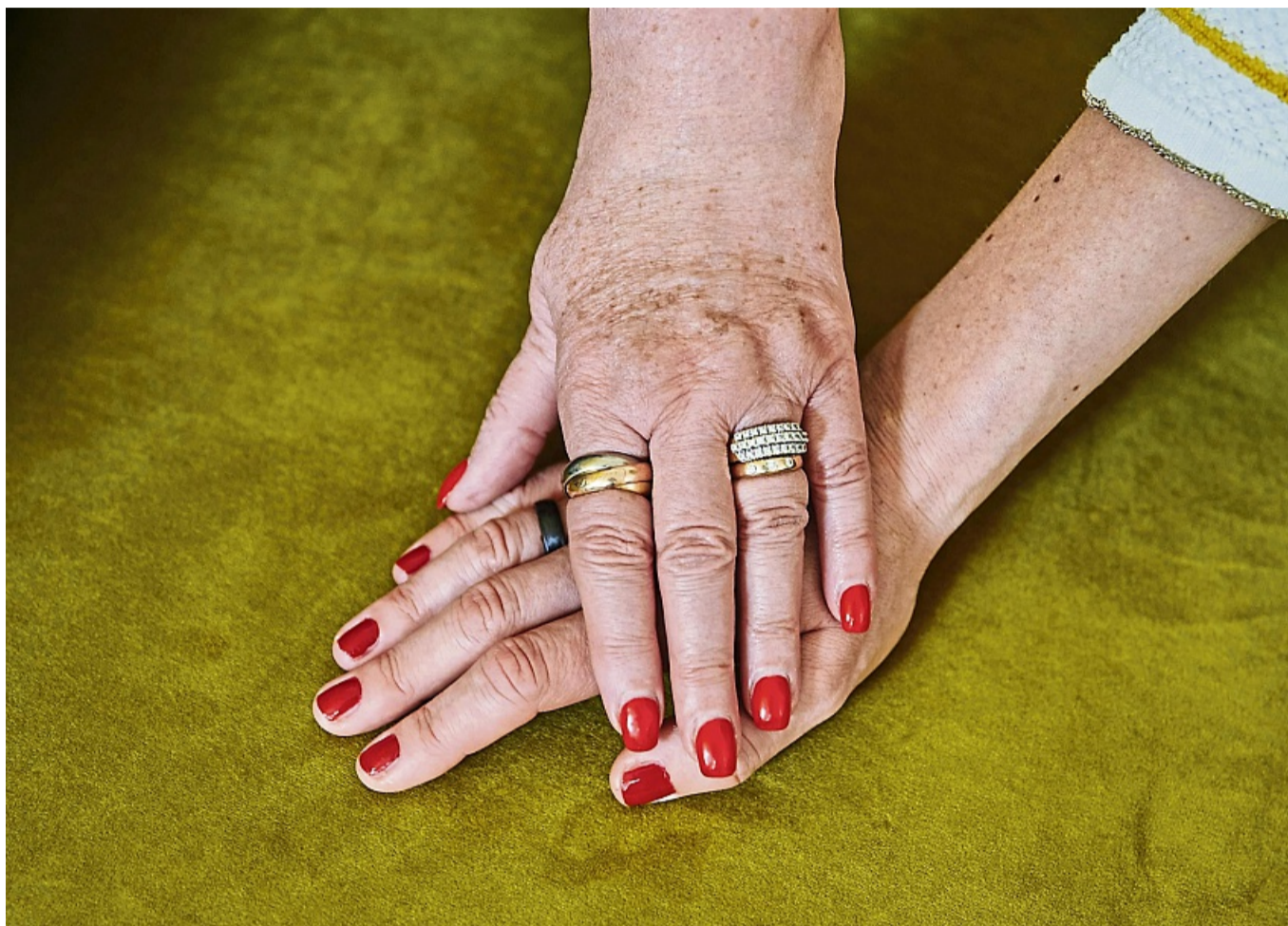
Verzeihen muss nicht zwingend Versöhnung bedeuten – je nachdem, was gut für uns ist.

Oder wie Maya Angelou sagt: „Du musst vergeben. Um dei-