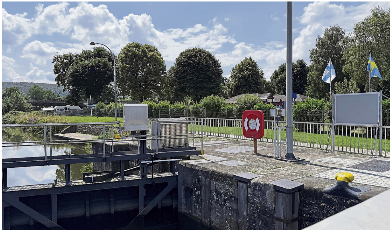
Auch in Hann. Münden stehen einige Rettungsringe, wie hier an der Fuldaschleuse.

Zum Glück passiere es selten, dass es zu tragischen Unfällen in Hann. Münden komme, aber die „Wahrscheinlichkeit ist nicht gleich null“, so der Vorsitzende. „Es ist ein stiller Tod. Man hört das Schreien un-