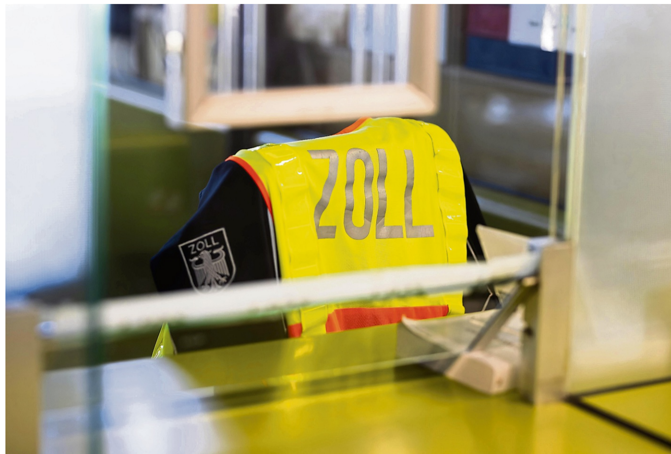
Damit es bei der Rückkehr keine unangenehmen Überraschungen beim Zoll gibt, ist es wichtig, sich rechtzeitig zu informieren.

Wer in die Details einsteigen will, kann unter anderem auf den Internetseiten des Zolls nachschauen. Dort gibt es auch einen Abgabenrechner, bei dem man ein konkretes Land, Alter, Verkehrsmittel und Warenart eingeben kann. trm