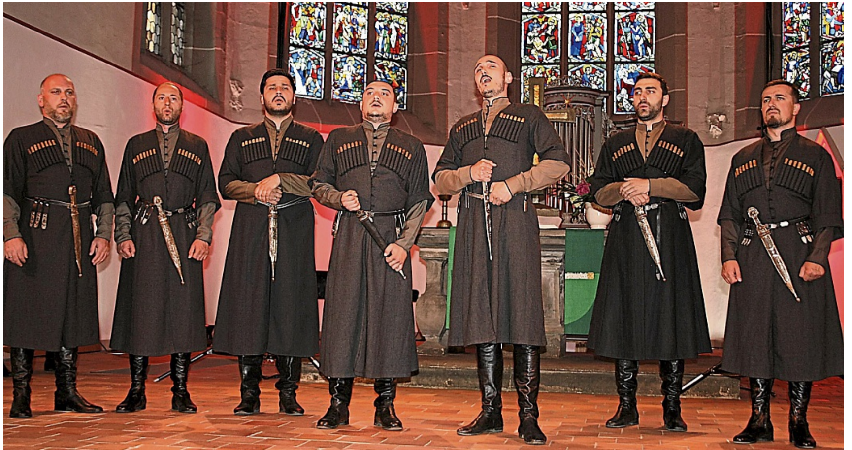
Stimmgewaltig: Ein Teil des Chors Shavanabada aus Georgien bei seinem Auftritt in Bad Sooden-Allendorfs St. Crucis-Kirche.

Weltliche und geistliche Lieder wechselten sich ebenso ab wie die zahlenmäßige Zusammensetzung der Interpreten, die mal zu Dritt, mal zu Siebt oder in kompletter Stärke die Bühne eroberten. Schade nur, dass wegen der fremden Sprache die Zuhörer nicht erfahren konnten, um was genau es bei den einzelnen Titeln ging. Al-