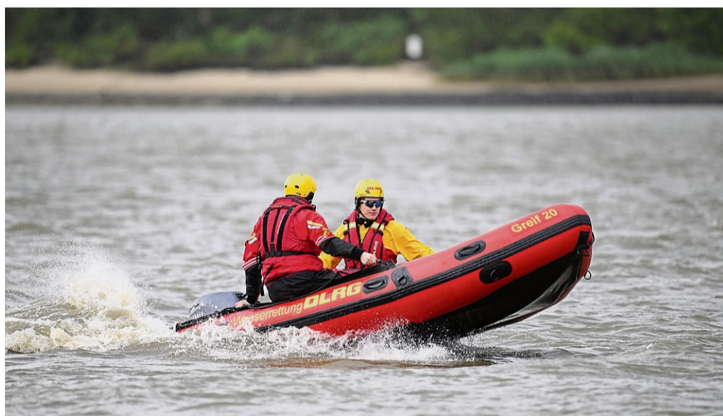
Zwei Mitarbeiter der DLRG sind auf Booten unterwegs. Auch in Hann. Münden sind die Retter im Einsatz.