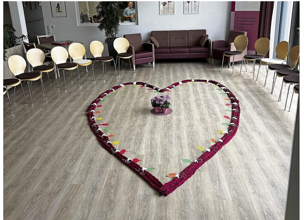
Gemeinsames Erinnern: Im Gemeinschaftsraum wurde in der Mitte eines Stuhlkreises für Angehörige und Mitarbeiter ein Herz aus rotem Tuch für die Verstorbenen ausgelegt.

„Einen geliebten Menschen, der seine letzte Lebenszeit im Hospiz verbringt, bis zum Schluss zu begleiten, das ist eine anspruchsvolle, aber auch