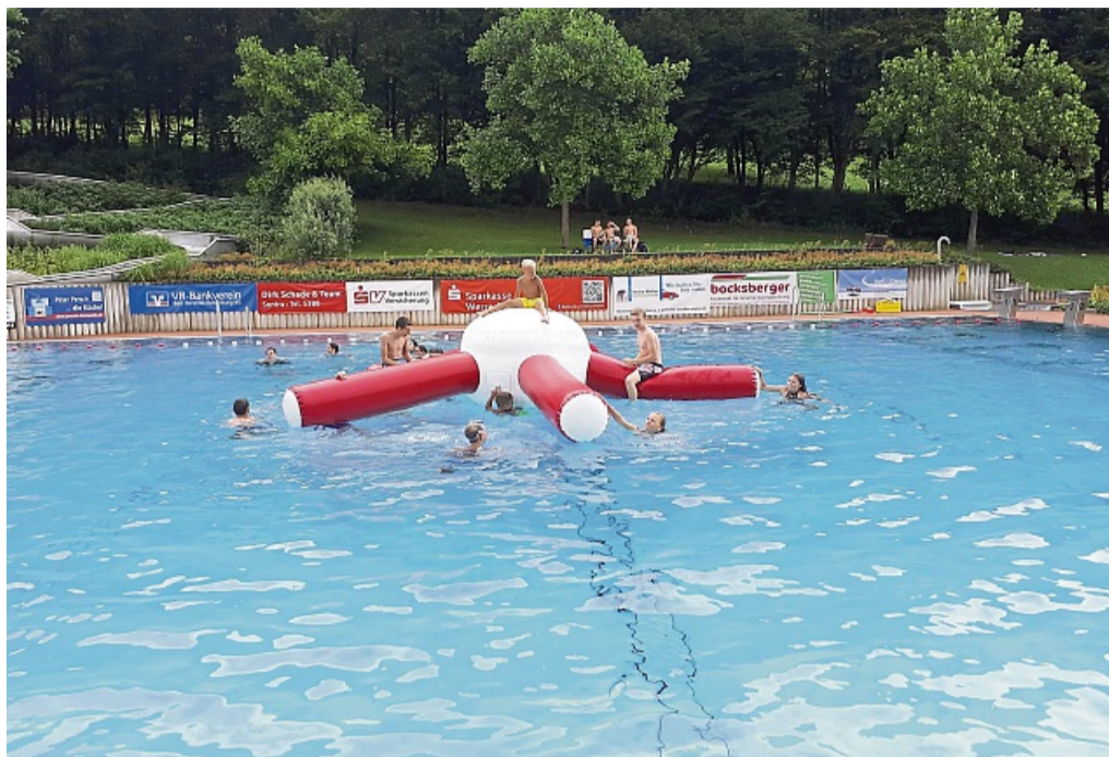
Spiel- und Badespaßtag im Freizeit- und Erlebnisbad Sontra: Große Wasserobjekte sorgen für Spiel und Spaß.