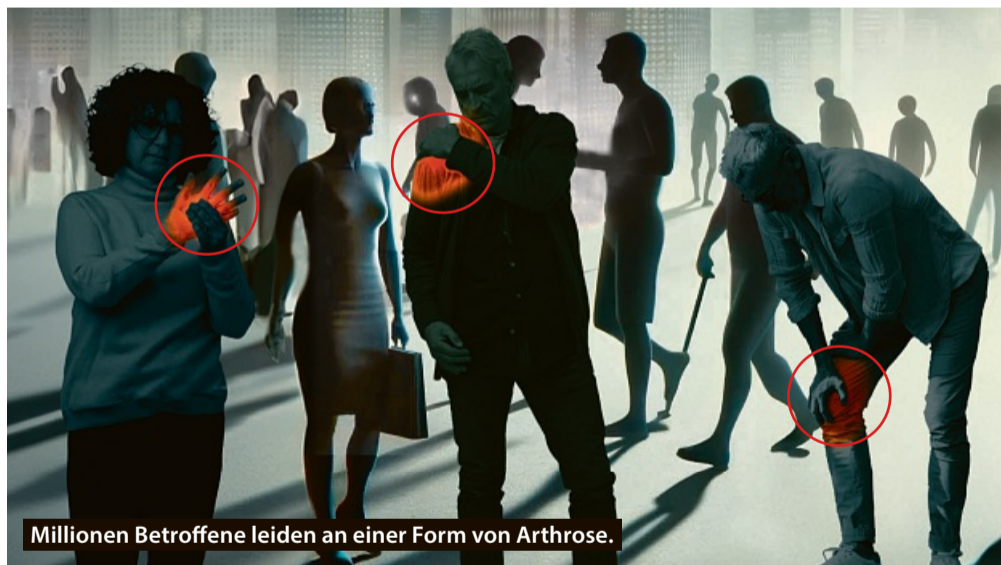
Millionen Betroffene leiden an einer Form von Arthrose.

Zunächst fällt es schwer, das Knie ganz durchzudrücken. Knack- und Reibegeräusche werden hörbar. Treppensteigen verursacht Schmerzen, die sich unter Belastung langsam steigern, aber auch plötzlich einschließen können. Im fortgeschrittenen Stadium treten