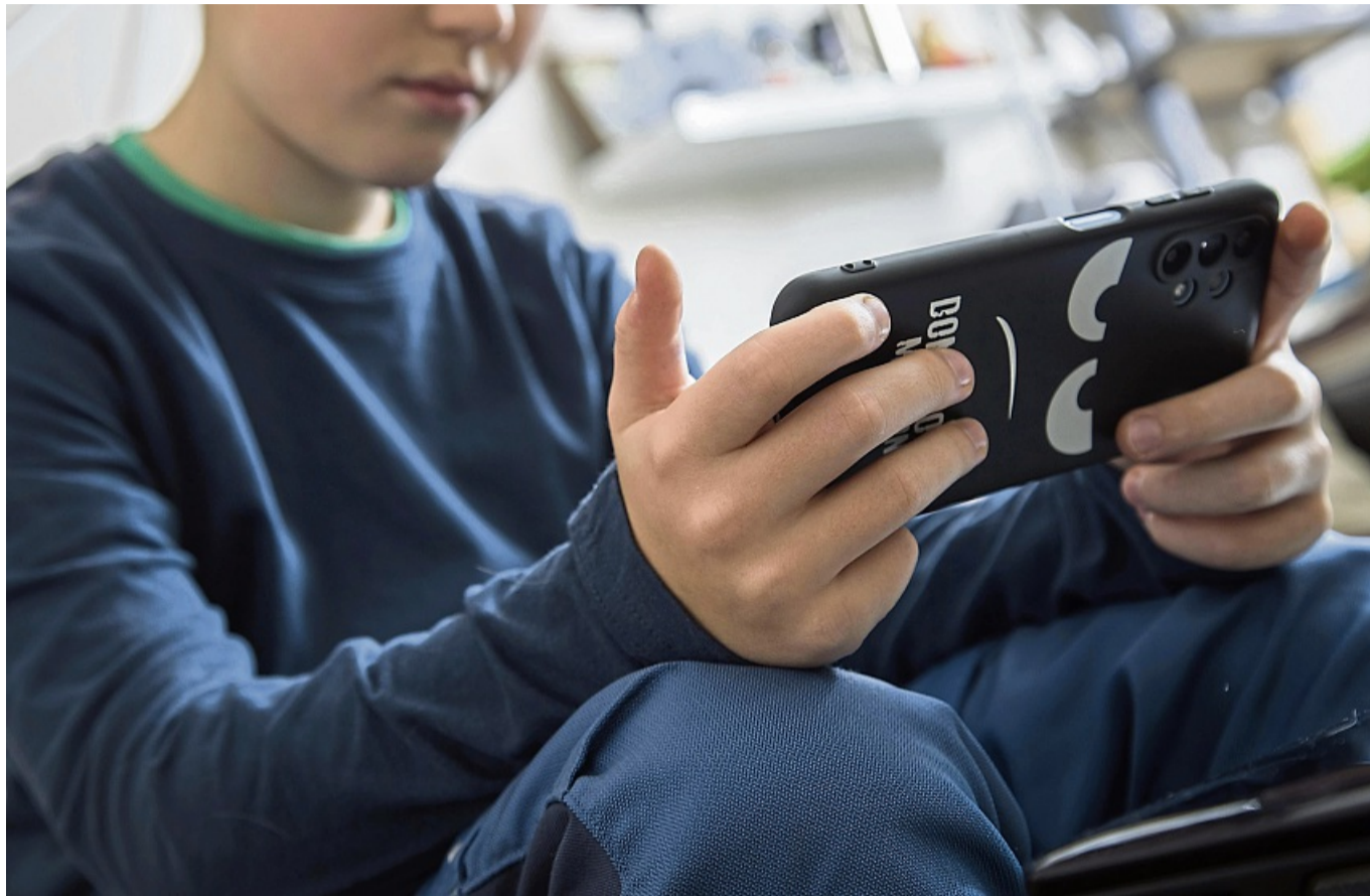
Bei Kindern zwischen 10 und 12 Jahren setzen Eltern bei Social Media vor allem auf Mitnutzung.

Dazu nutzen 50 Prozent der bis 9-Jährigen ein Tablet, 42 Prozent eine Spielkonsole. Bei Kindern zwischen 10 und 12 Jahren wird bei Social Media dann vor allem auf Mitnutzung gesetzt. Für 20 Prozent der Kinder sind soziale Netzwerke zwar grundsätzlich eine No-Go-Area, 38 Prozent aber dürfen ein ande-