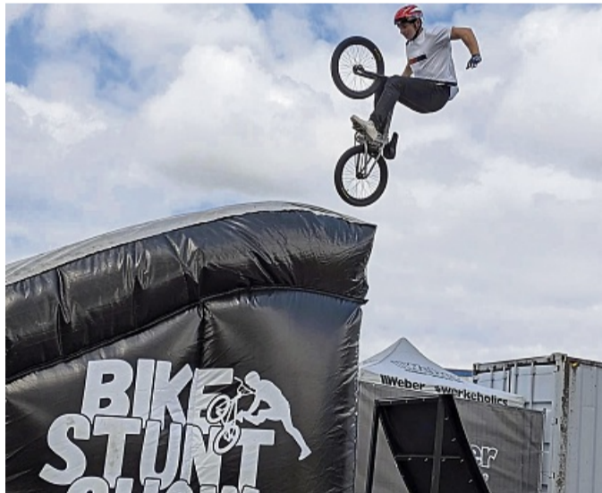
Unglaubliche Sprünge zeigten die BMX-Fahrer.