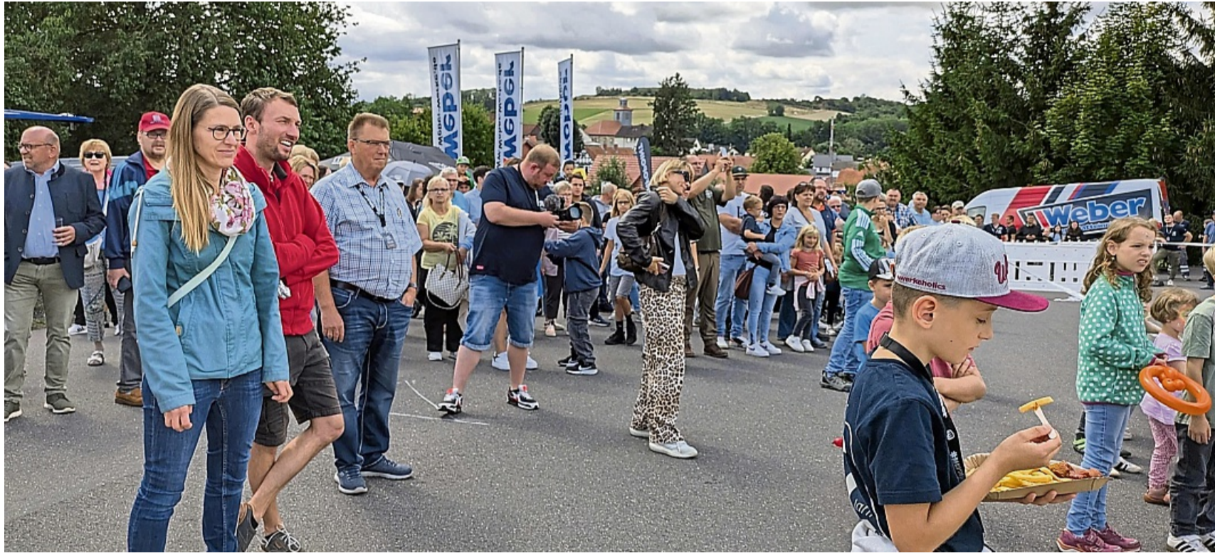
Volksfestcharakter im Außenbereich: Den Gästen des Tags der offenen Tür wurde von BMX-Stunts bis hin zur Kulinarik nur das Beste geboten.

Nesselröden – Was 1950 mit einer kleinen Fahrzeug-Reparaturwerkstatt und Tankstelle begann, hat sich bis heute zu einem innovativen Unternehmen mit 60 Mitarbeitenden entwickelt: Die Weber-Werke feierten am ersten Augustwochenende ihr 75-jähriges Firmenjubiläum – mit einem Festprogramm, das Technikbegeisterte ebenso an zog wie Familien und langjährige Wegbegleiter.