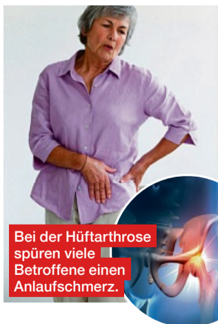
Bei der Hüftarthrose spüren viele Betroffene einen Anlaufschmerz.

Arthrose in den Fingern befällt in der Regel die beiden Endgelenke