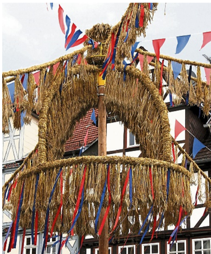
Ragt über allem: Erntekrone hängt über dem Marktplatz in Allendorf.