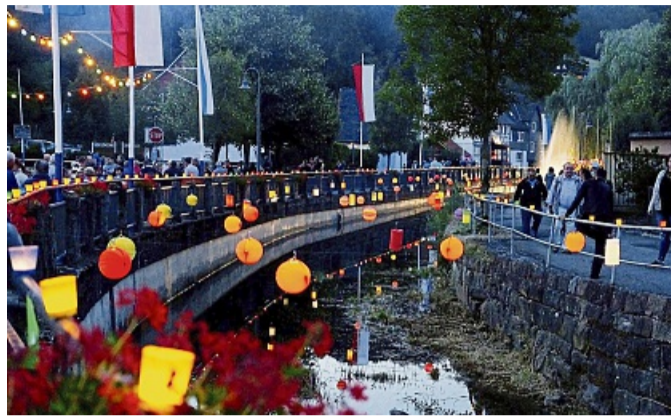
Lichterfest Trubenhausen: Die Gelster wird mit Lampions erleuchtet.

Auch die Kirche ist zu diesem Fest für alle geöffnet. Dort findet am Sonntag, 10. August, ab