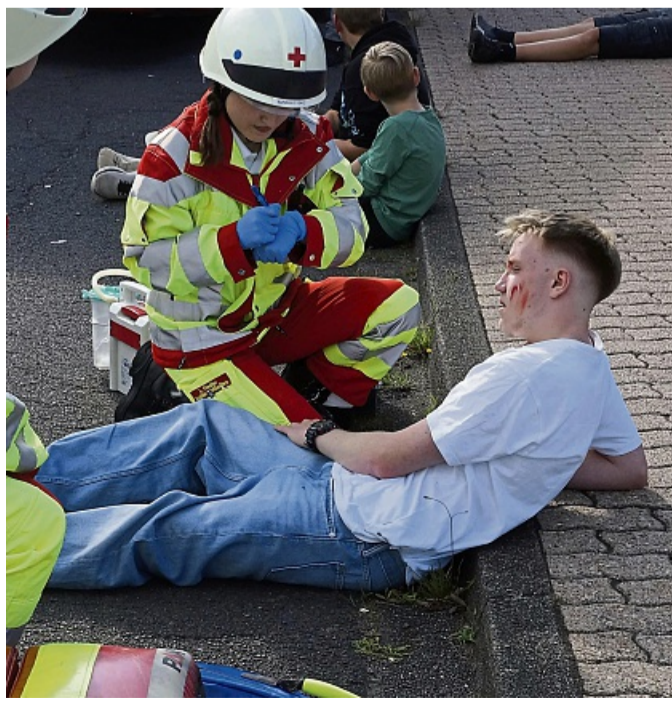
An der Bushaltestelle verletzt liegende Jugendliche benötigen Erste Hilfe.