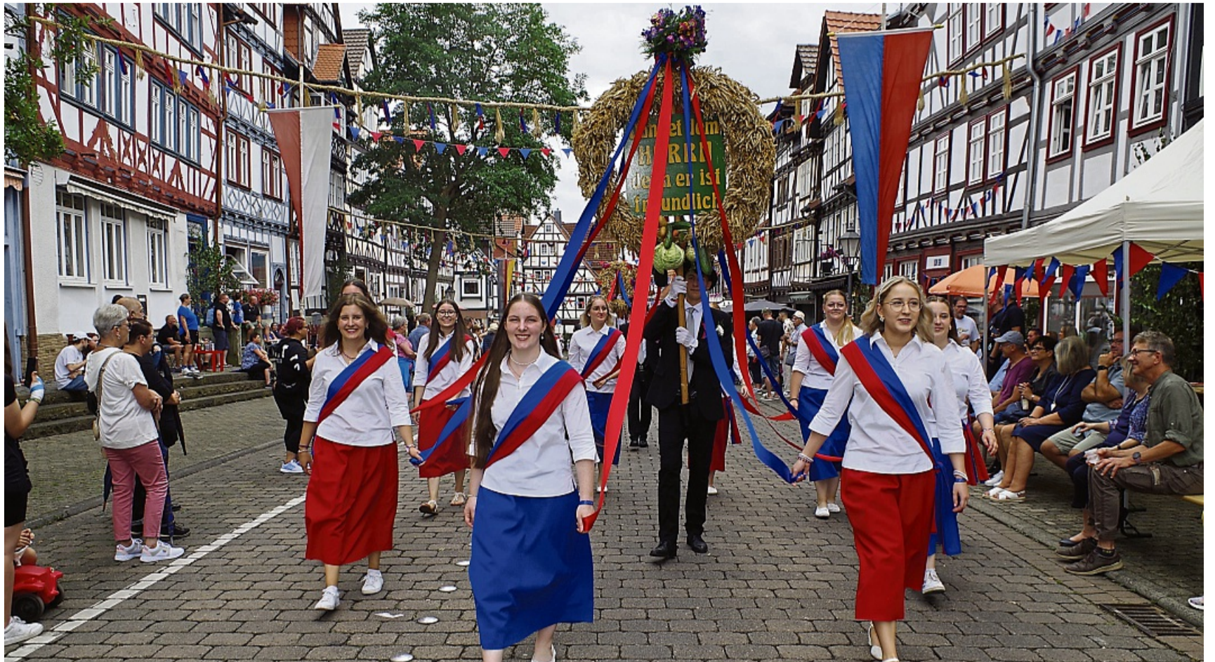
Festzug: Einer der wichtigsten Programmpunkte des Erntedank- und Heimatfests in Bad Sooden-Allendorf findet am Sonntag statt.

Auch am Samstag gibt die Kirche den Ton an: Das Fest wird ab 14 Uhr durch den Posaunenchor vom Turm der St.-Crucis-Kirche angeblasen. Um 15 Uhr folgt dann die offizielle Festeröffnung auf dem Marktplatz, wohin dann auch gegen 17.15 Uhr die Erntekrone und der Erntekranz durch die Weberstraße eingeholt werden – begleitet vom Musikzug Frankershausen und dem Spielmannszug Bad Sooden-Allendorf. Um 17.30 Uhr folgen die offiziellen Ansprachen von Sven Gerlach und Bürgermeister Frank Hix.