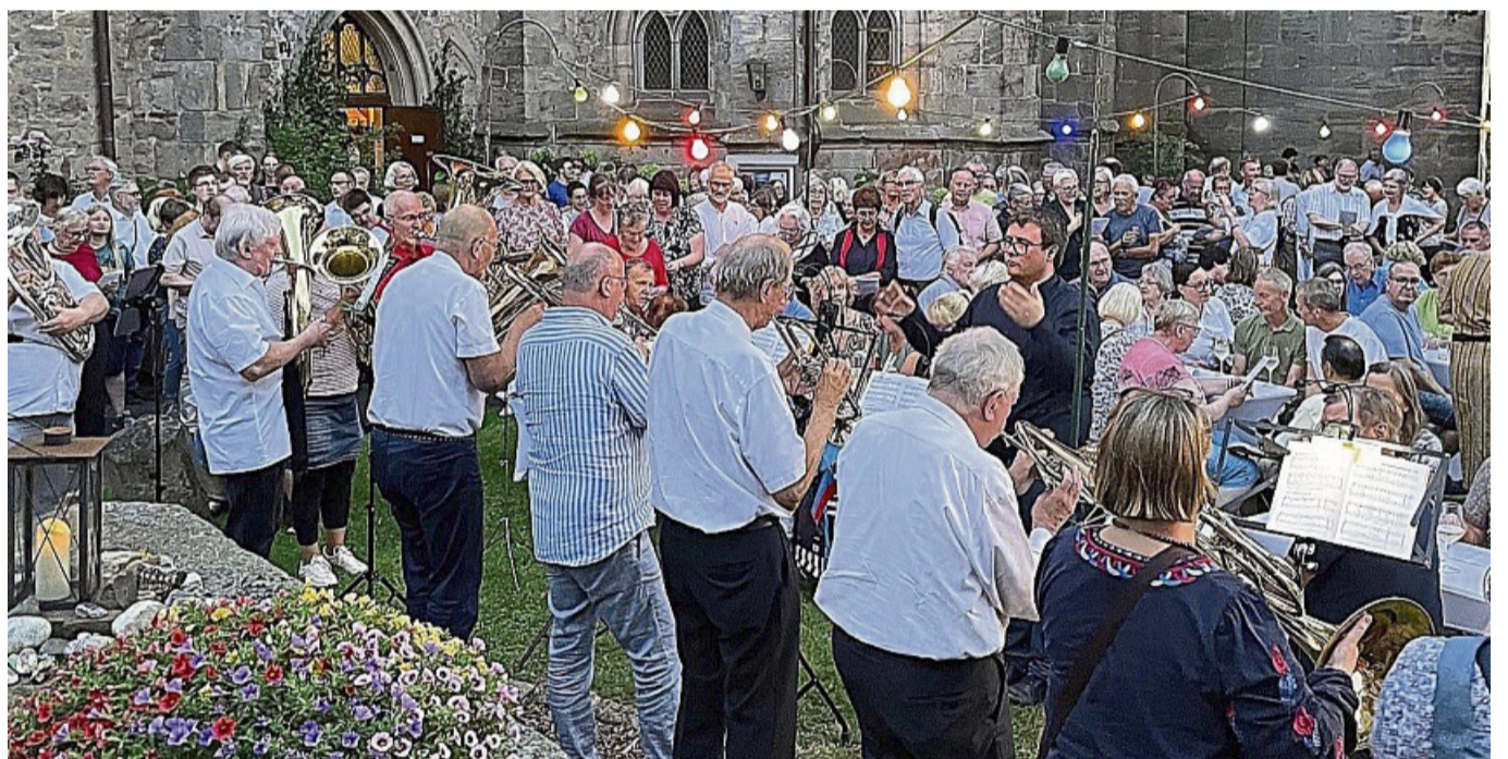
Voller Kirchplatz: An mehreren Tagen wird vor und in der Kirche musiziert.