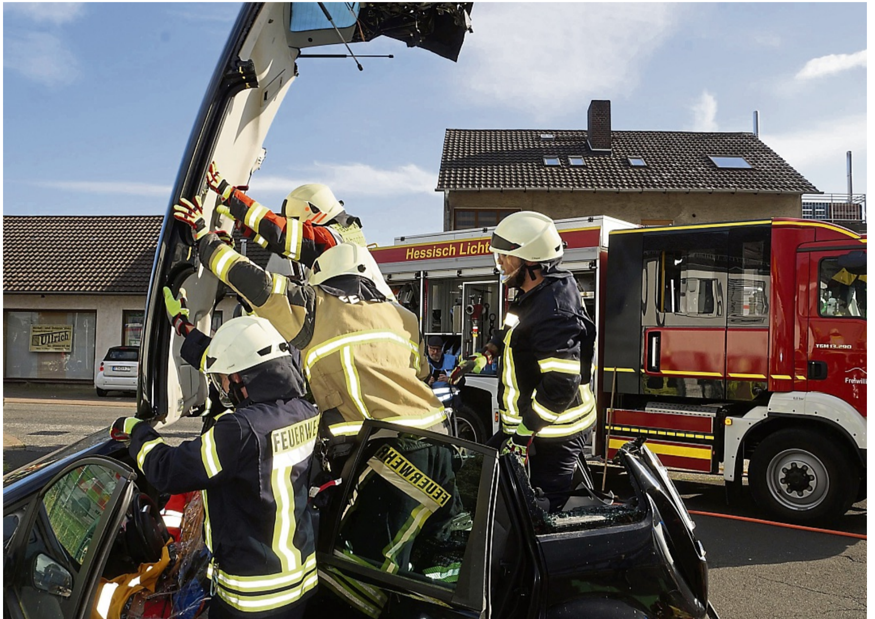
Das Autodach wird zur Bergung des eingeklemmten Unfallopfers nach vorne geklappt.

Während die angehenden Notfallsanitäter angesichts der hohen Zahl von Verletzten mit deren Erstversorgung alle Hände voll zu tun hatten, befreite die Feuerwehr im Zusammenspiel mit dem DRK die eingeklemmten Personen. Besonders