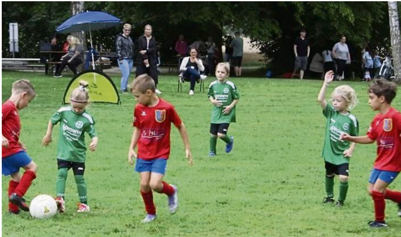
Auch Mädchen im Kampf um den Ball: eine Szene aus dem Spiel der sechsjährigen Kinder aus Bad Sooden-Allendorf (in Rot) und Herleshausen/Nesselröden/Unhausen.