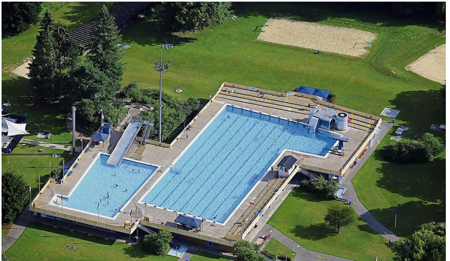
Im Hann. Mündener Hochbad startet Mitte August die 100er-Challenge.

Diese Zeit, sprich die Dauer für 100 Meter sowie die Pause,