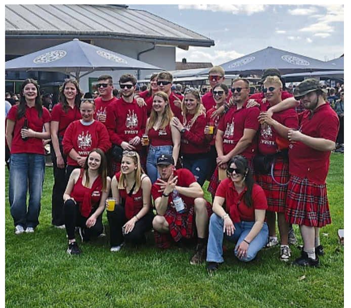
Die Kirmesburschen und Sektbargirls aus Twiste planen 2025 ein unvergessliches Festwochenende.

Am Montagmorgen ziehen die Kirmesburschen und Sektbargirls traditionell mit Musik und Besenverkauf durchs Dorf und wecken Twiste auf charmante Weise. Der Feierabendschoppen entfällt in diesem Jahr.