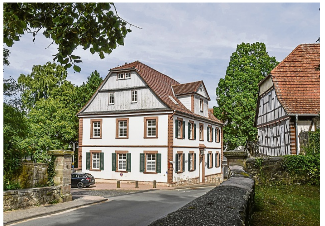
Die Musikschule Korbach bietet im neuen Schuljahr ein umfangreiches Angebot von der musikalischen Früherziehung bis zum Instrumentalunterricht.

Einen ersten Eindruck der Blasinstrumente können die Kinder auch beim Kinder- und Familienkonzert „Mähähäh“ des Symphonischen Blasorchesters Korbach-Lelbach bekommen. Das Konzert findet am 21. September um 15 Uhr in