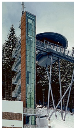
Die Firma Hübschmann baute den Aufzug im Sprungturm der Mühlenkopfschanze in Willingen.

Abgerundet wird die Veranstaltung durch ein Gewinnspiel. Für das leibliche Wohl ist gesorgt und für die jungen Besucher gibt es einen Hübschmann Eisenbahn-Express, eine Hüpfburg, Fußballart und -billard.