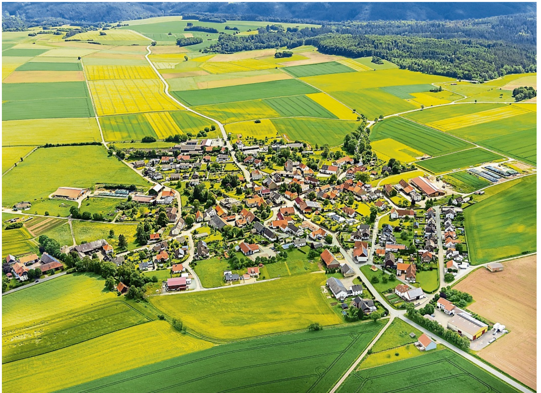
Immer mit der Zeit gegangen und jung geblieben: Immighausen wird 1175 Jahre alt. Das wird am letzten August-Wochenende gebührend gefeiert.

Der Kindergarten beim DGH öffnet am Samstagnachmittag ebenfalls seine Türen und bietet ein breites Spieleangebot für Mädchen und Jungen an. Dort gibt es auch frische Waffeln und eine Ausstellung mit historischen Kindergartenbetten. Außerdem wird für die Kleinen neben dem Festplatz auf einer Rasenfläche noch ei-