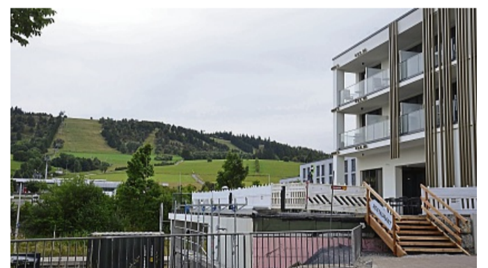
Das Baufundament des „Mountain View“-Hotels nutzen zu können, erleichtert der Brückenbau zwischen Briloner Straße und dem Fuß des Ettelsbergs. WILHELM FIGGE

Die nächsten Entscheidungen über Fördergelder der zuständigen Stellen stehen im September an, danach erst wieder im Frühjahr. Das stelle die Gemeinde vor Zeitdruck, erklärte Trachte: Mit dieser Verzögerung könne es zu Terminkollisionen mit dem Bau der geplanten Gastronomie neben dem B&B-Hotel kommen. Das