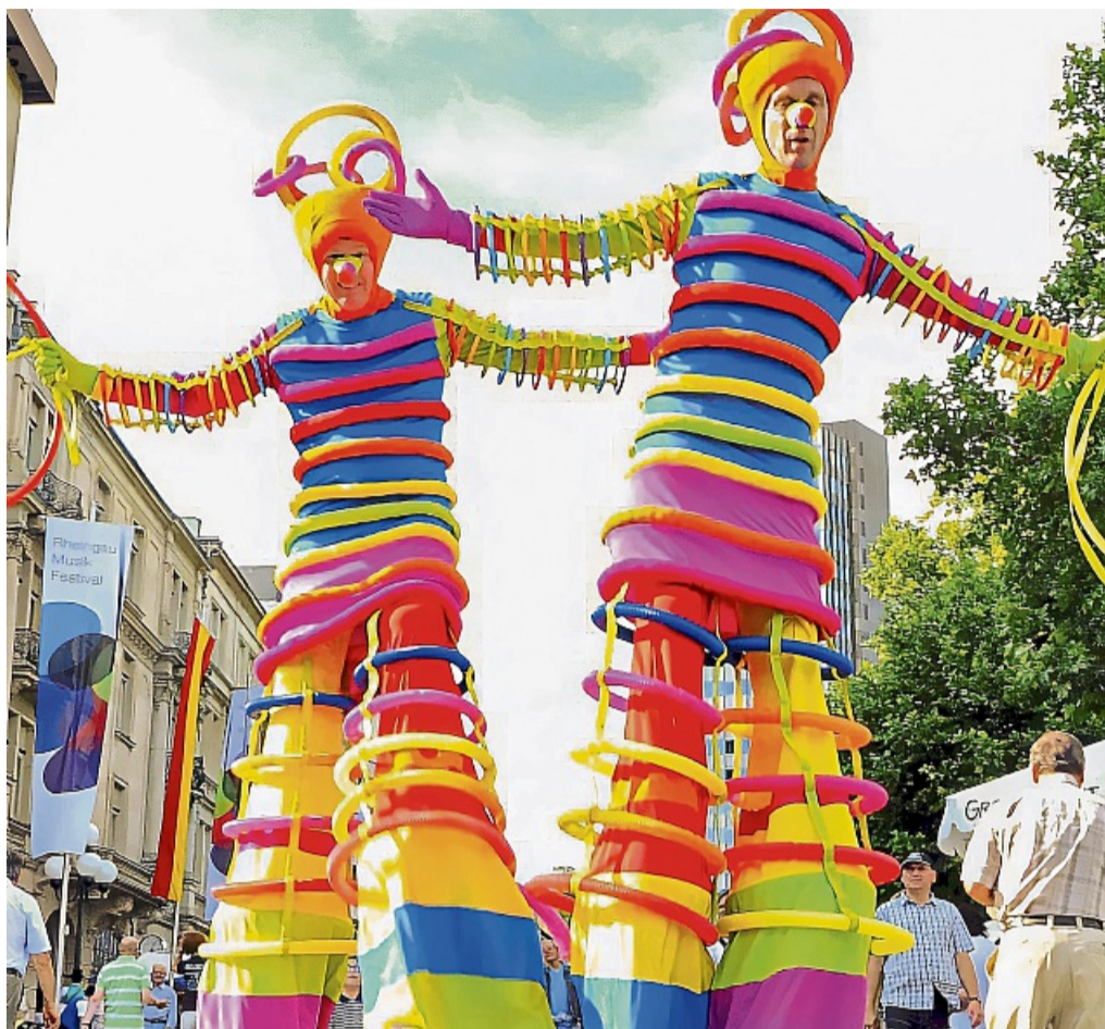
Die Ringelschlingel: Ein spielerischer Walking Act des Stelzentheaters Circolo mit Stelzenläufern in farnefrohen, spiralförmigen Kostümen, die über drei Meter groß sind.