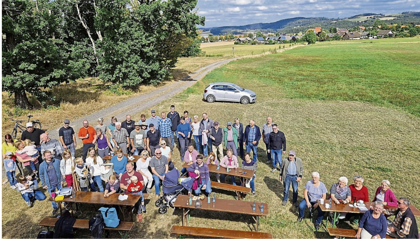
Grenzbegang: Rund 50 Rhaderner und zwölf Kinder sind der Einladung von Ortsbeirat und Sportgemeinschaft gefolgt.

Über 60 Teilnehmer haben Grenze zu Dalwigksthäl abgeschrieben