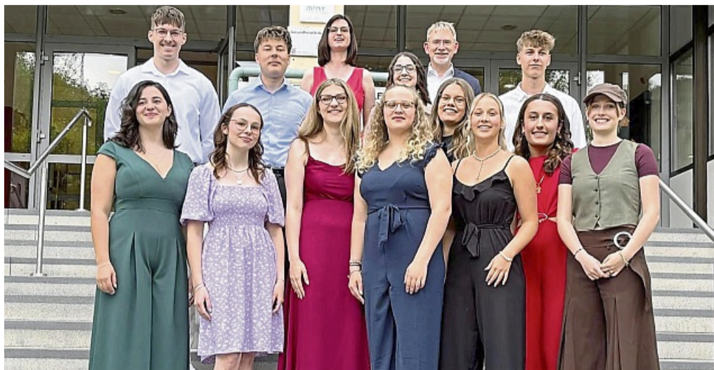
Feierliche Zeugnisübergabe für den Abiturjahrgang 2025 der Adam-von-Trott-Schule Sontra

Es schlossen sich weitere Reden des Bürgermeisters Herrn Eckhardt, des Elternbeirates sowie des Fördervereins an. Alle beglückwünschten herzlich die Abiturientinnen und Abiturienten und stellten die Leistungen und Anstrengungen heraus, welche die Schülerin-