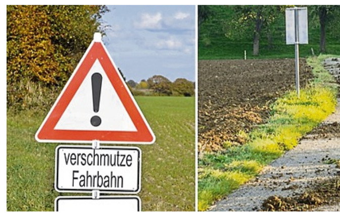
Verschmutzte Straßen durch landwirtschaftliche Maschinen oder forstwirtschaftliche Fahrzeuge

E-Bikes, E-Scooter, Mofas (bis 25 km), Inlineskater u.a. dürfen außerhalb geschlossener Ortschaften ebenfalls auf dem Radweg fahren. Gerade die Zweiradfahrer sind besonders gefährdet zu verunfallen.