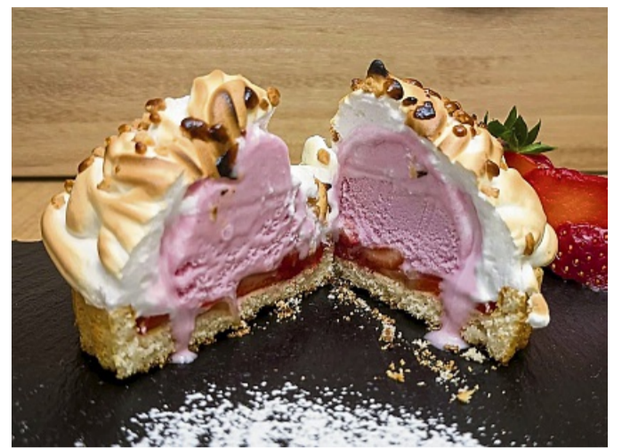
Außen heiß und flambiert, innen noch gefroren – so ist das gebrillte Eis mit goldbraunem Baiser perfekt zum sofortigen Servieren.

entstehen beim Flambieren unter der Grillhaube tolle braune Kanten.