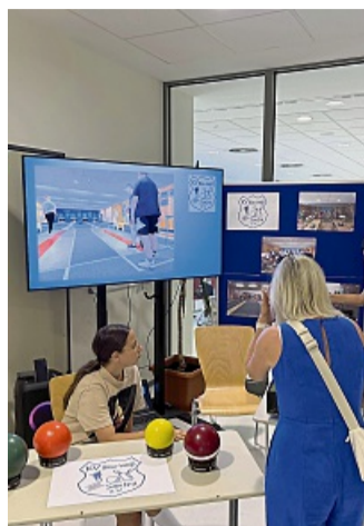
Projektwoche, Schulfest und Verabschiedungen beenden das Schuljahr 2024/2025 an der Adam-von-Trott-Schule.

Im Anschluss an das Schulfest wurden dann noch die folgenden Kolleginnen und Kollegen verabschiedet: Herr Fren-