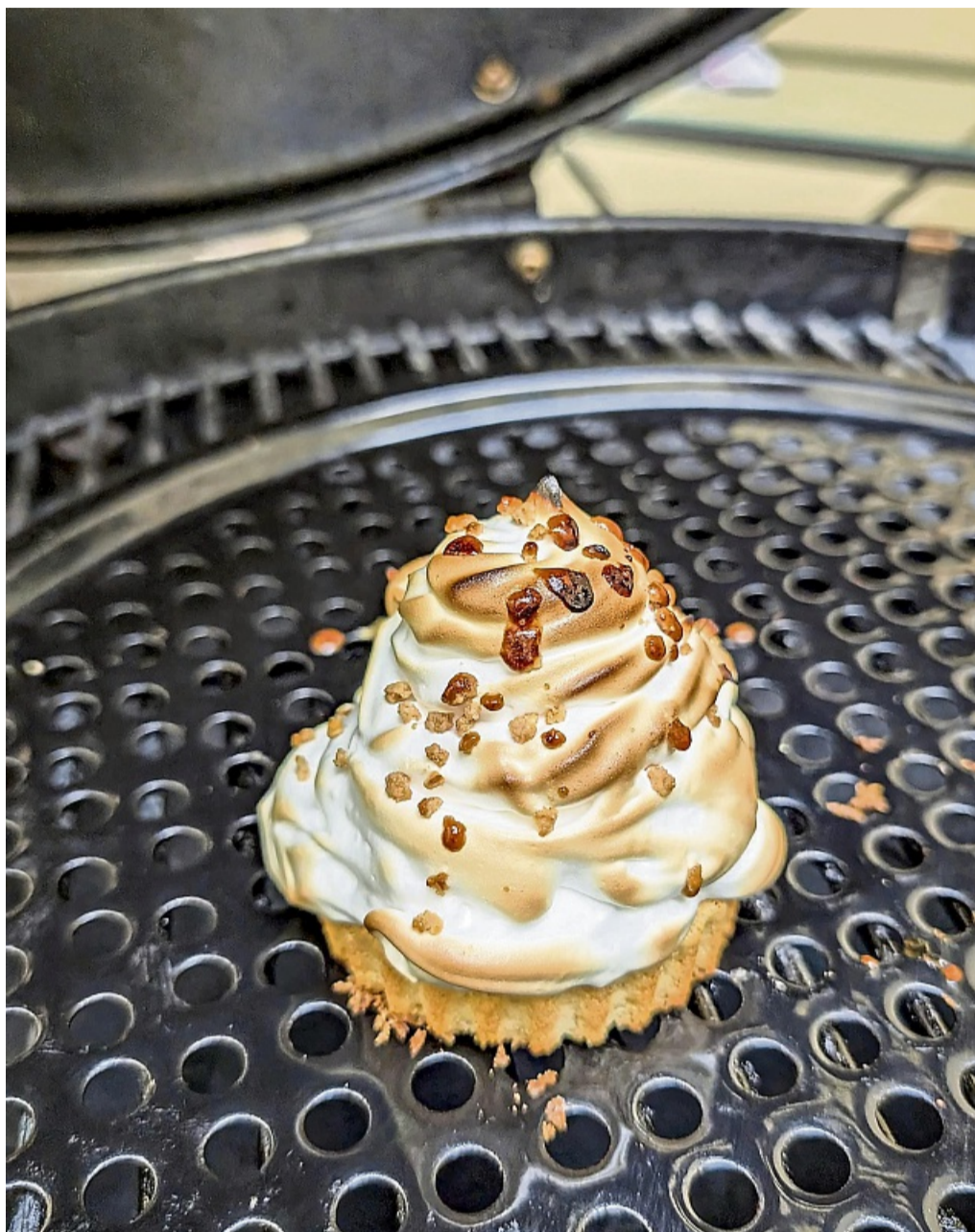
Der kleine Tortenboden sorgt beim Grillen des mit Eischnee ummanteltem Eis für Stand.