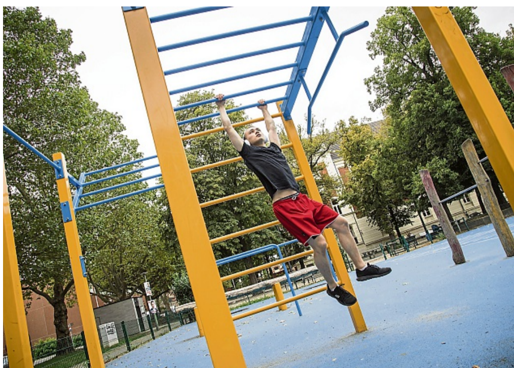
Calisthenics-Parks lassen sich in vielen Städten finden – die Online-Suche listet weltweit geeignete Spots auf.

Aus dem Griechischen kommend, setzt sich Calisthenics aus den Begriffen „schön“ und „Kraft“ zusammen. Auch Street Workout genannt, ist Calisthe-