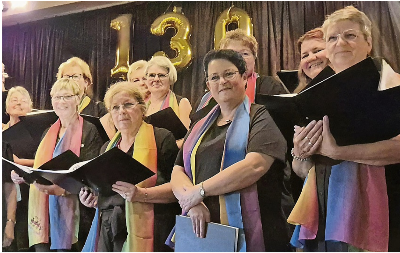
Hatten selbst gerade Jubiläum und bereichern jede Veranstaltung: Die Mixed Colours aus Berneburg werden einer von 16 Chören sein, die beim Chorfest am 24. August in Reichensachsen auftreten werden.