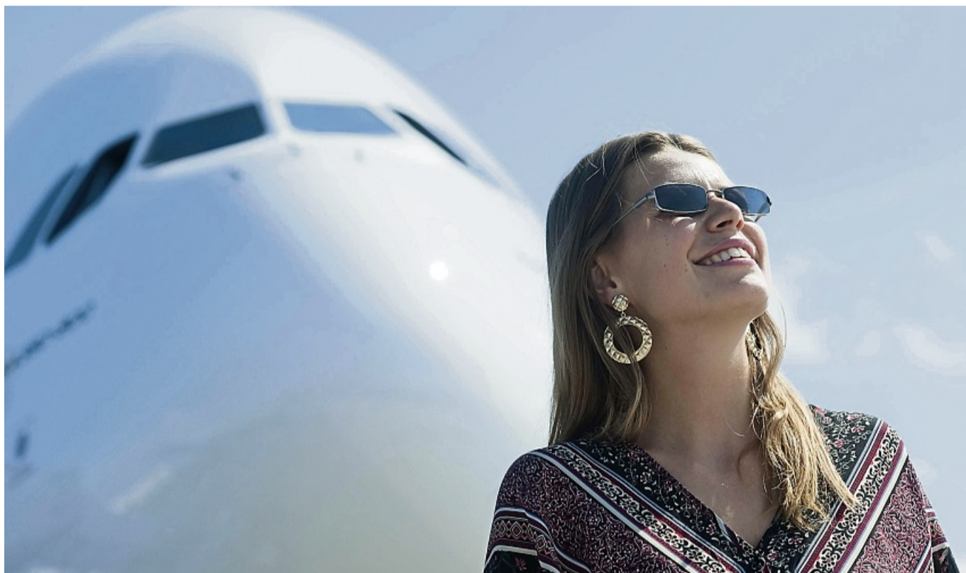
Mit einem Flugangst-Training lässt sich die Angst reduzieren und entspannter fliegen.

Von einer Flugphobie im engeren Sinne (Fachbegriff Aviophobie) spricht man, wenn schon der Gedanke an eine Flugreise Panik auslöst und Fliegen daher meist vermieden