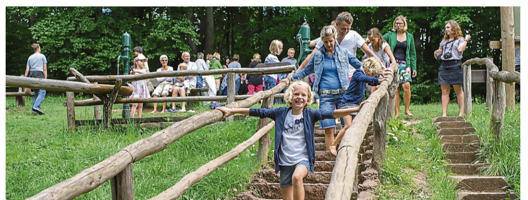
Die Schlammterrasse am Barfußpfad am Hohen Meißner mit kühlem Quellwasser gehört zu den besonderen Attraktionen und wird beispielsweise von Familien gerne genutzt.

Im Vergleich von 57 deutschen Barfußparks erster Platz gesichert