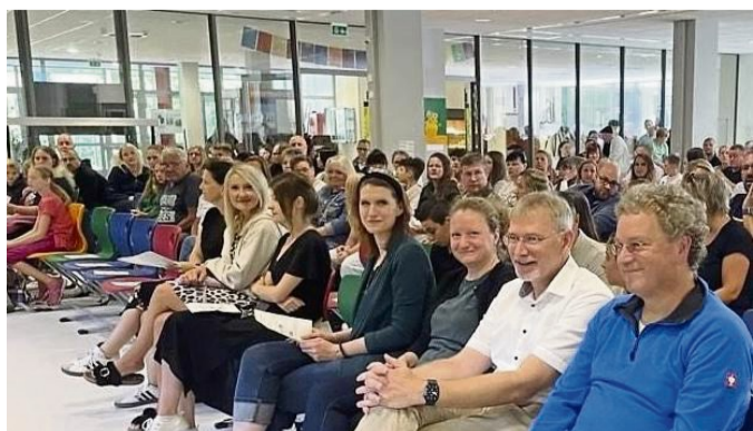
Begrüßungsfeier für die neuen Fünftklässler in der Adam-von-Trott-Schule Sontra.