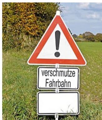
Verschmutzte Straßen sind aktuell kaum vermeidbar.

Um Beschwerden oder Unfälle zu vermeiden, ist die Verschmutzung auf allen öffentlichen Straßen und Wegen, inner- wie außerorts, unverzüglich zu beseitigen.