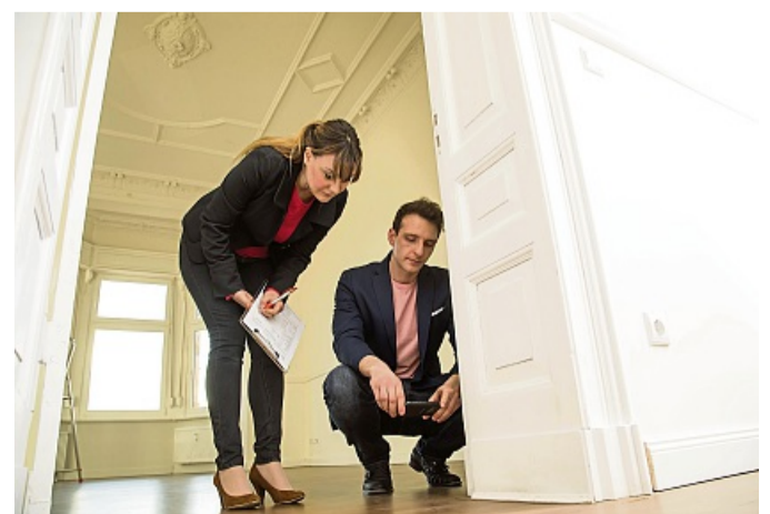
Möglicher Pilzbefall: Vor dem Kauf sollte ein Altbau von einem unabhängigen Sachverständigen kontrolliert werden.

Ein Altbau hat Charme und steht oft in gewachsenen Stadtvierteln mit guter Infrastruktur. Allerdings kann er auch seine Tücken haben. So warnt der Verband Privater Bauherren (VPB) etwa vor holzerstörenden Pilzen. Diese siedeln sich vor allem in feuchtem Holz an, wenn also etwa längere Zeit Wasser ins Haus eingedrungen ist. Aber auch wenn in ein altes Gebäude neue, luftdichte Fenster eingebaut wurden, können Feuchteschäden und Pilzbefall folgen. Je nach Schädling könne eine Sanierung sehr teuer werden, so der VPB. Aus diesem Grund sollten Kaufinteressierte immer vorab klären lassen, ob ein Pilz im Haus siedelt, und wenn ja, um welchen es sich handelt. Als Laie sehe man solch einen Pilz erst, wenn er schon sehr weit fortgeschritten sei. „Es kann aber auch schon bedenklich sein, ohne dass man etwas sieht“, sagt VPB-Sprecher Lars Klaußen. „Ob da etwas vorhanden ist, weiß nur ein Sachverständiger.“ Der Verband rät daher, ein altes Haus stets vor dem Kauf von einem unabhängigen Sachverständigen kontrollieren zu lassen. So eine Einschätzung zeigt letztlich nicht nur in Bezug auf einen Pilz, wo und was gegebenenfalls saniert werden muss.