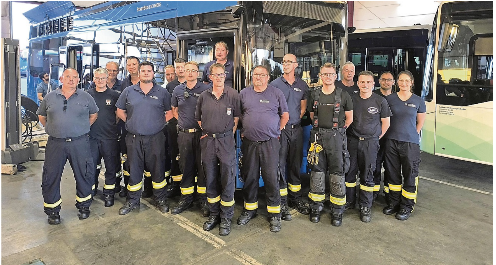
35 Feuerwehrangehörige informierten sich im Schulungszentrum der Firma Frölich bei Technikern und Ingenieuren der E-Busse über die speziellen Anforderungen.

Eschweger Einsatzkräfte wurden im Schulungszentrum von Frölich eingewiesen