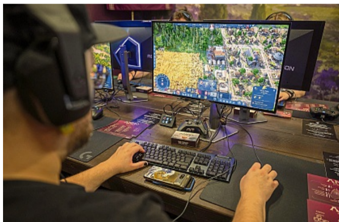
„Anno 117: Pax Romana“: Nach dem sehr erfolgreichen «Anno 1800» geht es für die Aufbau-Spielereihe als Nächstes in die Hoch-Zeit des römischen Imperiums.