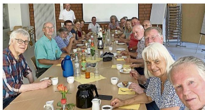
Gemütliches Beisammen beim Pensionärstreffen an der Adam-von-Trott-Schule Sontra.

Am Ende waren sich alle einig, diese Veranstaltung auch im kommenden Jahr zu wiederholen.