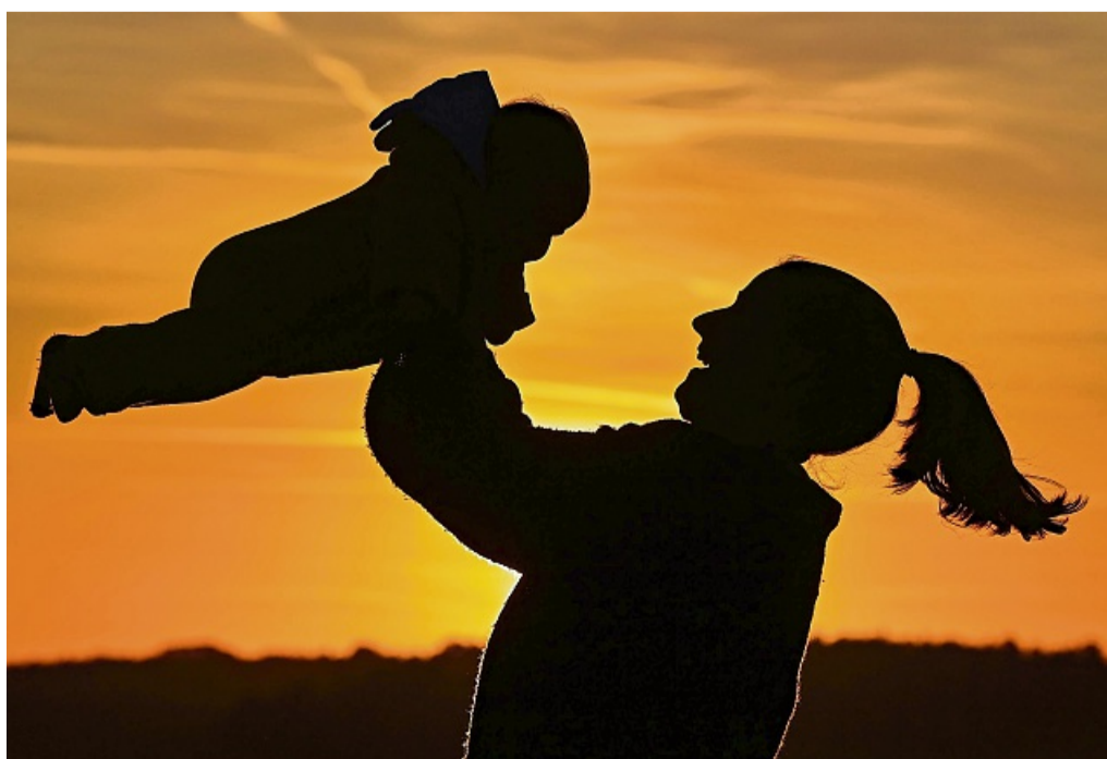
Alleinerziehend? In Deutschland trifft das auf deutlich mehr Mütter als Väter zu.

Auch der Tod eines Partners kann die Ursache dafür sein, dass man alleinerziehend wird. Die Ansprüche für die Witwe oder den Witwer richten sich danach, wie lange man verheiratet war. Bei den Ansprüchen der Kinder spielt das Alter eine Rolle. „Zuständig ist hier die Deutsche Rentenversicherung“, sagt Mechthild Greten, Sprecherin beim Deutschen Caritasverband.