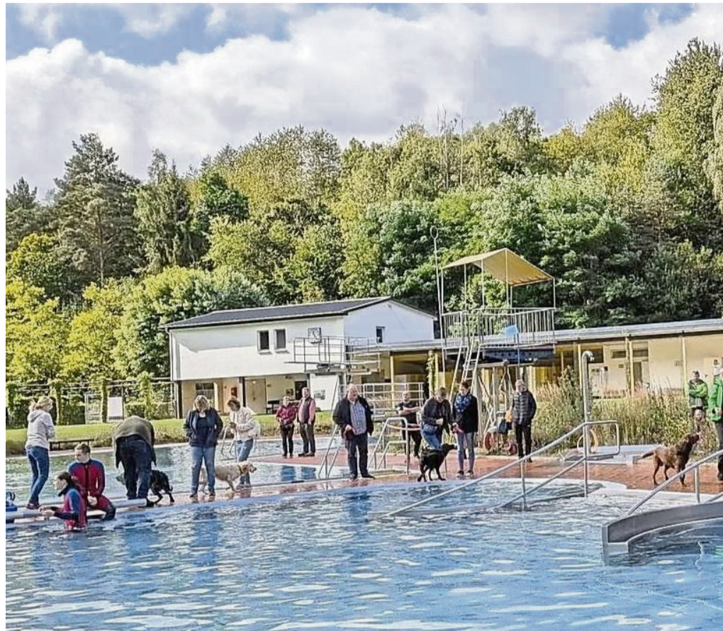
Freizeit- und Erlebnisbad Sontra: Das Hundeschwimmen im Freizeit- und Erlebnisbad Sontra findet immer sehr guten Zuspruch.

Schwimmbad lädt am 21. September zum Hundeschwimmen