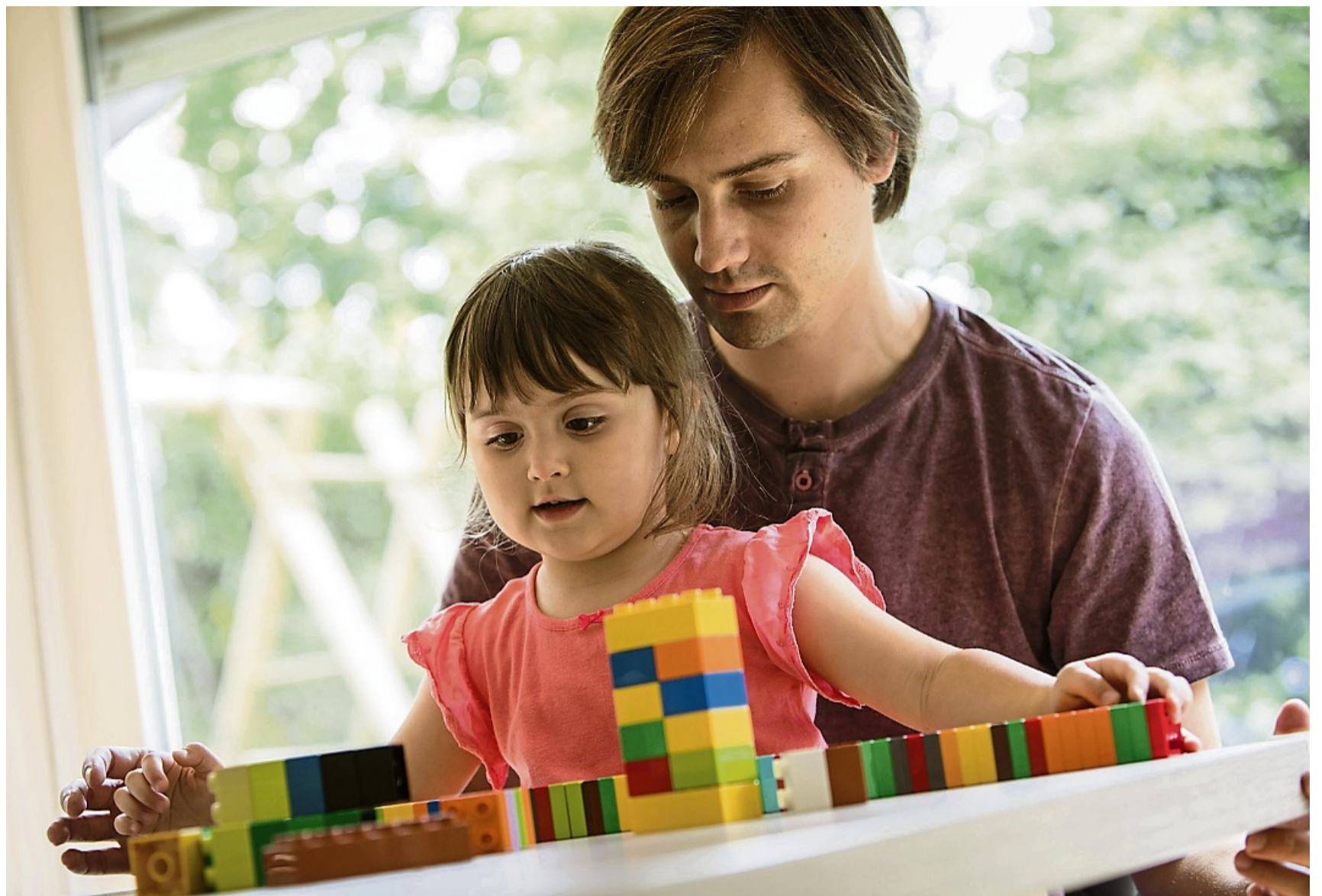
Weniger finanziell belastet: Wer als alleinerziehende Person alle rechtlichen und staatlichen Möglichkeiten ausschöpft, lebt unter Umständen entspannter.

Den Kinderzuschlag (KiZ) von maximal 297 Euro monatlich pro Kind gibt es zusätzlich zum Kindergeld, falls das Einkommen zwar für den eigenen Lebensunterhalt reicht, nicht aber dafür, die gesamte Familie zu versorgen. Der KiZ-Lotse auf der Homepage der Bundes-