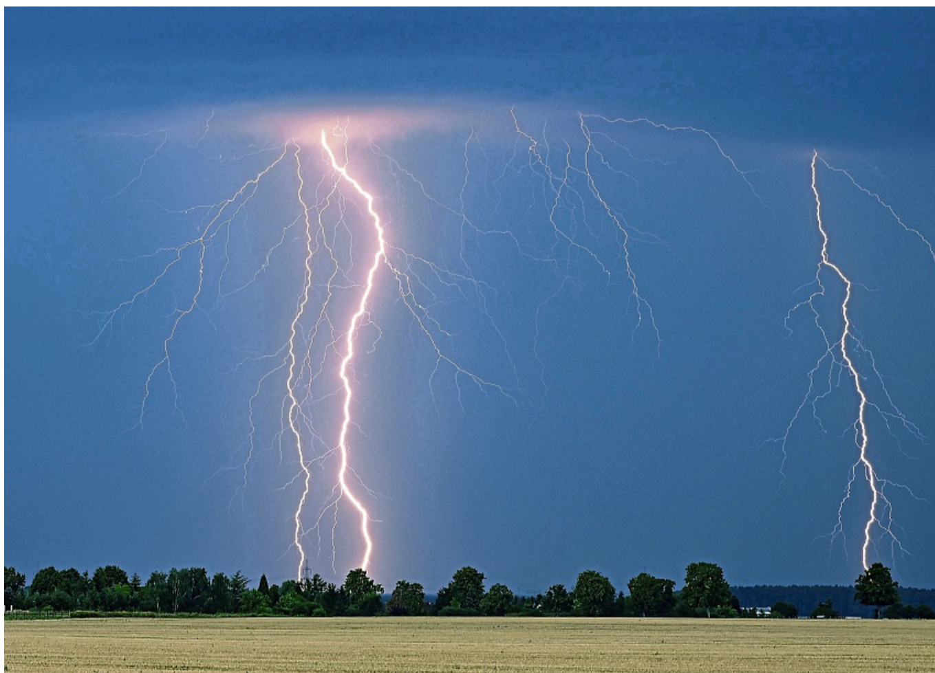
Gewitterblitze sind aus der Ferne ein spektakuläres Schauspiel – direkt über einem aber eher furchteinflößend.