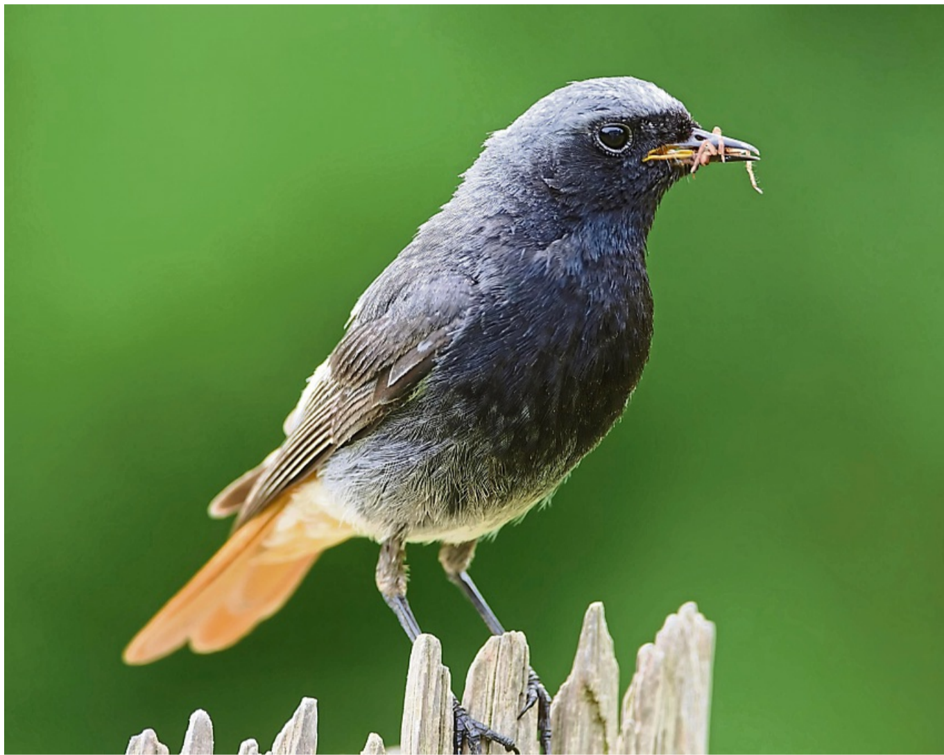
Der Hausrotschwanz ist Vogel des Jahres 2025. Er ziert die Titelseite des neuen Vogelkundlichen Heftes, das im Buchhandel und beim NABU erhältlich ist.