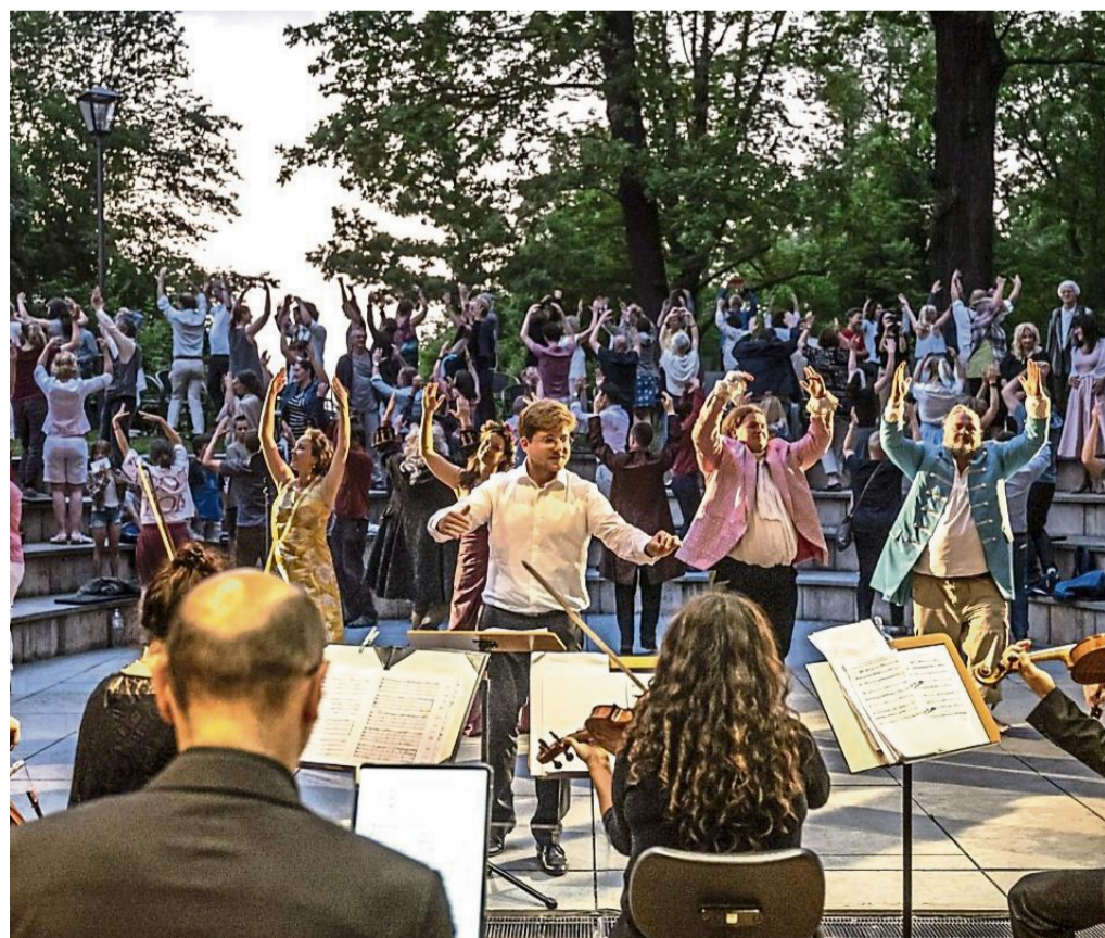
Oper prachtvoll unterm Abendhimmel: Am Samstag, 30. August, ist auf Burg Lichtenfels die Formation „Extra-Klang“ mit „Bock auf Barock“ zu erleben.

wigkthal.de/ticketshop, bei der Buchhandlung Jakobi in Frankenberg, der WLZ in der Lengfelder Straße 6 in Korbach und der Buchhandlung Thalia in Korbach. An der Abendkasse kosten sie 38 Euro. zve