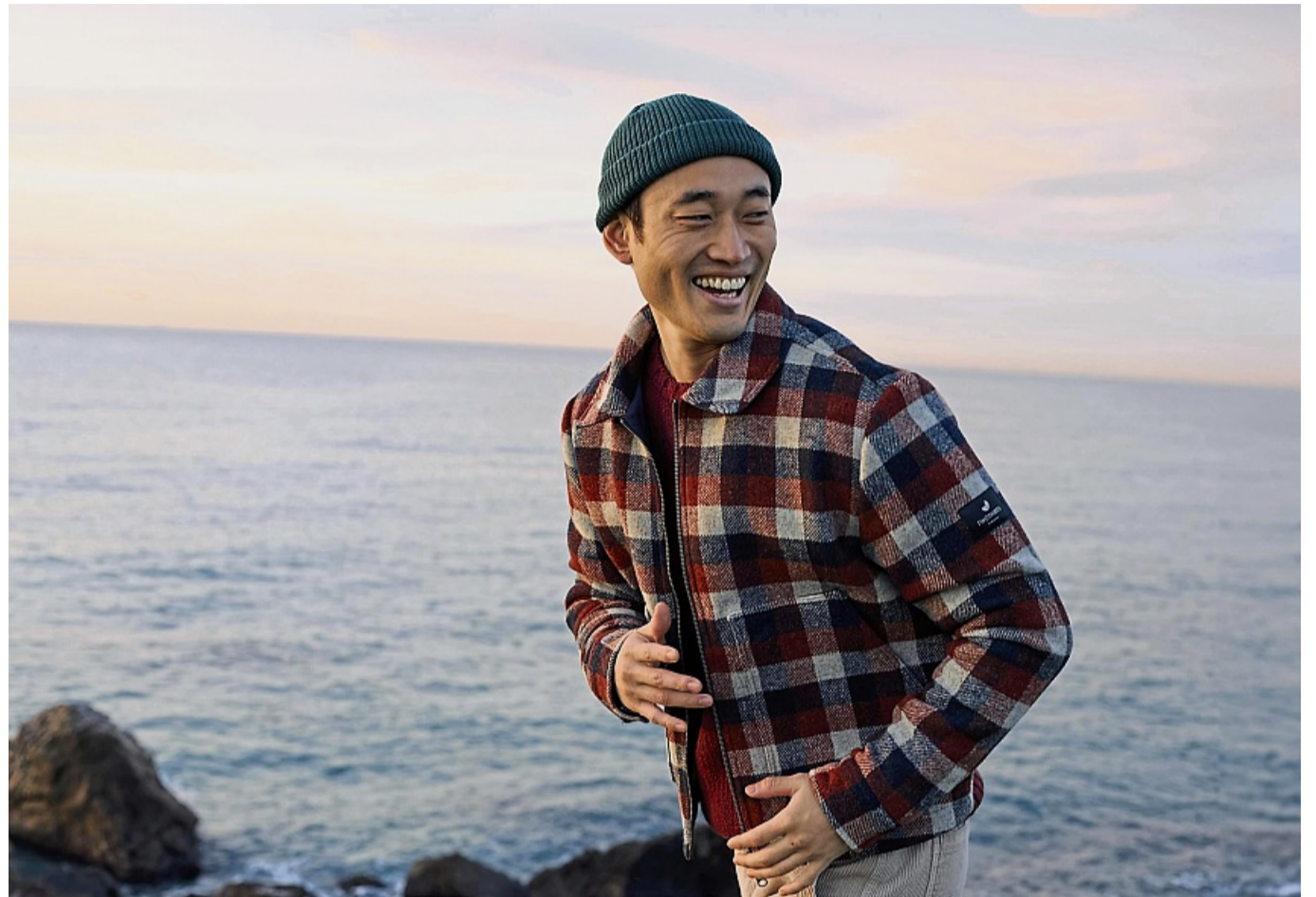
Auffällige Karos - wie bei der Hemdjackete von TwoThirds - transportieren eine gehörige Portion Lebenslust.

Wie bereits angedeutet, zieht die Krawatte in den Alltag ein. „Nicht als Muss, sondern als bewusst gesetzter Akzent für modisch aufgeschlossene Männer. So ist sie etwa neu zur Leder- oder Jeansjacke“, erklärt