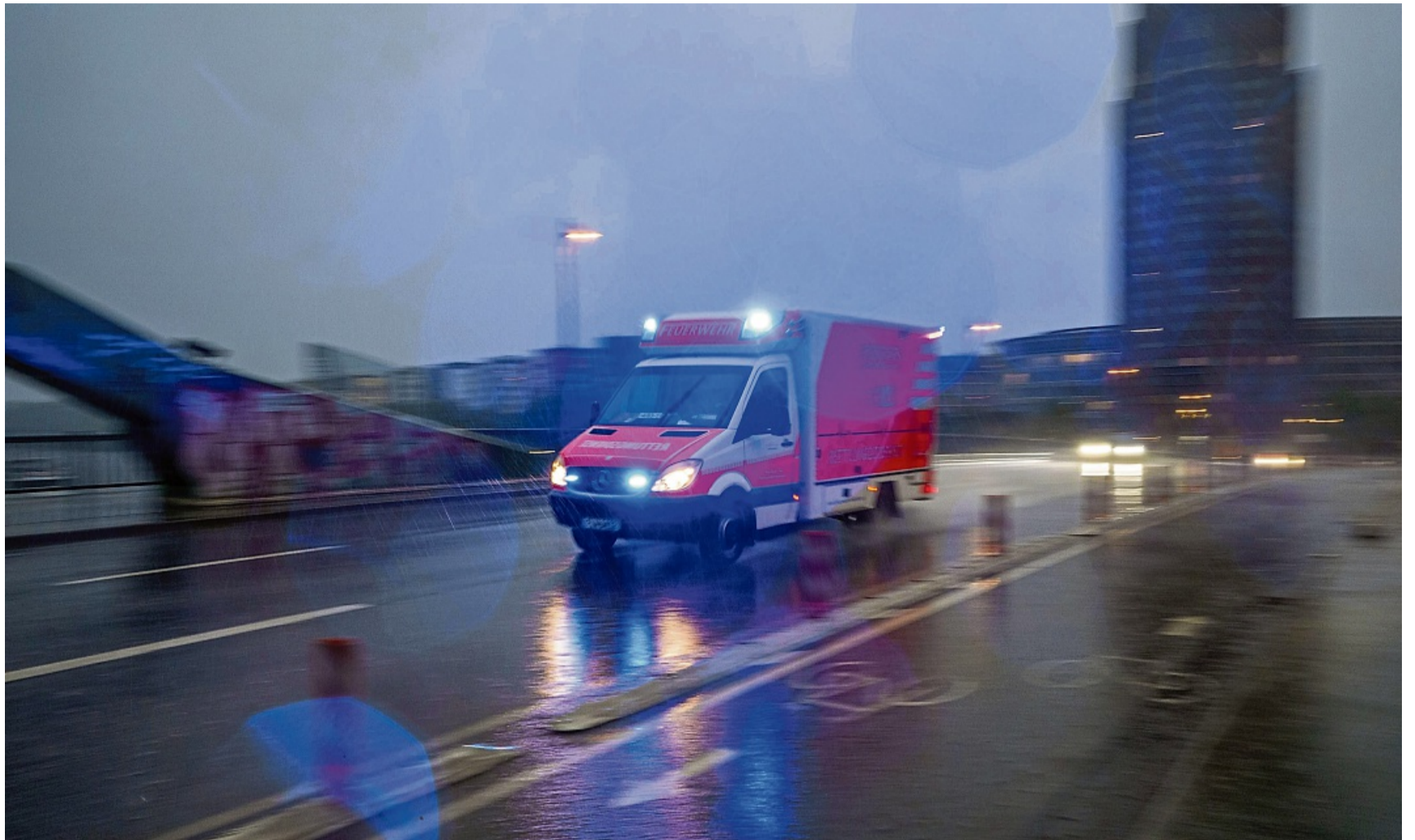
Jede Sekunde zählt: Wer vom Blitz getroffen wird, schwebt mitunter in Lebensgefahr und braucht schnelle Hilfe.