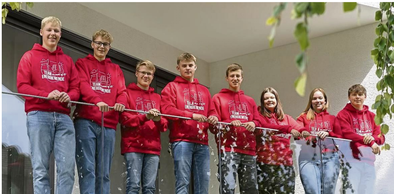
Die Auszubildenden bei der EWF haben gute Zukunftsperspektiven.

Die Energiewirtschaft ist die Zukunftsbranche überhaupt.