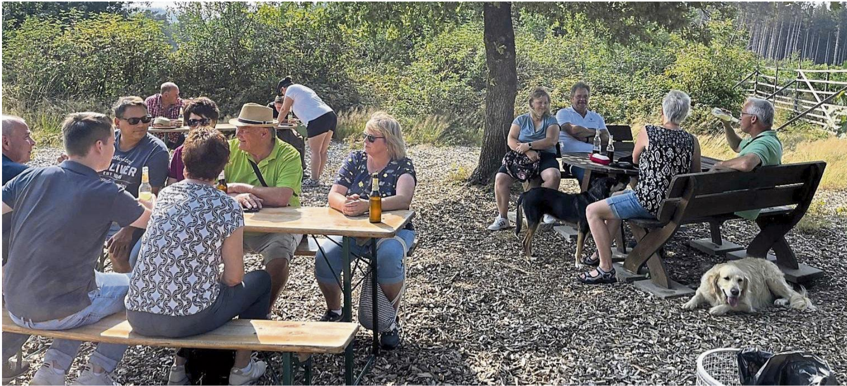
Zum Sommerfest trafen sich Mitglieder der Bürgerliste Gemünden.