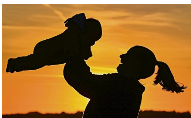
Alleinerziehend? In Deutschland trifft das auf deutlich mehr Mütter als Väter zu.