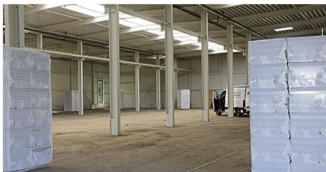
Neue Produktionshalle: Die ist aktuell noch voll im Bau. Fertigstellung soll voraussichtlich Ende des Jahres sein.