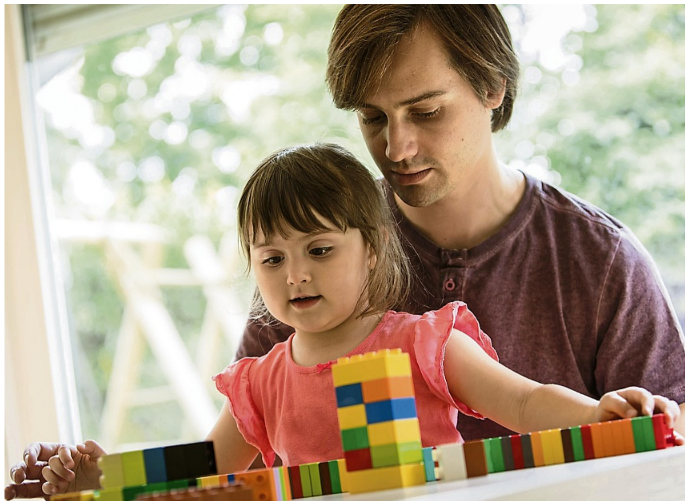
Weniger finanziell belastet: Wer als alleinerziehende Person alle rechtlichen und staatlichen Möglichkeiten ausschöpft, lebt unter Umständen entspannter.

Können Alleinerziehende aufgrund eines kranken Kindes nicht zur Arbeit gehen, haben sie grundsätzlich keinen