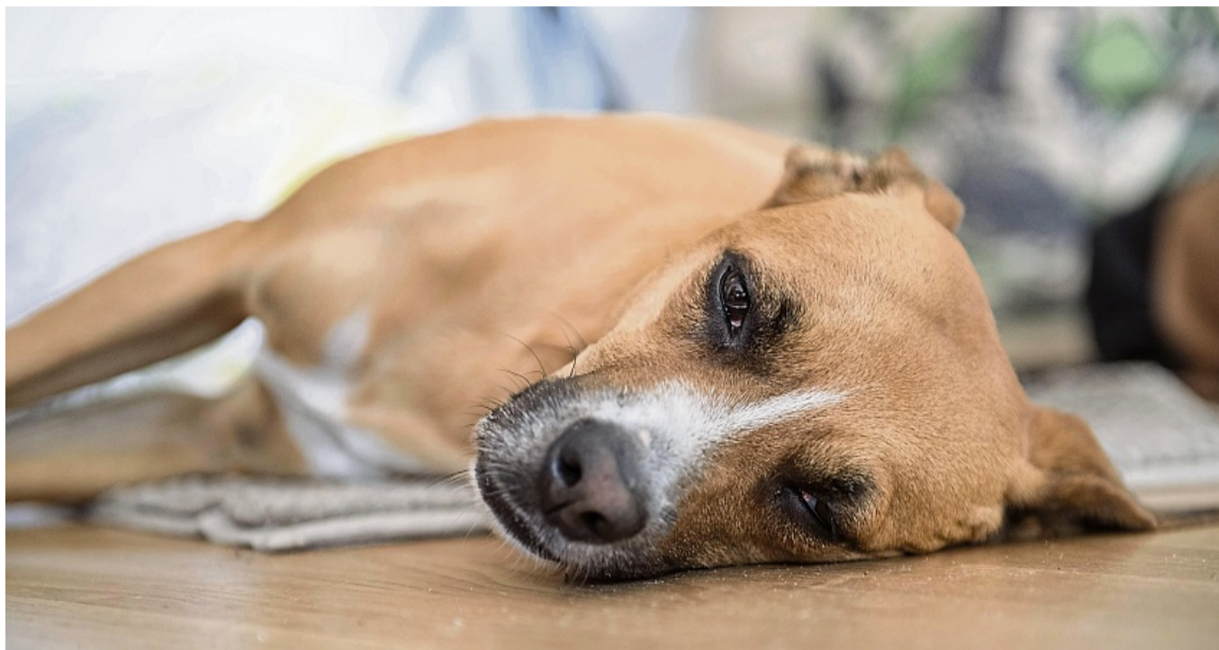
Anhand von Atmung, Puls, Schleimhäuten und der Temperatur lässt sich erkennen, wie es seinem Vierbeiner geht.

Ist der Hund bewusstlos? Wenn nein, reagiert er auf Ansprache oder schaut er teil-