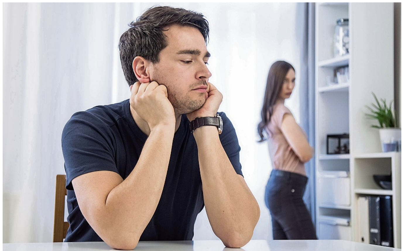
Wer sich mit einer Kränkung intensiv auseinandersetzt, gewinnt an innerer Stärke.

„Manchmal spüren wir sofort: Da ist wieder dieses alte Gefühl. Wir fühlen uns verletzt, nicht