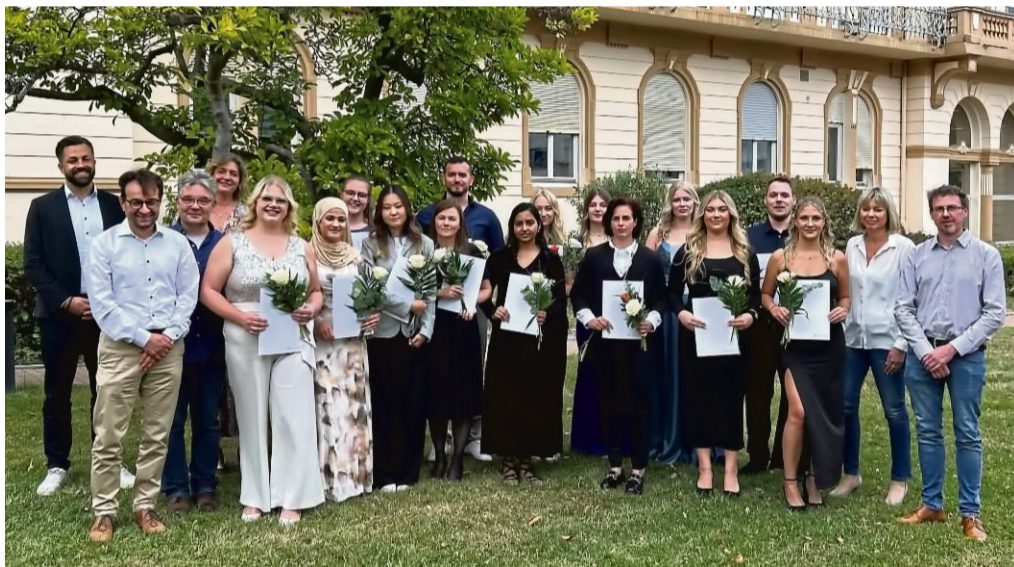
Nach ihrer erfolgreichen Ausbildung am Asklepios Bildungszentrum für Gesundheitsfachberufe Nordhessen starten die examinierten Pflegefachkräfte nun in das Berufsleben.

Bad Wildungen. Nach ihrer dreijährigen Ausbildung am Asklepios Bildungszentrum für Gesundheitsfachberufe Nordhessen konnten 15 Absolventinnen und Absolventen ihr Abschlusszeugnis in Empfang nehmen: Als examinierte Pflegefachkräfte starten sie nun in das Berufsleben.