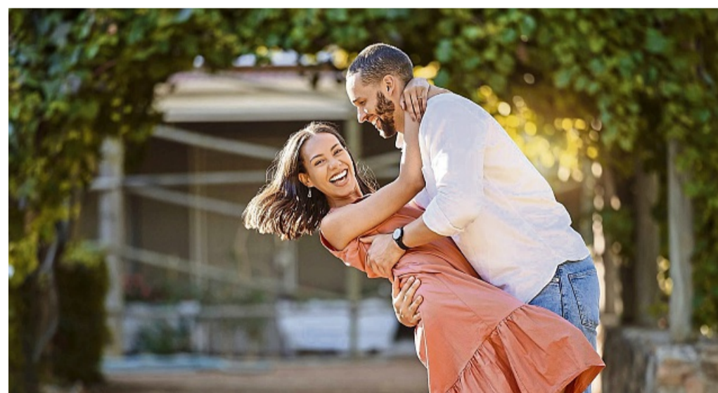
Neue Kontakte knüpfen und mit ein wenig Glück die Liebe finden: Eine Partnersuche mit der regionalen Online-Partnerbörse Partner.HNA.de könnte die Lösung sein.

Wenn Sie Kinder haben oder pflegebedürftige Angehörige auf Ihre Hilfe angewiesen sind, finden auch Sie sich vielleicht