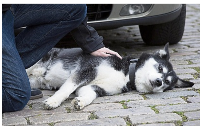
Wurde der Hund angefahren, gilt es Ruhe zu bewahren und den Tierarzt oder eine nahegelegene Tierklinik zu kontaktieren.

Anhand einfacher Parameter kann man erkennen, wie es seinem Vierbeiner geht. Die Stiftung Tierärztliche Hochschule Hannover erklärt, wie man die Vitalwerte beim Hund überprüfen kann: