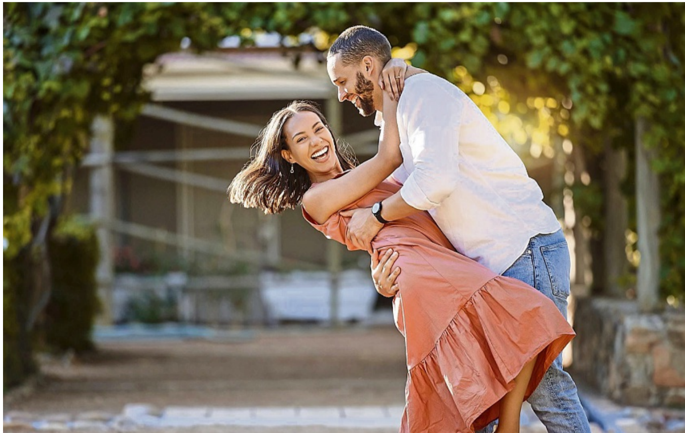
Neue Kontakte knüpfen und mit ein wenig Glück die Liebe finden: Eine Partnersuche mit der regionalen Online-Partnerbörse Partner.HNA.de könnte die Lösung sein.

Wenn Sie Kinder haben oder pflegebedürftige Angehörige auf Ihre Hilfe angewiesen sind, finden auch Sie sich vielleicht in dieser Gruppe Singles wie-