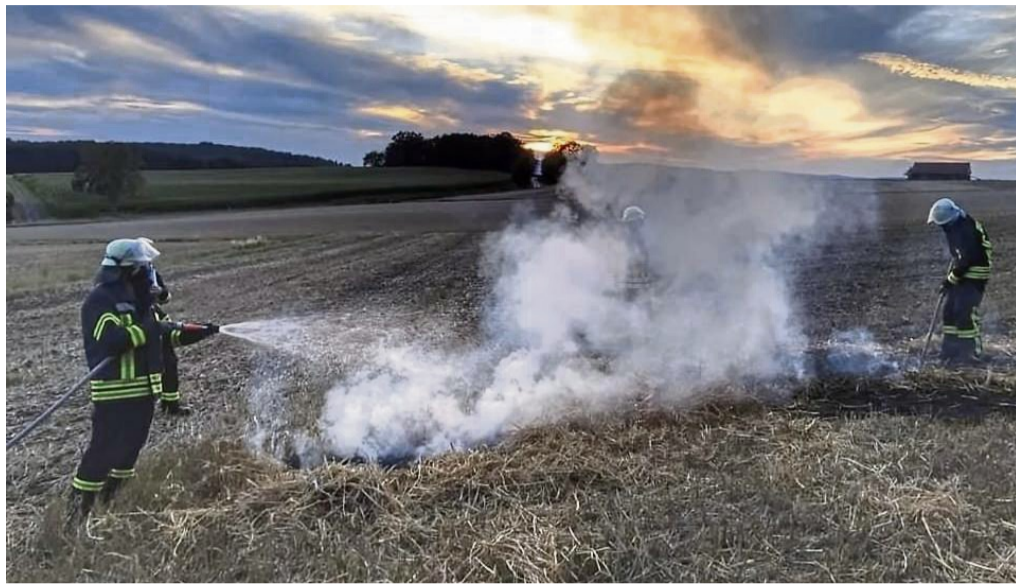
Im Sommer müssen sich Feuerwehrleute nicht nur gegen Einsatzgefahren wie Rauch und Feuer schützen. Auch Hitze stellt eine Gefahr dar. Darum nutzen viele Wehren mittlerweile leichte Schutzkleidung.

Um sich auf die veränderten Rahmenbedingungen einzustellen, denken viele Wehren im Landkreis um. Der Trend geht weg von der Einheitsschutzkleidung für alle Eventualitäten, hin zu mehreren Garnituren für verschiedene Zwecke. Ein Beispiel dafür ist die Interkommunale Kleiderkammer in Homberg. Dort wurde nach den Hitzesommern der jünge-