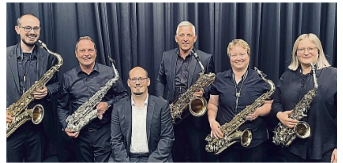
Saxophon-Ensemble Saxolution aus Brunslar

Melsungen – Das Saxophon-Ensemble Saxolution aus Brunslar lädt gemeinsam mit der katholischen Kirchengemeinde Melsungen für Sonntag, 7. September, 17 Uhr, zu einem Konzert in die Kirche Mariä Namen in Melsungen ein.