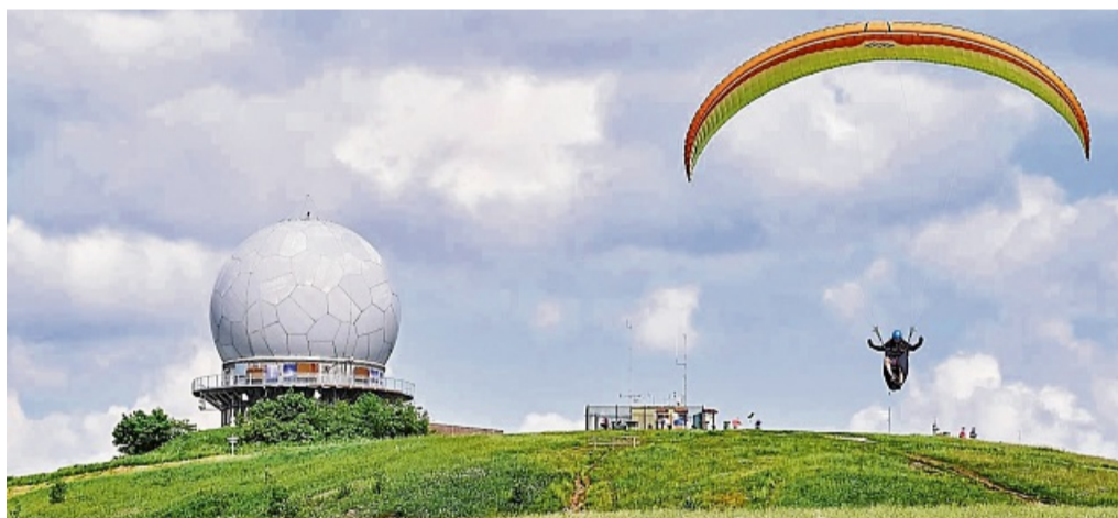
Körle / Gemeindefahrt für Senioren in die Rhön - Wasserkuppe

Anschließend besteht die Möglichkeit, zur Enzianhütte zu laufen, die Wasserkuppe zu besuchen – dazu gibt es einen Bus-Transfer – oder den Nach-