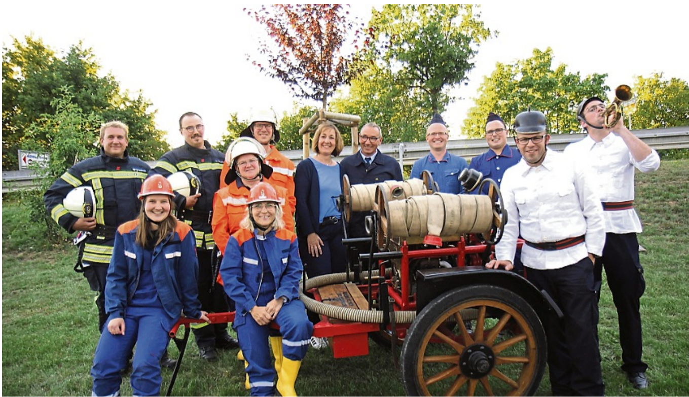
Sie machten Geschichte lebendig: Die Ostheimer stellen die Uniformen der vergangenen 100 Jahre vor.

Viel Applaus gab es am Ende von Ostheims Predigt. Sie verglich die Schaffung des ersten Ostheimer Feuerwehrmannes mit der Schöpfung durch Gott. Begleitet von einem Engel hat er am siebten Tag den Ostheimer Feuerwehrmann geschaffen. Damit habe er viel Arbeit gehabt, denn der Mann, den er aus der Rippe der Frau geschaffen habe, brauchte nicht nur ein großes Herz. Er musste auch pflegeleicht, einfühlsam, mutig, tatkräftig und hilfsbereit sein. All diese Attribute verkörperten auch heute noch die Feuerwehrleute. Ostheim sagte: „Die Leitsprüche der Feuerwehr, ‚Zu helfen in Not ist unser