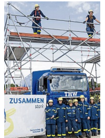
Stolz auf ihr Bauwerk: Die Einsatzkräfte nach erfolgreicher Arbeit.