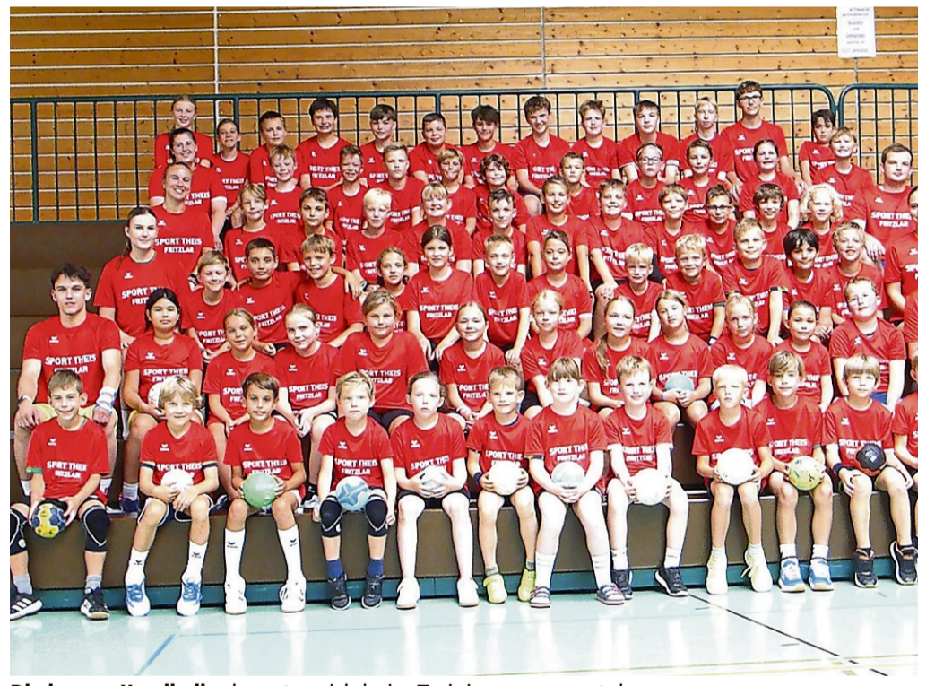
Die jungen Handballer konnten sich beim Trainingscamp austoben.

72 junge Sportler trainierten in den Sommerferien in Felsberg