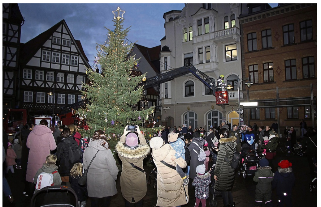
Festlicher Glanz auf dem Marktplatz: Auch für dieses Jahr wird ein Weihnachtsbaum gesucht. Das Foto zeigt das Schmücken im vergangenen Jahr.

Bürger können Vorschläge bis zum 30. September einreichen