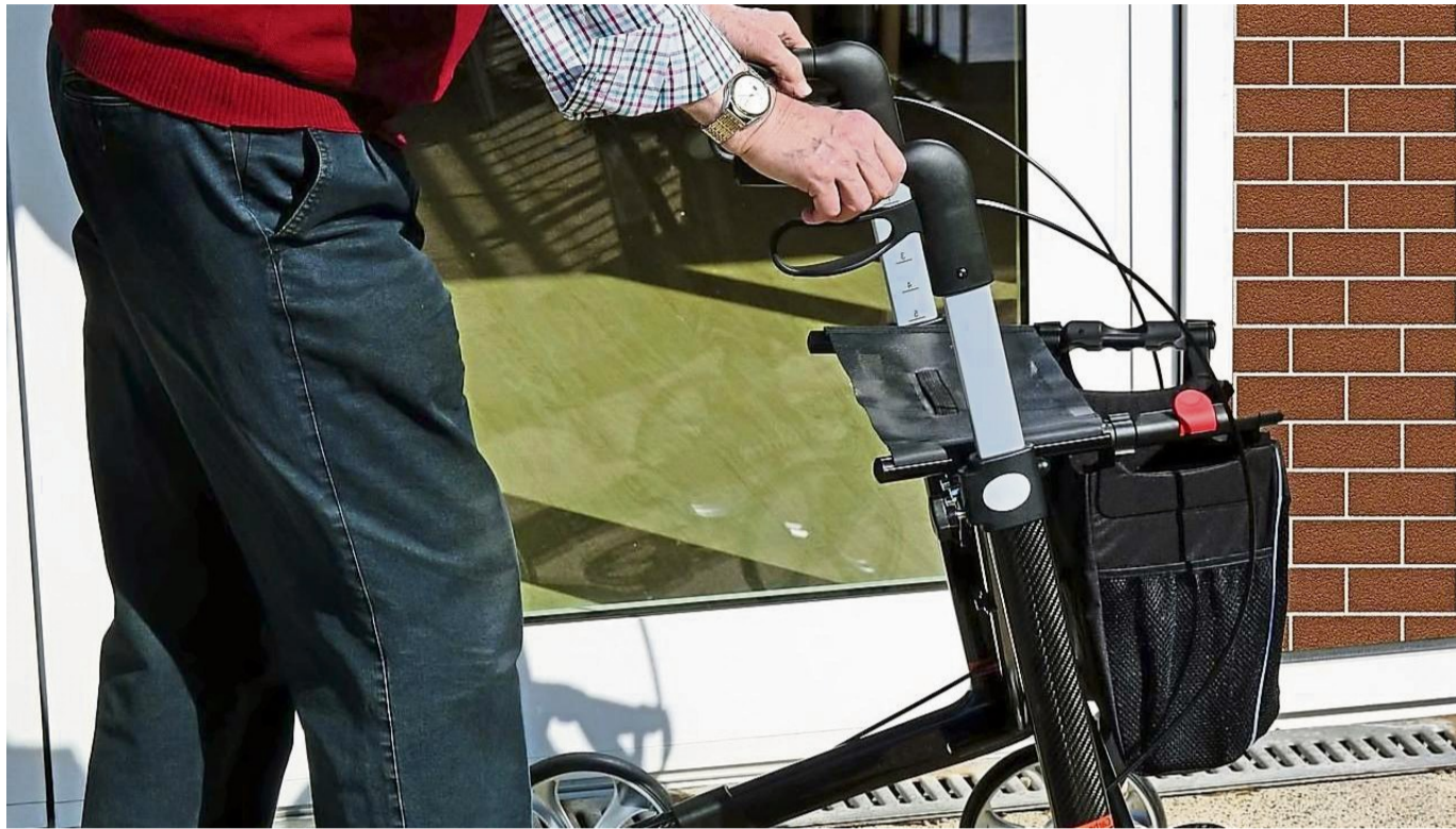
Ziel der Fortbildung ist sowohl ein sicherer Umgang mit dem Hilfsmittel, als auch die Förderung von Kraft und Beweglichkeit.

Laut Jaquet-Steinfeld gehe es dabei sowohl um den sicheren Umgang mit dem Hilfsmittel als auch um die Förderung von Beweglichkeit, Kraft und Balance. Ziel sei es, älteren Men-