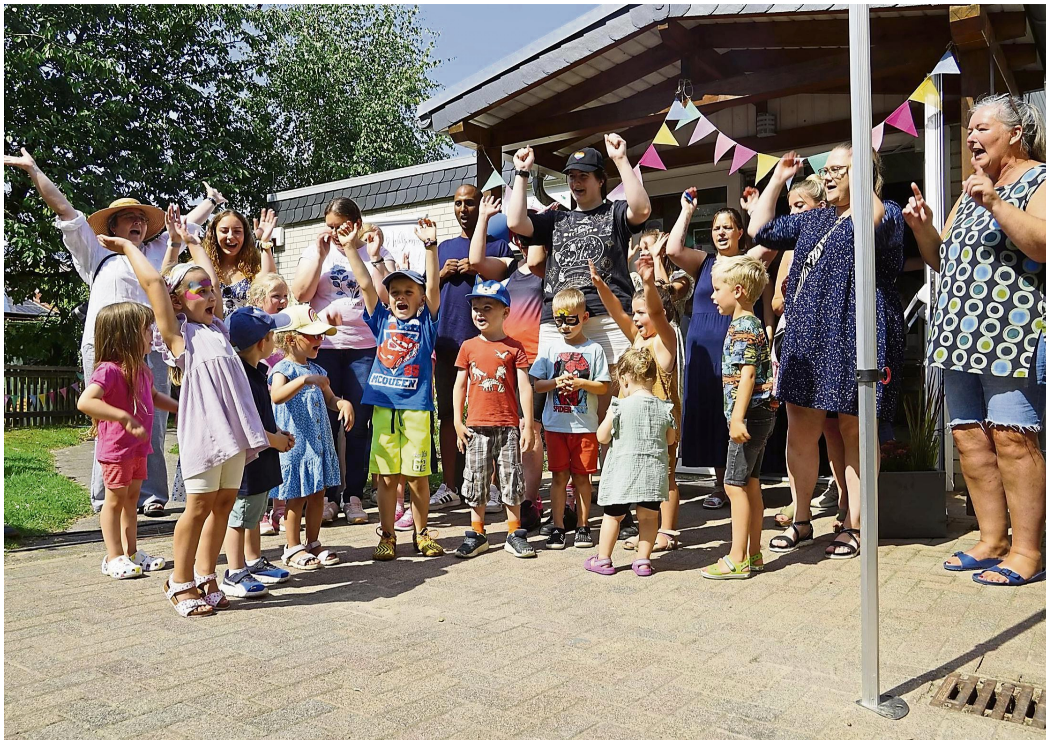
Mit einem Begrüßungslied eröffneten Kinder und Erzieherinnen das Sommerfest der Kita Landwehrhagen.

Kita Landwehrhagen feierte 50-jähriges Bestehen