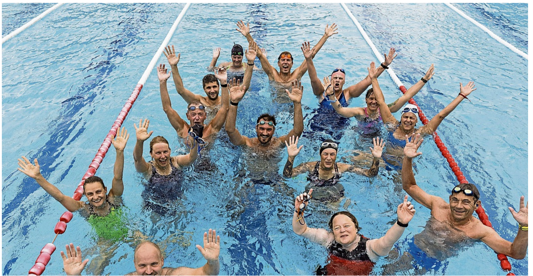
15 Teilnehmer schwammen gemeinsam 100 Minuten im Hann. Mündener Hochbad.

Dafür wurden verschiedene Gruppen mit jeweils unterschiedlichen Geschwindigkeiten gebildet, sodass jeder zusammen mit der eigenen Gruppe diese Herausforderung meistern konnte.