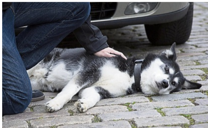
Wurde der Hund angefahren, gilt es Ruhe zu bewahren und den Tierarzt oder eine nahegelegene Tierklinik zu kontaktieren.

Anhand einfacher Parameter kann man erkennen, wie es seinem Vierbeiner geht. Die Stiftung Tierärztliche Hochschule Hannover erklärt, wie man die Vitalwerte beim Hund überprüfen kann: