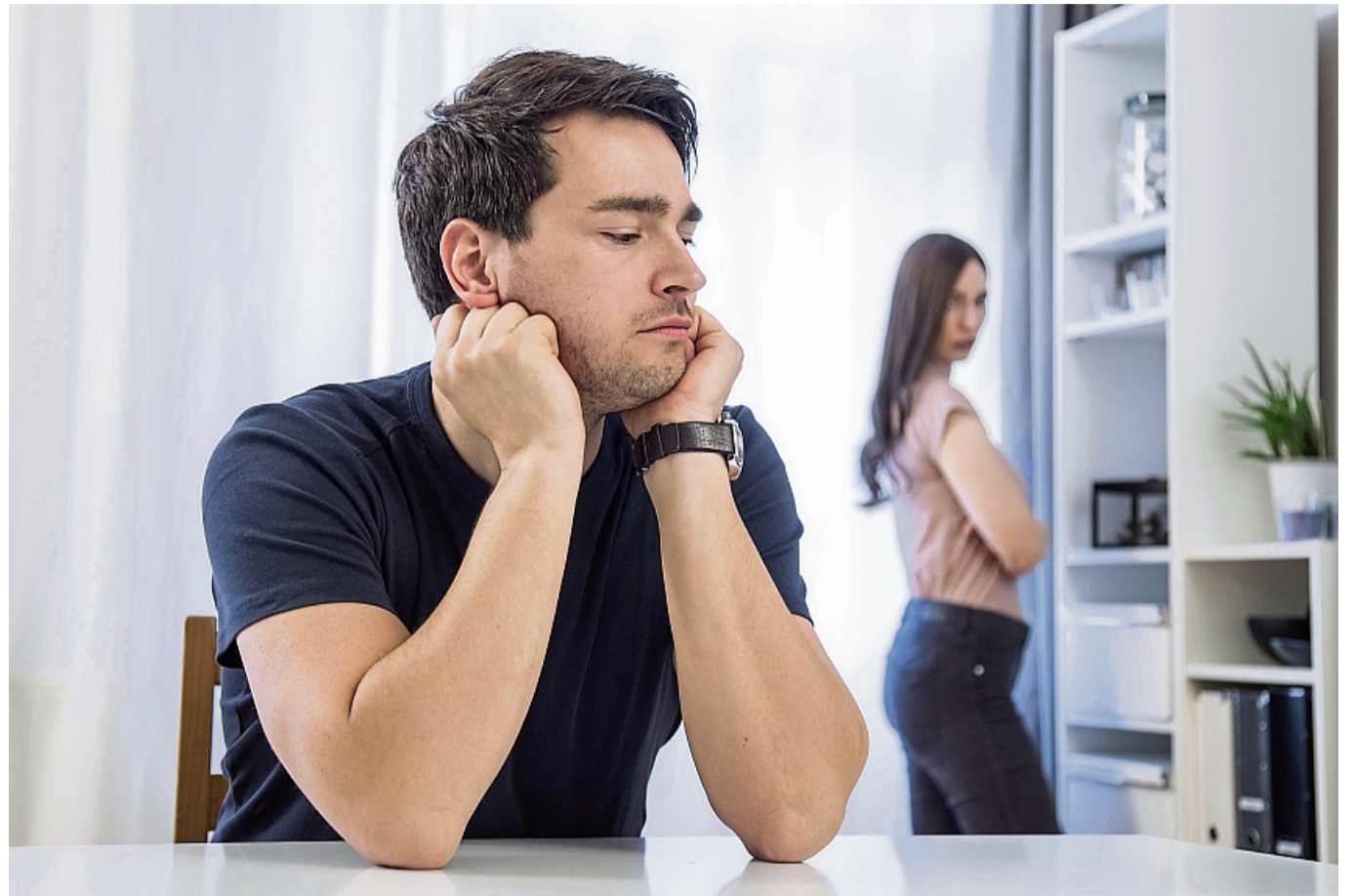
Wer sich mit einer Kränkung intensiv auseinandersetzt, gewinnt an innerer Stärke.

„Manchmal spüren wir sofort: Da ist wieder dieses alte Gefühl. Wir fühlen uns ver-