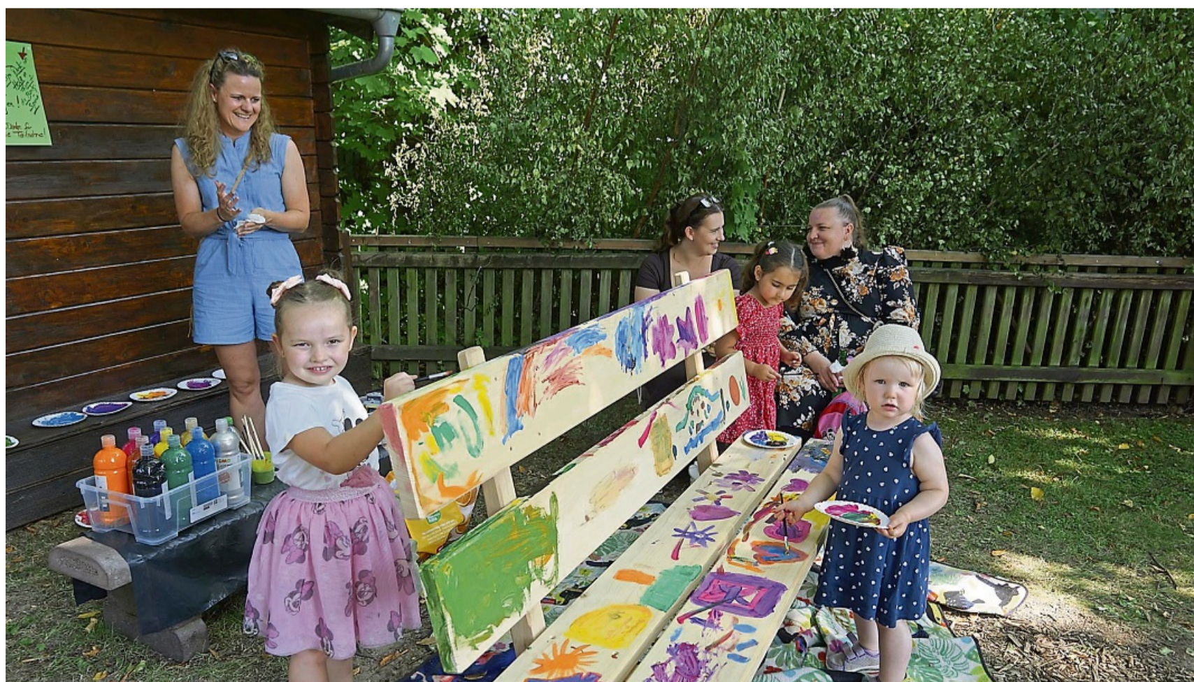
Bunte Erinnerungen: Auf einer gespendeten Gartenbank verewigten sich die Kinder mit ihren Kunstwerken.