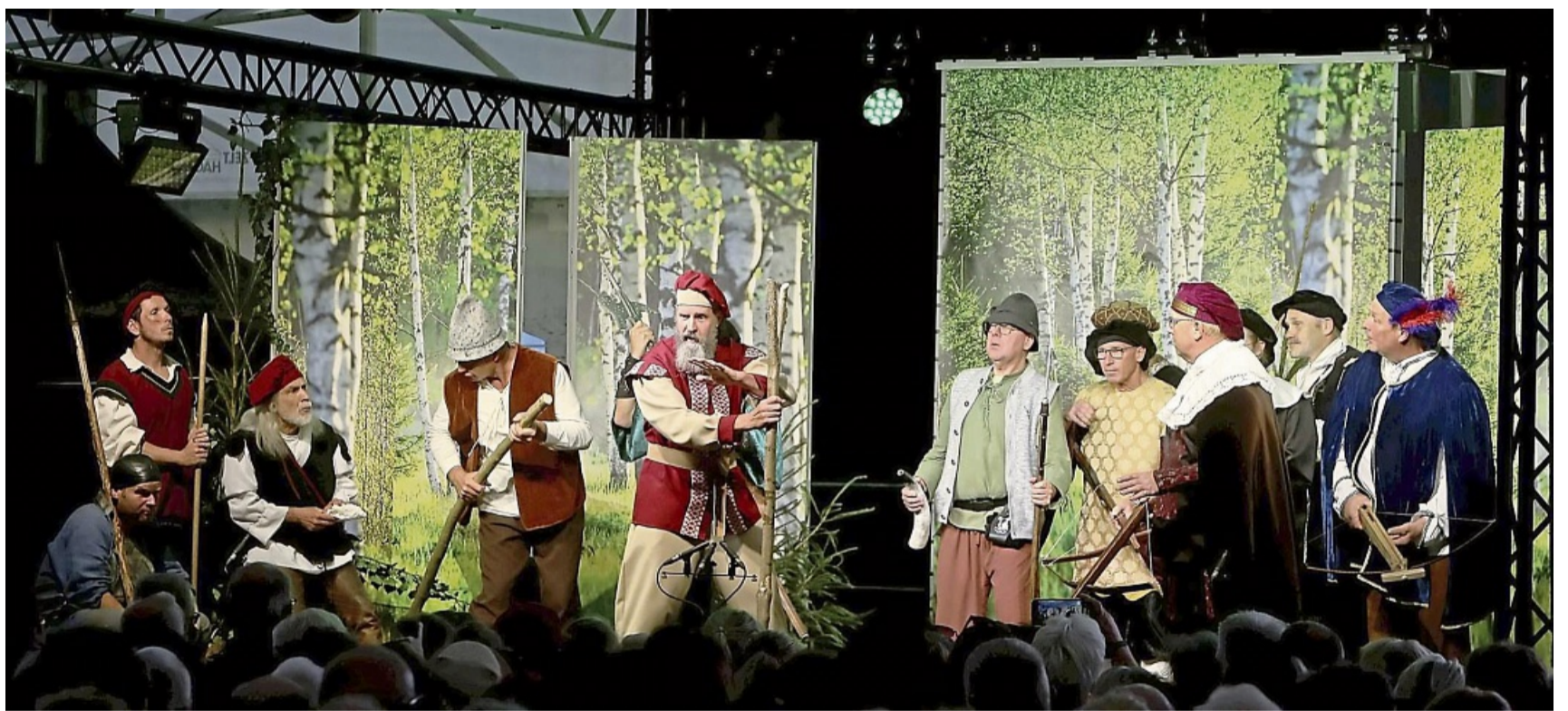
Mit der „Dransfelder Hasenjagd“ feierte die Dransfelder Laiengruppe am Montag eine umjubelte Premiere.

Der Inhalt des ausschließlich von Dransfelder Laienschau Spielern gespielten Theaterstückes ist schnell erzählt: Im ersten Akt erklären der Bürgermeister und drei Ratsherren den Dransfelder Bürgern ihre alten Rechte, die dann durch Herzog Wilhelm von Braunschweig bestätigt und um das Recht erweitert werden, in ihren Feldern und Wäldern Hasen zu jagen. Weil sie aber nicht wissen, wie ein Hase eigentlich aussieht, fangen sie einen Esel, den sie wegen seines „Gemelkes“ für die Mutter aller Hasen halten und dessen Milch sie als große Köstlichkeit empfinden, die sogar Kranken wieder auf die Beine hilft.