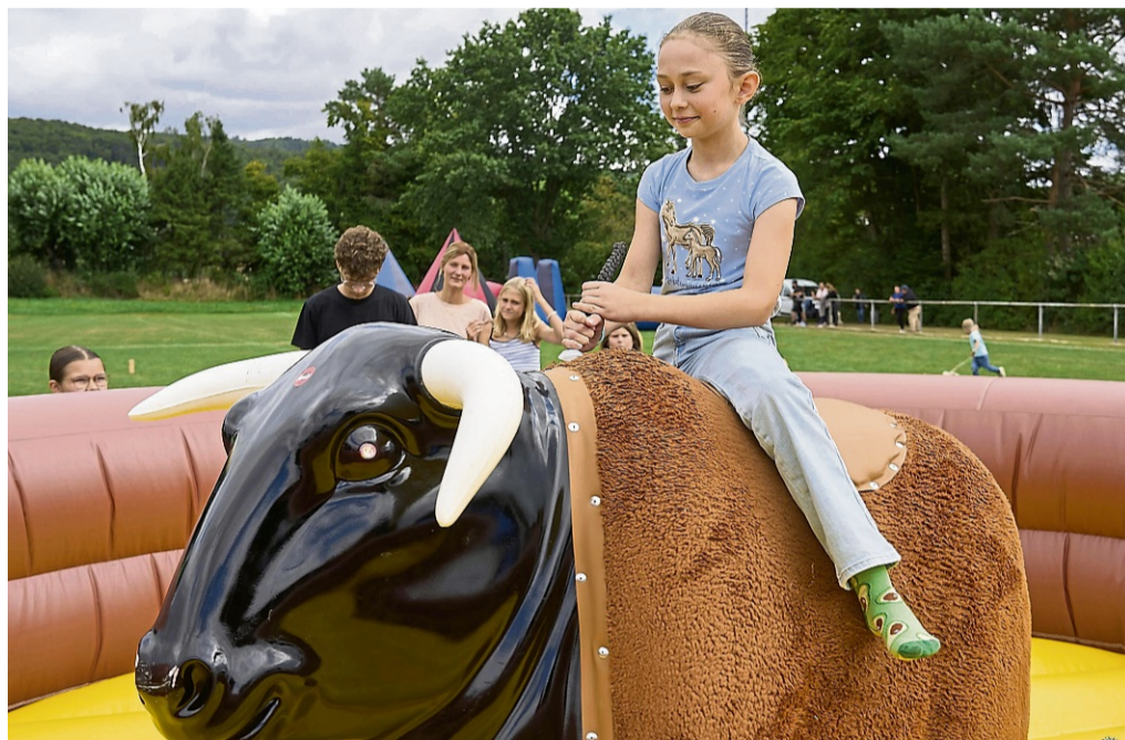
Ein wenig Mut gehörte schon dazu, beim Versuch, den elektrischen Bullen zu bezwingen.

vielleicht der Beginn einer neuen Tradition. Vieles deutet darauf hin, dass es vielleicht in zwei Jahren eine Neuauflage geben könnte. STEFAN BÖNNING