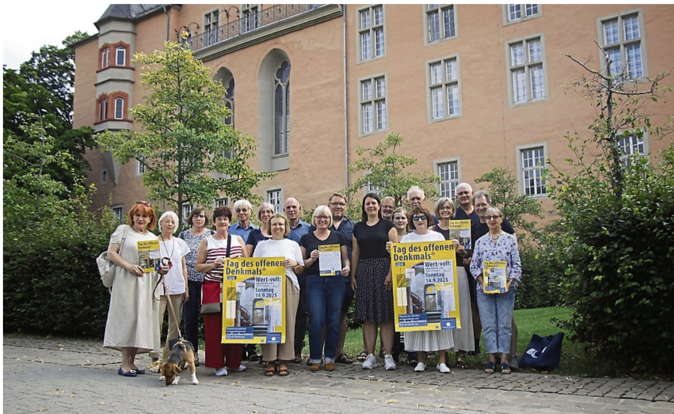
Freuen sich auf den Tag des Denkmals: Unser Bild zeigt die an der Programmgestaltung beteiligten Personen sowie Mitarbeiterinnen aus dem Bereich Stadtentwicklung.

Das klassizistische Lagerhaus an der Lohstraße, das noch in seinem Originalzustand erhalten ist, öffnet von 11 bis 17 Uhr sein Erdgeschoss für Besucher. Dieses wird laut Pressemitteilung zur Plattform für Vereine und Initiativen, die sich für die Altstadt und das Fachwerk engagieren. Dort gibt es ebenfalls Kaltgetränke, Kaffee und Kuchen.