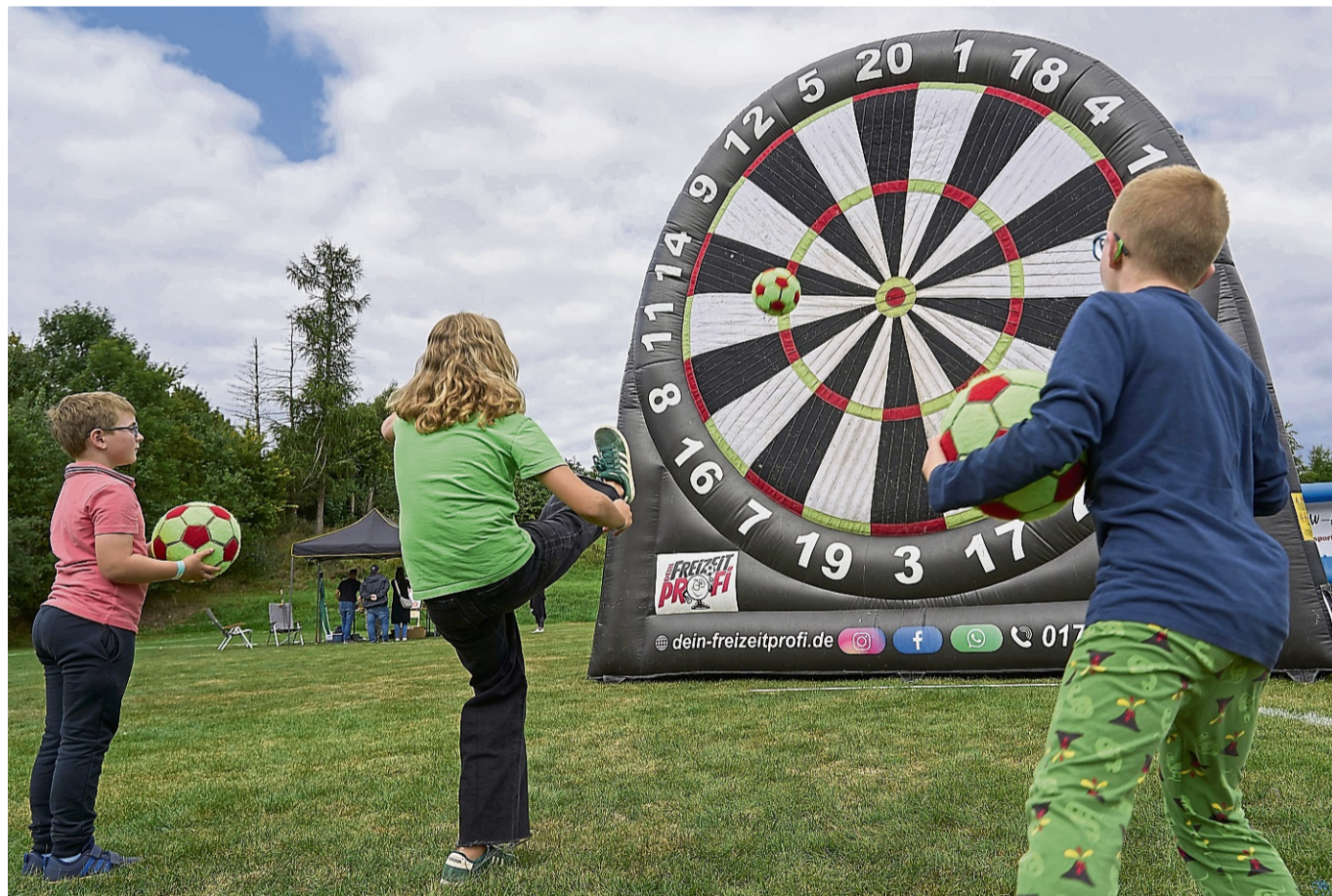
Eine riesige Fußball-Dart-Scheibe war eine der Attraktionen, an denen Kinder beim Erlebnistag in Scheden Spaß an Sport und Bewegung hatten.