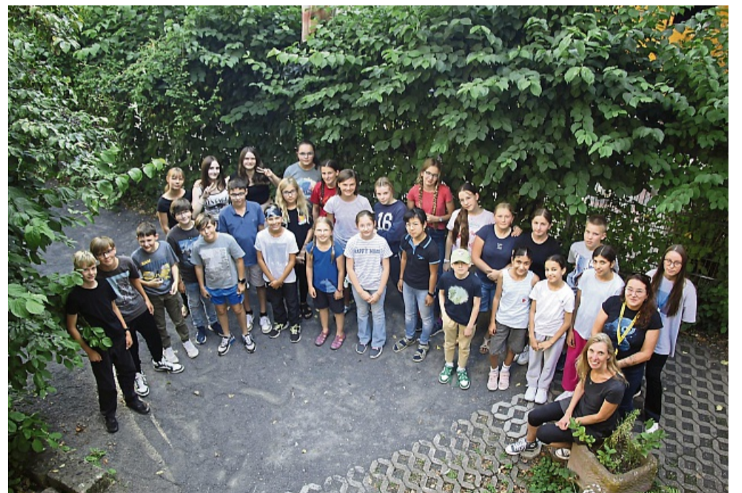
Julius Club in Hann. Münden endete mit insgesamt 285 gelesenen Büchern.

Über 40 Kinder besuchten in diesem Jahr den Julius-Club