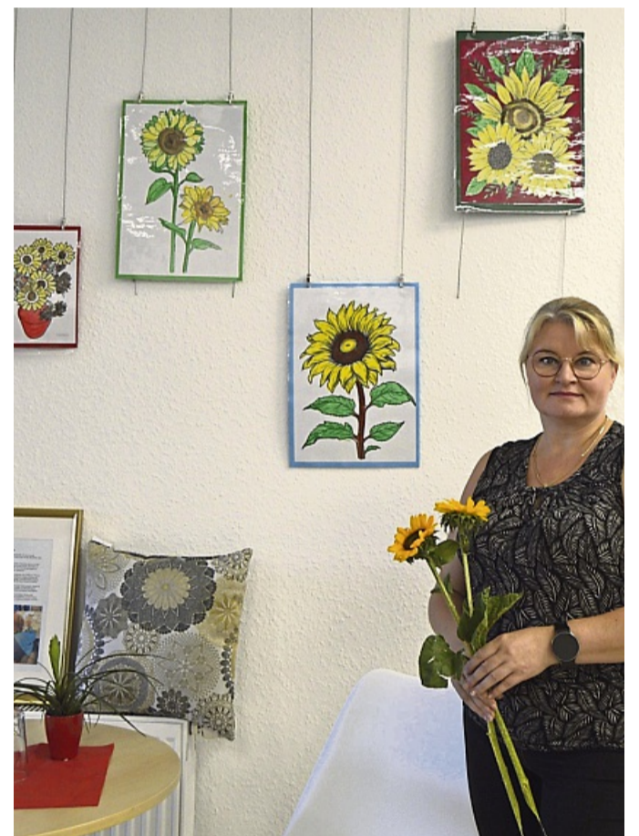
Zwischen echter Blüte und gemalter Farbe: Eine Mitarbeiterin des DRK-Seniorenzentrums vor den Sonnenblumenwerken der Bewohner.

Witzenhausen – Im DRK-Seniorenzentrum sind derzeit Bilder von Bewohnern zu sehen, die sich im Rahmen einer kreativen Malaktion mit Sonnenblumen beschäftigt haben. Anlass für das Projekt sei die spätsommerliche Blütenpracht gewesen, wie das Haus mitteilte. Nach Angaben des Seniorenzentrums spielt Malen für ältere Menschen eine weit größere Rolle als die reine künstlerische Betätigung. Es könne Lebensfreude vermitteln, innere Ruhe fördern und zugleich geistige Fähigkeiten anregen. Besonders im Umgang mit Demenz habe sich das kreative Gestalten als wertvoll erwiesen. Laut der Einrichtung ermögliche das Malen Betroffenen, Gefühle und Gedanken auszudrücken, die sich sprachlich oft nicht mehr mitteilen lassen. Farben und Formen eröffneten so eine alternative