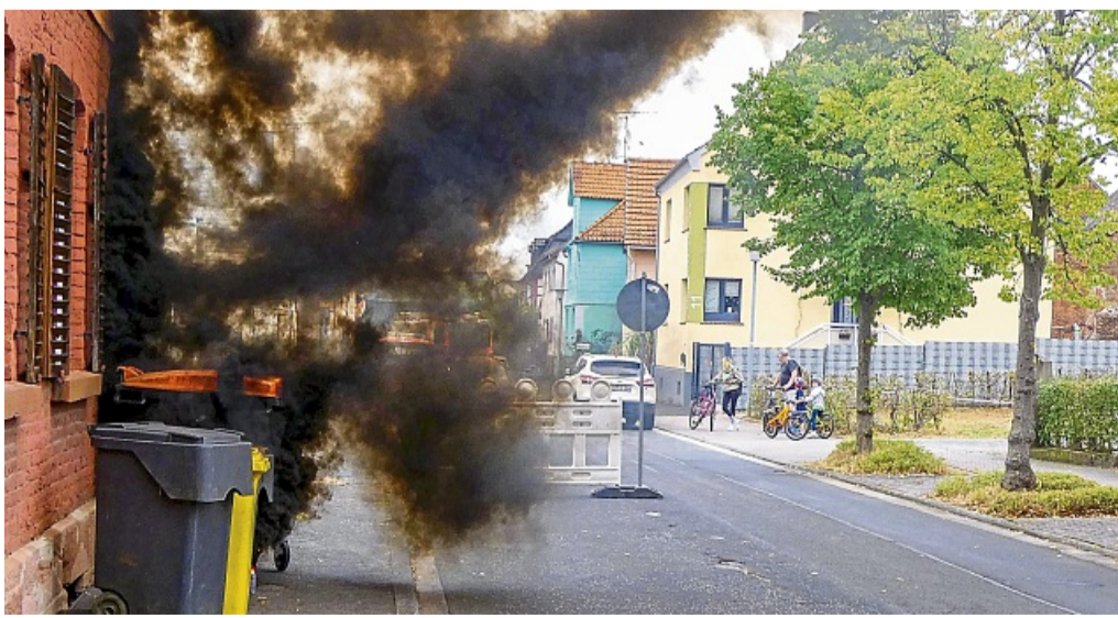
Dunkle Wolken stiegen während einer Übung bei einem gestellten Brand aus einer Mülltonne auf.