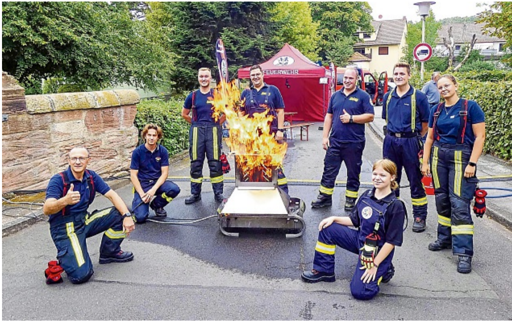
Einsatzkräfte der Freiwillige Feuerwehr Nentershausen löschten beim Blaulichtfest im Obersuhl fachgerecht Brände.