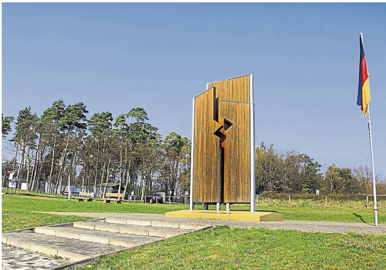
Kandidat erkrankt: In diesem Jahr findet keine Verleihung des Point-Alpha-Preises statt.

Da der Preis aber das Aushängeschild der Point Alpha Stiftung ist, wurde 2018 ein Grundsatzbeschluss gefasst, dass der Preis in jedem Jahr vergeben werden muss. Sollte das Kuratorium Deutsche Einheit nicht