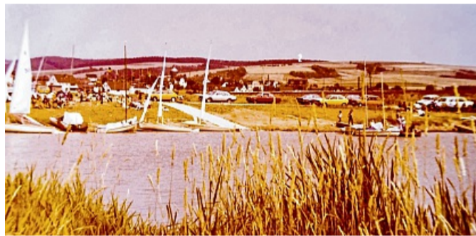
Gegründet wurde der Segelclub Bebra am 13. August 1975. Dieses Bild zeigt den Beginn einer Regatta aus dem Jahr 1980.