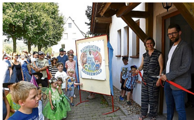
Der Rathauschef hat's geschafft: Das rote Band ist durchgeschnitten, der Weg zum „Anbau“ ist frei.

Mit dem Kita-Namen sind auch die Gruppennamen angepasst worden: Sie sind jetzt nach Eulen, Feuervögeln und demnächst nach Drachen benannt sowie bei der Krippe