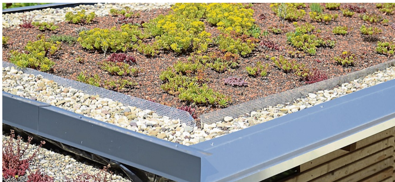
Aus dem Schutzdach wird ein Nutzdach: Mit einer Dachbegrünung oder Photovoltaik lässt sich mehr aus dem Oberstübchen machen.