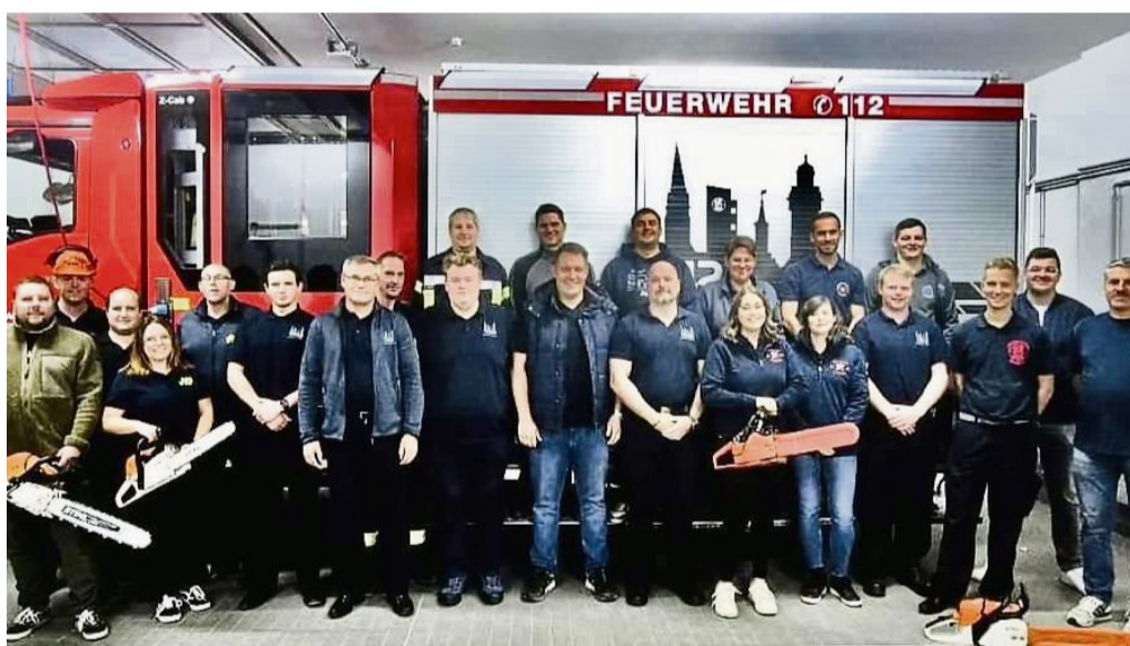
Einsatzkräfte der Feuerwehren der Großgemeinde Korbach lernten bei einem Lehrgang, was bei der Arbeit mit der Motorkettensäge zu beachten ist.

Die Motorkettensäge kommt nicht nur bei Windbruch nach Stürmen, sondern auch bei vielen anderen Einsatzlagen wie Verkehrsunfällen oder Bränden zum Einsatz, bei denen oftmals Rettungs- oder Angriffswege freigeschnitten werden müssen. „Der fachgerechte Umgang ist dabei nicht nur für die Einsatzkräfte selbst von Bedeutung, oftmals hängt auch das Leben von anderen davon ab“, heißt es in der Pressemitteilung. Die erlernten Kennt-