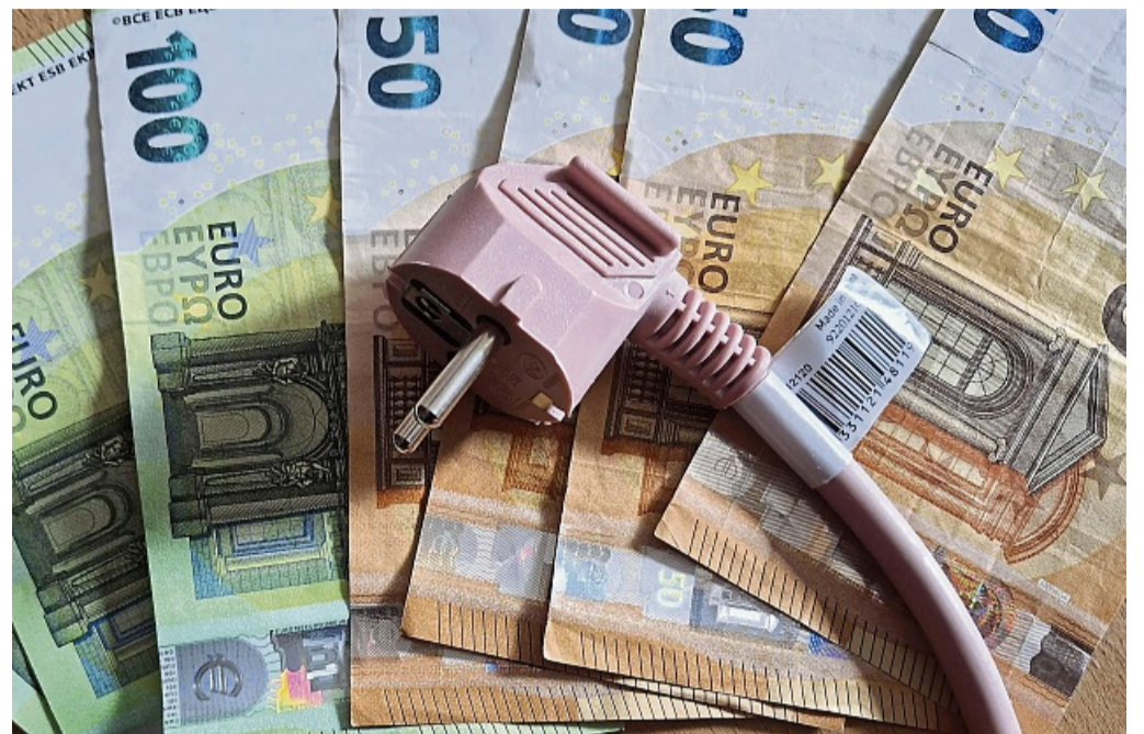
Energie und Geld sparen sollen Schulen – und dabei von einem Wettbewerb profitieren.