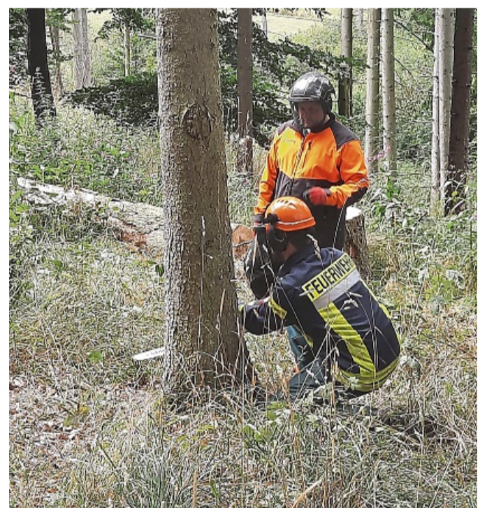
Einsatzkräfte der Feuerwehren der Großgemeinde Korbach lernten bei einem Lehrgang, was bei der Arbeit mit der Motorkettensäge zu beachten ist.

sen für die Lehrgangsbetreuung sowie den städtischen Betrieben für die Organisation der Schulung. red