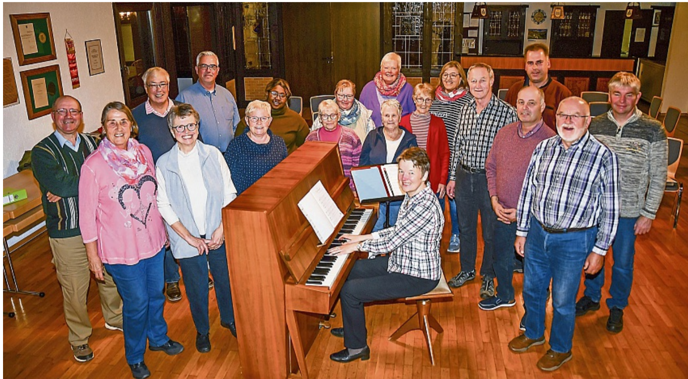
Der Gemischte Chor „Cantiamo“ Rhenegge will es Neueinsteigern mit einem Projektchor leicht machen.

Die gemeinsam einstudierten Stücke sollen bei der Feier am Sonntag, 2. November, aufgeführt werden. „Cantiamo“ lädt zu einem bunten Programm ins Dorfgemeinschaftshaus ein. Die Gäste erwartet um 17 Uhr ein abwechslungsreicher Nachmittag mit Liedern und weiteren Überraschungen. Der Verein bewirbt seine Gäste – Spenden sind dabei willkommen.