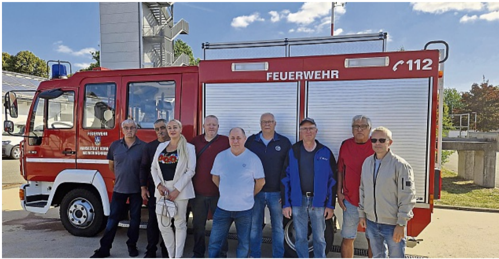
Eine Delegation aus der Ukraine hat das ausgerangierte Fahrzeug entgegengenommen.

„Humanitäre Hilfe Korbach“ investiert – Spendenaufruf