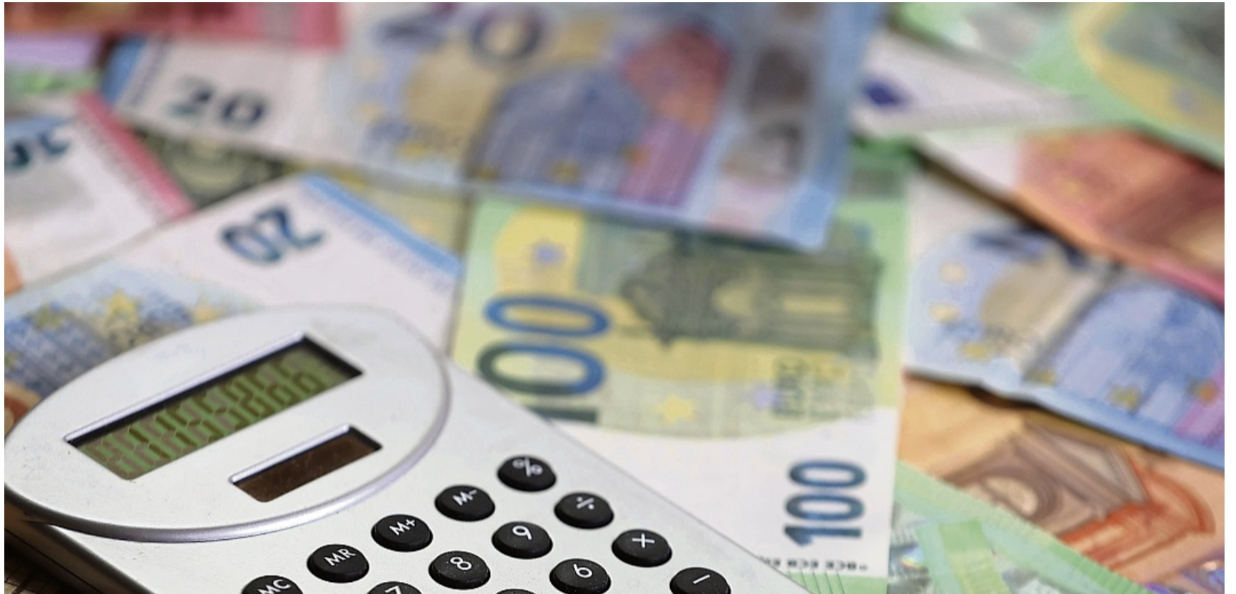
Genau gerechnet werden muss angesichts klammer kommunaler Haushalte.