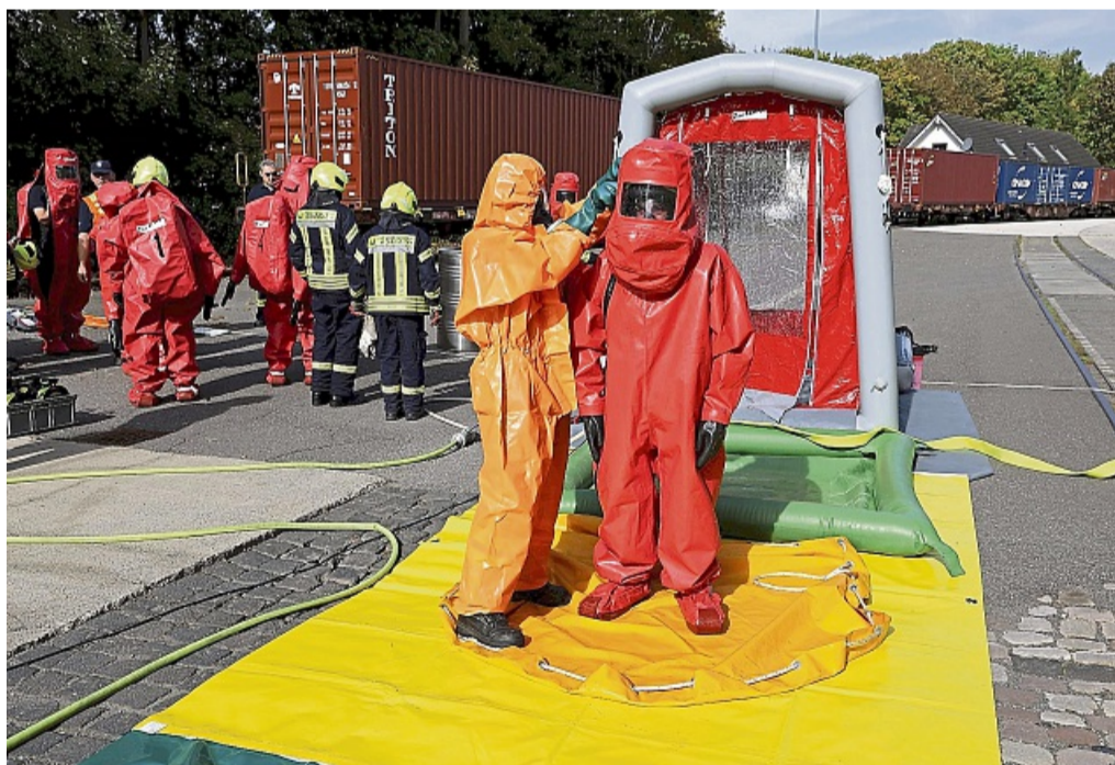
Die Feuerwehrleute müssen durch die Dekontaminationsschleuse.

Die Arbeit unter Vollschutz bedeutete eine erhebliche körperliche Belastung für die Feuerwehrleute. Daher kam der Überwachung und Dokumentation der Einsatzzeiten beson-