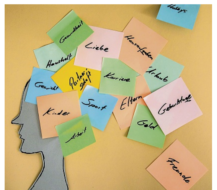
Mental Load sichtbar machen: Viele Familien erleben eine ungleiche Verteilung der unsichtbaren Sorgearbeit.