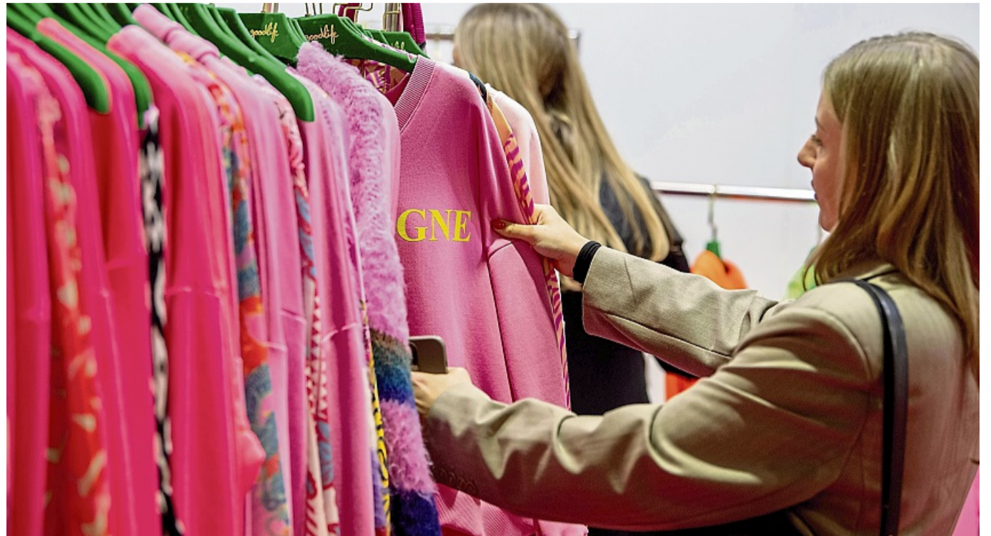
Wie finde ich meinen eigenen Mode-Stil? Mit diesen Tipps entwickelt man seine persönliche «Stil-DNA».

Insbesondere Social Media verstärkt den Druck, ständig neue Mode auszuprobieren. „Wir leben im Zeitalter der Mikro-Trends“, sagt Dangmann. „Kaum hat man einen ausprobiert, ist schon der nächste da.“ Wer jedoch seine eigene „Stil-DNA“ kenne, könne leichter entscheiden, ob ein Trendteil