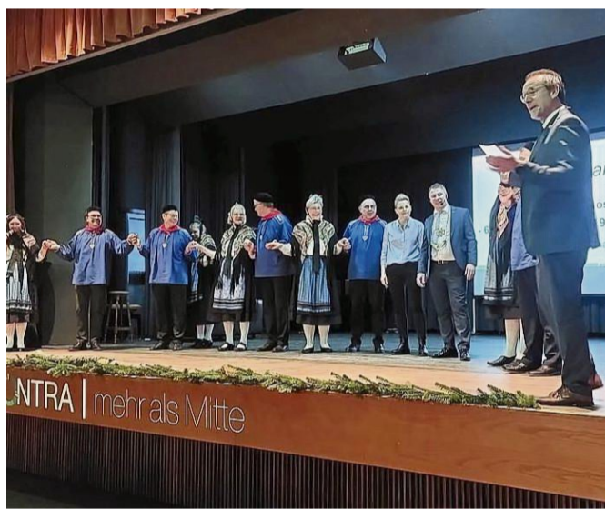
Wird 60 Jahre: die Volkstanzgruppe Hosbachtal feiert Jubiläum.

Seit ihrer Gründung steht die Volkstanzgruppe für die Pflege und Weitergabe regionaler Tanz- und Musikkultur und hat die Stadt Sontra und die Region auf vielen Feierlichkeiten und Veranstaltungen präsentiert. Mit viel Engagement und Leidenschaft setzen sich die Mitglieder seit sechs Jahrzehnten dafür ein, traditionelle Tänze