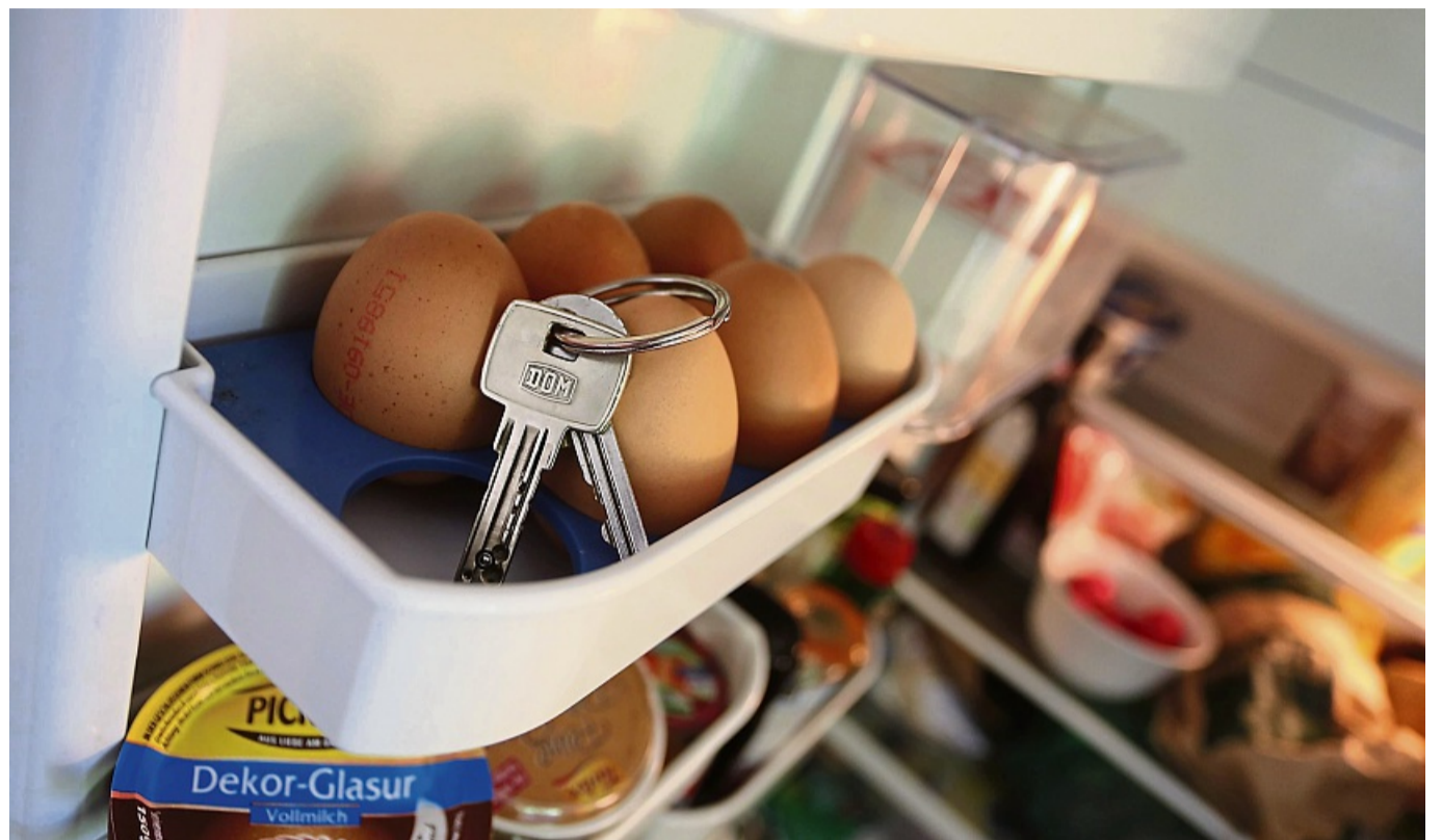
Wie kommt der Schlüsselbund ins Eierfach? Betroffene einer Demenz neigen dazu, Gegenstände an ungewöhnlichen Stellen zu verlegen – weil sie vergessen, wofür sie gut sind.

Die Demenz-Experten raten Betroffenen übrigens, ein Familienmitglied oder eine andere nahestehende Person zum