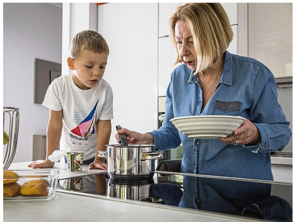
Oft haben Eltern im Alltag für gemeinsames Kochen weder Zeit noch Nerven – Oma schon.

Allerdings müsse der erste Besuch für gutes Gelingen entsprechend geplant sein. Dazu gehört, dass man mit den Eltern bespricht, worauf zu achten ist, etwa in Sachen Ernährung oder Gesundheit, welches Gute-Nacht-Ritual wichtig ist und was hilft, wenn das Kind traurig ist. Gerade wenn die