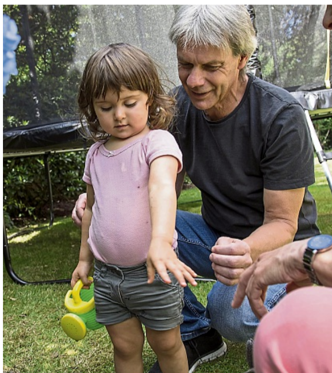
Großeltern haben oft mehr Zeit und nicht den Leistungsdruck, den Eltern oft empfinden. Sie können ihren Enkeln ungeteilte Aufmerksamkeit entgegenbringen.

Und wenn das Kind gerade mal keine Lust hat oder mit anderen Dingen beschäftigt ist? „Dann ruft man eben später noch mal an“, sagt Sperling und rät zu Flexibilität: „Großeltern sollten ohne Erwartungen den Kontakt suchen und nicht verlangen, dass man täglich oder zu bestimmten Zeitpunkten telefoniert.“