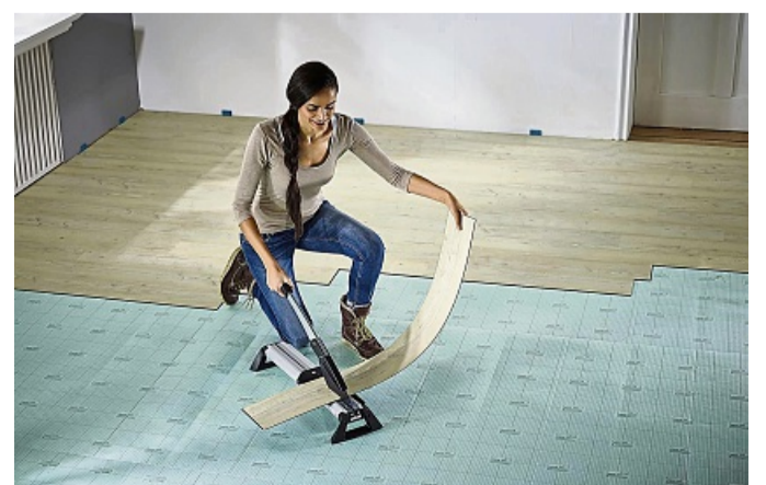
Nach der Trittschalldämmung kommt der Bodenbelag – wer ihn Zuhause selbst verlegen will, sollte vorgesehene Dehnungsfugen einplanen.