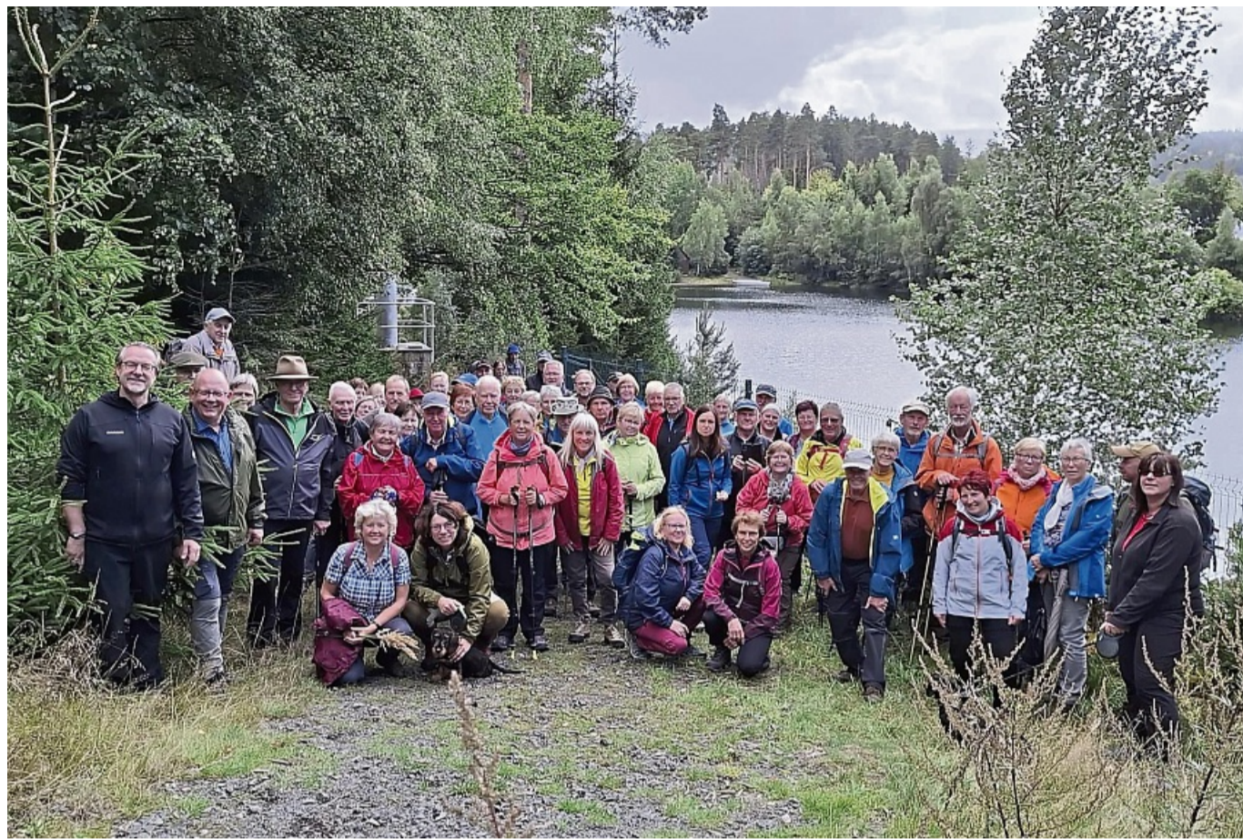
Hatten einen schönen Tag: Die große Wandergruppe anlässlich des Städtepartnerschaftstreffen in Tambach-Dietharz.