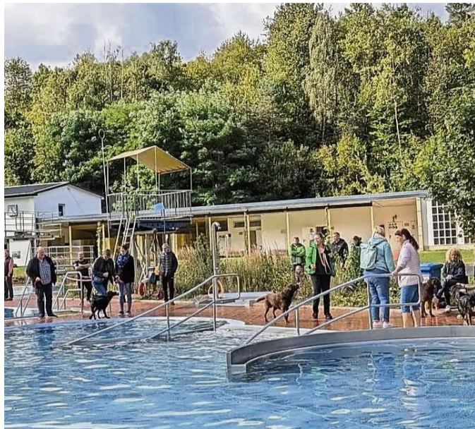
Das Hundeschwimmen im Freizeit- und Erlebnisbad Sontra findet immer sehr guten Zuspruch.

Sontra – Traditionell findet in diesem Jahr am Sonntag, 21. September von 10 Uhr bis 14 Uhr das Hundeschwimmen im Freizeit- und Erlebnisbad Sontra statt. Der Eintritt kostet ei-