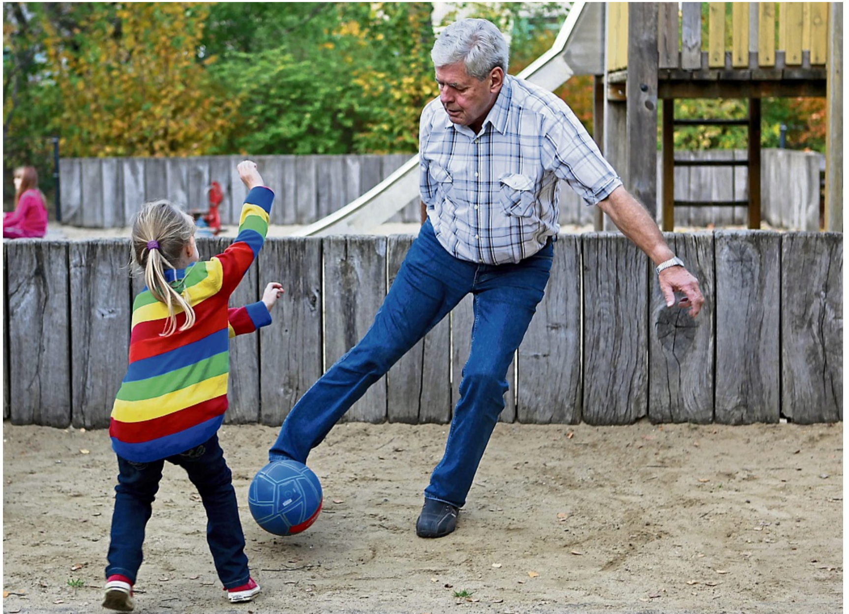
Ball statt Smartphone: Gerade mit Großeltern erleben Kinder aktive, handyfreie Zeiten.

Sperling empfiehlt Eltern, die Kinder auch unbeobachtet mit den Großeltern sprechen zu lassen – und gar nicht unbedingt immer in Form des klassischen Telefonats: „Man kann vorlesen, ein Spiel spielen, sich im Kinderzimmer etwas zeigen lassen.“