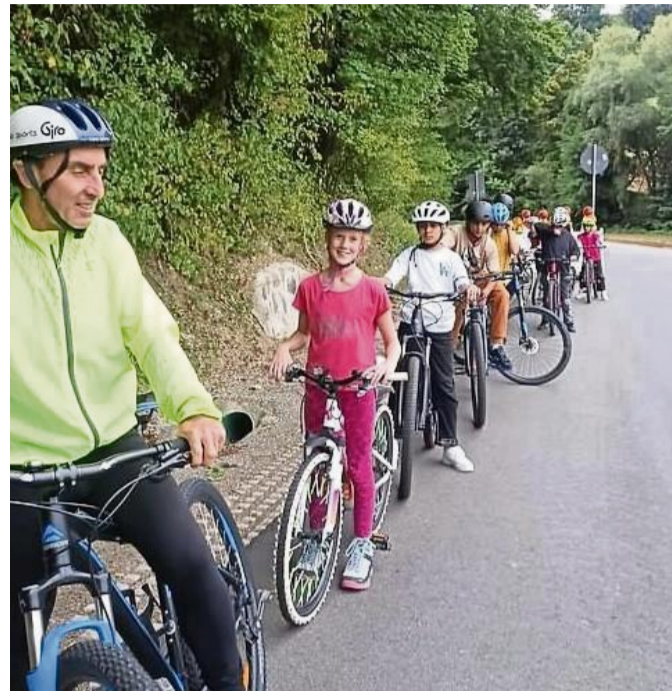
Radeln mit: Kinder der Ganztagsbetreuung der Adam-von-Trott-Schule mit dem Rad auf dem Weg nach Mitterode.

Da die Aktion bis zum 21.09.2025 läuft, ist es wichtig, dass alle Einträge bis zum 24.9.2025 in der STADTRADEL-App erfasst werden, um so frühzeitig die Gewinner*innen ermitteln und informieren zu können. Die Siegerehrung findet am Sonntag, 28.9.2025 um 16 Uhr auf der Pumptrack-Anlage statt.