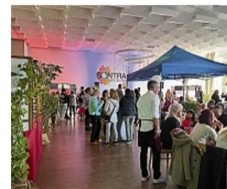
Die ASH lädt zum zweiten Weinfest ein.

Für das leibliche Wohl, musikalische Unterhaltung und viele Weine aus unterschiedlichen Anbaugebieten wird gesorgt. Eintritt frei.