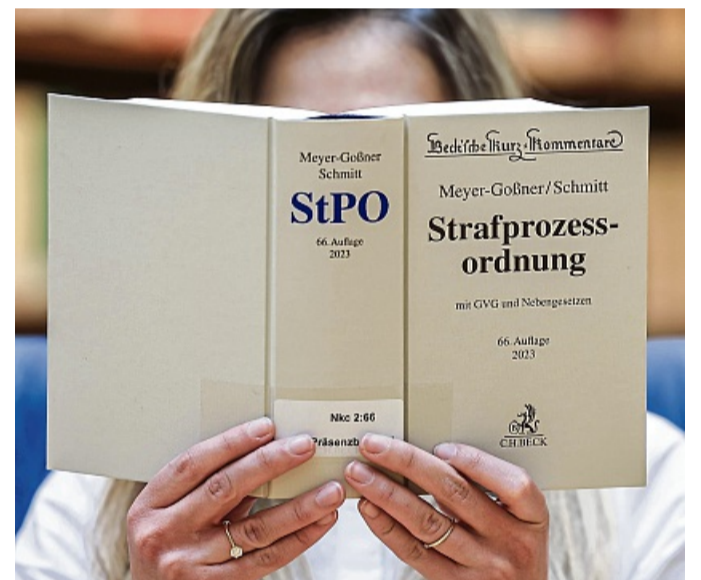
Gefunden - aber ist er oder sie auch für den jeweiligen Fall geeignet? Rechtsbeistände sollten im betreffenden Rechtsgebiet möglichst fachkundig sein.

„Bewertungen von Anwälten im Internet durch frühere Mandanten können erste Hinweise geben, ob die jeweilige Person für einen als Rechtsbeistand infrage kommen könnte“, sagt Görzel.