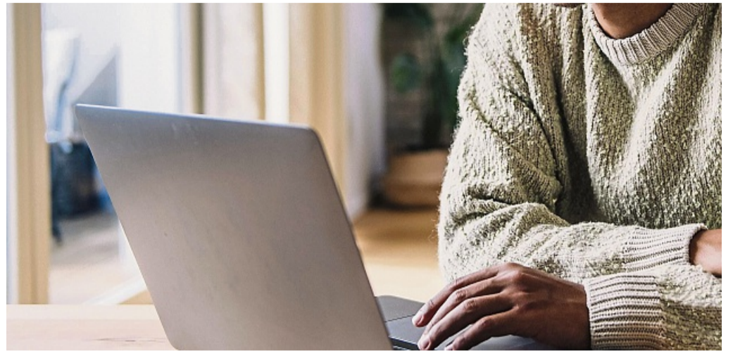
Doch umentschieden? Wer online einen Mobilfunkvertrag abgeschlossen hat, kann diesen innerhalb einer Frist widerrufen.

Nach einer nochmaligen Kontaktaufnahme wurde der Widerruf dann doch anerkannt. Und die Frau bekam ihr Geld wieder. Darum raten die Verbraucherschützer: Hartnäckig bleiben und nicht nachgeben, wenn man im Recht ist. dpa