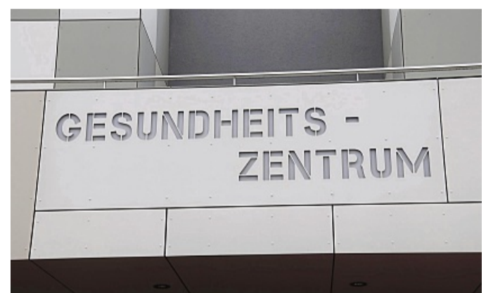
Gesundheitszentrum: Mit großen Lettern wird auf das neue Gebäude hingewiesen.

Die Stadt Frankenaue ist der Bauherr der Einrichtung, das ansässige Architekturbüro