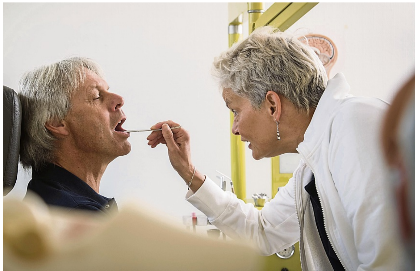
Was fehlt ihnen denn? Arbeitgeber haben zwar grundsätzlich keinen Anspruch auf Mitteilung von Diagnosen oder Symptomen, dürfen aber ohne Gründe die Vorlage eines ärztlichen Attests verlangen.

Seit dem 1. Januar 2023 übernehmen Arztpraxen die Arbeitsunfähigkeitsdaten elektronisch an die Krankenkassen. Die Arbeitgeberin muss die eAU eigeninitiativ abfragen, so