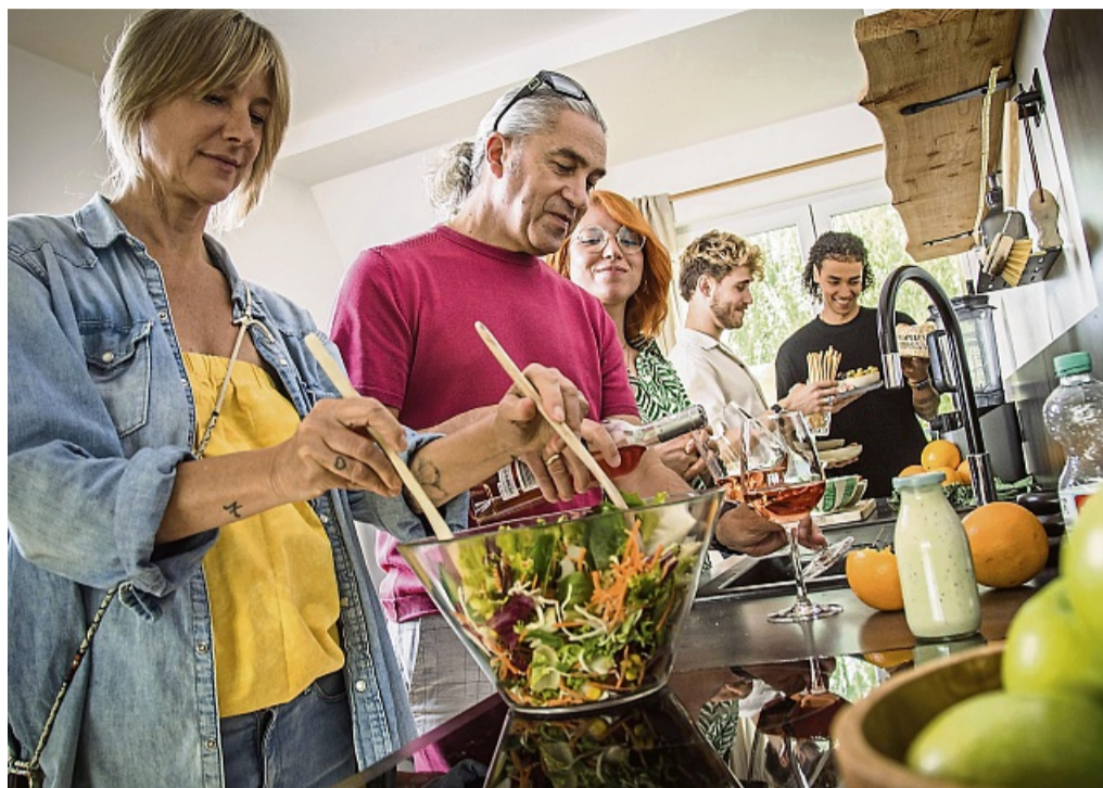
Was wollen wir kochen? Damit nicht immer wieder das gleiche Essen auf dem Tisch steht, ist gute Planung gefragt.

Schwengel-Exner: Man kann Dosenkichererbsen auch mit einer Mischung aus ein paar Tropfen geschmacksneutralem Rapsöl und einem schönen Gewürz, etwa Cayennepfeffer oder einem Bruschetta-Gewürz mit Tomaten- und Basilikumgeschmack und etwas Salz vermengt in den Backofen schieben. Da werden sie schön knusprig. Die Backzeit von 10 bis 20 Minuten nutzt man einfach, um in seinen Jogginganzug zu schlüpfen und es sich gemütlich fürs Sofa zu machen. Oder wie wär's mit einer schnellen Gemüsepfanne? Dazu eignet sich eine TK-Gemüsemischung, mit der man sich ruhig beim Wocheneinkauf bevorraten kann. Sie wird einfach mit etwas Öl in der Pfanne gebraten. Mit ein paar angebratenen