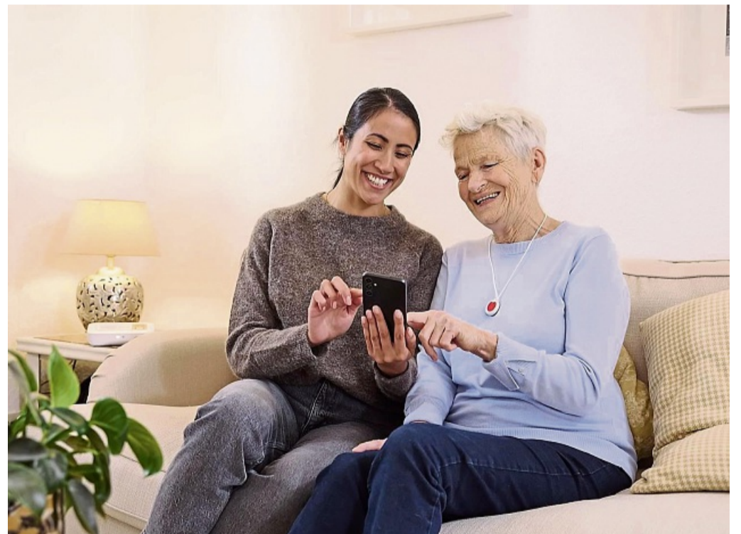
Mit dem Malteser Hausnotruf lässt sich bei Bedarf schnell und einfach Hilfe auf Knopfdruck anfordern. Das kleine, handliche Gerät kann wie eine Armbanduhr am Handgelenk getragen werden oder auf Wunsch auch als Halskette.

Mehr Informationen unter www.malteser.de/hausnotruf oder telefonisch unter 0800 99 66 028 (kostenfrei, Mo-Fr 8-20 Uhr). nh