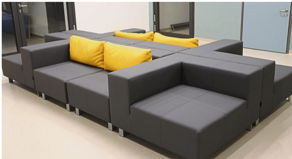
Warteraum: Die Warteflächen wurden modern eingerichtet.

angenommen.“ Der Baubeginn für das Gesundheitszentrum - nur einen kleinen Steinwurf entfernt vom Frankenaer Rathaus - war im Frühjahr 2023, wobei