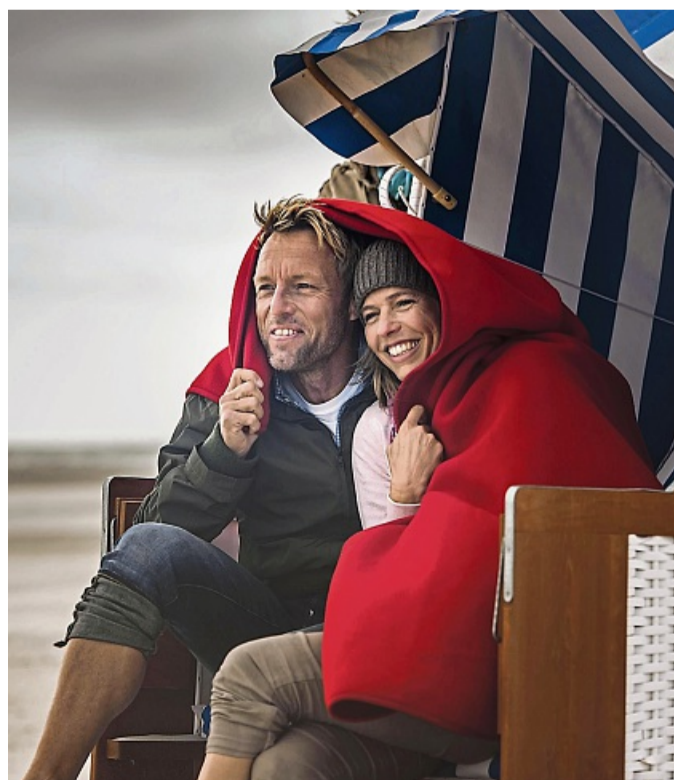
Es gibt im Herbst kein schlechtes Wetter auf Amrum, man muss nur einen schützenden Strandkorb gefunden haben.

flug auf den Knien. Die Wärme in der behaglichen Unterkunft nach langen Spaziergängen fühlt sich wohltuend an und verströmt Geborgenheit. djd