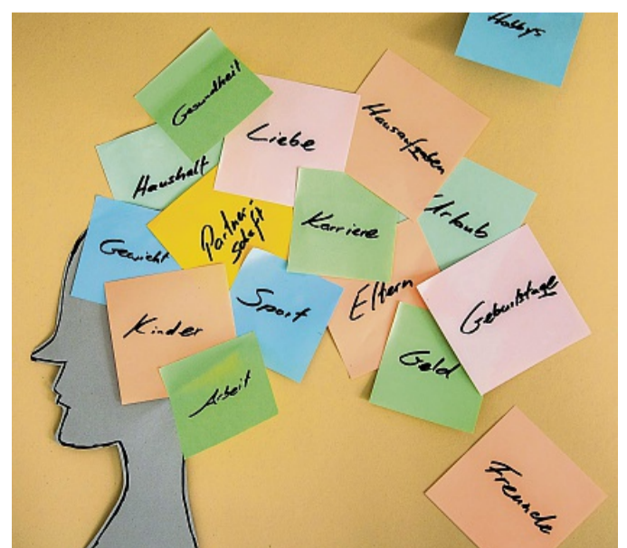
Mental Load sichtbar machen: Viele Familien erleben eine ungleiche Verteilung der unsichtbaren Sorgearbeit.