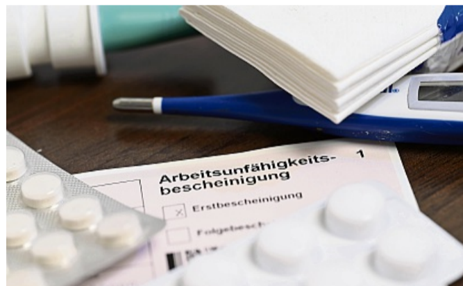
Schon ab dem ersten Krankheitstag eine AU-Bescheinigung? Das kann dann der Arbeitgeber fordern.

dass der Nachweis erst zeitlich später verfügbar ist. Zudem sieht die Arbeitgeberin in der eAU nicht mehr die Person des ausstellenden Arztes.