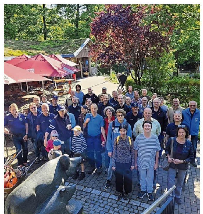
Trafen sich zum gemeinsamen Arbeiten: Der Lions Club Homberg und Mitglieder befreundeter Clubs setzen sich für den Wildpark ein.

Homberg – Der Lions Club Homberg hat sich wieder zu seinem alljährlichen Arbeitseinsatz im Wildpark Knüll getroffen. Unterstützung erhielten die Homberger von befreundeten Clubs aus Borken, Fritzlar und Melsungen. Auch das Wildpark-Team packte waren Schüler der Carl-Strehl-Schule aus Marburg, einem Gymnasium für sehbehinderte Kinder, dabei. Sie tauschten