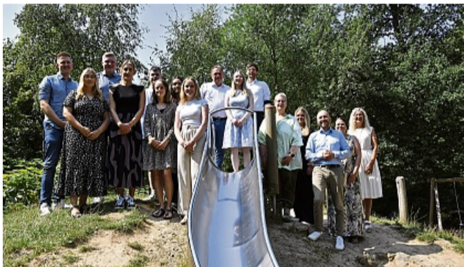
15 junge Menschen haben ihre Ausbildung, ihr Studium oder eine Fortbildung bei der Kreisverwaltung Schwalm-Eder erfolgreich abgeschlossen.

Nun gibt es die Chance auf Übernahme in der Kreisverwaltung Schwalm-Eder