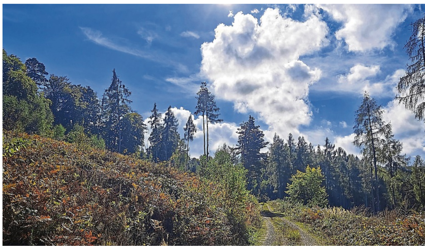
Die Natur rund um Morschen genießen: Die unterschiedlichen Strecken des Wanderevents Mörscher Sieben bieten den Teilnehmern herrliche Ausblicke.

„Die Verpflegung wird dieses Mal sehr viel regionaler gestaltet“, sagt Maaßen. In der Umfrage nach der ersten Auflage 2024 sei auch das ein Wunsch der Teilnehmer gewesen, ergänzt Konheiser. Deshalb habe man einen lokalen Caterer für das Mittagessen in Konnefeld ins Boot geholt, die Ahle Wurst fürs Frühstück in Heina kommt vom Hof Beinhauer in Altmorschen, die Brötchen aus Heinebach, die gekochten