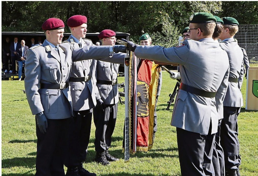
Stellvertretend für die anderen Soldaten legt die Rekrutenabordnung beim Gelöbnis die Hand auf die Truppenfahne.

Bei der Begrüßung der Familienangehörigen und Gäste be-