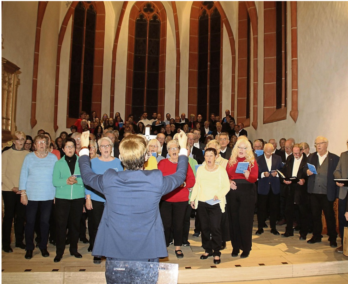
Mit Sang und Klang lautete das Motto des Chorkonzertes 100 Jahre Sängerkreis Heiligenberg in der Melsunger Stadtkirche. Unser Bild zeigt nur einen Teil des großen Abschluss-Gemeinschaftschores.

„Schmetterling“ der Wollröder fügte hinzu: „We are the Sound-Kids. Auch Anlass für Rohdes Appell: „Bewahrt die Welt für unsere Kinder.“ Und der Gemischte Chor Wollrode