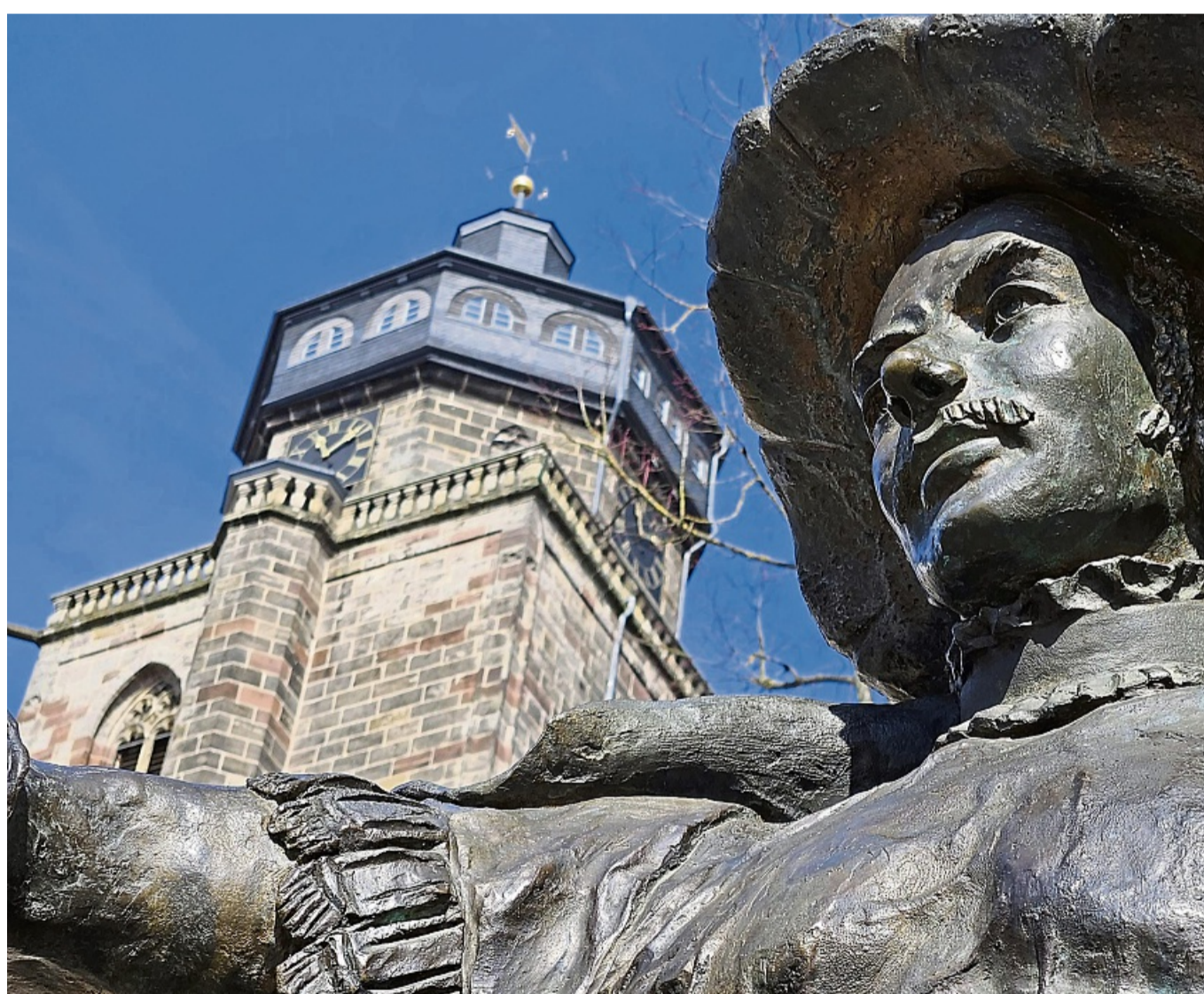
Das Reformationsjubiläum steht 2026 an: Im kommenden Jahr feiert Homberg die Tatsache, dass Landgraf Philipp der Großmütige 1526 die Synode nach Homberg holte und die Reformation auf den Weg brachte.

Am Sonntag, 26. Oktober, stehen die Kirchenvorstandswahlen an. Über 1000 Kandidaten haben sich als Ehrenamtliche aufstellen lassen. Damit setzt sich die Kreissynode als Entscheidungsorgan des Kirchenkreises ab dem nächsten Jahr mit den neu Gewählten neu zu-