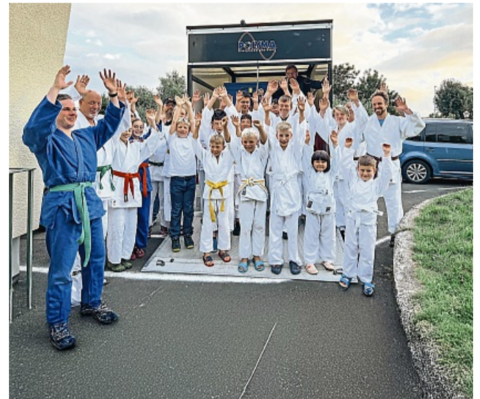
Spendenübergabe der Firma Polyma Energiesysteme GmbH an den Judo-Club Fritzlar.

Firma Polyma schafft Trainingsmöglichkeiten