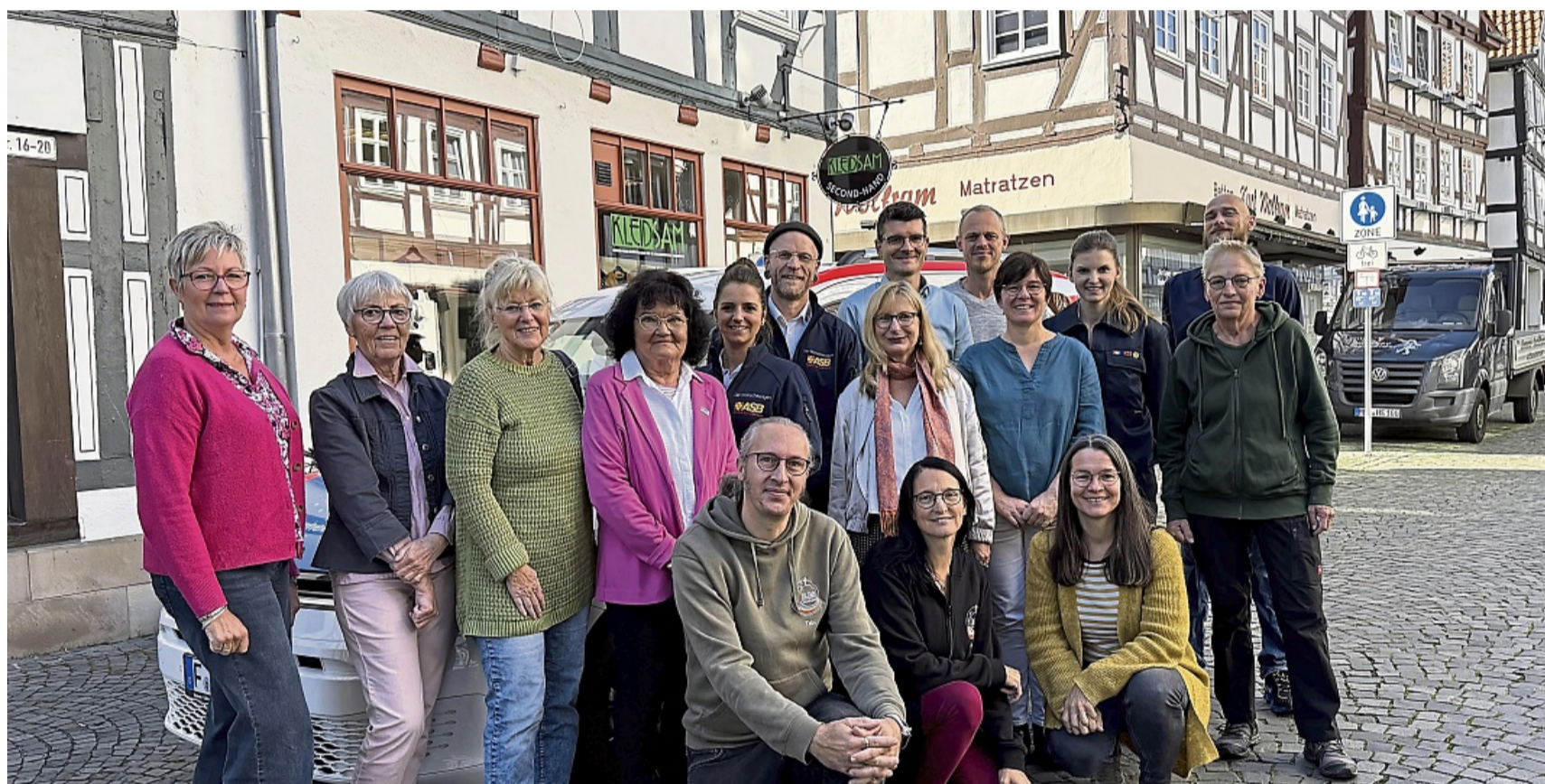
Sie freuen sich, gemeinsam etwas für den guten Zweck zu tun: Die Spendeneempfänger und das Kleidsam-Team haben sich am Wünschewagen zusammengefunden.

Melsungen – Dicht gedrängt stehen die Vertreter von zwölf Organisationen und Projekten im Kleidsam, dem gemütlichen Second-Hand-Laden in der Melsunger Innenstadt, um eine Spende entgegenzunehmen.