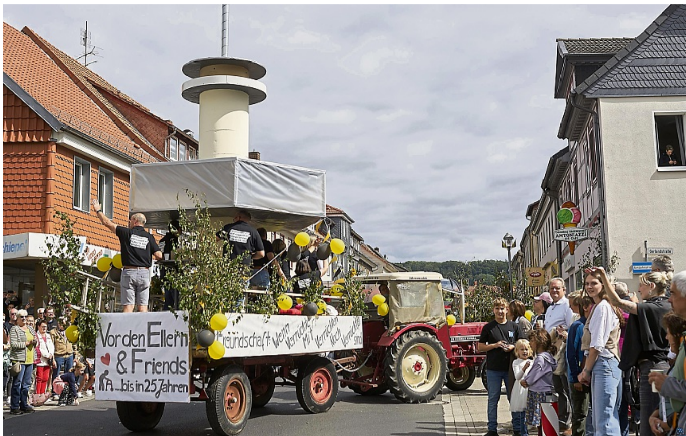
Ob zu Fuß oder auf dem Wagen: 40 Gruppen zogen beim Festumzug durch die Straßen Dransfelds.

Mit einem weiteren Höhepunkt ging es direkt am Sonntag weiter: Der große Festumzug. Insgesamt 40 Fußgruppen und Wagen zeigten die Verbundenheit zum Ort und zogen durch die Straßen von Dransfeld. Die Vielfalt der Vereine und Organisationen wurde zusätzlich von befreundeten Vereinen sowie Musikzügen aus Südniedersachsen und Nordhessen unterstützt.