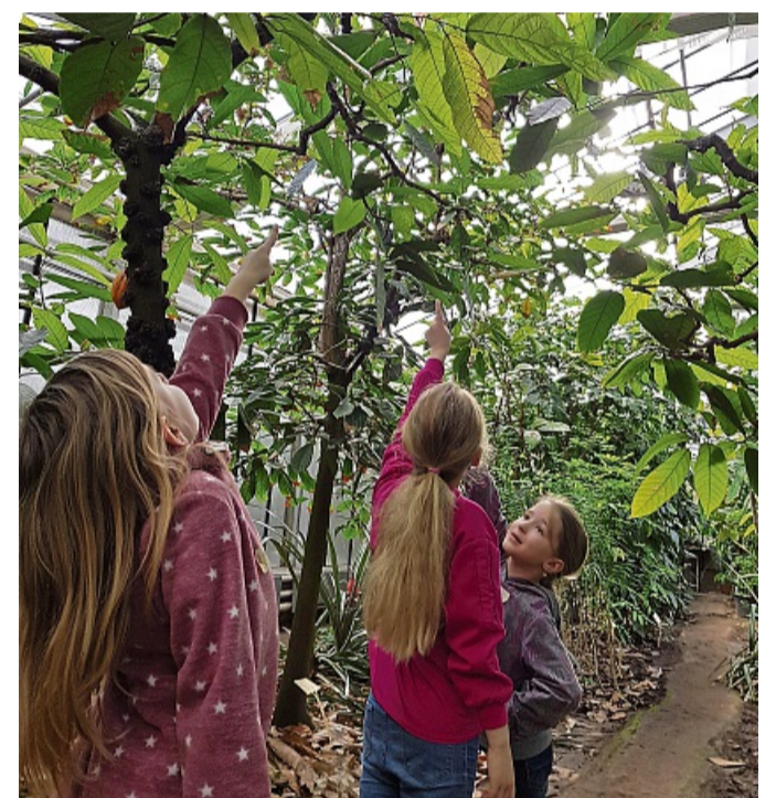
Mit Lupe, Notizblock und viel Neugier: Junge „Glücksforscher“ erkunden die Pflanzen.