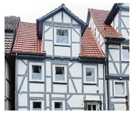
Auch Fachwerkhäuser sind bei uns in guten Händen.