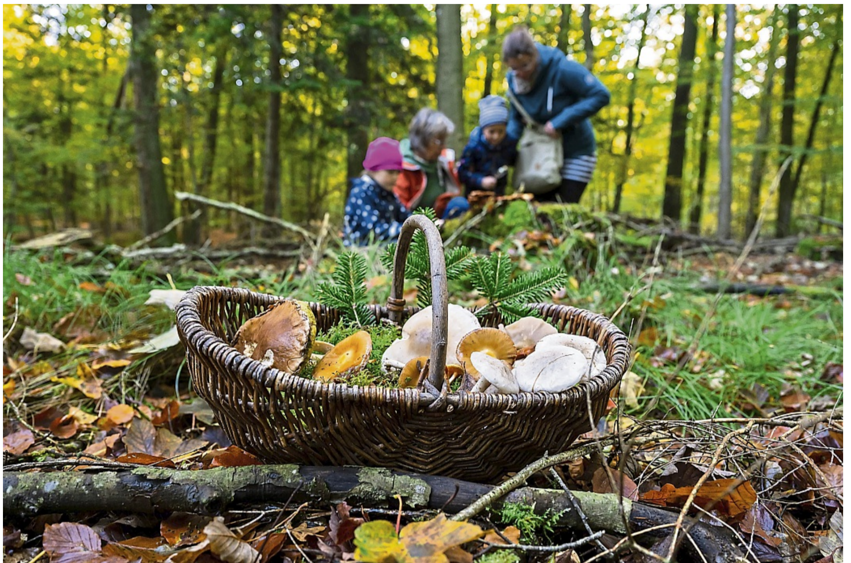
Um in die Pilze zu gehen, sollte man früh aufstehen. Sonst findet man nur noch die, die andere stehen gelassen haben.

Empfehlungen von Freunden und Bekannten sind im-