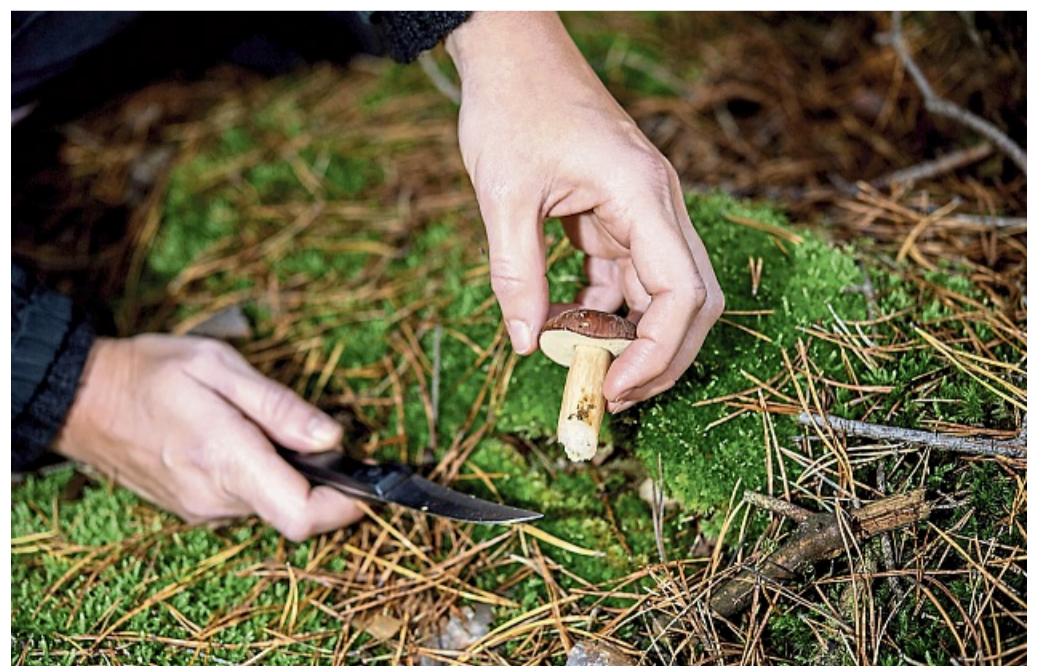
Ist man sich sicher, dass man einen bekannten Pilz wie eine Marone gefunden hat, kann man ihn mit einem scharfen Messer abschneiden.