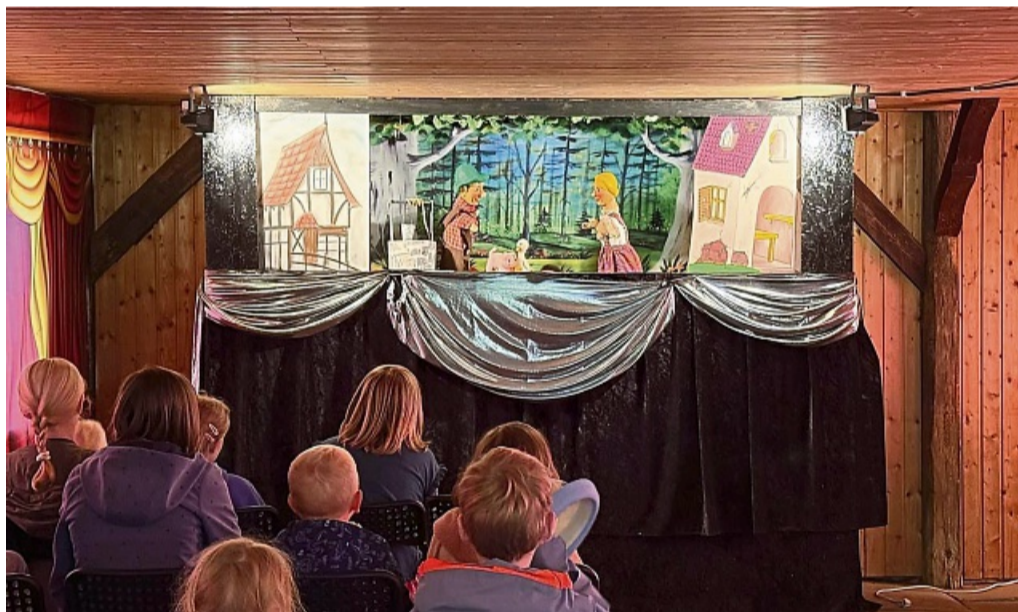
Wenn Hans im Glück und Schneewittchen die Bühne betreten, wird das Puppenspiel zur lebendigen Märchenstunde.