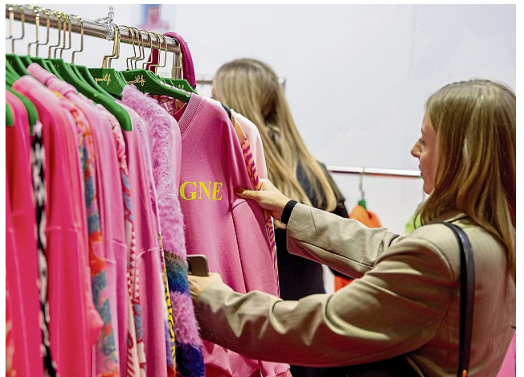
Wie finde ich meinen eigenen Mode-Stil? Mit diesen Tipps entwickelt man seine persönliche «Stil-DNA».

Als Grundlage empfiehlt Dangmann das Konzept der sogenannten Capsule Wardrobe, also eine kleine, aber hochwer-