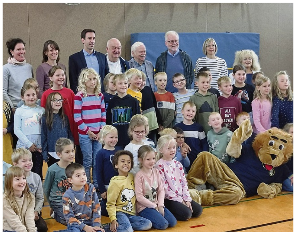
Auch das Maskottchen des Wettbewerbs kommt zu Besuch: Die Kinder der Grundschule Hedemünden erfuhren im vergangenen Jahr durch Frage- und Antwortspiele sowie humorvolle Beiträge mehr über das Lesen.