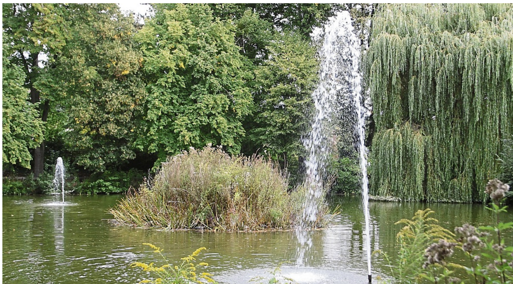
Soll mit großem Aufwand zu einer „Natueroase“ werden: der Schwanenteich im Zentrum von Sooden.