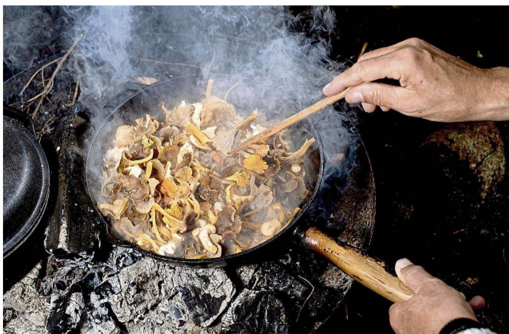
Pilze sollten innerhalb von 24 Stunden gegessen werden. Kommt man nicht dazu, ist Trocknen oder Einfrieren eine Methode, um sie haltbar zu machen.

Da Pilze nicht besonders gut verdaulich sind, sollten Pilzgerichte nicht zu üppig sein und auch nicht zu spät am Abend eingenommen werden. trm