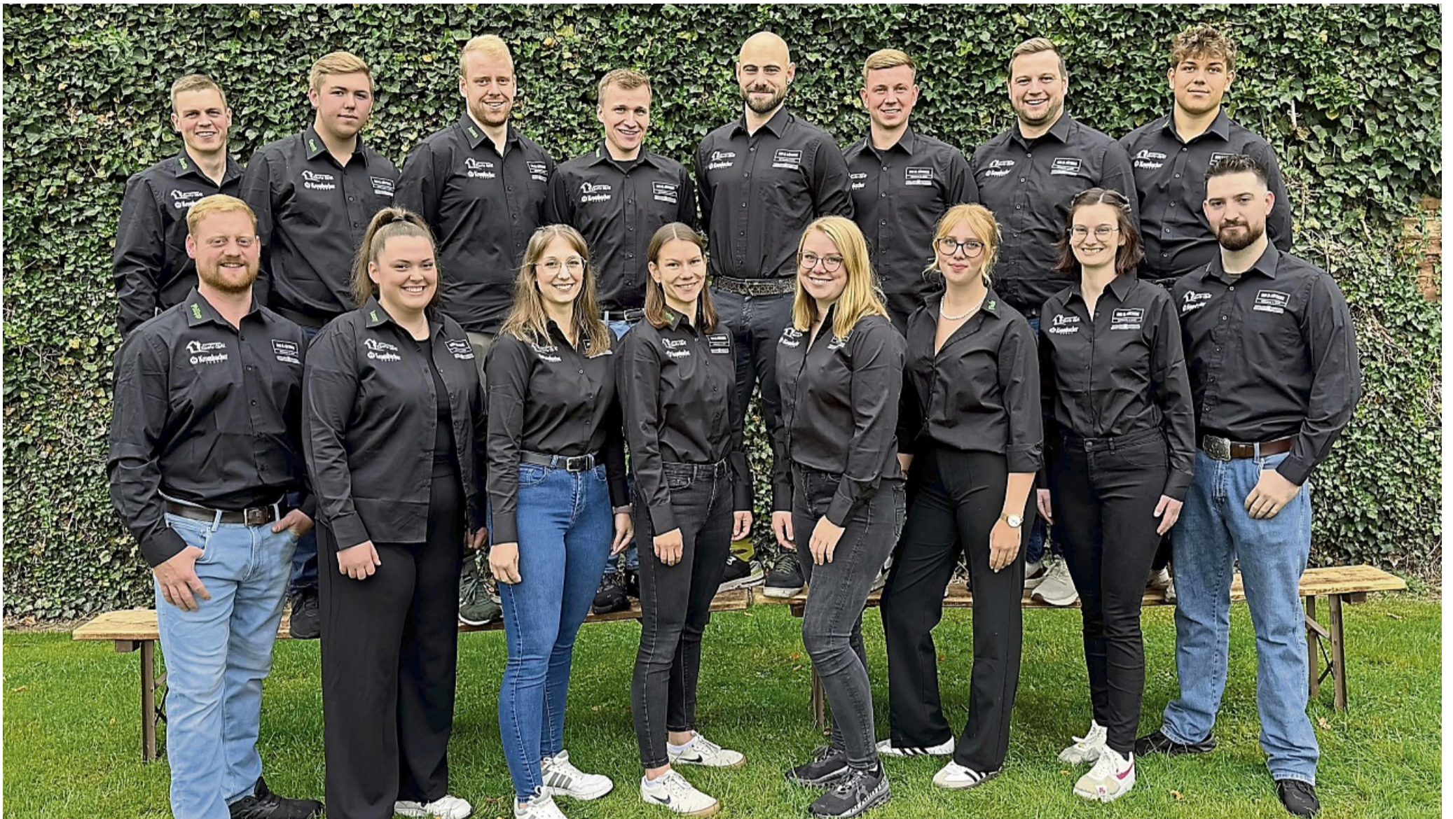
Die Meininghäuser Kirmesburschen und -mädeln im einheitlichen Outfit. Noch bunter sind die Kostüme bei ihrer Show am Montagabend mit lustigen Erinnerungen an ihre Kindheit.

Feiern mit XCITED und lustiger Show bei Kirmes in Meininghausen