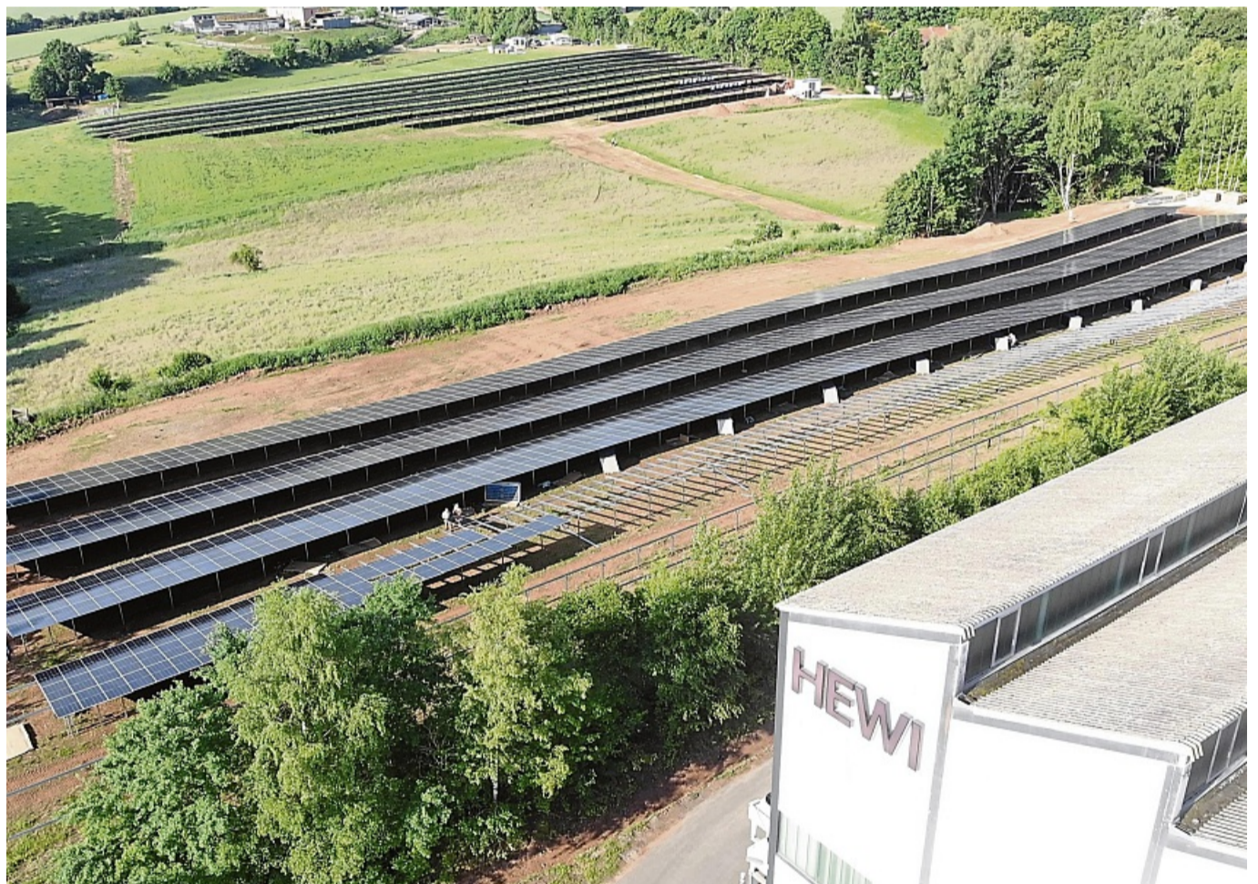
Blick aus der Vogelperspektive: Die Firma HEWI nutzt in Mengersinghausen Eigenstrom aus zwei großen Solarfeldern. Die Photovoltaikflächen mit rund drei Megawatt Leistung ermöglichen den kostengünstigen Betrieb der Produktionsmaschinen.

Ein besonderes Augenmerk liegt zudem auf der ökologischen Gestaltung der Anlage: Die rund 2 Hektar große Fläche wurde so konzipiert, dass sie nach Vorgaben für Schafhaltung genutzt werden kann. Ziel ist es, die Pflege der Grünflächen durch Beweidung sicherzustellen. Der Zaun der Fläche wurde zudem mit einem Abstand von 15 cm zum Boden errichtet, um auch Kleintieren die Durchwanderung des Geländes zu ermöglichen. So wird die Fläche nicht nur für klimafreundliche Energieversorgung genutzt, sondern dient gleichzeitig auch für tiergerechte Flächennutzung, wodurch ein mehrfacher Nutzen entsteht. pr