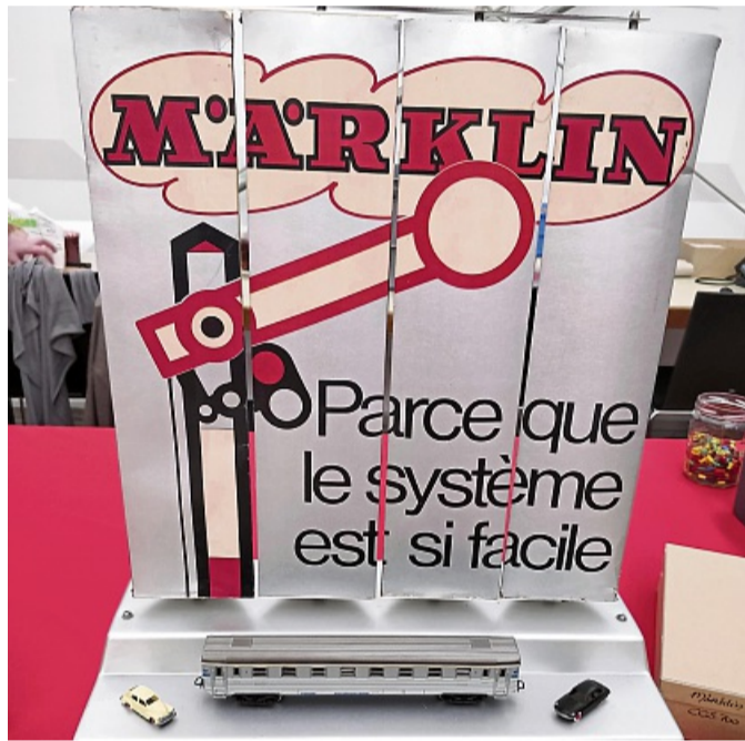
Ein französisches Theken-Schaustück aus den 1970er Jahren.