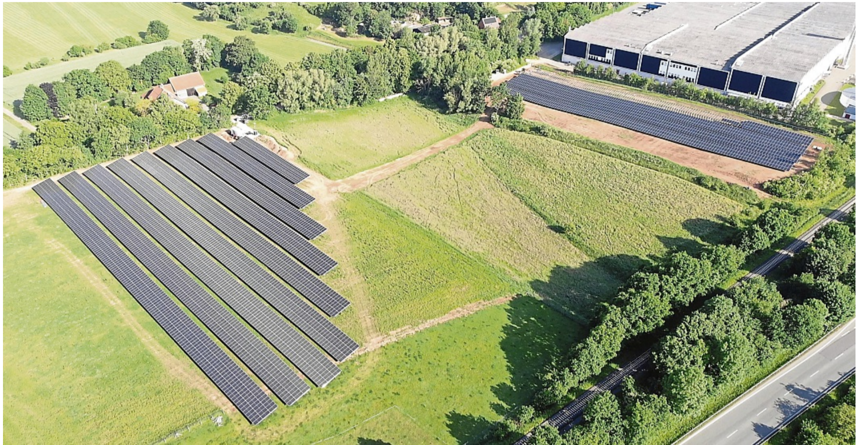
HEWI Mengersinghausen: Die neue Freiflächenanlage ergänzt die bereits installierten PV-Module an der Südseite der Produktionshalle und trägt maßgeblich zur Energieautarkie des Standorts bei.

„Photovoltaikprojekte wie dieses zeigen, dass Klimaschutz und Wirtschaftlichkeit Hand in Hand gehen können. Wir danken HEWI für das Ver-