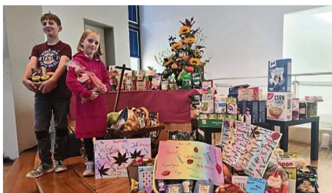
Der Erntedanktisch: Viele Spenden für die Tafel wurden zusammengetragen.

Mehrere Kisten voll wurden am Folgetag zur Verteilstelle