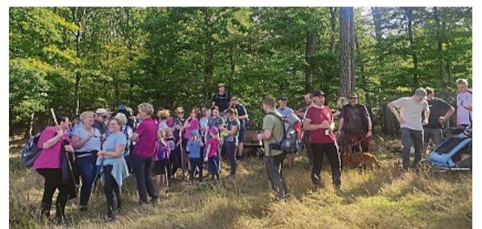
Grenzgänger unterwegs: Teilnehmerinnen und Teilnehmer der fünften Schnade in Epe pflegten alten Brauch.

Korbach-Eppe – Zu einer gemeinsamen Aktion hatten der Ortsbeirat und des Vereins „Aktives Epe“ eingeladen und die Resonanz war gut: Rund 50 Epperinnen und Epper nahmen an der fünften Schnade teil.