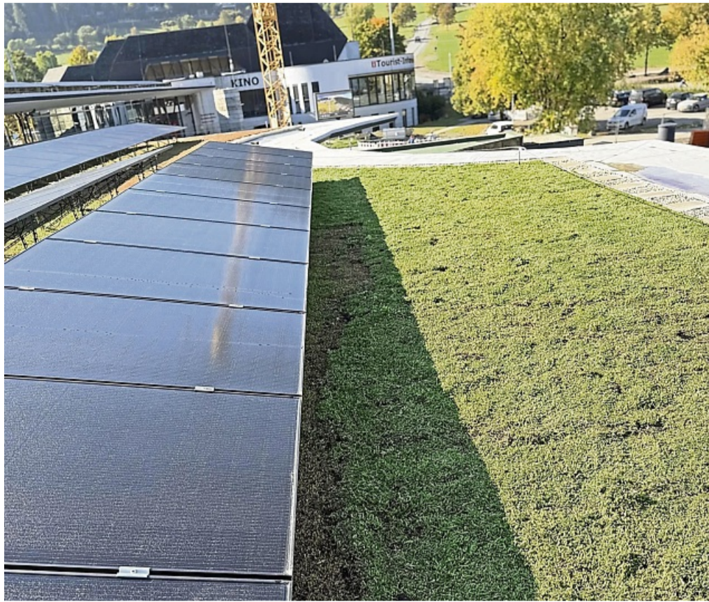
Teil des Konzepts: Photovoltaikanlage mit Dachbegrünung auf dem neuen Lagunenbad.

Hinzu kommt eine große Photovoltaikanlage mit rund