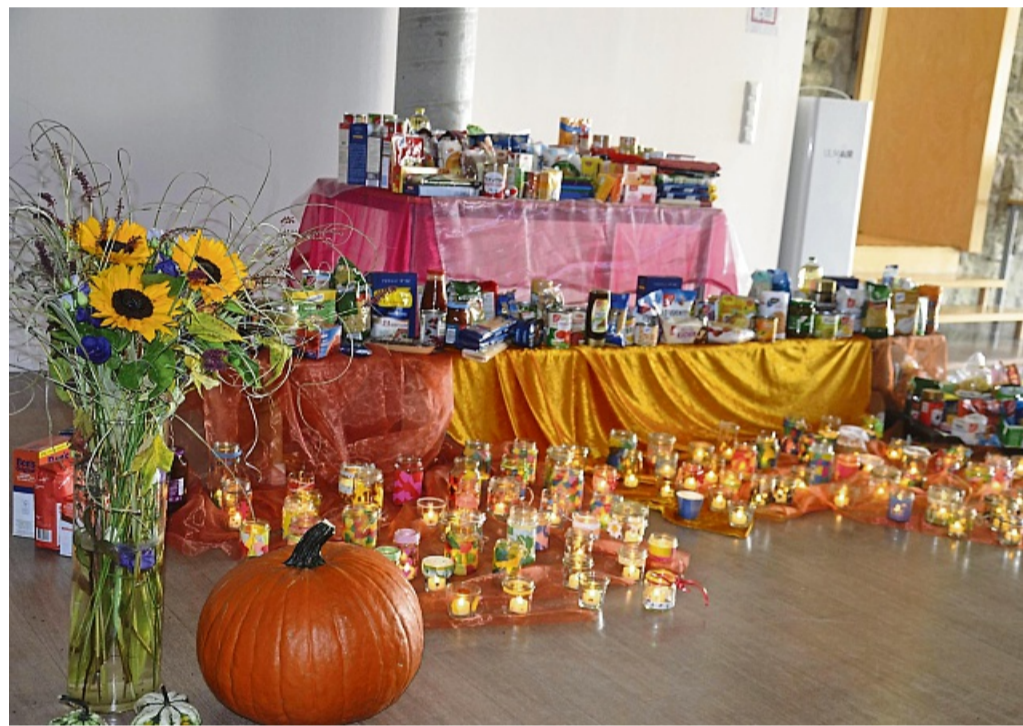
Licht war das Thema des Erntedankgottesdienstes im Schein der kleinen Gläser.

Besuchen Sie die Fachgeschäfte der Region