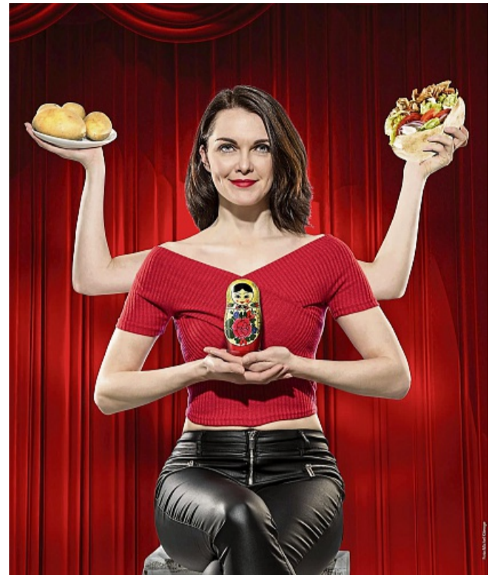
Kabarett und Musik: Liza Kos tritt am Samstag, 29. November, im Korbacher Bürgerhaus auf.

Korbach – Die Kabarettistin Liza Kos gastiert am Samstag, 29. November, um 20 Uhr im Korbacher Bürgerhaus. Das vhs-Kulturforum präsentiert ihr Programm „Intrigation – Russischer Döner mit Kartoffelsalat“.