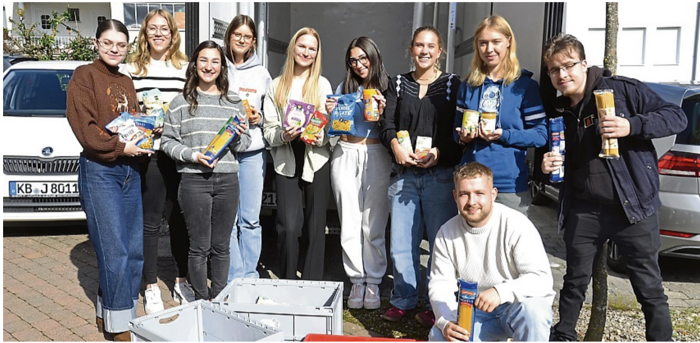
Die Spenden der Fröbel-Studierenden zu verladen, half die Schülerversammlung den Tafel-Mitarbeitern.