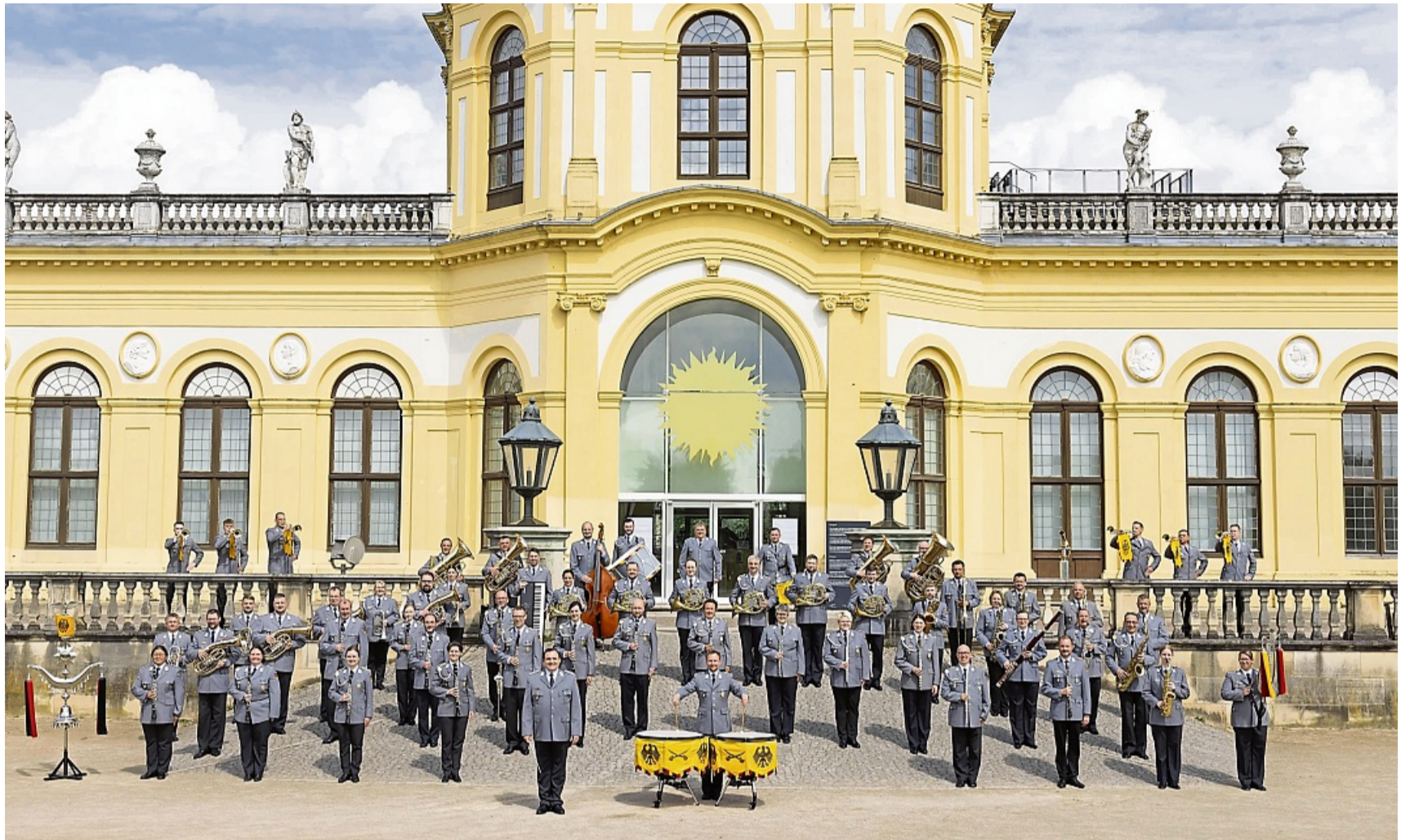
Der Heeresmusikkorps Kassel tritt am 22. Oktober in der Bergheimer Festhalle auf. Karten sind ab sofort über die Vorverkaufsstellen der Nationalparkgemeinde Edertal erhältlich. Unter anderem Behinderte, ihre Begleiter und Werkstatt-Mitarbeiter sind vom Eintritt befreit

Vom Eintritt befreit sind zusammen mit ihren Begleitpersonen Bewohner von Wohn-