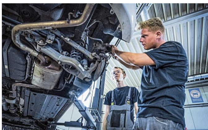
Besonders im Winter sind Bremsen, Stoßdämpfer und das gesamte Fahrwerk wichtig.

Die gesetzlich vorgeschriebene Profiltiefe liegt bei 1,6 Millimeter - viel zu wenig, um bei Schnee oder Nässe sicher zu bremsen und in der Spur zu bleiben. Die Experten des Deutschen Kraftfahrzeuggewerbes empfehlen eine Mindesttiefe von vier Millimetern. Nach sechs bis acht, spätestens 10 Jahren sollten die Pneu getauscht werden, da die Elastizität nachlässt und der Gummi verspröden kann. Die Kfz-Werkstatt kann Alter und Zu-