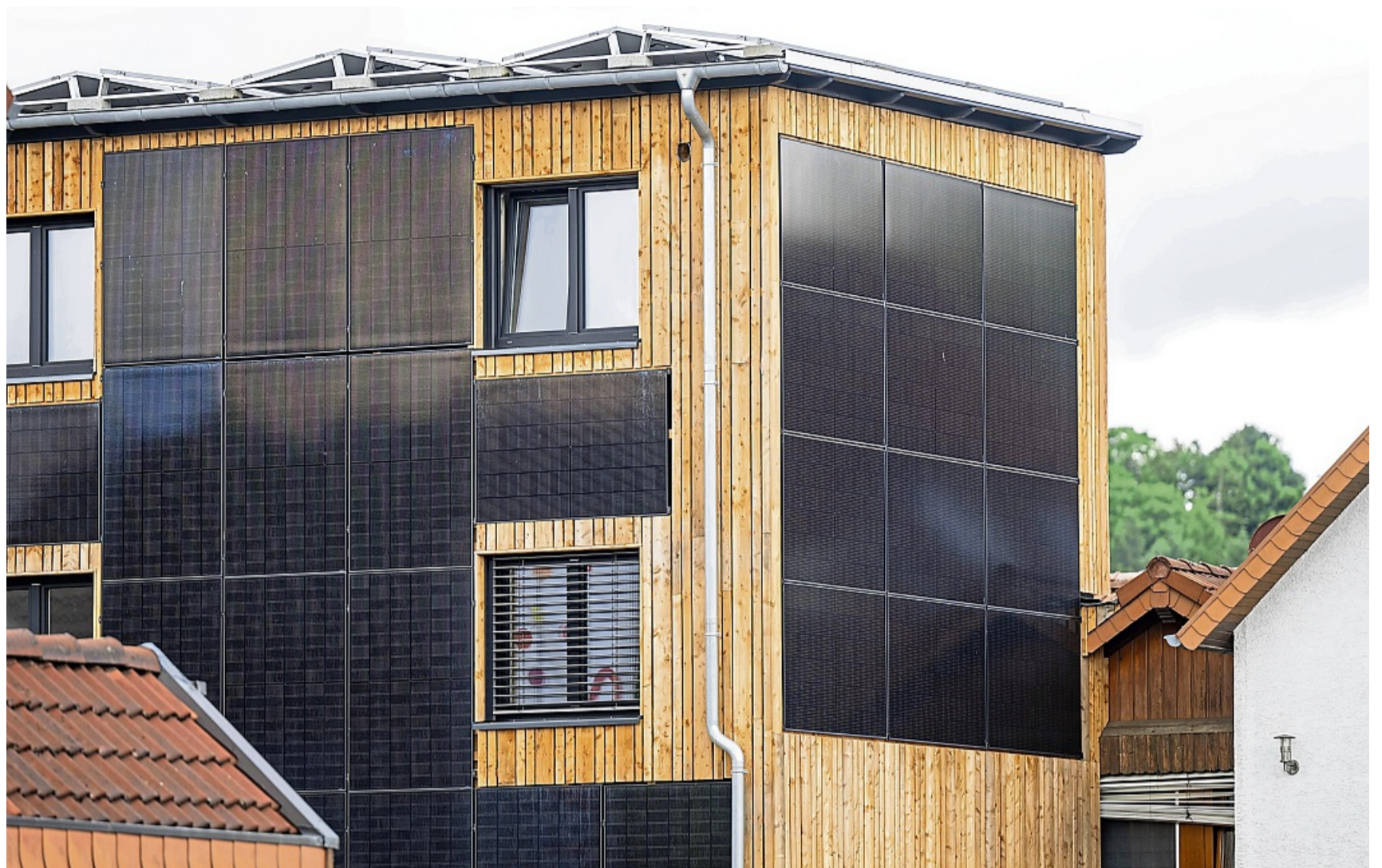
Energie im Gebäude einsparen: Solarpaneele sind nur ein Aspekt beim klimagerechten Bauen.

„Mit diesem Fachmann sollte der Bauherr direkt zu seinem Grundstück fahren, dort die