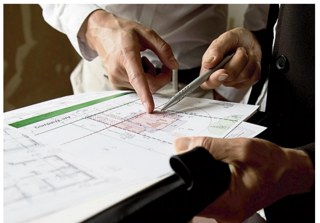
Ganzheitlich denken: Sachverständige und Architekten können bei der Bauplanung unterstützen.