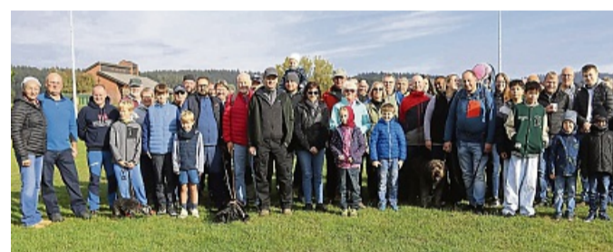
Grenzgang Teil 2: Daran nahmen am Freitag rund 60 Wanderer teil. Das Grenzgang war ein weiterer Höhepunkt des Dorfjubiläums „825 Jahre“ Halgehausen. Das Bild zeigt die Gruppe beim „Abmarsch“ am Sportplatz in Halgehausen.