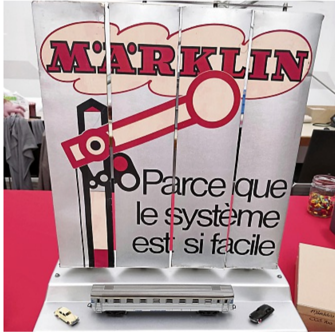
Ein französisches Theken-Schaustück aus den 1970er Jahren.