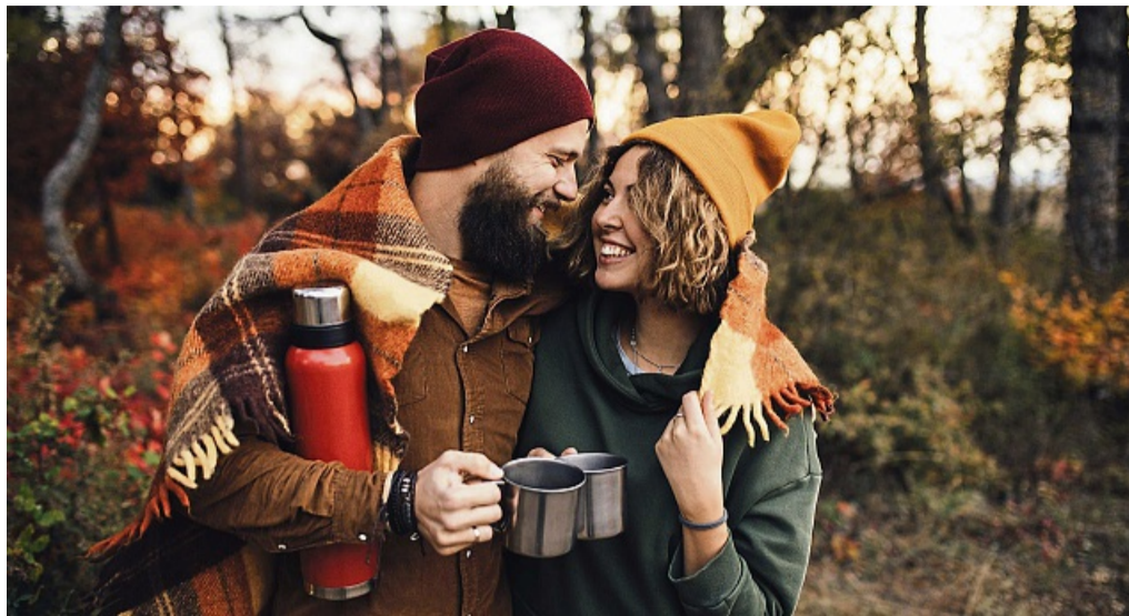
Tipps für entspannte Dates im Herbst: Ein kurzer Spaziergang im Tageslicht oder bewusstes Durchatmen an der frischen Luft tun gut.

Geben Sie Ihrem Tag kleine, wohlthuende Anker: ein kurzer Spaziergang im Tageslicht, bewusstes Durchatmen an der frischen Luft, abends ein ruhiger Abschluss zu Hause. Warmes Licht statt greller Beleuchtung, eine Kerze, leise Musik und ein heißes Bad schaffen sofort eine behagliche Stimmung. Auch allein können Rituale guttun: eine Suppe köcheln, ein neues