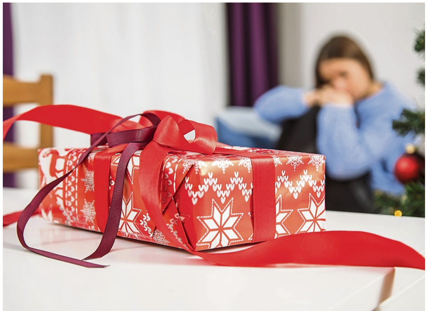
Hoffentlich keine Geschmacklosigkeit: Eine Studie enthüllt, wie oft Geschenke nach hinten losgehen.

Fast zwei Drittel (61 Prozent) aller Befragten haben schon