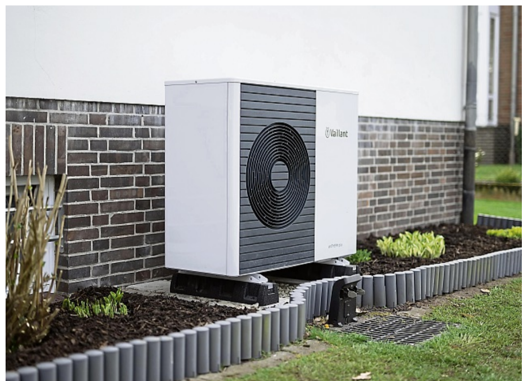
Energieeffizient heizen und Maßnahmen kombinieren: Wärmepumpen kann man mit Strom der eigenen Photovoltaik betreiben.