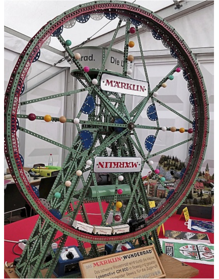
Der absolute Publikumsmagnet in Göppingen war das originale Märklin Wunderrad aus dem Jahr 1956.

sie aktuell die jüngste von vielen Werbe- und Schaufenster-Anlagen. Als weiteres Ausstellungsstück wurde ein Theken-Schaustück präsentiert, das die französischen Spielwarenhändler in den 1970er Jahren zur Verkaufsförderung bei Märklin erwerben konnten und das passend mit französischen Loks, Wagen und Autos bestückt war. Der absolute Publikumsmagnet in Göppingen war das originale Märklin Wunderrad aus dem Jahr 1956; es ist aus Metallbaukasten-Teilen gefertigt und erinnert an ein Riesenrad, zur damaligen Zeit eine beliebte Attraktion auf den Rummelpätzen. Bei diesem Schaustück treibt eine 3000er Dampflok das große