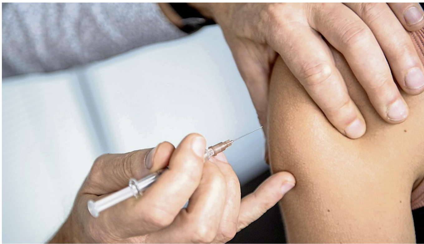
Wer sich vor der Grippe schützen will, lässt sich am besten zwischen Oktober und Mitte Dezember gegen Influenzaviren impfen.

Die Faustregel: Wer Grunderkrankungen mitbringt oder in fortgeschrittenem Alter ist, sollte eher einen Gang runterschalten als jemand, der gesund ist. Wer sich unsicher ist, bespricht am besten mit dem Arzt oder der Ärztin, worauf es in den Tagen danach ankommt, so Peters Rat. Und natürlich grundsätzlich