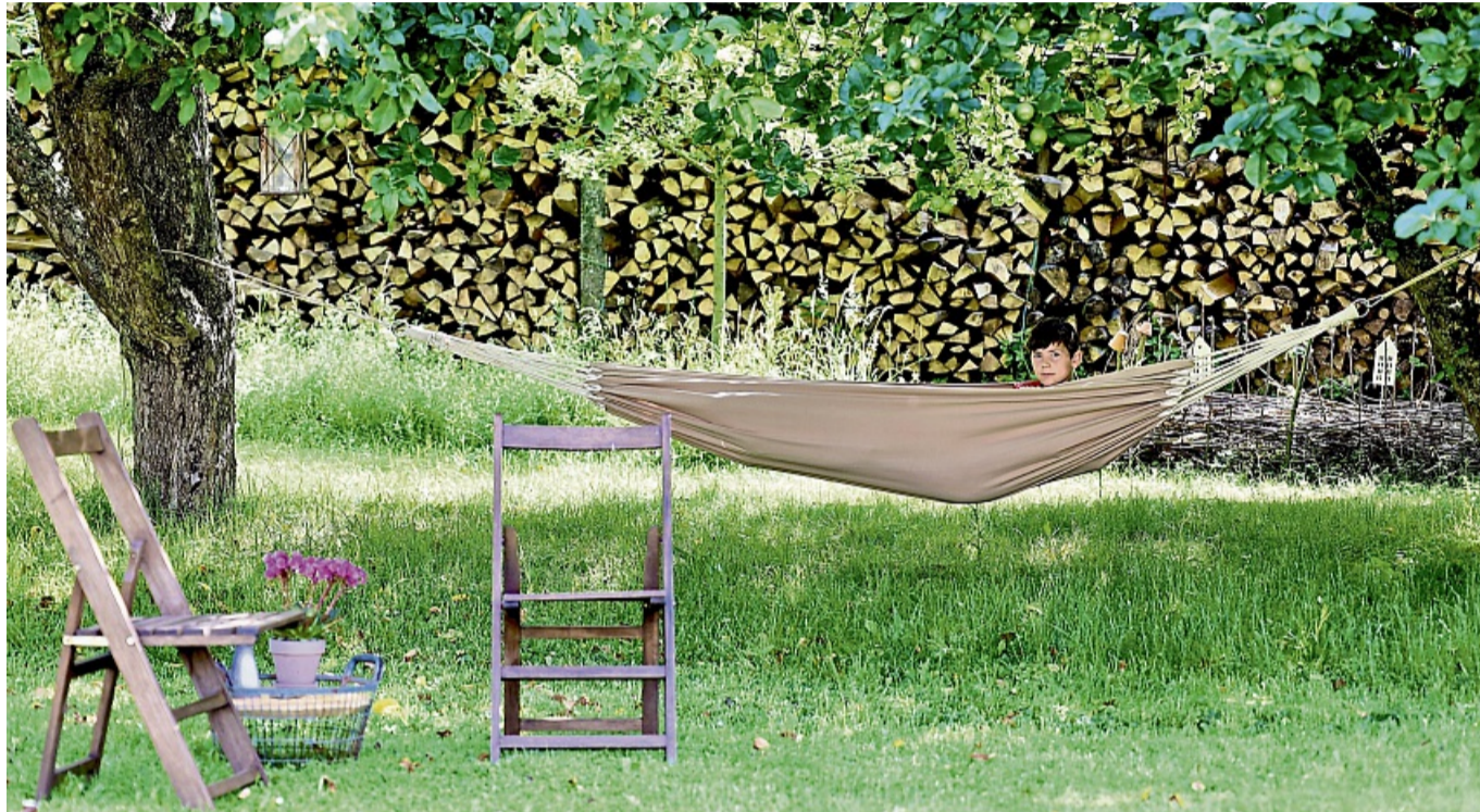
Die Offenen Gärten in Waldeck-Frankenberg sollen 2026 wieder im Juni und im September stattfinden.