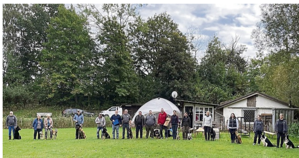
Erfolgreich: Hunde und Herrchen bzw. Frauchen vom Verein Deutsche Schäferhunde mit Sitz in Gemünden

den in den Sparten Sachkunde, Unterordnung und Verkehrsteil geprüft. In der Sachkunde muss der Hundeführer schriftliche Kenntnisse über Hundezucht, -haltung und -pflege beweisen. Im Unterordnungsteil werden Leinenführigkeit, Sitz, Platz, Ablage unter Ablenkung und Sozialverhalten in einer Personengruppe abverlangt. Im Verkehrsteil muss sich der Hund neutral im Straßenverkehr verhalten. Begegnung mit Autos, Joggern, Fahrradfahrern und anderen Hunden wird überprüft.