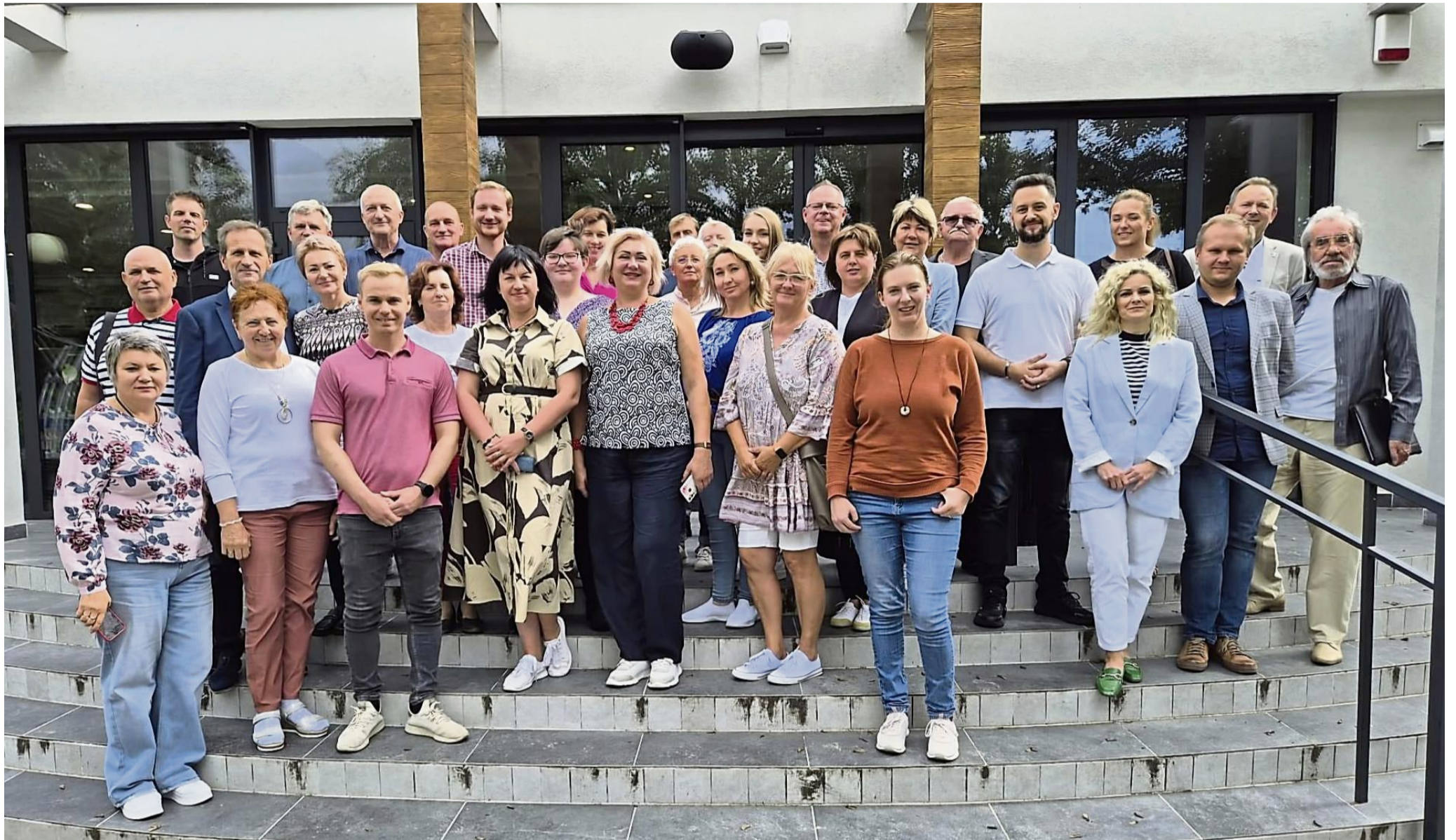
Aus vier Ländern kamen die Teilnehmer des Treffens in Chelmno. Unser Bild entstand vor dem Kurt-Schumacher-Haus.

Multinationales Treffen in Hann. Mündens polnischer Partnerstadt Chelmno