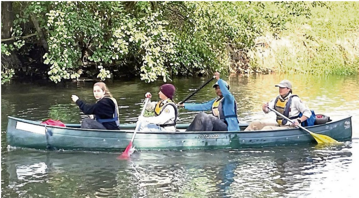
Erkundeten die Natur: Pfadfinderinnen auf dem Kanu-Trails der Diemel.