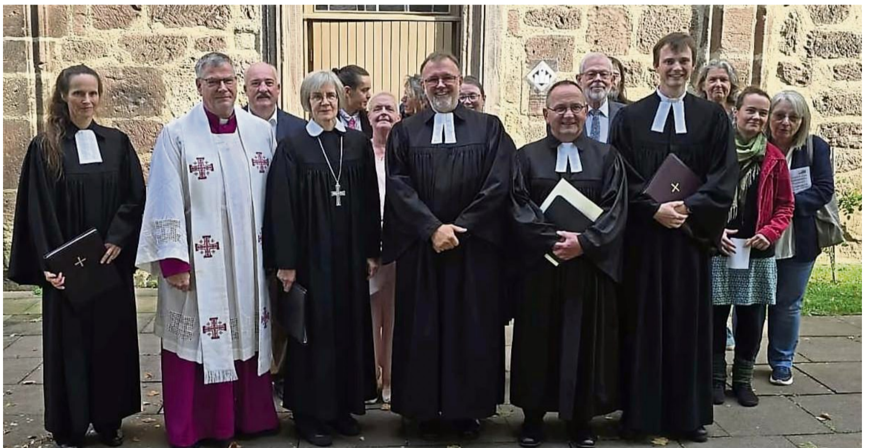
Ein Bild des Zusammenhalts: Bracks Abschiedsgottesdienst vereinte Generationen und Konfessionen.

Bracks Predigt zeigte, dass er den Augenblick nicht als reine Rückschau verstand. „Euer Umgang miteinander soll von Demut geprägt sein“, zitierte er den Apostel Petrus. Er sprach von Läufern und Werfern aus seinem Sportleistungskurs, Sinnbilder zweier Talente, die aufeinander angewiesen sind. Ein Bild für die Kirche, für das