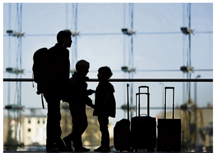
Anspruch auf Kindergeld? Den haben unter bestimmten Voraussetzungen auch im Ausland lebende Deutsche.

Deutsche, die im Ausland wohnen und arbeiten, haben für ihren Nachwuchs unter bestimmten Voraussetzungen Anspruch auf Kindergeld. Darauf weist Irmgard Pirkel von der Zentrale der Bundesagentur für Arbeit in Nürnberg hin. Demnach muss der Elternteil, der den Anspruch geltend macht, in Deutschland unbeschränkt einkommensteuerpflichtig sein - oder auf Antrag als unbeschränkt einkommensteuerpflichtig behandelt werden. Unbeschränkt einkommensteuerpflichtig sind beispielsweise entsandte deutsche Staatsangehörige, die als Beamte, Richterinnen oder Soldaten im Ausland arbeiten und wohnen. Anspruch auf Kindergeld kann zwar auch ein Elternteil geltend machen, der in Deutschland nicht unbeschränkt steuerpflichtig ist. Diese Person muss aber laut Pirkel in einem Versicherungsverhältnis zur Bundesagentur für Arbeit stehen oder zum Beispiel als Entwicklungshelferin oder als Missionarin oder Missionar tätig sein.