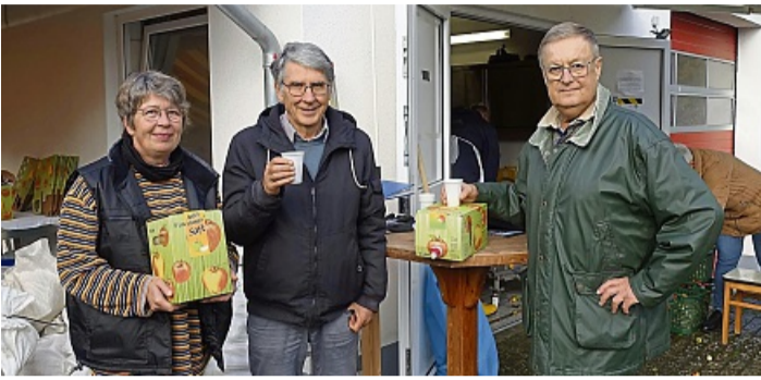
Keltertage bei der Grenzlandkellerei Nieder-Schleidern

Keltertage der Grenzlandkellerei Nieder-Schleidern – Ernte sehr wechselhaft