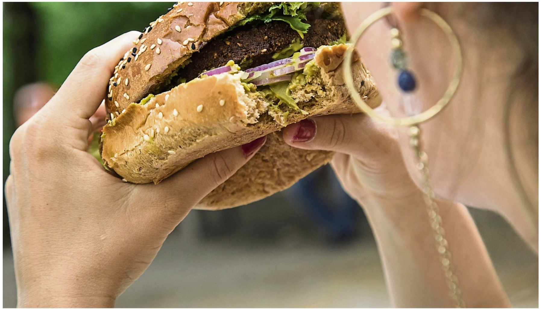
Burger statt Obst: 84 Prozent der Befragten sind der Ansicht, dass gesunde Lebensmittel an öffentlichen Plätzen schwerer zu finden sind als ungesunde Produkte.

Doch was sind die Hindernisse? Oft liegt es daran, dass außer Haus die ungesündere Option