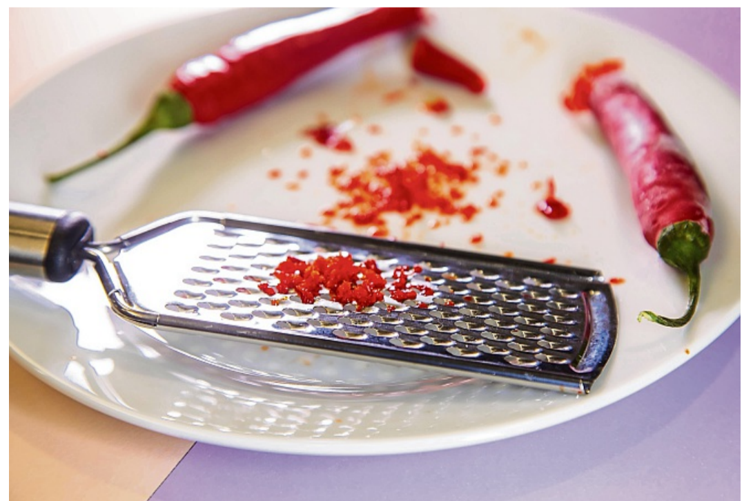
Fazit: Der Hack funktioniert hervorragend - das Ergebnis sind kleine, feine Chiliraspel.

Wie man eine Chilischote einfach zerkleinert