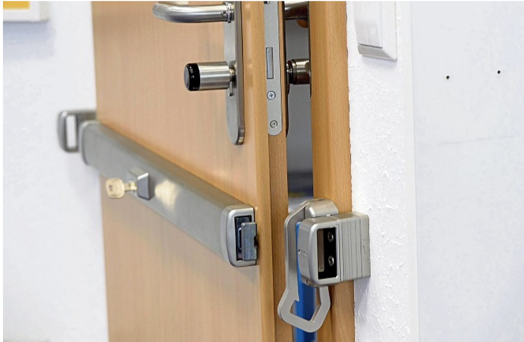
Gut gesichert gegen Einbruch ist die Tür mit einem Querriegelschloss.

Generell betont Elsner: „Wichtig ist, dass die Nachrüstung für Türblatt, Türrahmen, Türbänder, Türschlösser, Beschläge, Schließbleche und auch Zusatzsicherungen in ihrer Wirkung sinnvoll aufeinander abgestimmt ist und fachgerecht eingebaut wird.“ Polizeilich empfohlene Fachbetriebe in der Nähe, die Türen nachrü-