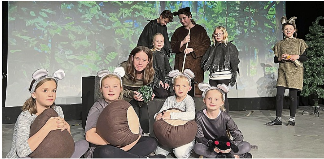
Probenszene für das Stück Rapunzel - mal ohne Prinz: Zu sehen sind die Waldtiere beim Spiel.

liest am 28. Oktober und 4. November jeweils um 19.30 Uhr in der Buchhandlung, Bahnhofstraße 7. Der Eintritt beträgt zwei Euro. Für eine bessere Planung wird um telefonische Anmeldung unter 05691 / 2224 gebeten.