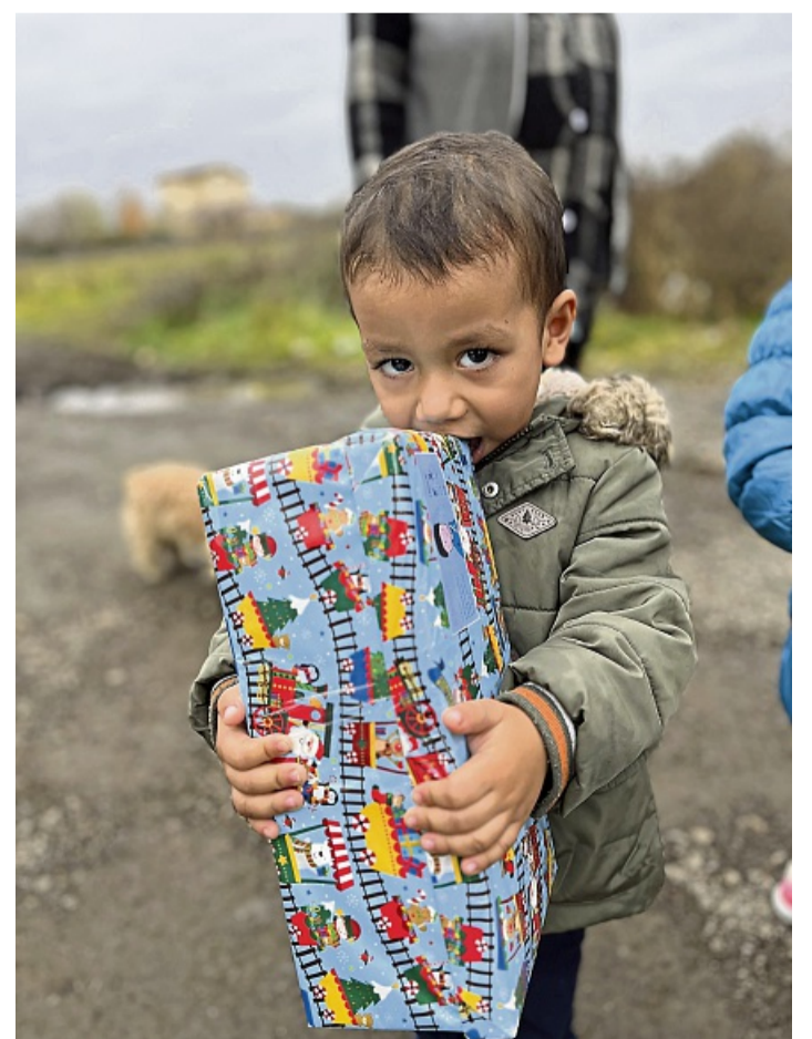
Kindern eine Freude machen: Mit der Weihnachtspäckchenaktion der Stiftung Kinderzukunft.

Mehr Infos zur Aktion gibt es im Internet unter kinderzukunft.de