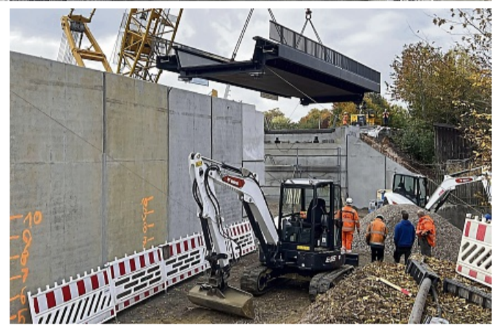
Millimeterarbeit: Langsam, ganz langsam wurde das vorgefertigte Bauteil eingepasst.

Die tonnenschweren Bauteile für die Widerlager wurden vorgefertigt in die Baugrube eingepasst.