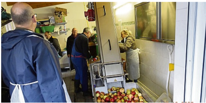
Nach dem Auspressen wurde der Saft pasteurisiert und in Fünf-Liter-Boxen gefüllt.