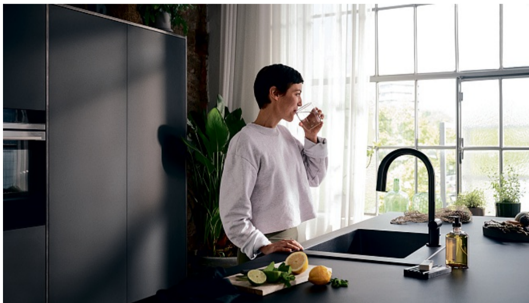
Filter- und Sprudelarmaturen erleichtern den Alltag. Individuelle Filterkartuschen erlauben abgestimmte Mineralisierungsstufen. FOTO: HANS GROHE SE/AKZ-O

Ganz nebenbei erübrigt sich dann auch das Schleppen von schweren Wasserflaschen. akz-o