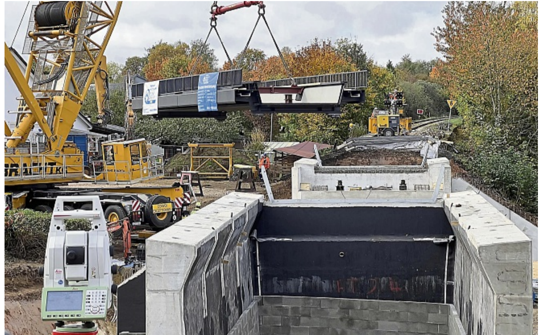
Die neue Bahnbrücke über die Rauchstraße in Helsen wurde von einem Schwerlastkran in die neuen Widerlager eingehoben.

Die neue Brücke ist als eingeleisige, stählerne Trogbrücke angelegt. Um die Bauzeit und die verkehrlichen Einschränkungen so gering wie möglich zu halten, wurde die Brücke in einer Schiffsverft an der Elbe bei Dessau vorgefertigt.