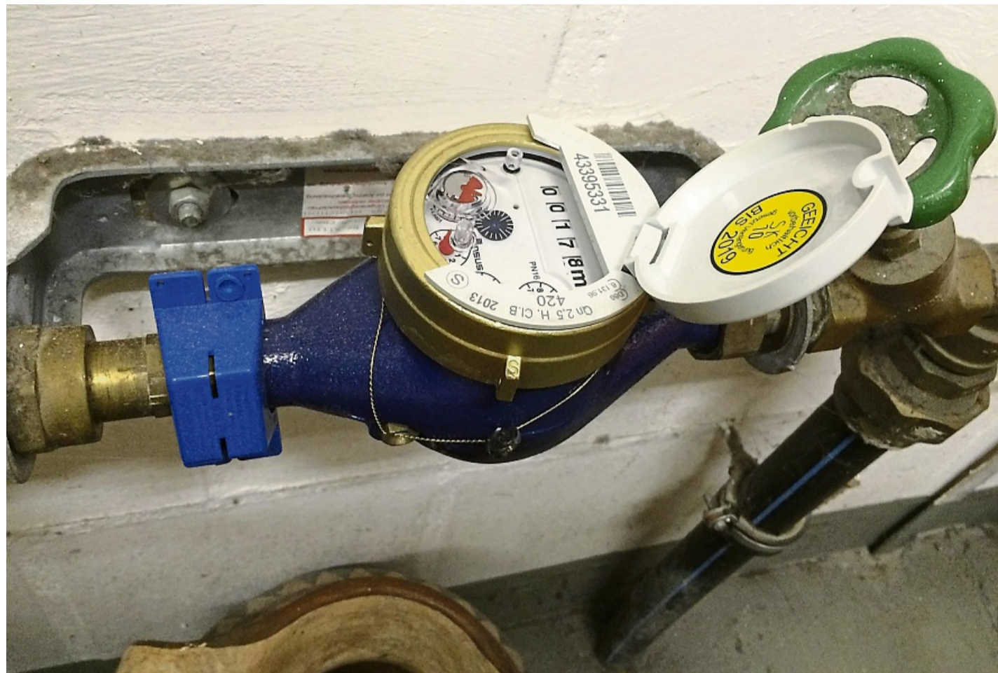
Unbestechlich: Die Wasseruhr im Keller ist der Maßstab für die Gebührenabrechnung. In die Kosten fließen aber viele Faktoren mit ein.

Eine 100kW-Wärmepumpe und eine größere PV-Anlage sollen langfristig dabei helfen, die enormen Energiekosten zu senken. Ähnliche Planungen gibt es für die Verbandskläranlage in Volkmarsen. Da muss unter