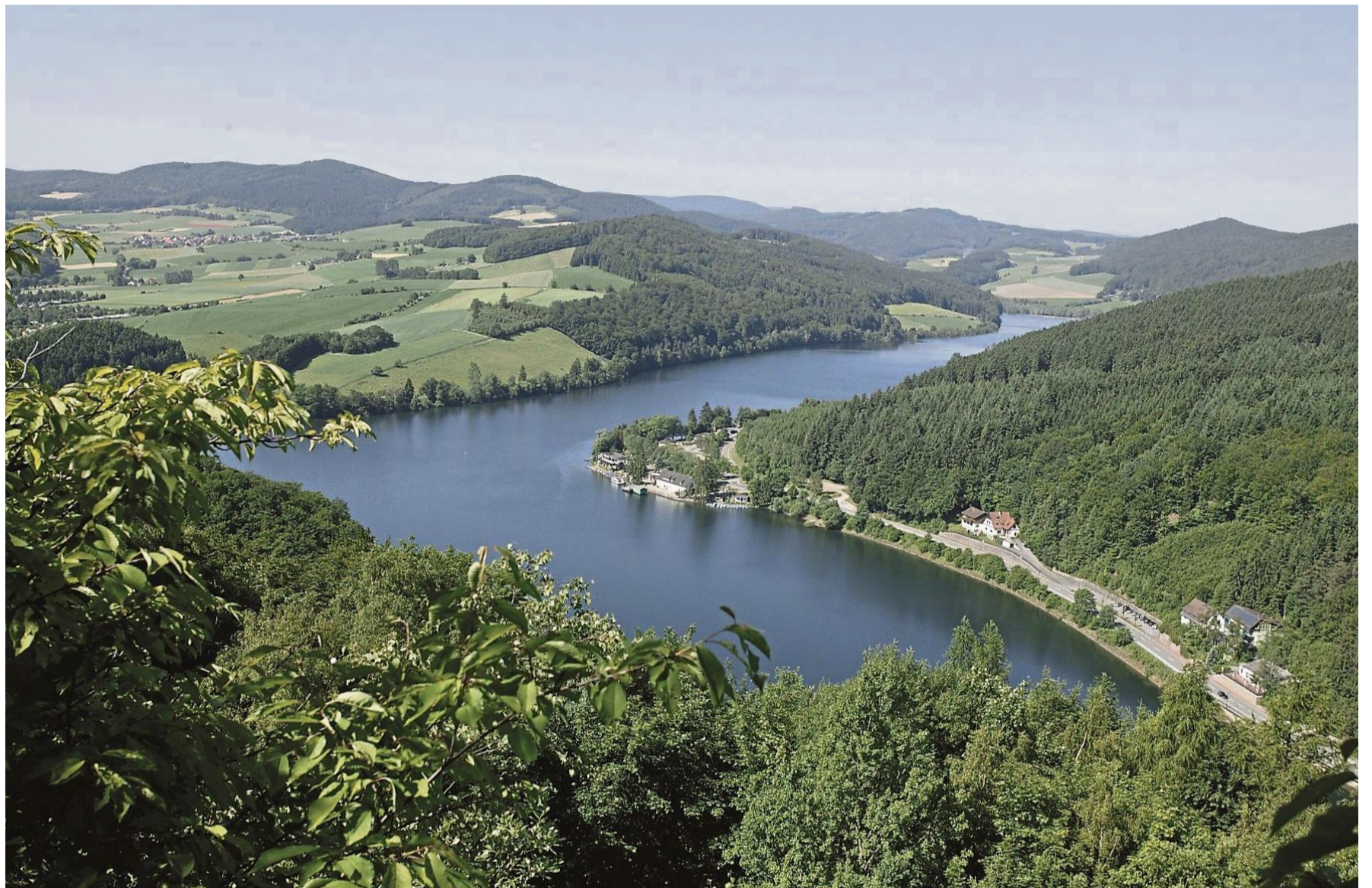
Der Diemelsee gehörte zu den Reisezielen, die im ersten Halbjahr 2025 gefragter waren als im Vorjahr.

Bei den Übernachtungen im ersten Halbjahr 2025 liegen April (+8,2 Prozent) und Juni (+5,4 Prozent) im Plus, während es in allen anderen Monaten Minuswerte im Vergleich zu 2024 gab. Gründe sind hauptsächlich Verschiebungen bei Feiertagen und kein stabiles gutes Wetter: Die Buchungen erfolgen immer kurzfristiger in Abhängigkeit von der Wetterprognose. Dies gilt auch für geplante Tagesausflüge. Neben dem