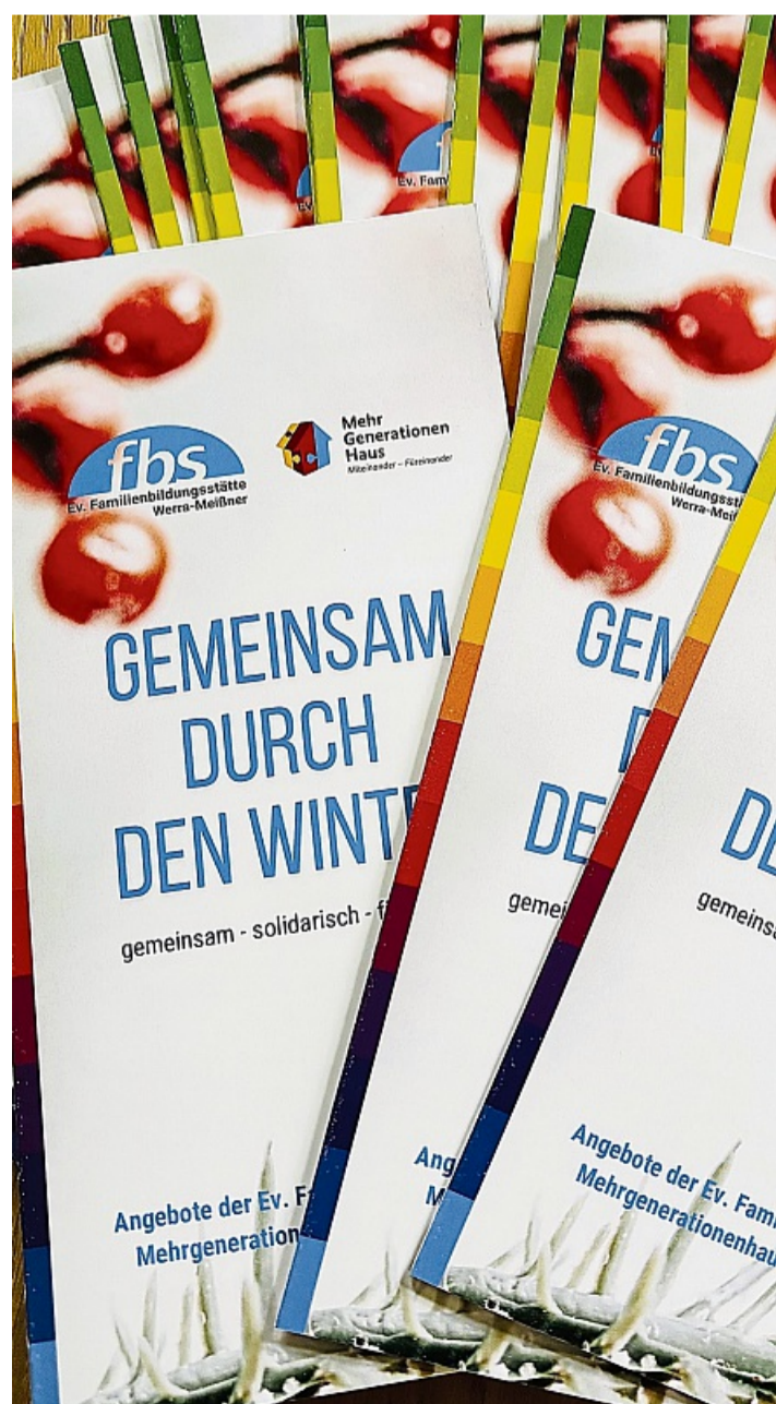
Gemeinsam durch den Winter: Die evangelische Familienbildungsstätte sorgt mit einem bunten Programm dafür, dass der Winter weniger einsam ist.

Zu der FBS-Aktion gibt es einen Flyer zum downloaden unter fbs-werra-meissner.de . MAREN SCHIMKOWIAK