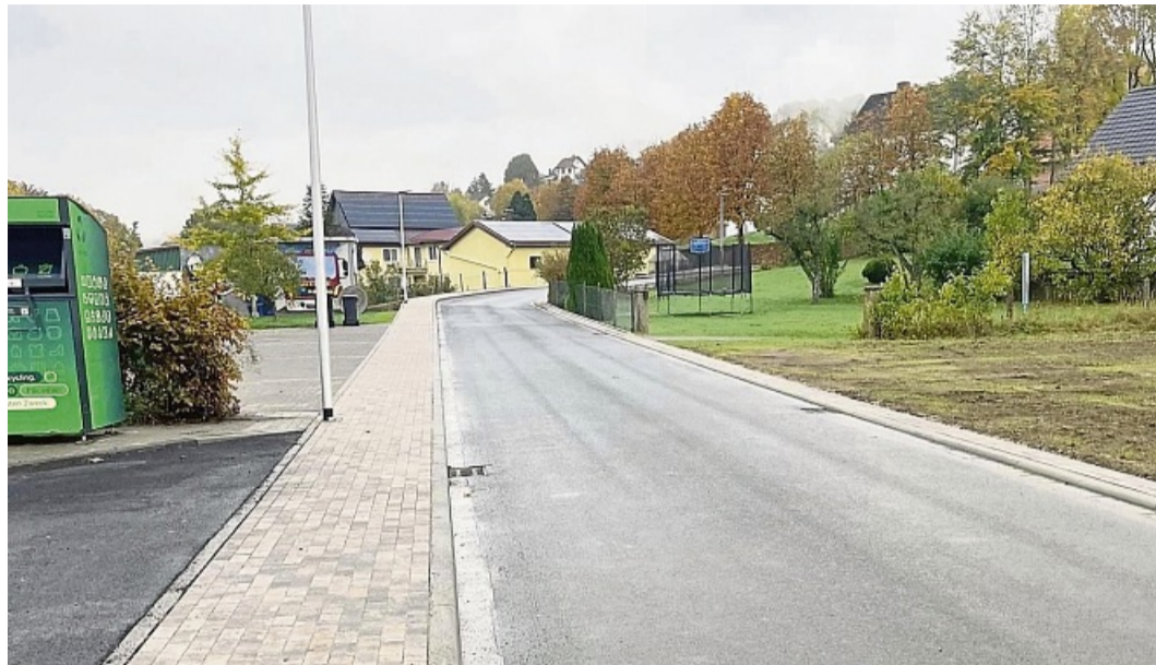
Alles neu in Ulfen: Erneuerung der Wasser- und Kanalleitungen sowie der Straße und Gehwege.

Mit der Abnahme und damit verbundenen Fertigstellung im Bereich der Industriestraße, die die Erneuerung der Wasser- und Kanalleitungen sowie der Straße und Gehwege mit beinhaltet und ca. 1.140.000 Euro gekostet hat, konnte ein erster wichtiger Bauabschnitt in der Ortslage Ulfen auf Maßgabe des