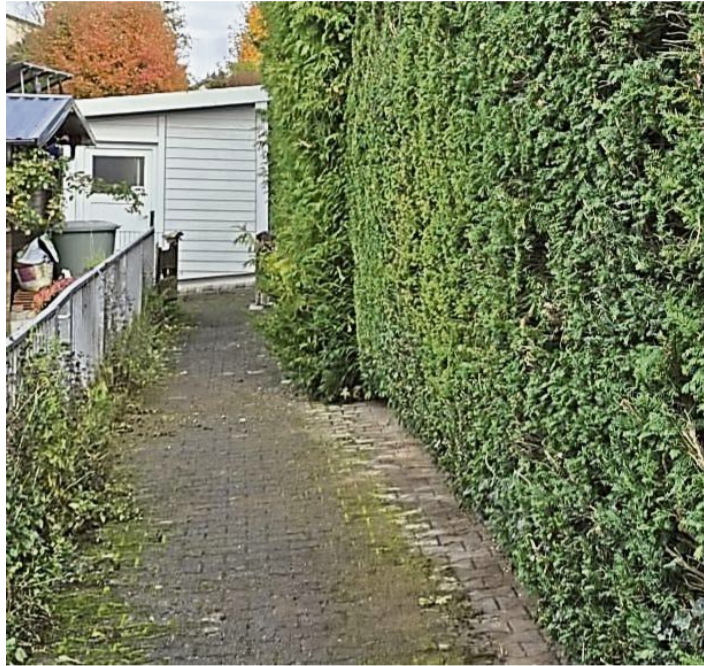
Der perfekte Heckenschnitt: Olaf Garus und sein Team kümmern sich um Gartenarbeit und -pflege aller Art.

Olaf Garus und sein Team kümmern sich um Ihr Zuhause