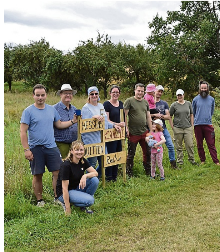
Die Mitglieder des Heimatvereins haben die Beschilderung verbessert.

Heimatverein Niddawitzhausen pflegt „längste Quittenreihe Hessens“