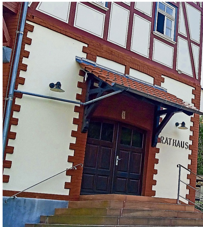
Gleich neben dem Rathaus befindet sich die Praxis von Gloriette Temole, das Schild der ehemaligen Praxis Schellenberg an der Außenmauer hängt noch.

Auch von der Kassenärztlichen Vereinigung (KV) stand Temole Geld zur Verfügung – zur Höhe äußert sich die Praxis nicht, auch dieses Geld ist be-