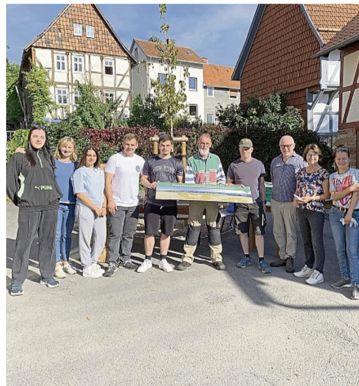
Freiwilligentag 2025 Niddawitzhausen

Insgesamt kümmern sich 26 Baumpaten und Baumpatinnen – darunter viele Kinder – um 34 Bäume entlang des Quittenlehrpfades. Mit ihrem Engagement sorgen sie dafür, dass die Quitten und Wege gepflegt werden. Zu den Bäumen gehören 22 Quitten von neun verschiedenen Quittensorten. Ein weiteres Dutzend Obstsorten sind auf dem Wanderweg ne-