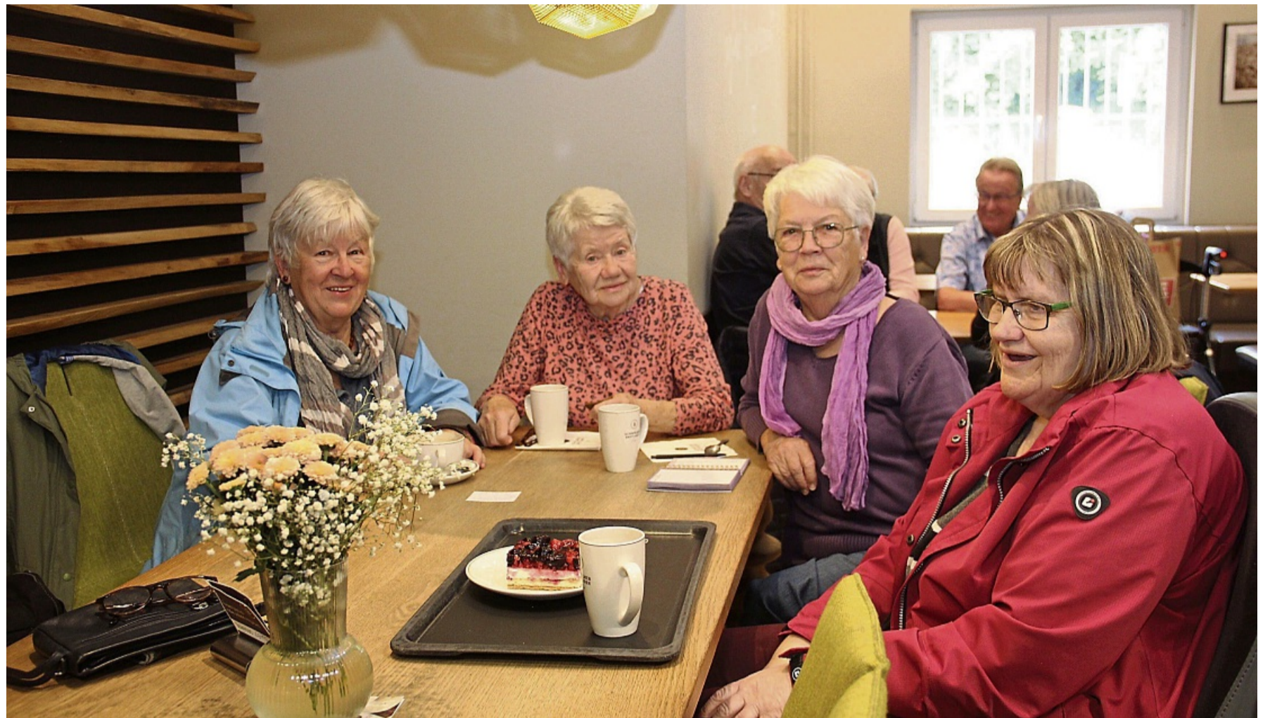
Gute Gesellschaft statt Einsamkeit: Die Veranstaltungsreihe der evangelischen Familienbildungsstätte verbindet alleinstehende Menschen.

Locker, lecker, literarisch: Immer donnerstags gibt es in der Zeit zwischen 16.30 und 18 Uhr leckere Pfannkuchen – jede Woche neu interpretiert. So wird es landestypische Pfannkuchen aus Rumänien (30. Ok-