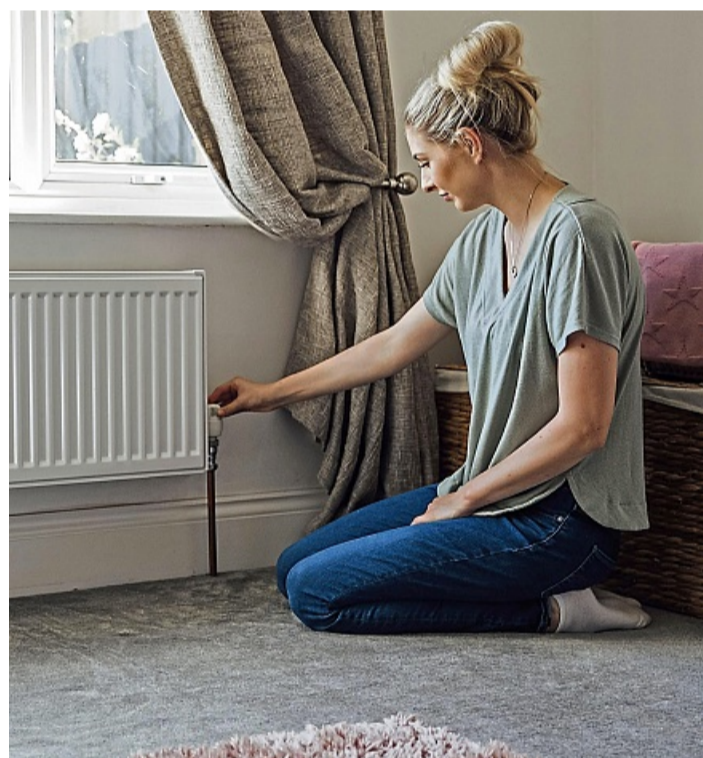
Werden Heizkörper nicht richtig oder unterschiedlich warm und gluckern, ist möglicherweise Luft im System.

1. Jedes Grad Raumtemperatur weniger senkt den Verbrauch um etwa sechs Prozent. Ob Sie Ihre Raumtemperatur auf 21 Grad oder 25 Grad einstel-