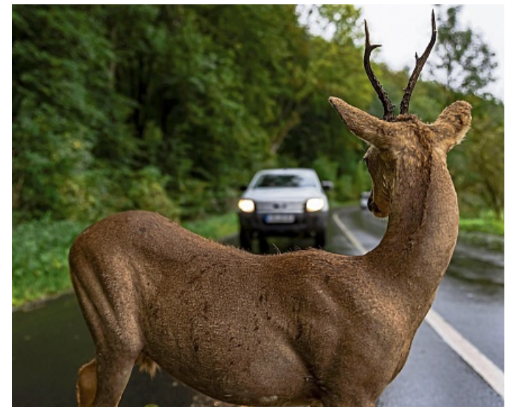
Durch die Zeitumstellung steigt das Risiko für Wildunfälle vor allem in der Dämmerung.

Die Obere Jagdbehörde gibt Tipps, falls es doch mal knallt