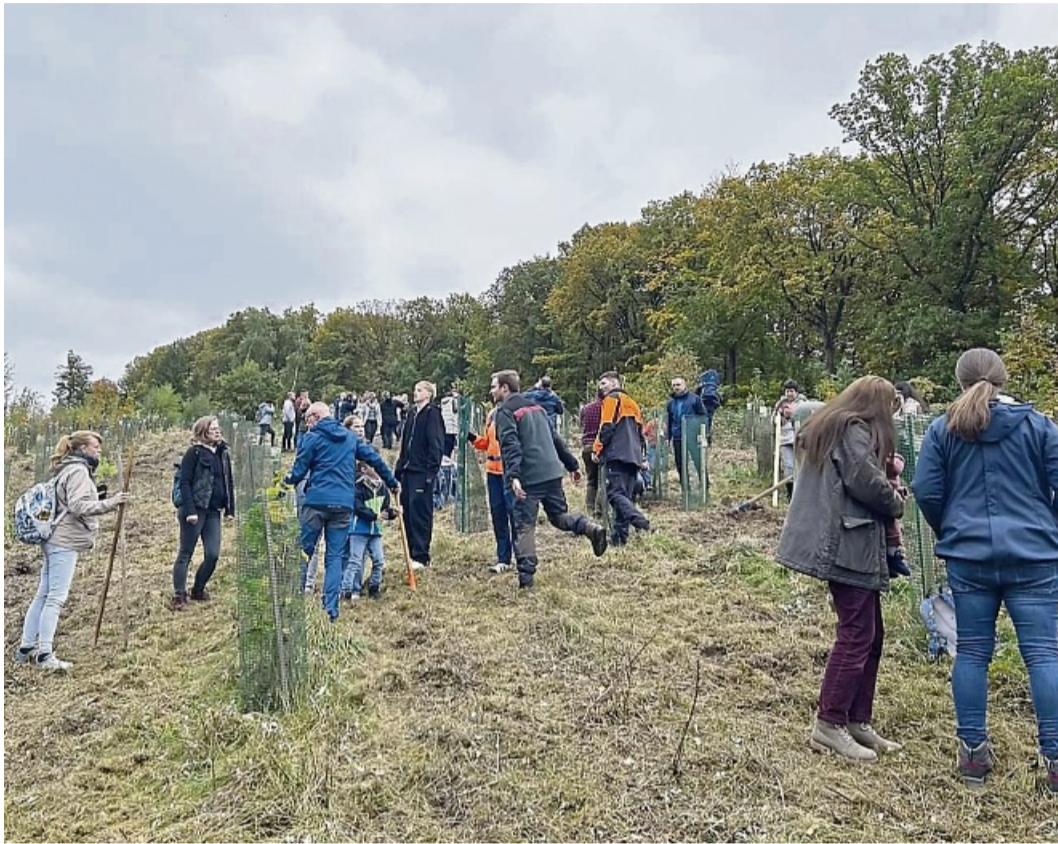
Wald-Erlebnis-Tag für Familien: Viele Familien kamen mit ihren Neugeborenen, um einen Baum zu pflanzen.

Sontra – An einem schönen Herbsttag startete am Sonntag, 12.10.2025 um 14 Uhr mit über 150 Besucherinnen und Besuchern der 6. Klimagottesdienst durch die neue Pfarrerin Susanne Leinweber unter freiem Himmel am Waldlehrhaus am Eingang des Sontraer Wald-