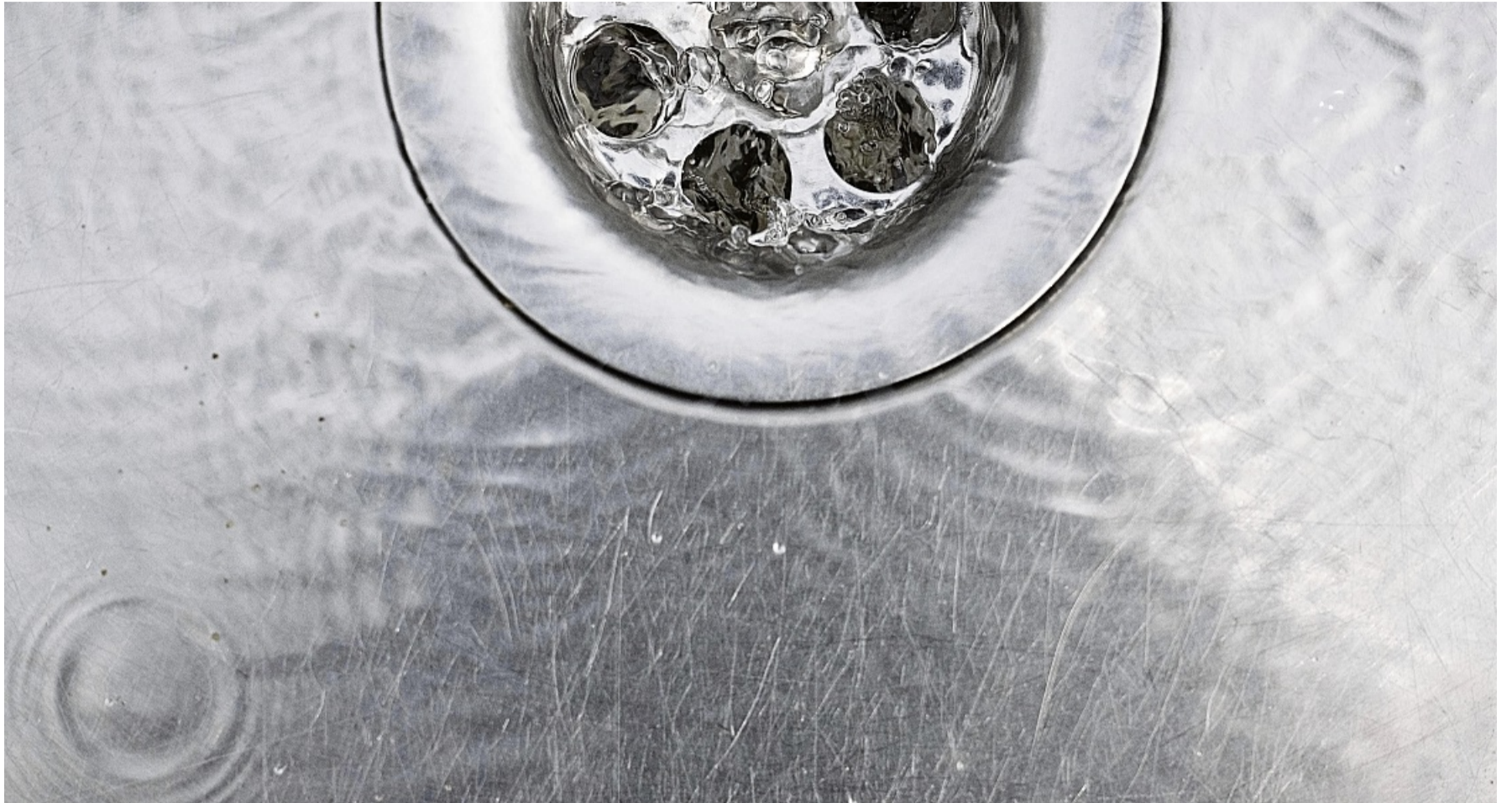
Einfach das Wasser laufenlassen – oft hilft das schon, wenn aus dem Abfluss unangenehme Gerüche aufsteigen.

Kurz nicht aufgepasst und schon ist der Ehering oder ein kleiner Gegenstand im Abfluss verschwunden. Kein Grund zur Panik! Siphons lassen sich relativ einfach abbauen. Dafür braucht man: