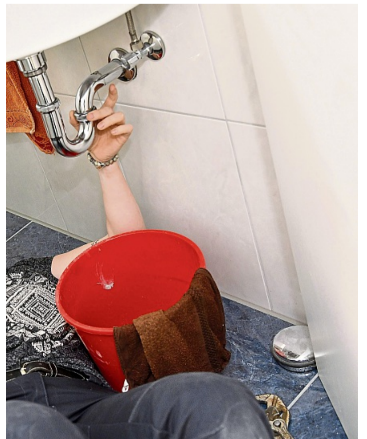
Der Ring ist im Abfluss verschwunden? Bevor man den Siphon am Waschbecken abschraubt, am besten einen Eimer darunter stellen.

Ist der Wasserdruck in der Dusche gering, liegt das häufig daran, dass der Duschkopf verkalkt ist. „Da kann es helfen, den Duschkopf abzubauen und in Essigwasser einzulegen“, rät Jens Wischmann. Wichtig: