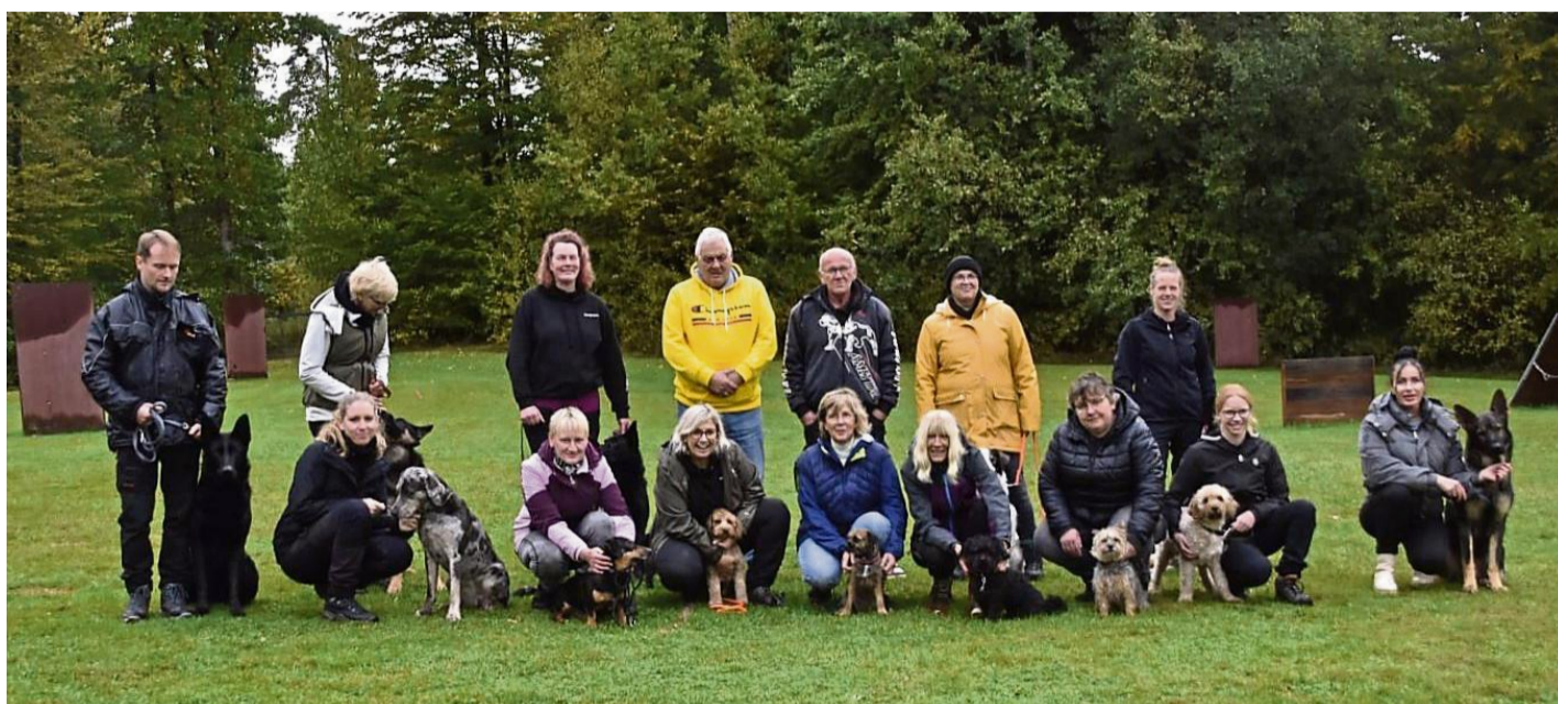
Teilnehmer der Begleithundeprüfungen beim Schäferhundeverein Frankenberg, Team Altes Forsthaus, auf dem Vereinsgelände in Schreufa.

Schuhe für lose Einlagen, Überweiten, Übergrößen und Untergrößen Schuhhaus Vach Lichtenfels-Goddelshaus • Tel. 05636/273