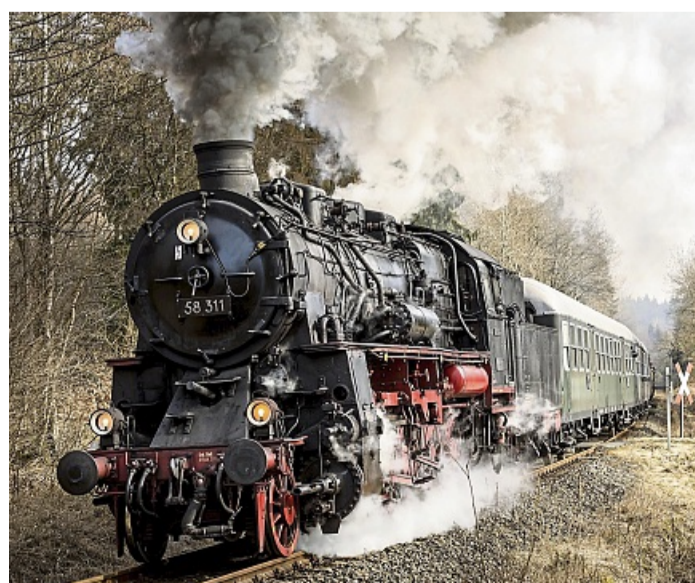
Nostalgisch: Die Sonderzüge werden von historischen Dampfloks gezogen.

Feuerlöscher liefert, prüft, füllt Schäfer-Feuerschutz Friedhelm Schäfer Sandweg 5, 35119 Rosenthal Mobil 0171 3348574 schaefer-feuerschutz@web.de Fachbetrieb für Wartung und Instandsetzung von Feuerlöschern aller Fabrikate. Neue Feuerlöscher mit Aufladetechnik (CO 2 -Patrone) – Made in Germany Wir liefern Ihnen frei Haus z. B. einen mit 6 kg ABC-Pulver 15 LE für 99,00€