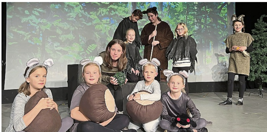
Probenszene für das Stück Rapunzel - mal ohne Prinz: Zu sehen sind die Waldtiere beim Spiel.

Der Eintritt beträgt zwei Euro. Für eine bessere Planung wird um telefonische Anmeldung unter 05691 / 2224 gebeten.