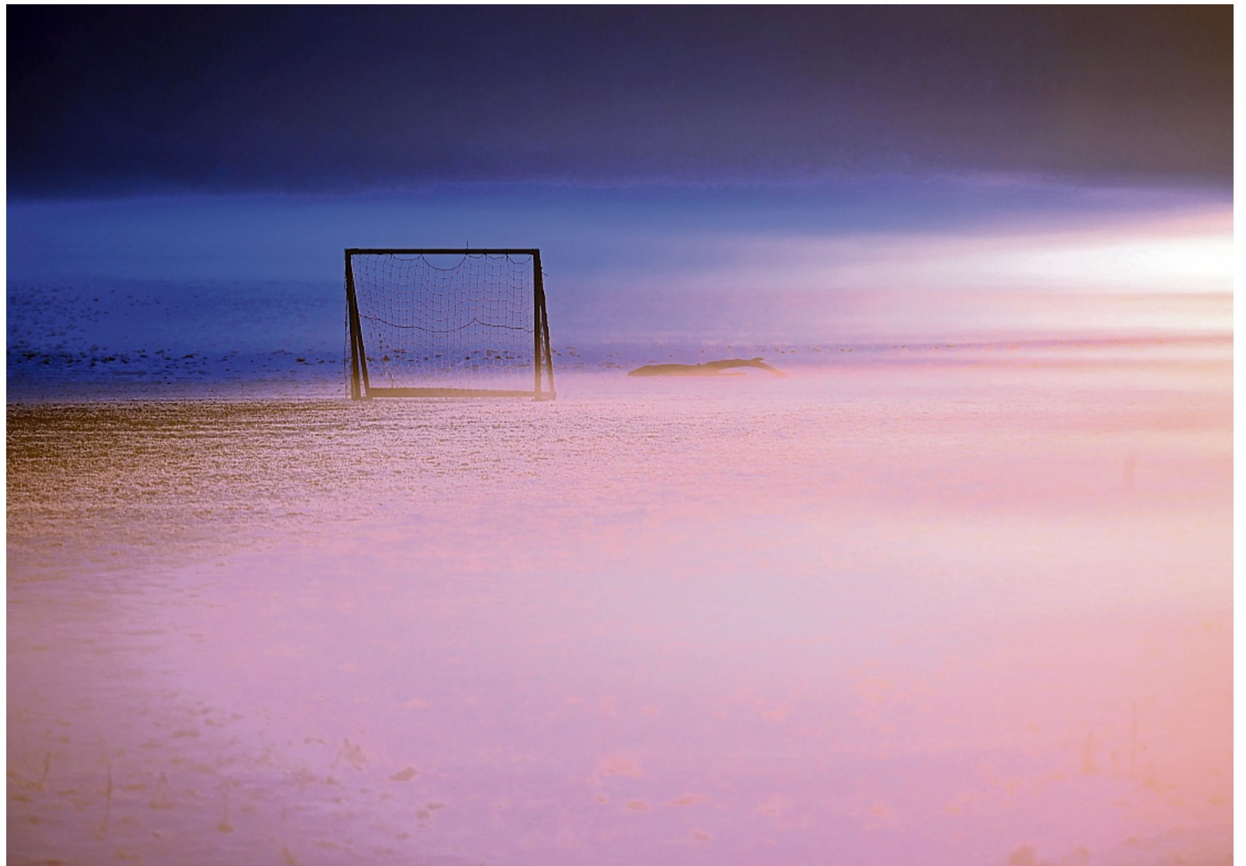
Ist da Weite oder Leere? Alleinsein kann sich unterschiedlich anfühlen.

Gerade deshalb sei es wichtig, sich das Gefühl einzugestehen. Anonyme Anlaufstellen wie die