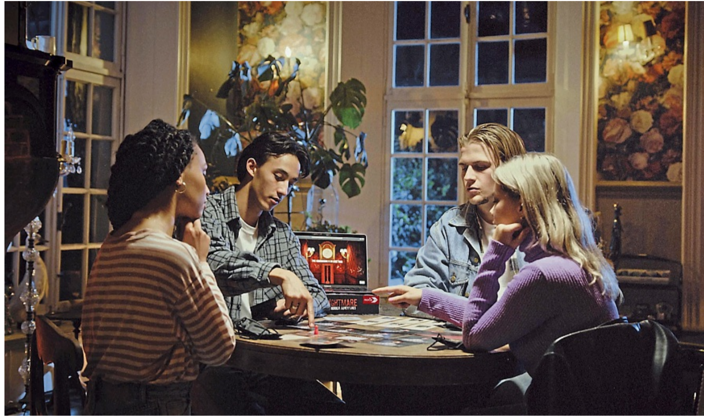
„Nightmare“ ist für 4 bis 5 Spielende ausgelegt: Mit genau 5 Personen geht es allerdings am besten. Dann kann jeder eine andere Rolle des Familienclangs übernehmen.

Jeder Spielende hat sein eigenes Deck und nimmt im Verlauf der Kampagne immer neue Karten darin auf, um so seine Fähigkeiten immer weiter zu verbessern. Neben dem bereits durchaus komplexen Grund-