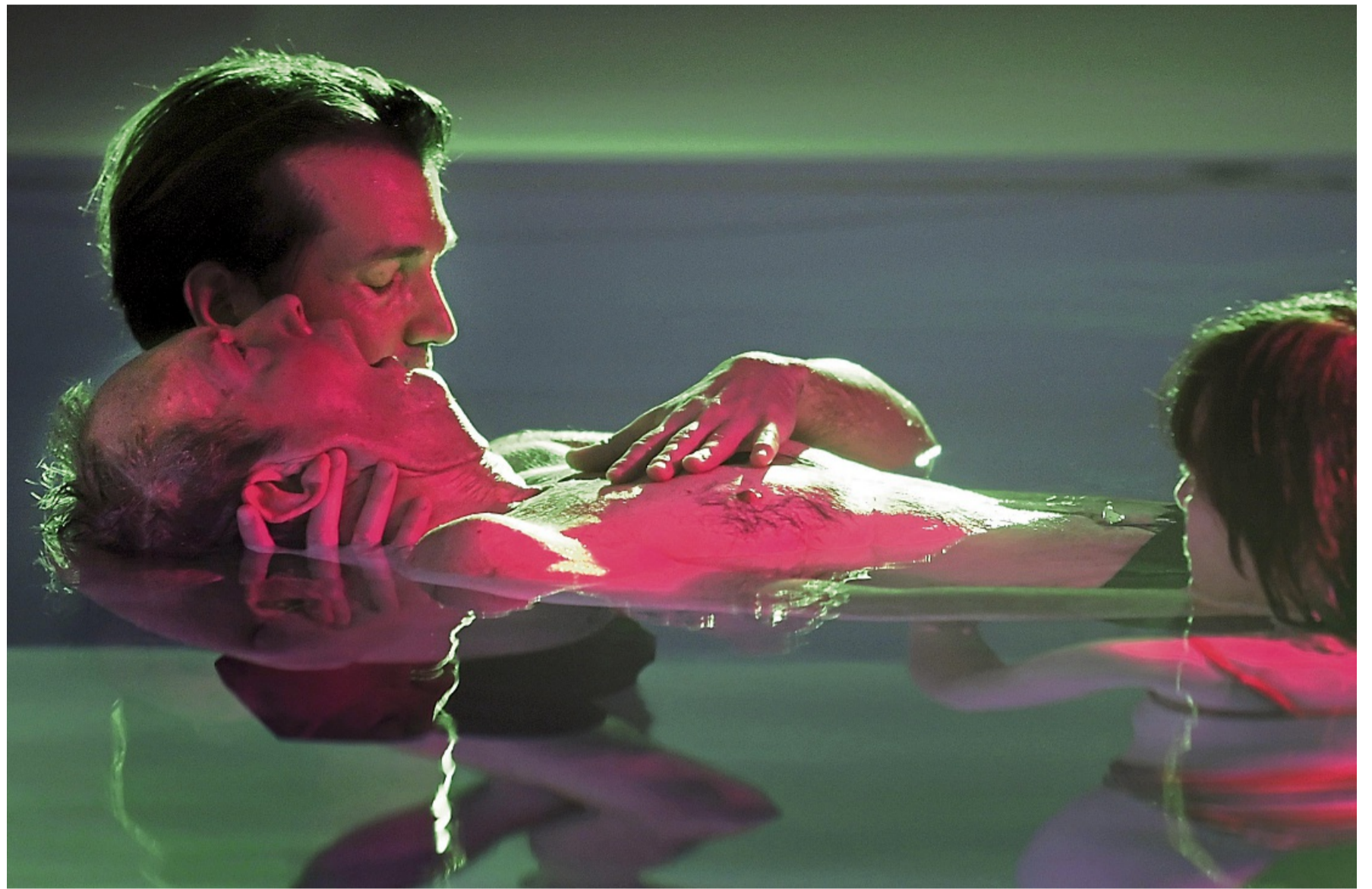
Mit Logopädie im Warmwasser in Verbindung mit Klang- und Lichttherapie erreicht der Verein „Patienten im Wachkoma“ nach eigenen Angaben häufig außergewöhnliche Verbesserungen des Allgemeinzustandes der Patienten.

Durch eine Schlucktherapie konnte die Trachealkanüle entfernt werden und wurde das Schlucken von normalem Es-