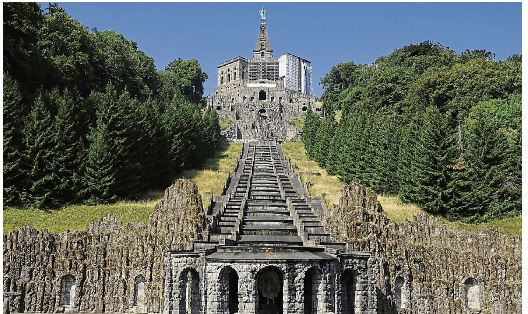
Bergpark und Herkules zählen zu den Touristenmagneten der Region.