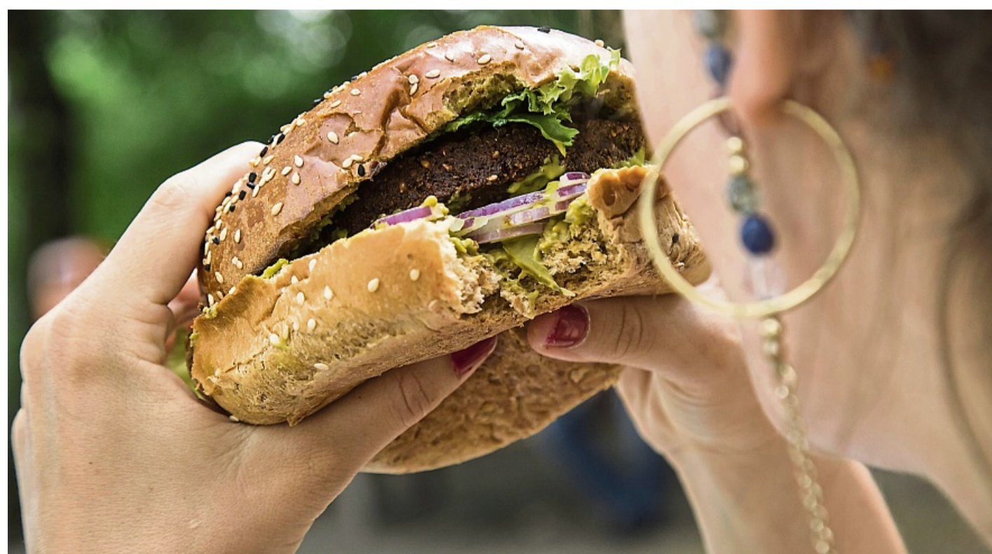
Burger statt Obst: 84 Prozent der Befragten sind der Ansicht, dass gesunde Lebensmittel an öffentlichen Plätzen schwerer zu finden sind als ungesunde Produkte.

Was gesunde Ernährungsgewohnheiten ebenfalls erschweren kann, sind unsere Gefühle und damit verbundene Muster rund ums Essen. So sagen 36 Prozent, dass sie ungesünder essen, wenn sie traurig oder enttäuscht sind. Fast ebenso