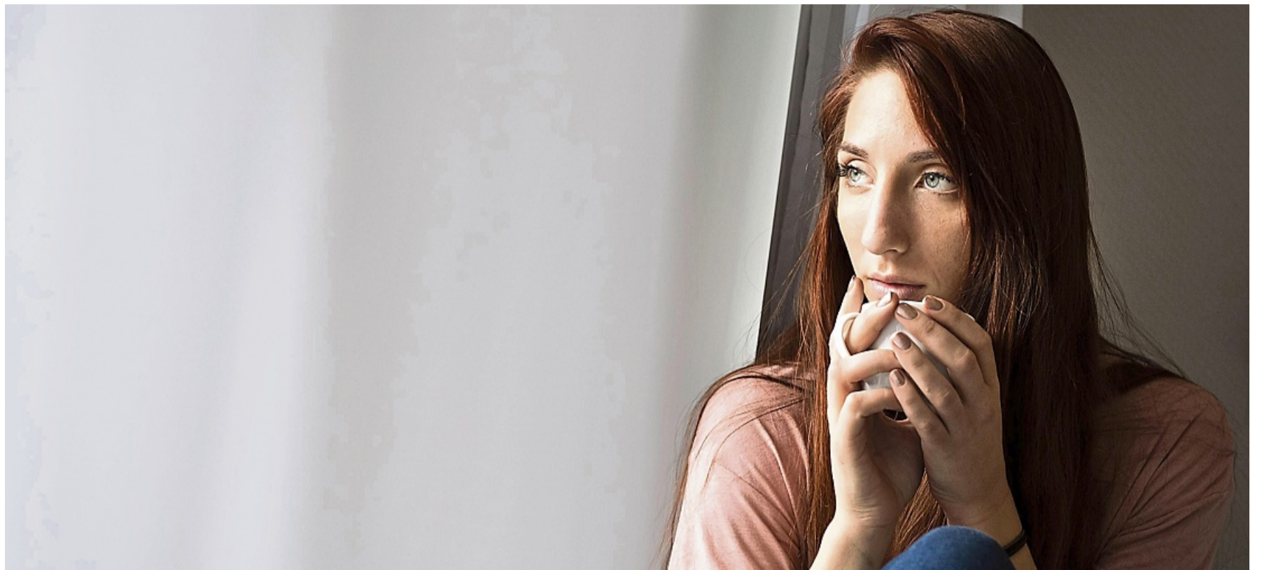
Gedanken, Empfindungen, Wünsche: Wer Ambivalenz zulässt und akzeptiert, kann zu authentischen Entscheidungen und innerer Ruhe gelangen.