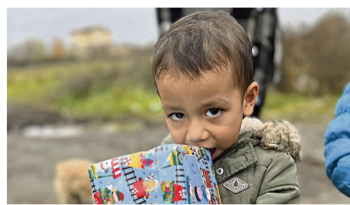
Kindern eine Freude machen: Mit der Weihnachtspäckchenaktion der Stiftung Kinderzukunft.

Die diesjährige Sammelaktion läuft vom 24. Oktober bis zum 24. November. Anschließend werden die Weihnachtspäckchen über die Stiftung „Kinderzukunft“ nach Bosnien, Herzegowina, Rumänien und – wenn möglich – in die Ukraine geschickt. Dort kommen die Päckchen bedürftigen Waisen- und Straßenkindern, kranken