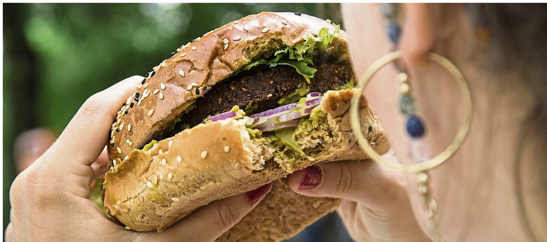
Burger statt Obst: 84 Prozent der Befragten sind der Ansicht, dass gesunde Lebensmittel an öffentlichen Plätzen schwerer zu finden sind als ungesunde Produkte.

Ebenfalls knapp drei Viertel der Befragten (74 Prozent) achten den Umfrageergebnissen zufolge darauf, regelmäßig Obst und Gemüse zu essen. Die Deutsche Gesellschaft für Ernährung empfiehlt fünf Por-