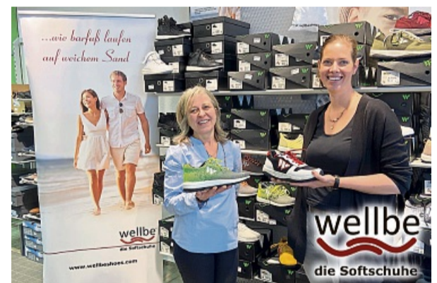
Das Team im Schuhhaus Schreier, Nikolausstraße 2 freut sich auf Sie.

Eigentlich sind sie ultra leichte, weiche Komfortschuhe mit einer sanften Aktivität in der Muskulatur. So können Füße und Gelenke natürlich stabilisiert werden.