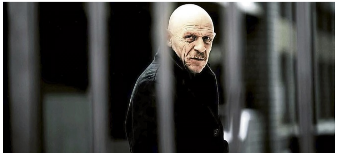
Liest in Morschen: Schauspieler Joe Bausch.