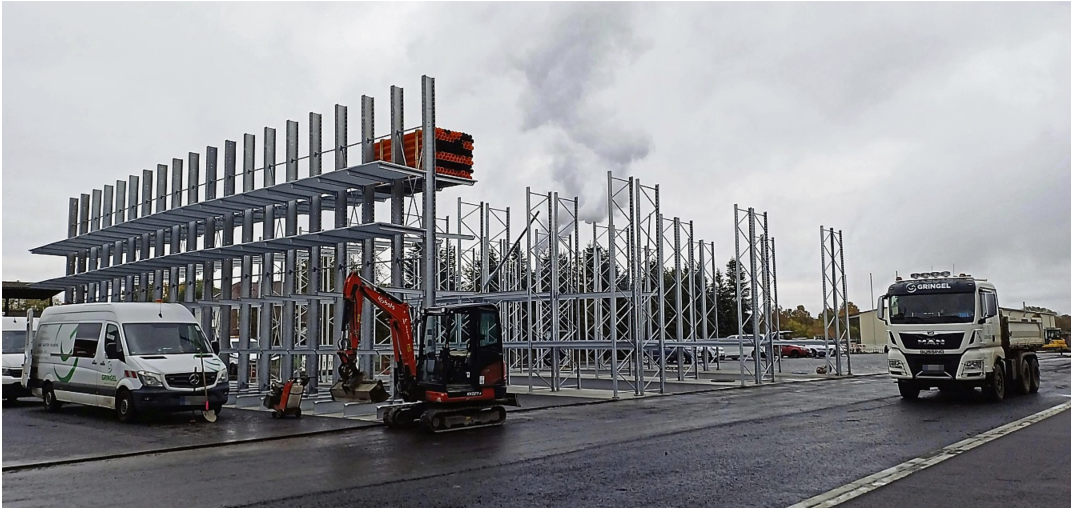
Neue Regale bieten mehr Stauraum für Baumaterialien. Im Freien sollen Baustoffe wie Pflastersteine und Rasenbordsteine gelagert werden.

FKR-Bauzentrum im Trieschweg in Wabern wurde umgebaut – Offizielle Eröffnung am Freitag