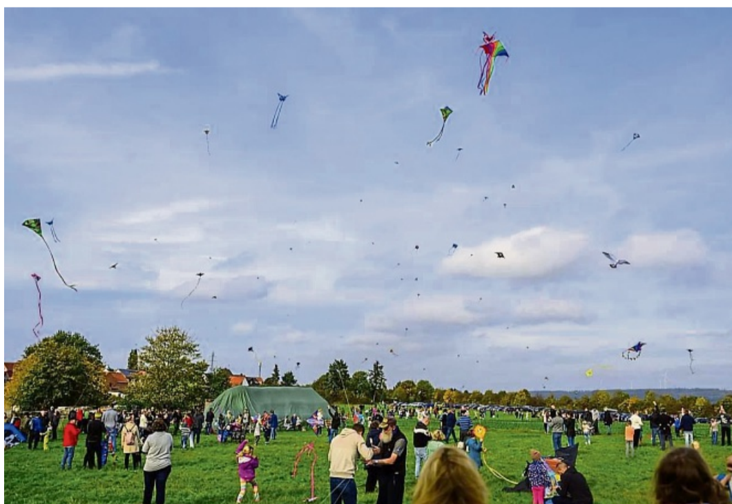
So viele Besucher wie noch nie: Bis zu 100 Drachen waren beim Ellenberger Drachenfest gleichzeitig am Himmel.