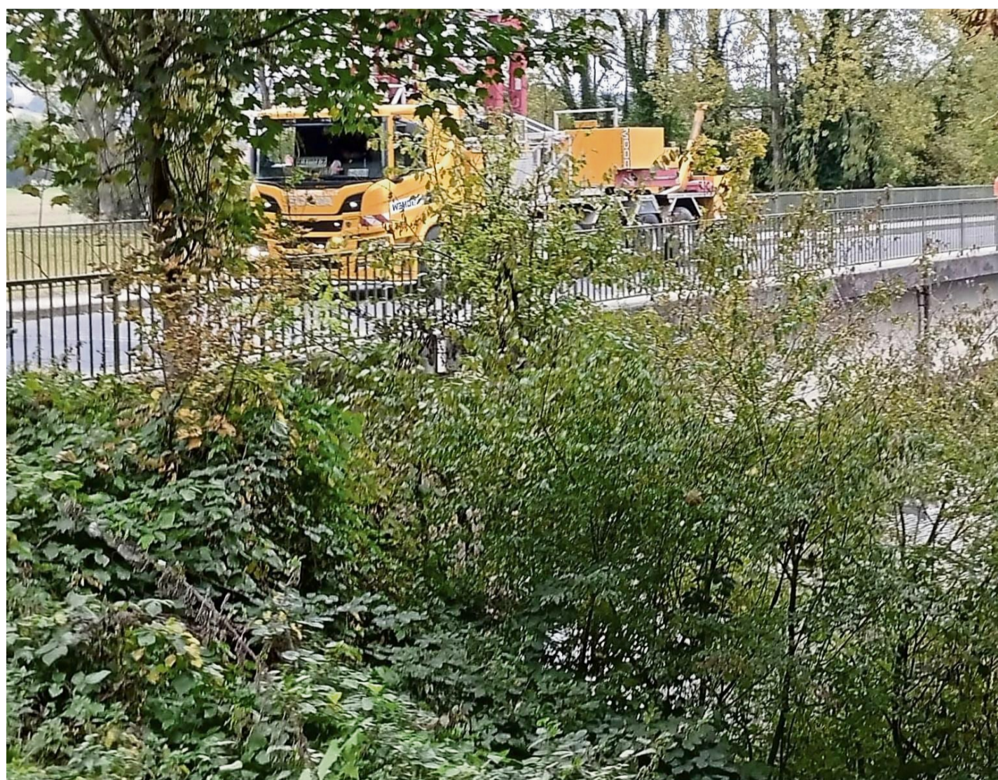
Spezialfahrzeug statt Lkw: Für die Untersuchungen am Bauwerk ist ein Brückenuntersichtgerät nötig.

Allen Beteiligten seien die Gefahren vor Ort und das mögliche Risiko – im schlimmsten Fall ein Nachgeben des Bauwerkes – bewusst. Die Personen, die sich an und auf die Brücke wagen, seien Profis, so der Sprecher weiter. Die Fachleute er-