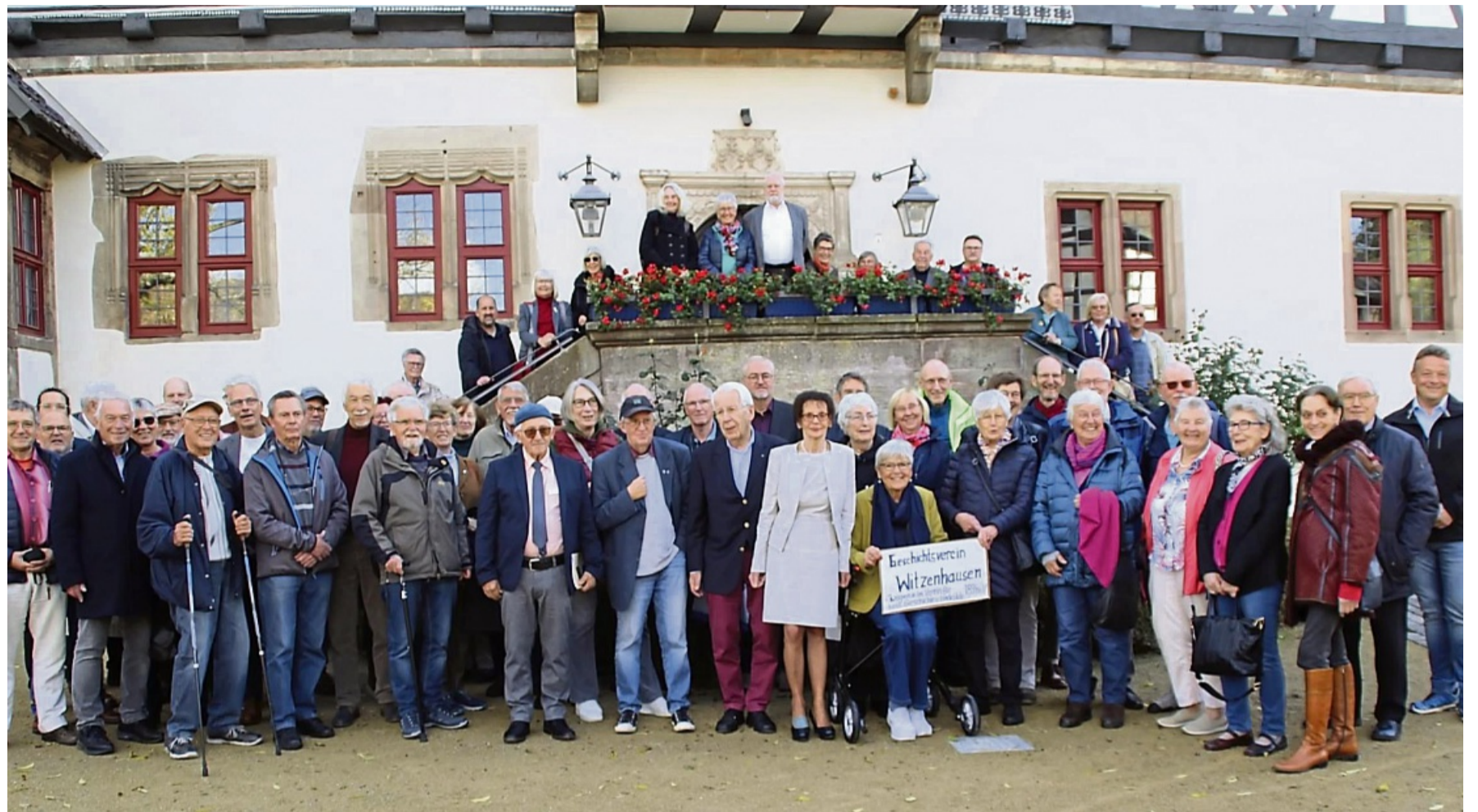
Gruppenbild im Schlosshof: Ein Teil der Tagungsteilnehmer stellte sich vor schöner Kulisse der Kamera.