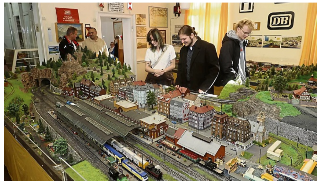
Bei der Herbstausstellung gab es für die Besucher in den Clubräumen des MEC Witzenhausen einiges zu entdecken.

Witzenhausen – Als echter Besuchermagnet präsentierte sich am Wochenende der Witzhäuser Nordbahnhof. Mit ihrer traditionellen Herbstausstellung brachten die Mitglieder des Modelleisenbahnclubs Witzenhausen (MEC) dort nicht nur Kinderaugen zum Leuchten.