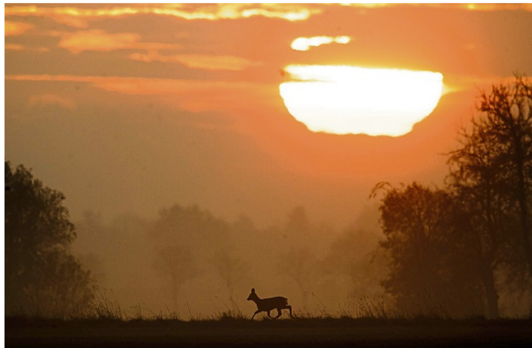
Idylle im Herbst? Gewiss, aber durch die Zeitumstellung erhöht sich auch das Unfallrisiko durch Wildwechsel.