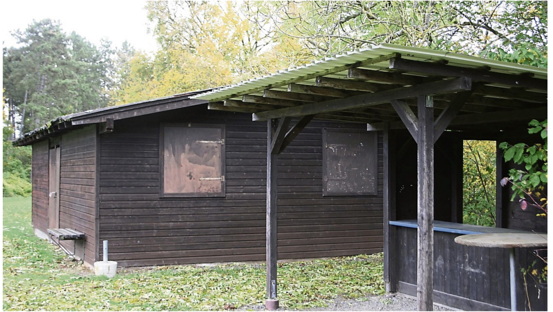
Der flüchtige Blick täuscht: Laut dem Vorsitzenden des SSV Diana Ziegenhagen ist das Umkleidegebäude eine „Ruine“.