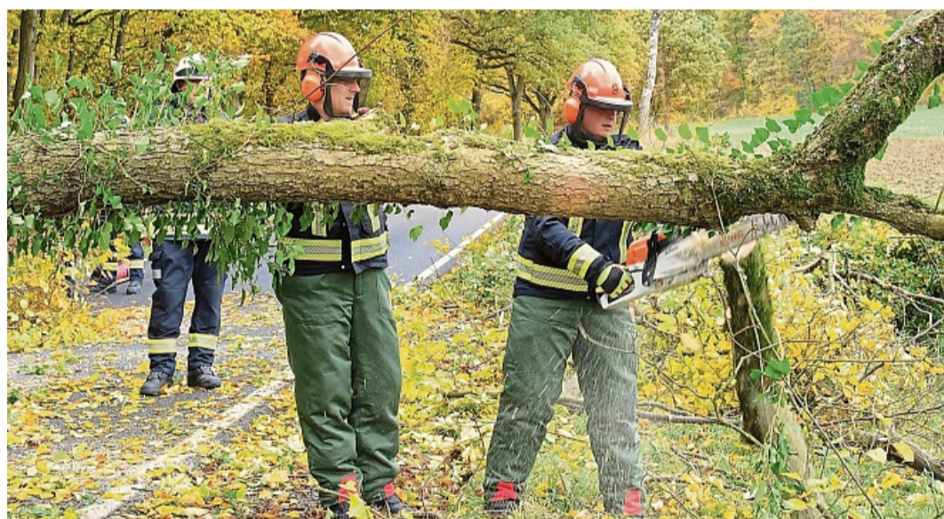
Die Zufahrt zu einer Einsatzstelle wurde durch umgestürzte Bäume erschwert. Die Einsatzkräfte mussten sich den Weg zu den Verletzten mit Kettensägen freischnitten.