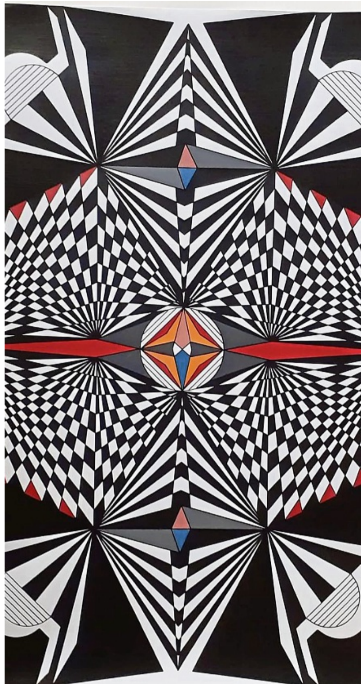
Kunst Grafik Spangenberg Hans-Dieter Krohne Op-Art Optical-Art PRIVAT

„In einem Bild muss etwas sein, das nicht hinein gemalt wurde. Mit diesem Satz verweist Krohne auf ein wesentliches Element seiner Kunst: Etwas Lebendiges muss erfahrbar sein. So wie hinter der richtig geschriebenen) Form der Buchstaben eines Textes ein Sinngehalt verborgen ist, so ist hinter