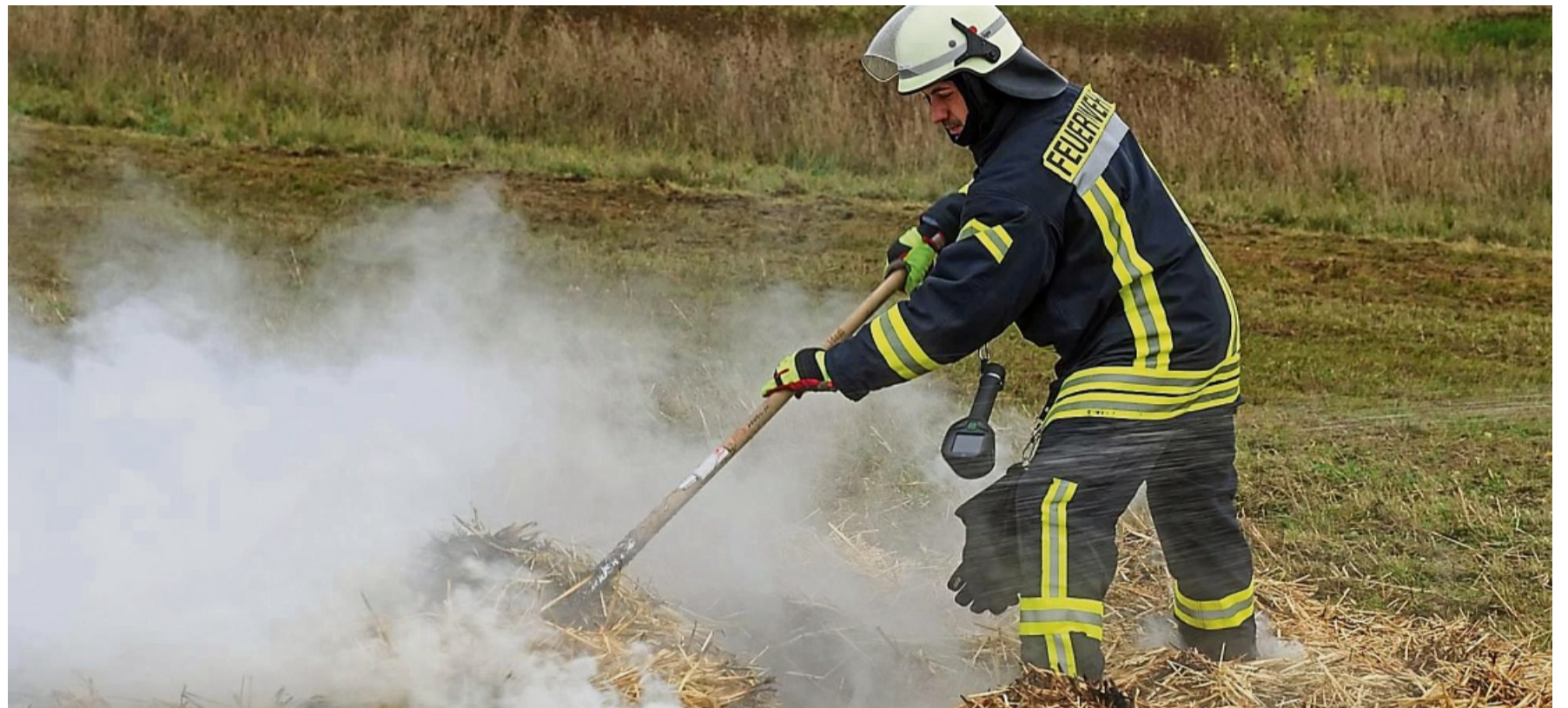
Ein Feuerwehrmann löscht ein Feuer, das innerhalb der Übung erledigt werden musste.

Der Zug aus Fritzlar wurde nach Ermetheis an eine Scheune geschickt, dort war es zu einem Blitzeinschlag gekommen. Erschwerend kam für die Fritzlarer hinzu, dass in der Scheune acht bis zehn Wanderer Schutz vor dem Unwetter gesucht haben und nun als vermisst galten. Bedingt durch die angenommene Trockenheit des Sommers musste ein Ausbreiten des Brandes auf angrenzende Baumbestände vermieden werden. Es galt neben den Rettungsmaßnahmen und dem Löscheinsatz eine Riegelstellung aufzubauen, so Martin. Der Zug aus Gudensberg wur-