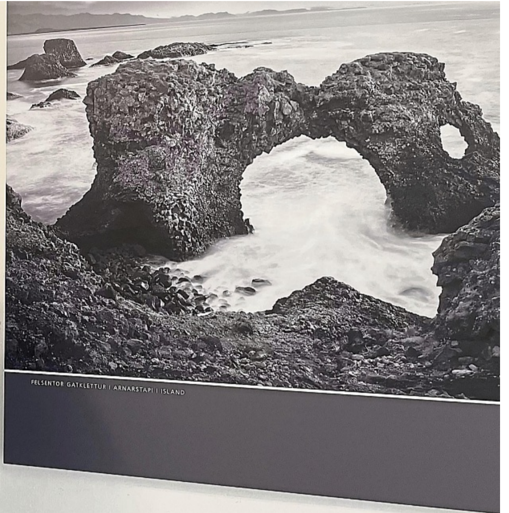
Die Faszination der Schwarzweiß-Fotografie erlebten Besucher am Wochenende im Künstlerhaus. Dort präsentierte Michael Jaeschke (Foto) aus Oedelsheim unter dem Titel „Landschaft monochrom“ eine eindrucksvolle Auswahl seiner Landschaftsfotografien.

Utahs und die algerische Sahara. Seine Fotografien verbinden künstlerischen Ausdruck mit technischer Perfektion.