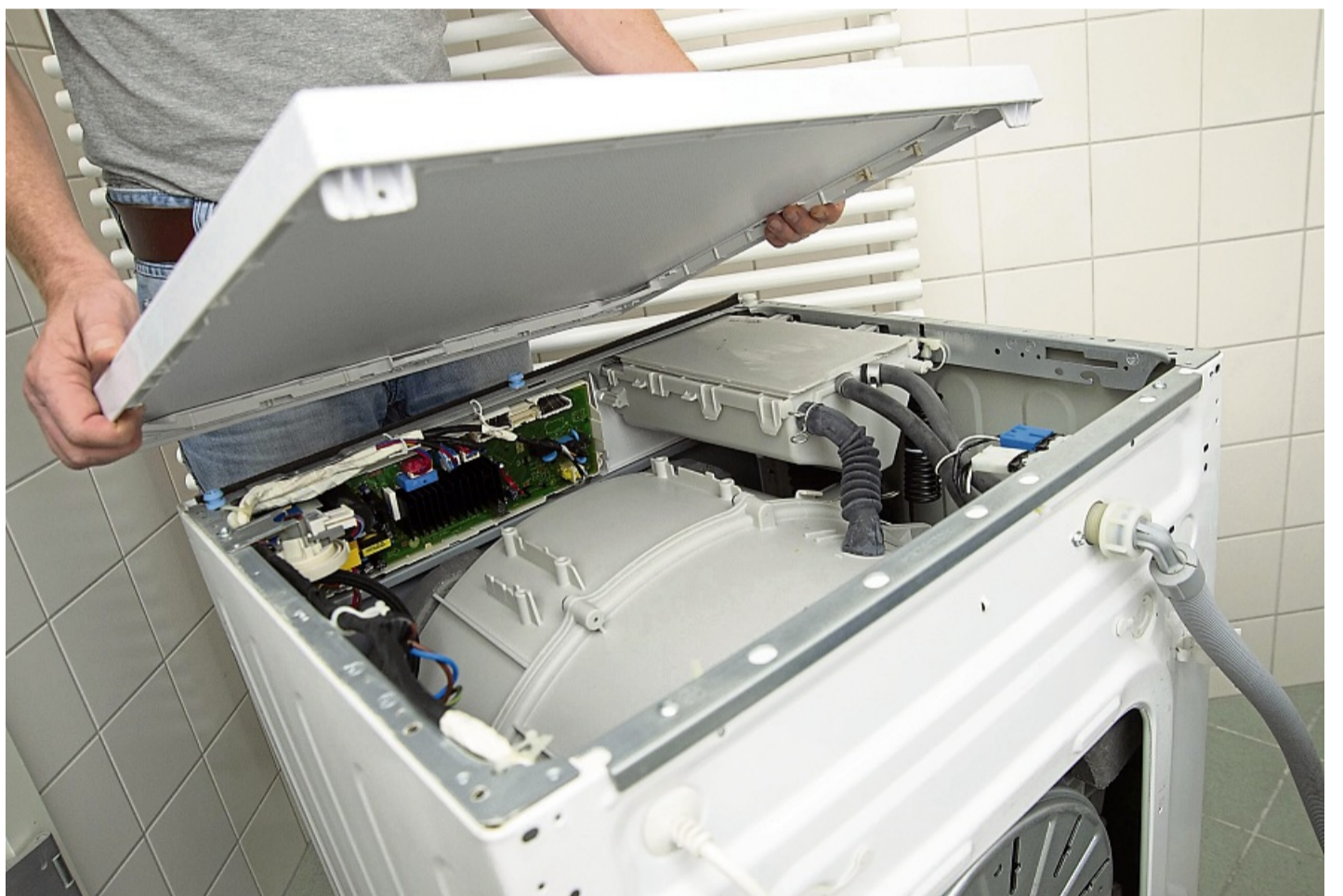
Viele gängige Bauteile lassen sich mit Standardwerkzeugen leicht austauschen: Ersatzteile müssen laut EU-Vorgaben mehrere Jahre verfügbar sein.

Vor dem Reinigen der Maschine: zur eigenen Sicherheit das Gerät ausschalten und den Netzstecker ziehen, rät die Initiative Hausgeräte+. Am bes-