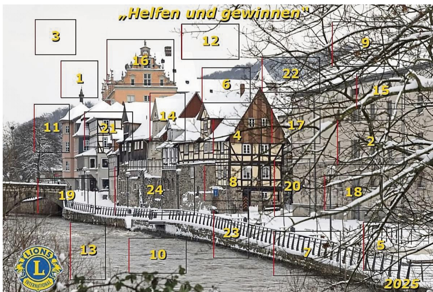
Das Bild für den diesjährigen Lions-Adventskalender „Helfen und gewinnen“ wurde von Astrid Burkhardt „Photo Burkhardt“ kostenfrei zur Verfügung gestellt.

Zusätzlich bieten die Lions den Kalender an den Samstagen 1., 8., 15. und 22. November, in der Zeit von 10 bis 13 Uhr, in ihrem Verkaufsstand an der Langen Straße an. Die 3333 Adventskalender sind durchnummeriert. Jede Nummer stellt ein Los dar. Ausgelost werden über 400 Gewinne, die von rund 70