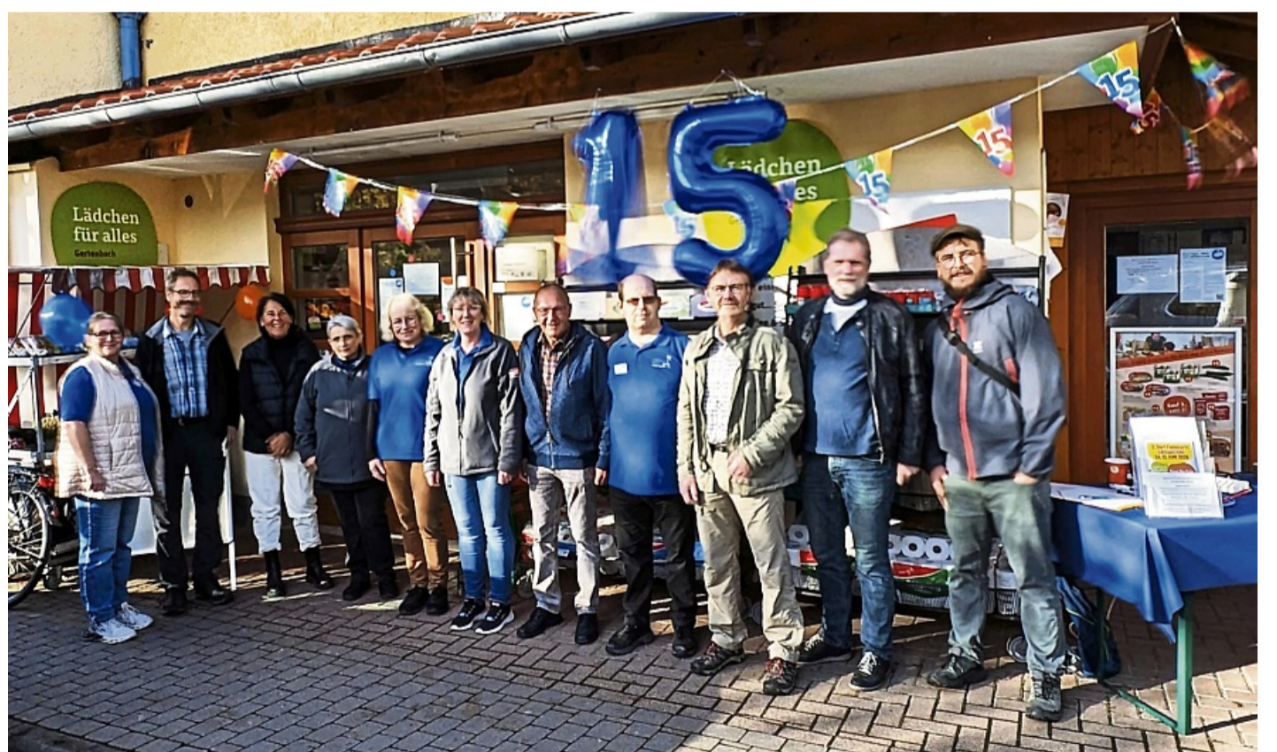
15 Jahre Lädchen für alles: Mit dem 18. Oktober konnte Gertenbach den Geburtstag seines „Lädchen für alles“ im Dorf feiern.

Gertenbach – Mit dem 18. Oktober konnte Gertenbach den 15. Geburtstag seines „Lädchen für alles“ im Dorf feiern. Von Morgens bis Mittags hatten das Lädchen-Team und die Vereinsmitglieder die Kunden mit verschiedenen Aktionen begrüßt, teilt der Verein „Dorfladen für Gertenbach“ in seinem Bericht mit. Im Laden konnten regionale Produkte probiert werden, wie beispielsweise Kirschwein, Kirsch-Secco und Kirschsaft, verschiedene Käsesorten aus dem Nachbardorf und eine Wurstauswahl auf leckerem Brot. Draußen vor dem Laden lockte der Duft frischer Waffeln nicht nur Jung und Alt an, sondern auch den Ortsbeirat. Der Vorstand des Dorfladenvereins verteilte Flyer, um auf den nächsten Erste-Hilfe-Kurs in Gertenbach am Samstag, 22. November, hinzuweisen. Auch bei diesem werden die Pausengetränke und der Imbiss auch aus dem Lädchen kommen, ist dem Bericht zu entnehmen. Daneben wurde der diesjährige „lebendige Adventskalender“ beworben, in den sich schon viele Aktive aus Gertenbach mit vielfältigen Angeboten eingetragen haben. Ab Mitte No-