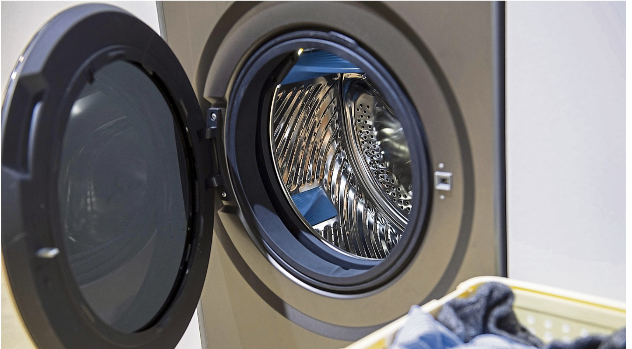
So wird Schimmelbildung effektiv vorgebeugt: Wer nach dem Waschen die Tür und das Waschmittelfach offen lässt, ermöglicht der Restfeuchte, zu entweichen.

Eine gut gepflegte Waschmaschine hält länger, schont den Geldbeutel und die Umwelt