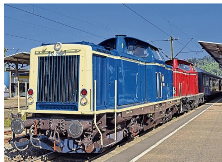
Unterwegs wie früher: Der Verein Eisenbahn-Nostalgiefahrten-Bebra bietet einen Tagesausflug im historischen Sonderzug an.

Hersfeld, Bebra, Melsungen, Kassel-Wilhelmshöhe, Hann. Münden, Witzenhausen Nord und Göttingen. Gezogen wird der Zug von gleich zwei historischen Diesellokomotiven der Baureihe V100. Die eingesetzten Reisezugwagen bieten in der 2. Klasse Plätze auf mit Kunstleder gepolsterten Bänken und in der 1. Klasse auf mit Stoffgepolsterten Sitzen. Fahrkarten sind ab 75 Euro erhältlich.