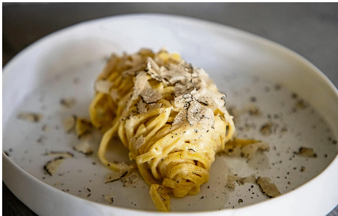
Hier ist der Trüffel der Star und braucht nicht viel Beiwerk: Über die Tagliatelle wird der Trüffel hauchdünn geraspelt.

Da man oft nur die Chance hat, Trüffel online zu ordern,