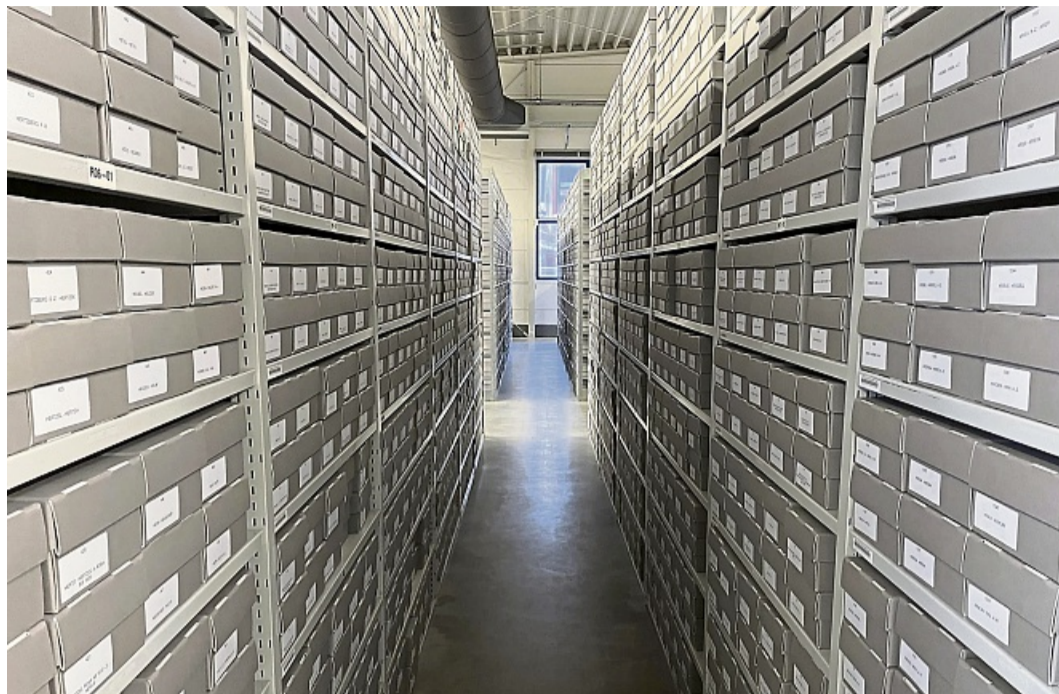
Bad Arolsen: Landesweite Gedenkveranstaltung zum 80. Jahrestag der Befreiung von Auschwitz. Dokumente im Arolsen Archives.

Ziel des Neubaus ist die zentrale, archivgerechte und nachhaltige Sicherung der wertvollen Aktenbestände.