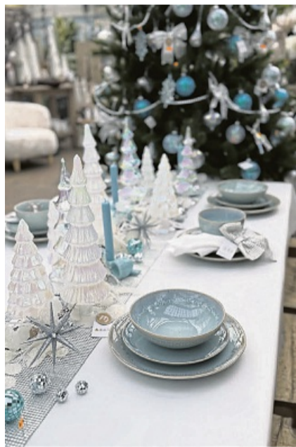
Die Meckelburg Gartencentern verwandeln sich wieder in ein stimmungsvolles Winterparadies.

Sanfte Schneetöne, funkelnder Glitzer und liebevoll arrangierte Eisbärfiguren bringen die Magie des Winters direkt in jedes Zuhause. Ein besonderer Hingucker sind die Nostalgie-Anhänger für den Tannenbaum: aus feinem Metall gefertigt, wunderschön bedruckt im Stil der 1900er- bis 1920er-Jahre. Sie erzählen kleine Geschichten vergangener Weihnachten – charmant, elegant und voller Erinnerungen. Für alle, die Natürlichkeit lieben, zeigt das Gartencenter in diesem Jahr viele Artikel aus Naturmaterialien: gefilzte Figuren, liebevolle Schneemänner und Dekorationen mit warmem Charakter. So entsteht ein harmonischer Mix aus Tradition