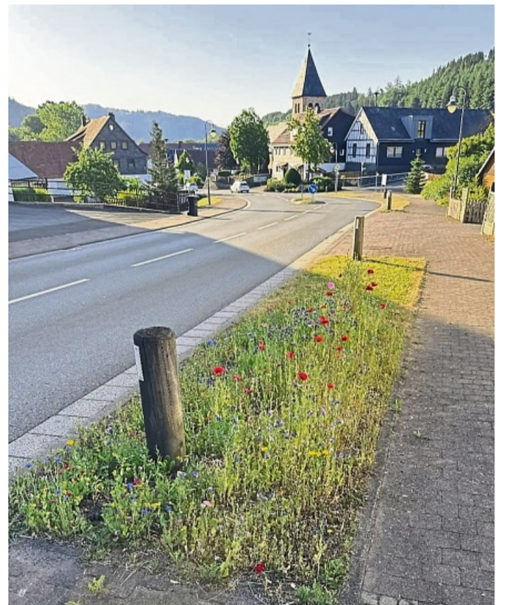
Ein kleiner Schritt zur Klimaanpassung sind Blühstreifen wie in Neerdar, die zu stabilen Ökosystemen beitragen.