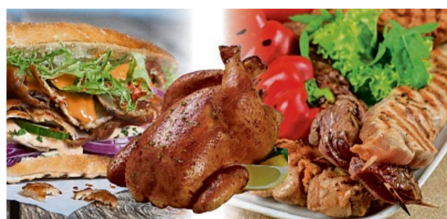
Knuspriges, saftiges Fleisch in vielen Variationen und einer Vielfalt an frischem Gemüse bieten der Berliner Grill und das Berliner Grill Haus.