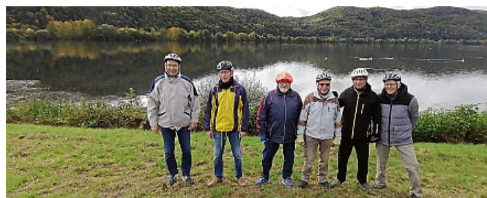
2025 am Affolderner See.

Ab April wird das Fahrrad benutzt. Mit dem E-Bike werden Entfernungen zwischen 40 und