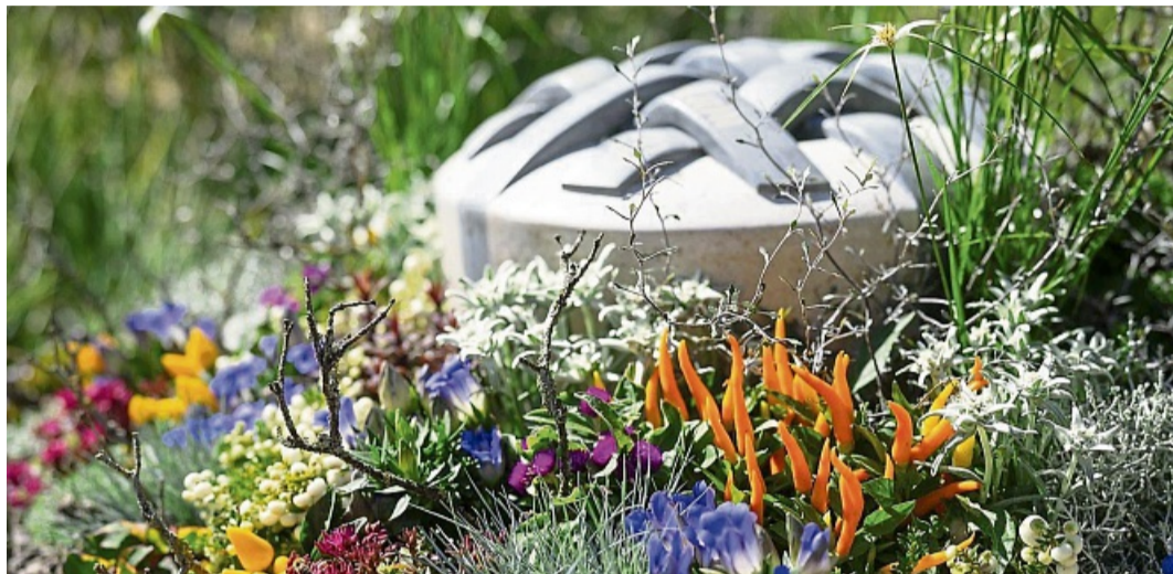
Die Preise bei einer Bestattung sollten mit den erbrachten und vereinbarten Leistungen in Einklang stehen.

Am Ende geht es darum, den Trauerprozess mit Respekt und Würde zu begleiten – und das kann nur durch ein Bestattungsunternehmen geschehen, das Vertrauen aufbaut und eine transparente, faire Preisgestaltung bietet. Die Frage nach den Kosten sollte von Beginn an geklärt und schriftlich festgehalten werden, damit Hinterbliebene in dieser schweren Zeit keine bösen Überraschungen erleben.