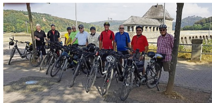
Schnappschuss der Gruppe 2018 an der Sperrmauer.