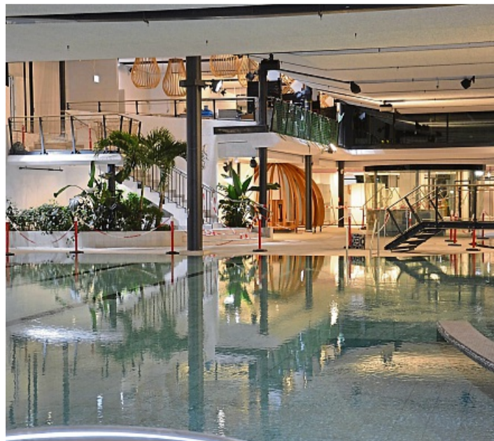
Eine Stunde in einem der Lagunenbadbecken können die Teilnehmerinnen und Teilnehmer des Belastungstests verbringen.

Interessenten werden gebeten, sich ausschließlich über E-Mail an kurbetrieb@willingen.de zu melden; die Teilnahme wird mit einer Antwort bestätigt. Es ist an diesem Tag auch ein Fotograf vor Ort, der Fotos für Werbezwecke macht – somit muss jeder Gast einer Datenschutzerklärung unterschreiben. wf