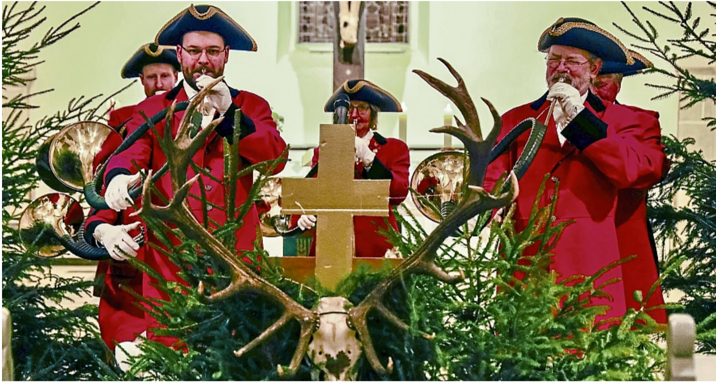
Das Parforcehorn-Bläsercorps aus Vöhl hatte sich rund um den Altar postiert.

Falkner und Jagdhornbläser sorgen für festliche Stimmung in vollem Gotteshaus