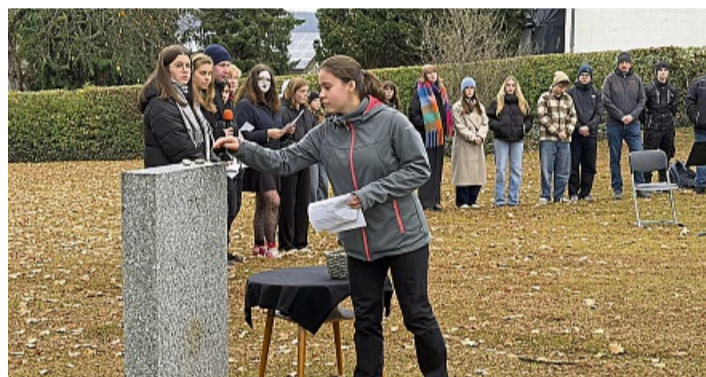
Das Steinritual an jüdischen Grabmalen ist Ausdruck der Trauer und Zeichen des Erinnerns an die Verstorbenen. Die Schüler erinnerten damit an die letzten zehn jüdischen Mitbürger, die am 8. November 1938 in Arolsen wohnten.