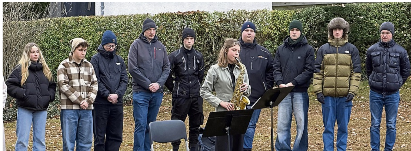
Musikalische umrahmt und inhaltlich mitgestaltet wurde die Gedenkveranstaltung auf dem jüdischen Friedhof von Schülern der Christian-Rauch-Schule. Mit dabei: der Chor unter Leitung von Steffen Hause und Solistinnen.

Viele seien der Erinnerung überdrüssig. Schließlich seien mit der Erinnerung viele traurige und unangenehme Fragen verbunden. Das ändere aber