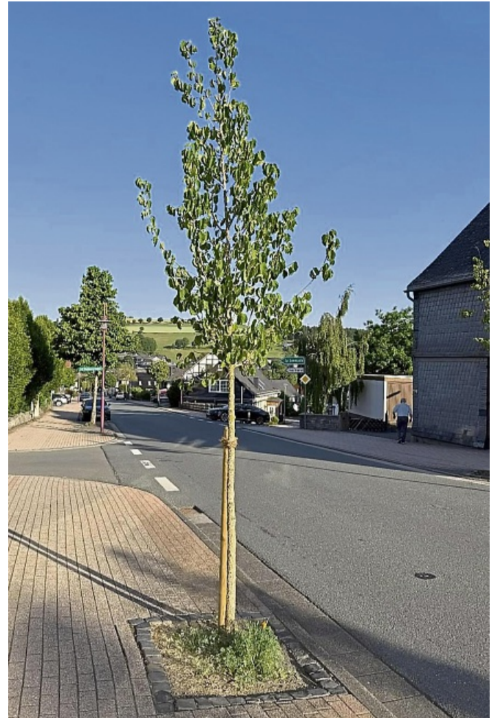
Die Straßenbäume in Usseln haben zu wenig Platz, um sich steigender Hitze zu erwehren.

Es gebe dabei viele Themengebiete, an denen er und die Verwaltung arbeiten. Das führt vom Energiemanagement in den Gebäuden über Strategien zu Photovoltaik auf Dächern und Freiflächen sowie Windenergie bis zur kommunalen Wärmeplanung, die beim Landkreis liegt. Effizienzsteigerungen in Kläranlagen und Wasserversorgung sowie Straßenbeleuchtung, eine Elektrifizierung des Fuhrparks, eine Stärkung von ÖPNV und Radwegenetz zählen ebenso dazu wie naturnahes Grünflächenmanagement und Maßnahmen zur Klimaanpassung. Letztlich sei auch die Starkregengefährdung zu beachten. Und die Gemeinde müsse klimaangepasst planen und beschaffen, die Öffentlichkeit mitnehmen und ihre Anstrengungen verstetigen. Klar sei: „Wir werden einige Wutbürger aushalten müssen.“ WILHELM FIGGE