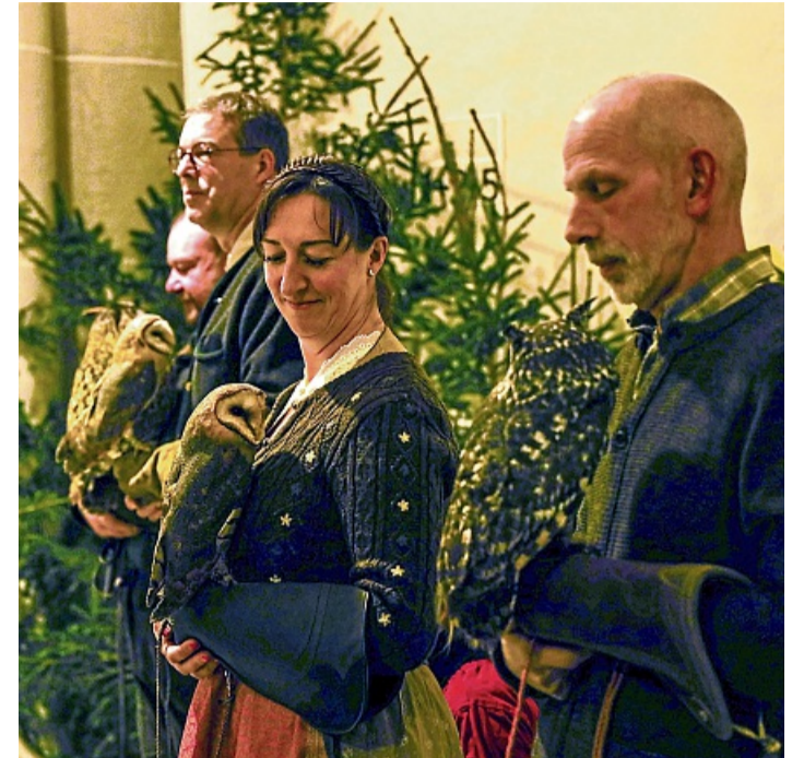
Echte Hingucker waren die Greifvögel, die von Falknern in der forstlich geschmückten Landauer Kirche präsentiert wurden.

Bad Arolsen-Landau – Eine festliche Hubertusmesse zu Ehren des Schutzpatrons der Jagd wurde am Sonnabend in der festlich geschmückten Kirche der Bergstadt Landau gefeiert.