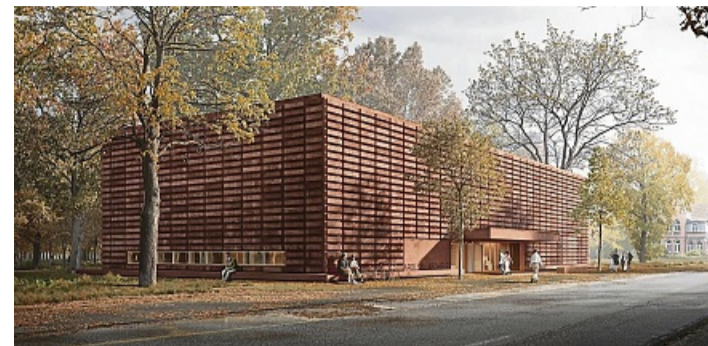
Ausgewählt im Architektenwettbewerb: Eine moderne Fassade aus rot eingefärbten Betonfertigteilen, die an Schachteln und Archivboxen erinnert: So wird das neue Gebäude der Arolsen Archives aussehen.

Während der Bauzeit wird es unvermeidlich zu Belastungen