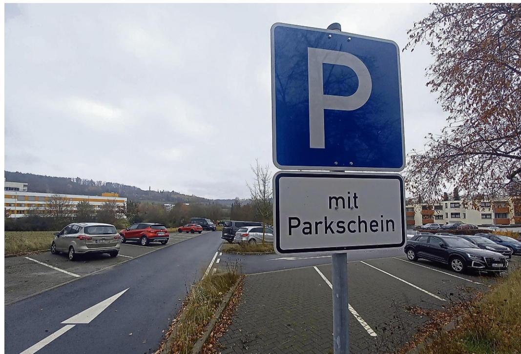
61 Stellplätze stehen ab sofort der Öffentlichkeit auf dem ehemaligen Klinik-Parkplatz an der Quellenstraße in Reinhardshausen zur Verfügung.

Sowohl im „Kreuzfeld“ als auch auf dem Parkplatz an der Quellenstraße werden Parkscheinautomaten aufgestellt. Beide Flächen werden der „Zo-