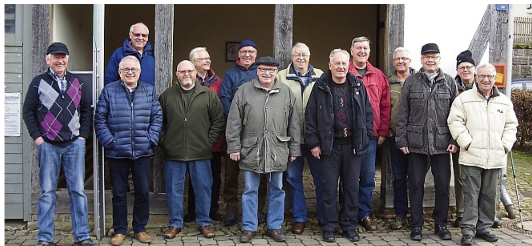
Die Rad- und Wandergruppe auf einem Foto von 2017