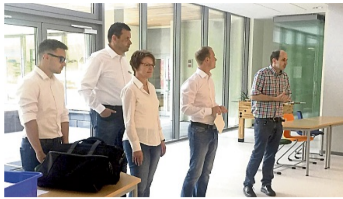
20. BKK Werra-Meissner Bewerbungstraining an der Adam-von-Trott-Schule in Sontra.

„Ziel des BKK-Bewerbertrainings ist es, dass die Lernenden der 10. Klassen die verschiedenen Aspekte eines Bewerbungsverfahren nicht nur kennenlernen, sondern sie selbst einen Bewerbungstest, ein Bewerbungsgespräch und Rollenspiele dazu mit den Coaches der BKK üben bzw. simulieren. Im Anschluss an die Rollenspiele und die Vorstellungsgespräche werden diese gemeinsam reflektiert und Ideen entwickelt, wie der Einzelne sich individu-