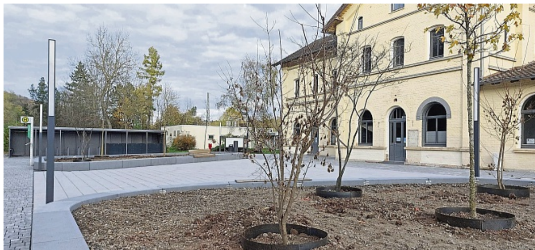
Feierliche Einweihung: Sehr einladend wurde der neue Bahnhofsvorplatz gestaltet.

Die beauftragten Bauleistungen für die Umgestaltungs-