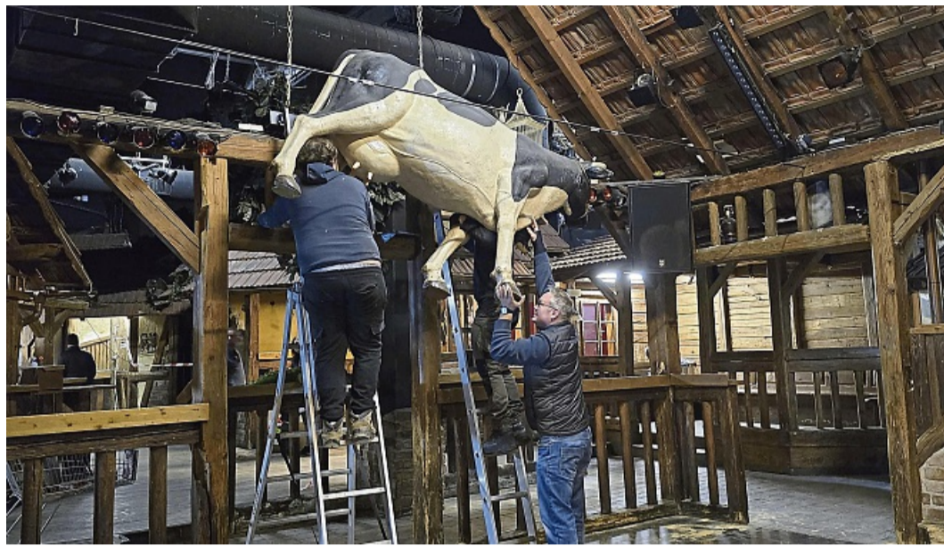
Das Inventar der ehemaligen Diskothek Mausefalle und Amadeus in Eschwege wird verkauft, am 11. November 2025 erlebt die Disko ihren letzten großen Ansturm