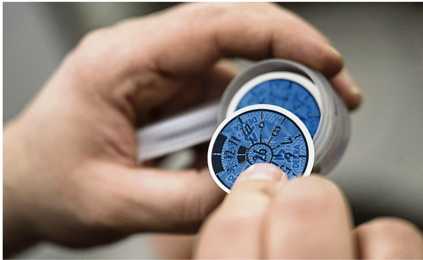
Unter anderem die Farbe der Prüfplakette gibt an, wann die nächste HU fällig ist: Nach Orange für 2025 folgen Blau, Gelb, Braun, Rosa und Grün.

Die Jahreszahl der Fälligkeit ist auch immer als zweistellige Zahl in der Mitte der Plakette – „26“ als Beispiel steht für „2026“. Durch zusätzliche Balken und gegen den Uhrzeigersinn angeordnete Zahlen von „1“ bis „12“ lässt sich die Plakette ähnlich wie das Ziffernblatt einer Uhr lesen. Sie ist stets so aufgeklebt, dass auf der 12-Uhr-Position eine Zahl für den Monat der Fälligkeit oben steht. Eine „8“ etwa weist auf den achten