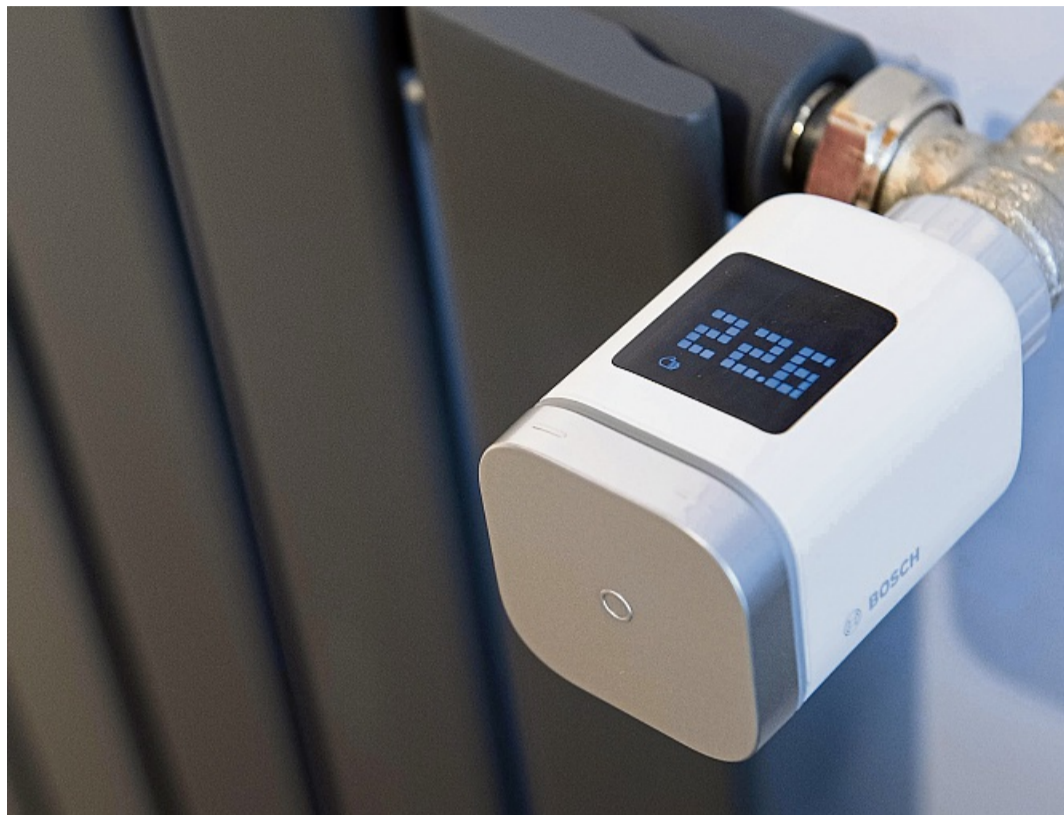
Statt ständigem Hoch- und Runterdrehen: Wer die Heizung konstant auf niedriger oder mittlerer Stufe einstellt, kommt energiesparender durch den Winter.

Nicht alle Zimmer müssen die gleiche Temperatur haben. Es lohnt sich Lau zufolge darüber nachzudenken, wie intensiv und wofür man einen Raum