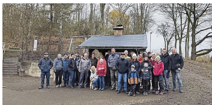
Arbeitseinsatz durch den Heimatverein und Ortsbeirat: Von jung bis alt – in Hornel wird aktiv beim Arbeitseinsatz mit angefasst.

Hierzu bedankt sich der Heimatverein und Ortsbeirat bei allen Aktiven sowie der Gerätestellung von Radladern und Traktoren mit Hängern.