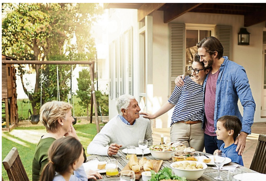
Eltern können Streitigkeiten um das Erbe vermeiden , indem sie klug vorsorgen und ihren Nachlass sorgfältig regeln - organisatorisch wie finanziell.

Wie hoch diese ist, entscheidet der Verwandtschaftsgrad. Bei verheirateten Paaren und eingetragenen Lebenspartnern können 500.000 Euro