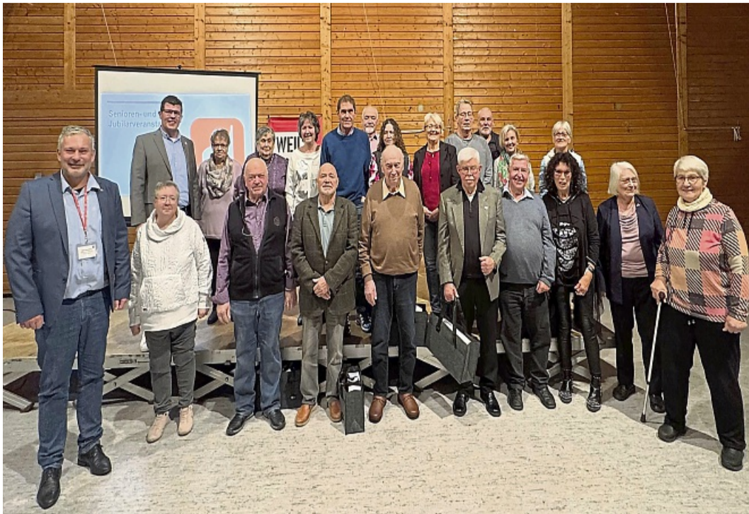
Kamen zusammen: Die geehrten Mitglieder des IGBCE-Bezirks Kassel.