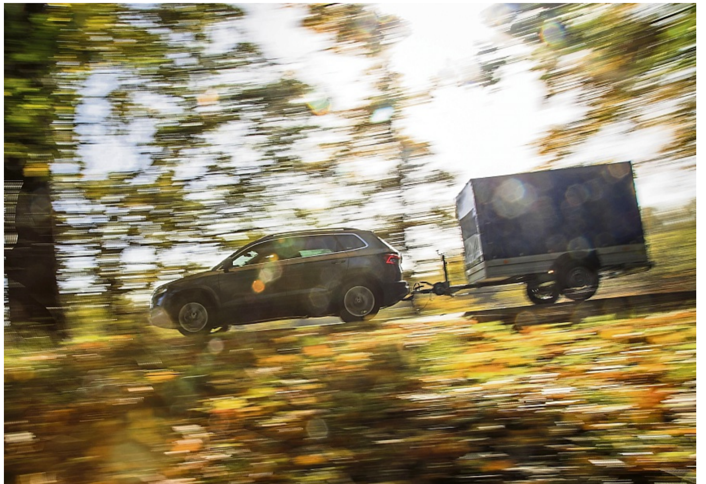
Planung und Preisvergleich lohnen sich. Wann ist der Umzug mit dem eigenen Auto, mit einem Miet-Transporter oder per Umzugsunternehmen sinnvoll?

Für die eigene Sicherheit und um Schäden zu vermeiden, lieber häufiger fahren. Denn es ist wichtig, dass man sein Auto richtig belädt. Die Straßenverkehrsordnung (§ 22 StVO) schreibt dazu klare Regeln vor: