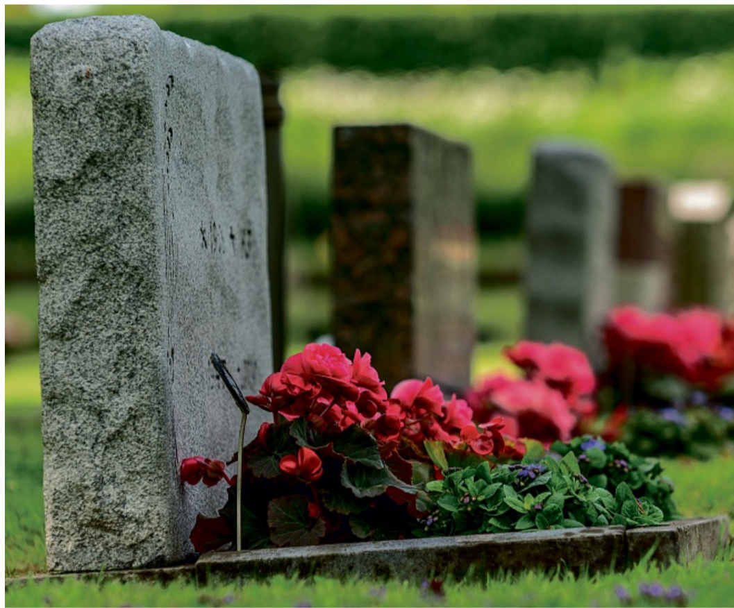
Gepflegte Ruhestätte: Eine schöne Grabpflanzung drückt Liebe und Gedenken aus.