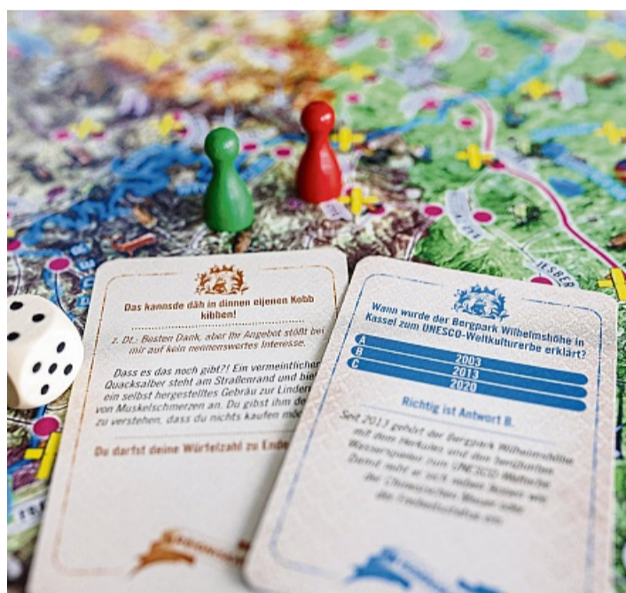
Um ins Ziel zu kommen, müssen Spieler sowohl Ereigniskarten (links) als auch Wissenskarten (rechts) ziehen.

warten auf die Ausflügler Ereigniskarten und damit auch einige Herausforderungen: blockierte Wege, geklaute Räder und Unfälle behindern die Fahrt. Auch wie gut die Spieler die Wissensfragen über die Region beantworten, entscheidet, wie schnell sie vorwärtskommen.