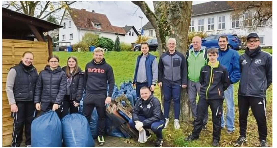
Zeigte Umweltverantwortung: Auch der TSV Obermelsungen machte mit beim Tag der Stadt- und Landschaftspflege.