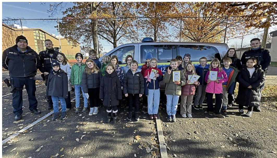
Machten mit bei Blitz for Kids: Die Schulkinder der Klasse 3a mit den Beamten der Verkehrsinspektion der Polizeidirektion Schwalm-Eder.