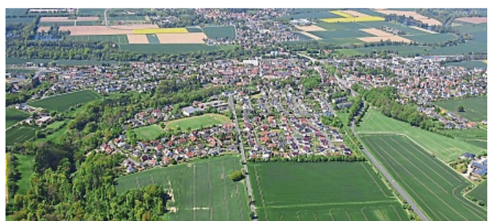
Das Ortsgericht Felsberg II , unter anderem zuständig für Gensungen, sucht einen neuen Schöffen.