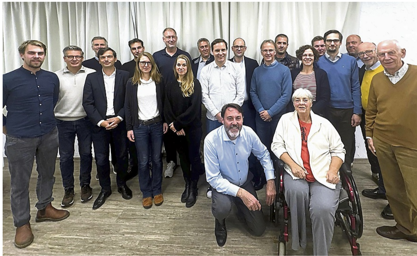
Sie treten bei der nächsten Kommunalwahl an: Der Melsunger FDP-Stadtverband hat seine Liste für die Wahlen im März aufgestellt. Das Foto ist mit einem starken Weitwinkel aufgenommen.

Ein besonderes Merkmal der neuen Liste ist ihre Vielfalt: Sie vereint Frauen und Männer verschiedener Altersgruppen, Berufe und Hintergründe – von Anfang 20 bis über 80 Jahre. Etwa ein Drittel der 31 Kandidaten steht erstmals auf einer FDP-Liste – „ein starkes Zeichen für den