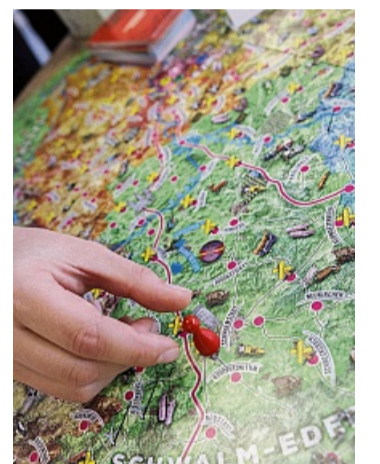
Vorbeischaun in Schwalmstadt: Bei diesem Brettspiel geht es durch ganz Nordhessen.