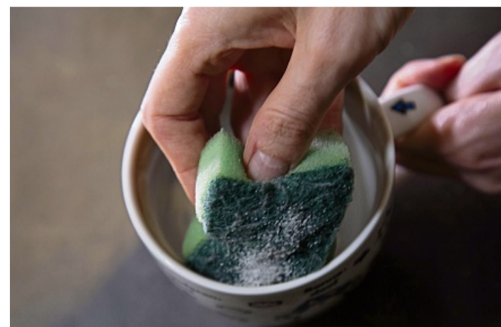
Schritt 2: Mit dem Schwamm über den Teerand schrubbten.