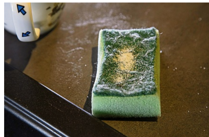
Schritt 1: Etwas Salz auf einen Schwamm streuen.