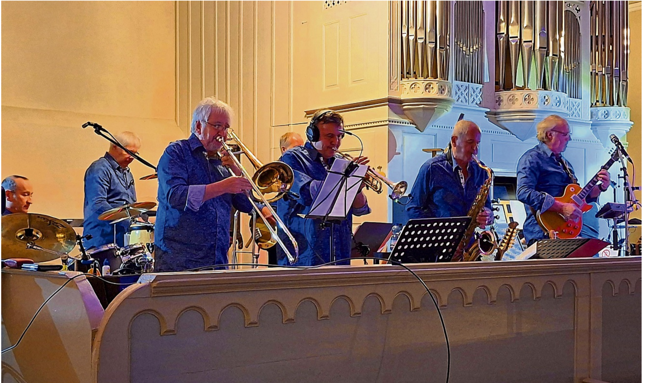
Die Musiker der Band „Deep Organ on Rock - D.O.O.R.“ ließen die Stimmung des siebziger Jahre Rocks in der Schedener Markuskirche aufleben.

D.O.O.R. lud Besucher zum Mitmachen ein und erweckte Musik der sechziger Jahre zum Leben