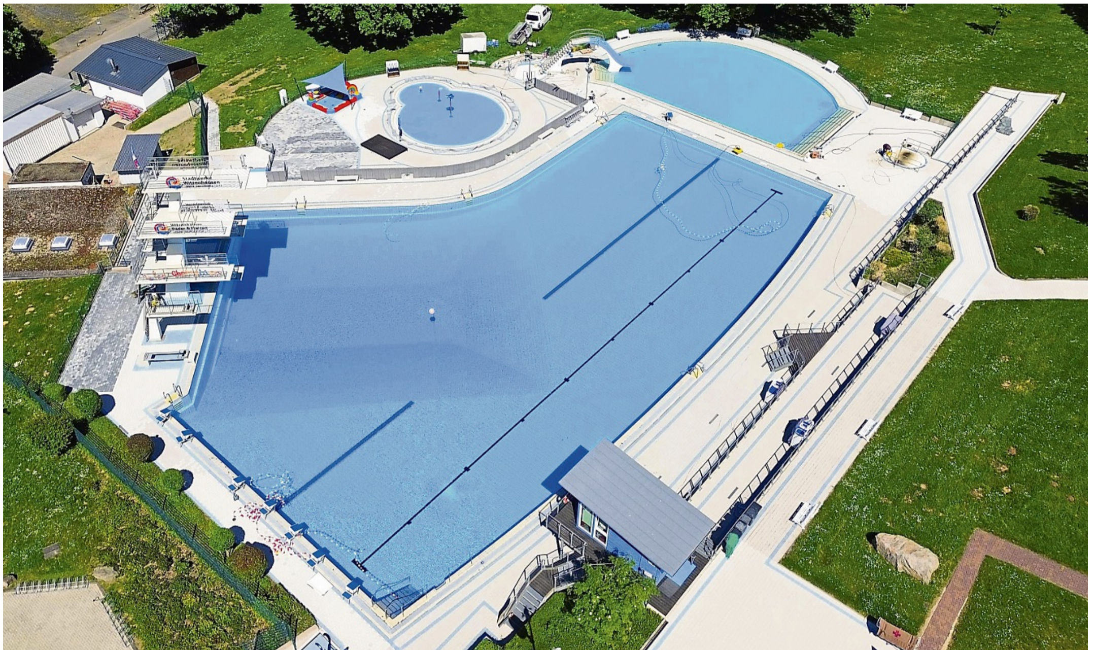
Das Witzenhäuser Freibad ist Teil der neuen Arbeitsgemeinschaft hessischer Bäder, die sich für den Erhalt der Badeanstalten einsetzen will.

Arbeitsgemeinschaft will Zusammenarbeit für Erhalt fördern