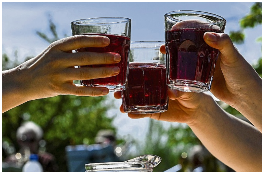
Mit bis zu 22 Gramm Zucker pro Glas enthält Kindersekt mehr Zucker als viele Softdrinks.