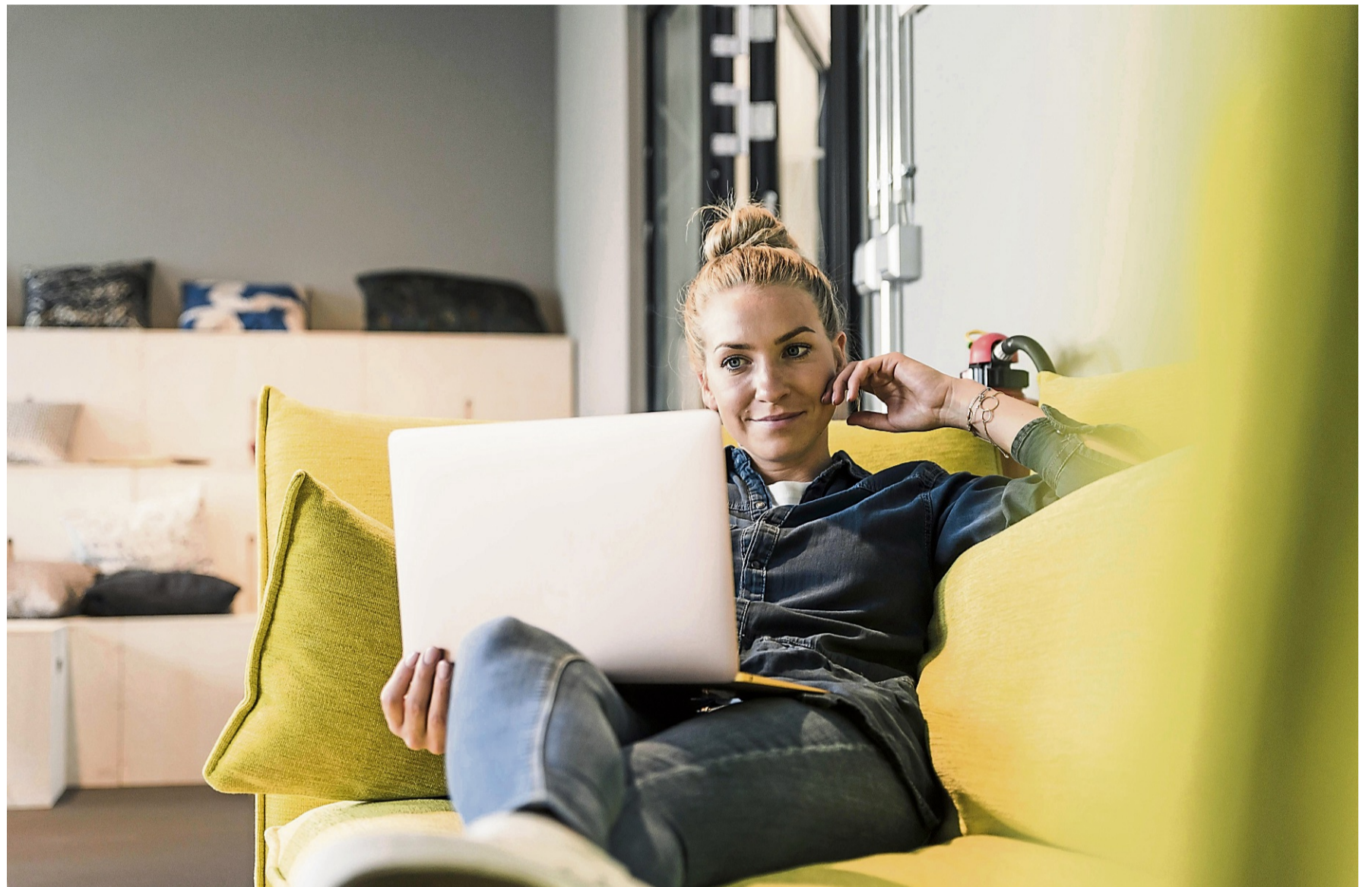
Den Depotanbieter wechseln? In der Praxis kann es dafür gute Gründe geben.

Vor allem natürlich die anfallenden Kosten. „Relevant sind vor allem die Kosten für die Depotführung und die Orderkosten“, sagt Verbraucherschützer Scherfling. Diese sollten Anlegerinnen und Anleger genauso prüfen wie die angebotenen Gebührenmodelle. „Wer beispielsweise nur ein- oder zweimal im Jahr handelt, für den ist vor allem die Höhe der Grund-