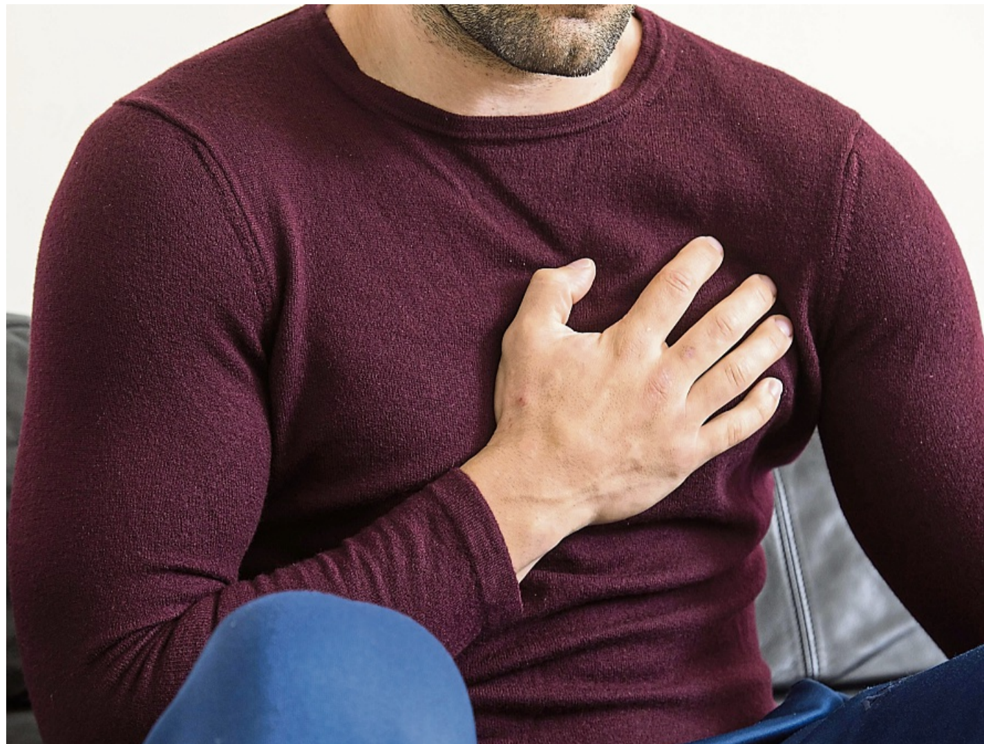
Druck und Schmerzen in der Brust: Was tun bei einem Angina-Pectoris-Anfall?

Bei schweren Formen von Angina Pectoris können die Brustschmerzen jedoch auch im Ru-