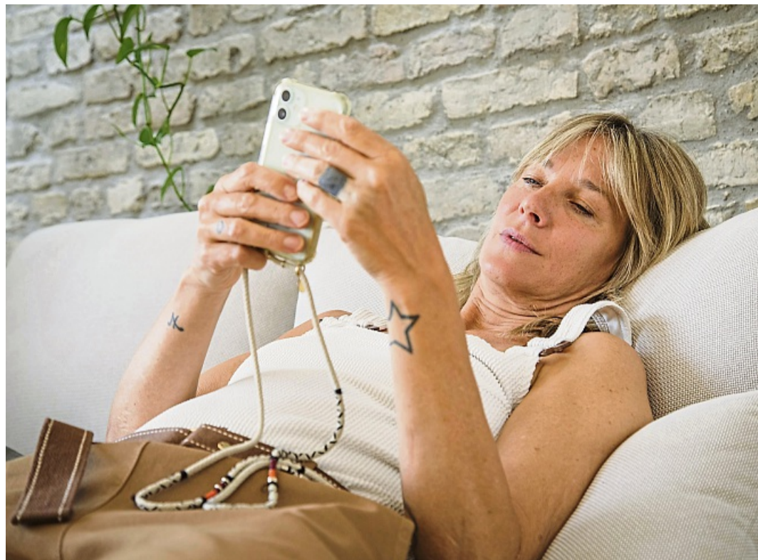
Was so teuer? Dann lieber WLAN: Nachgebuchte Datenpakete können teuer werden. Wer so oft als möglich WLAN-Netz nutzt, spart.

Wird ein Tarif nicht bedarfsgerecht gebucht, bedeutet das, dass man entweder den Datenumfang des eigenen Tarifs nicht ausnutzt oder ihn eben überschreitet. Dann zahlt man drauf, weil man jeden Monat zu