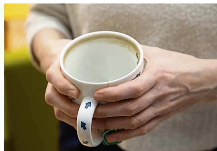
Hartnäckige Teeränder in der Tasse? Mit einem Hack sollen sie sich einfach entfernen lassen.