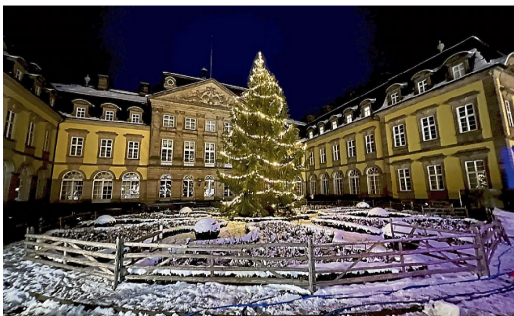
Arolser Weihnachtsmarkt vor Schlosskulisse.