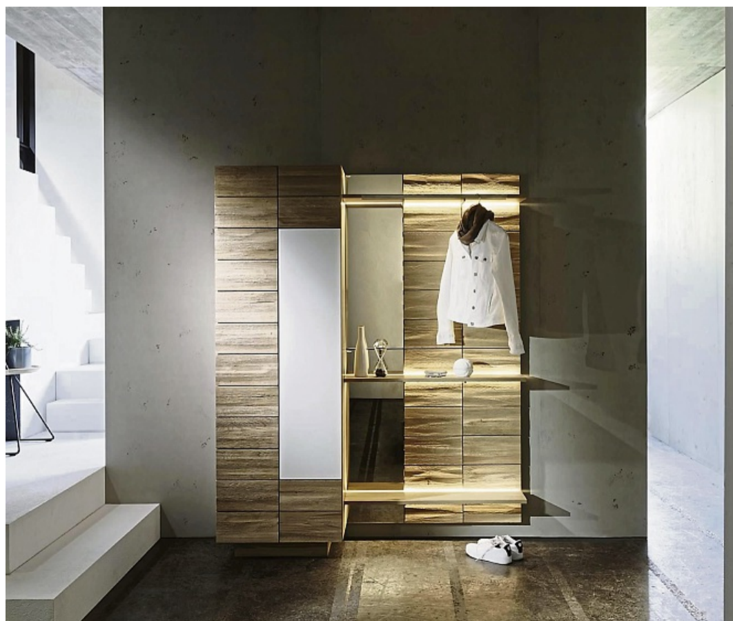
Eine Mischung aus geschlossenen und offenen Elementen erleichtert das Verstauen von Mänteln, Jacken und Schuhen.

Persönliche Akzente wie Bilder, Pflanzen oder dekorative Accessoires machen den Flur einladend und spiegeln den eigenen Stil wider. Eine schöne Fußmatte sorgt für einen freundlichen Empfang und hält Schmutz draußen. r