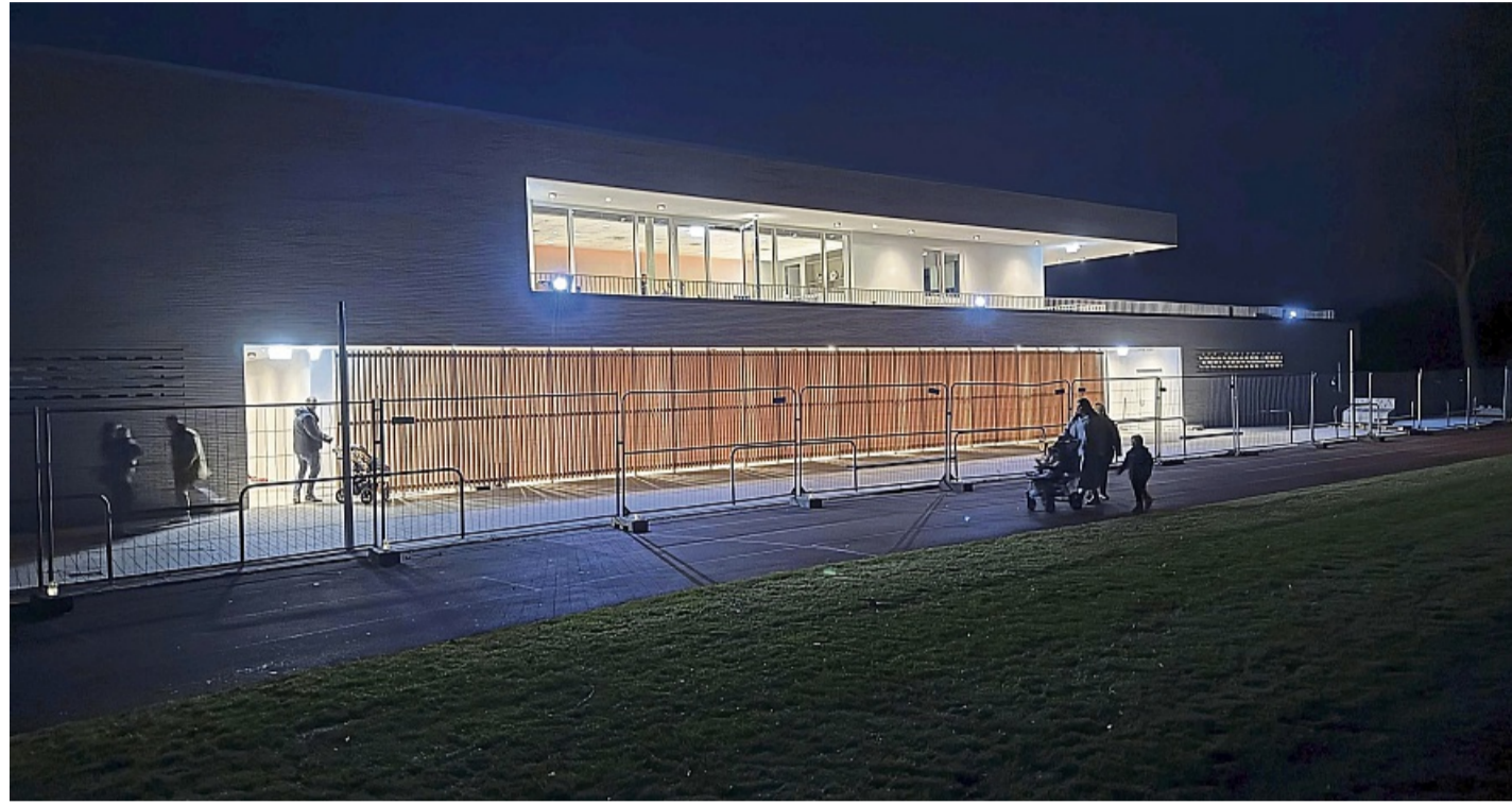
Das neue inklusive Sportzentrum am Tannenkopf wurde am Wochenende vom TuS Bad Arolsen mit einer ersten Jahreshauptversammlung im Clubraum in Betrieb genommen.