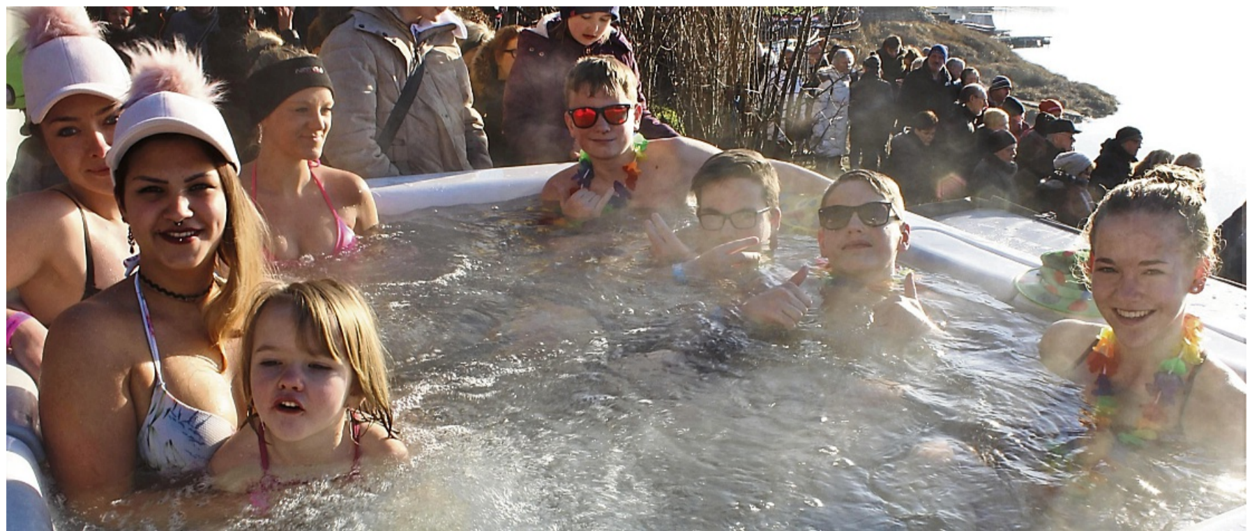
Erst leise köcheln, dann schockfrosten. Schnappschuss von 2024.

Predator - Badlands (3D): So u. Mo 19.45 h / 2D: Sa 19.45, Mi 17 h Wicked 2: 3D: Sa bis Mo 16.45 h, Di 16.15 h, Mi 17.15 h / 2D: Sa 13, 15.30, 19.30 u. 22 h, So 13, 15 u. 19.30 h, Mo u. Di 15 u. 19.30 h, Mi 15 u. 19.15 h Zoomania (3D): Mi 15, 17.45 u. 20 h All das Ungesagte zwischen uns - Regretting You: Sa bis Di 17 h Das Kanu des Manitou: Mo u. Di 17.45 h Der Hochstapler - Roofman: Mi 20 h Die Schule der magischen Tiere 4: Tägl. 15 h Die Unfassbaren 3: Sa u. Mo 19.45 h, So 17.45 u. 19.30 h, Di 20 h, Mi 17.15 h Dracula - Die Auferstehung: Sa 22.15 h Ein kleines Stück vom Kuchen: Mo 19.30 h Ganzer Halber Bruder: So 17.15 h Met Opera - Arabella - Strauss: Sa 19 h Mission Santa - Ein Elf rettet Weihnachten: Tägl. 15 h Mission: Mäusejagd - chaos unterm Weihnachtsbaum: Sa u. So 13 u. 15 h, Mo 15 h Momo: Sa u. So 13 h No Hit Wonder: So 17.15 h Paw Patrol - Rubbles Weihnachtswunsch: Sa 13.30 u. 15.45 h, So 13.15 u. 15.45 h Pumuckl und das große Missverständnis: Sa u. So 13 h, Mo bis Mi 15 h She said: Di 19 h Sisu - Road to Revenge: Sa 22.15 h, So 20.15 h, Mo u. Mi 19.45 h, Di 17 h Springsteen - Deliver Me From Nowhere: Sa bis Mo 17.15 h The Running Man: Sa 19.30 u. 22.15 h, So 19.30 h, Mo u. Mi 17 h, Di 17.15 h Wenn der Herbst naht: Mi 19.45