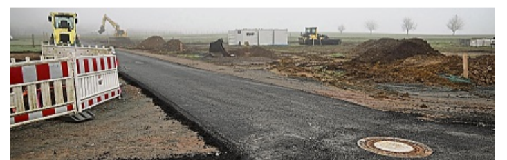
Schon viel geschafft: Das Baugebiet „Über dem Herrngarten“ in der Verlängerung der Straße „Hohler Weg“ wird derzeit in Goddelsheim erschlossen.

Lichtenfelser Stadtverordnete legen Verkaufspreis für Grundstücke fest