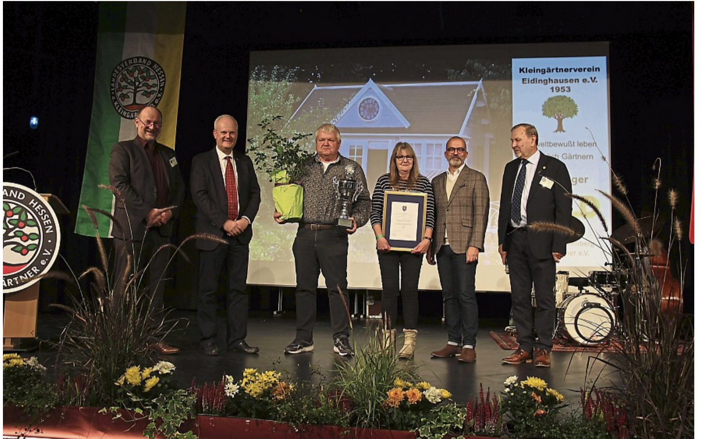
Beim Landeswettbewerb der Hessischen Kleingärtnervereine hat der Kleingärtnerverein (KGV) Eidinghausen aus Korbach die Auszeichnung in Gold erhalten und damit den ersten Platz belegt.