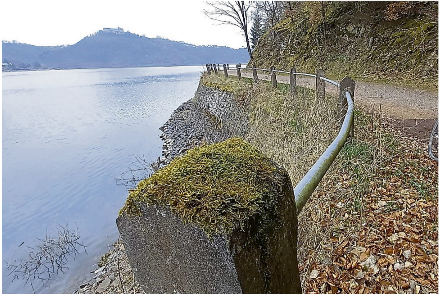
Das alte Geländer muss weg, aber es fällt nicht ersatzlos. Das steht bereits fest.

Verkehrssicherungspflicht lässt am Edersee nichts Anderes zu