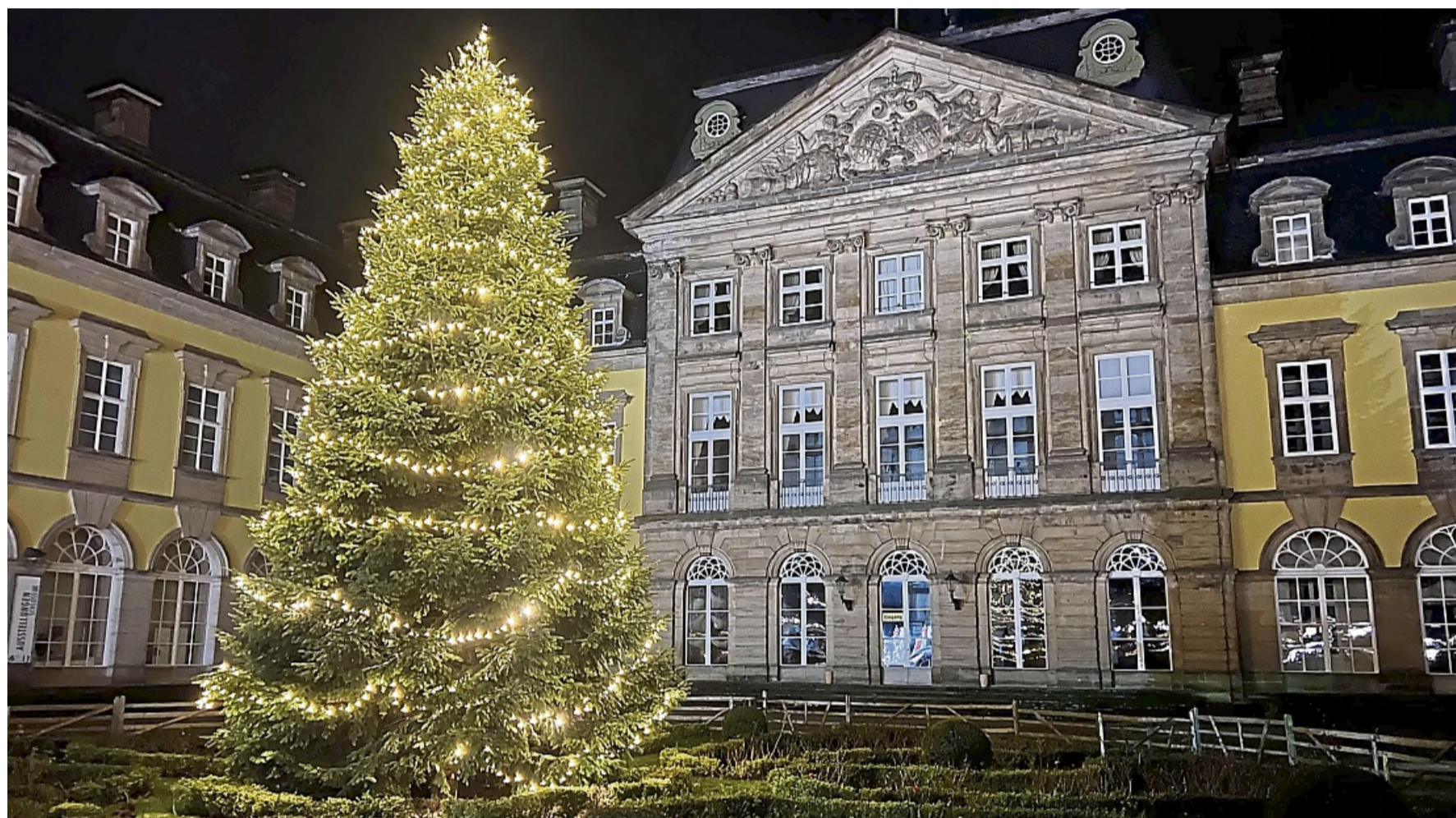
Weihnachtsmarkt und Weihnachtsbeleuchtung in Bad Arolsen.

Um 18 Uhr findet eine Andacht in der Schlosskapelle statt, gefolgt vom Auftritt der Bad Arolser Jagdhornbläser um 18.40 Uhr. Den musikalischen Abschluss des Tages gestaltet ab 19.30 Uhr Tommy Goerke mit seiner Gitarre „Hope“. Der Singer-Songwriter präsentiert ei-