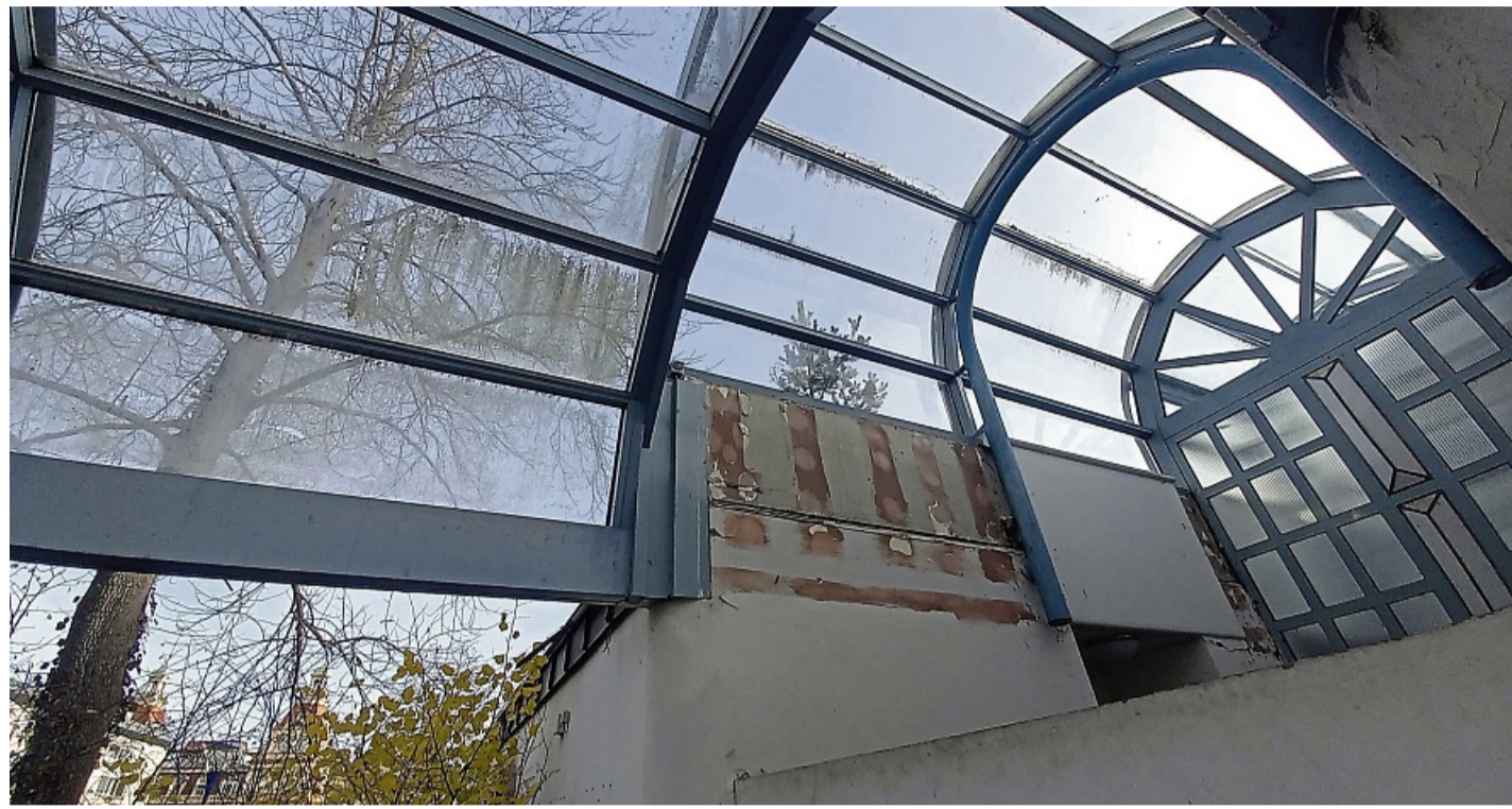
Seit wenigen Tagen läuft europaweit das Bieterverfahren für das Kurhausgelände.