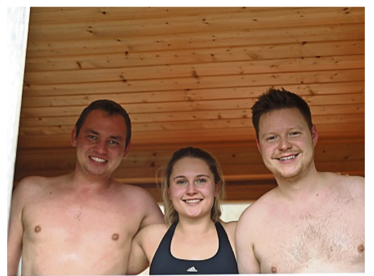
Wärme tanken in der Sauna vorm Weg ins Eiswasser. Szene vom 1. Januar 2025.