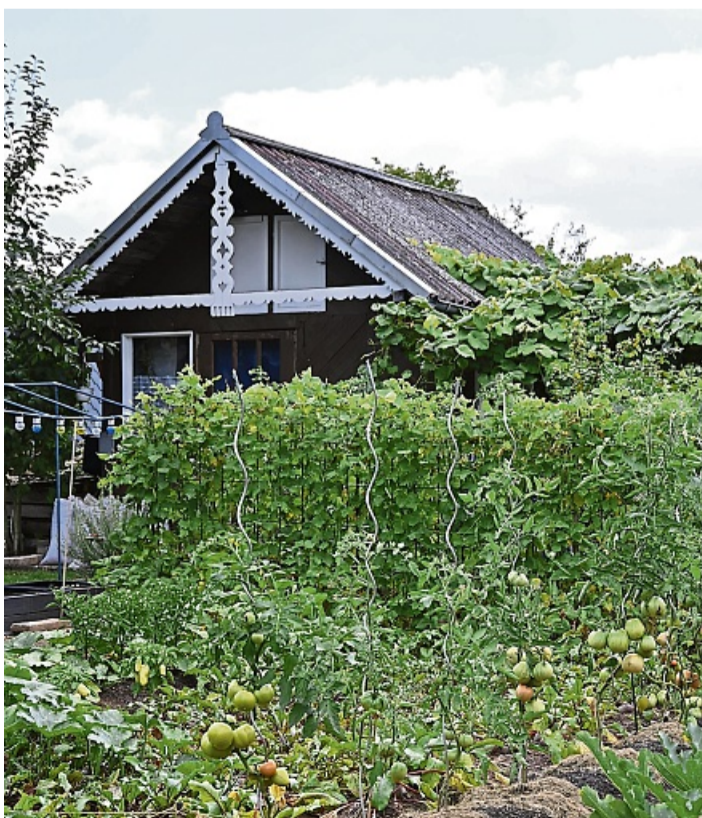
Dem klassischen Gemüse- und Obstanbau widmen sich Laubkolonisten auch im KGV Eidinghausen.