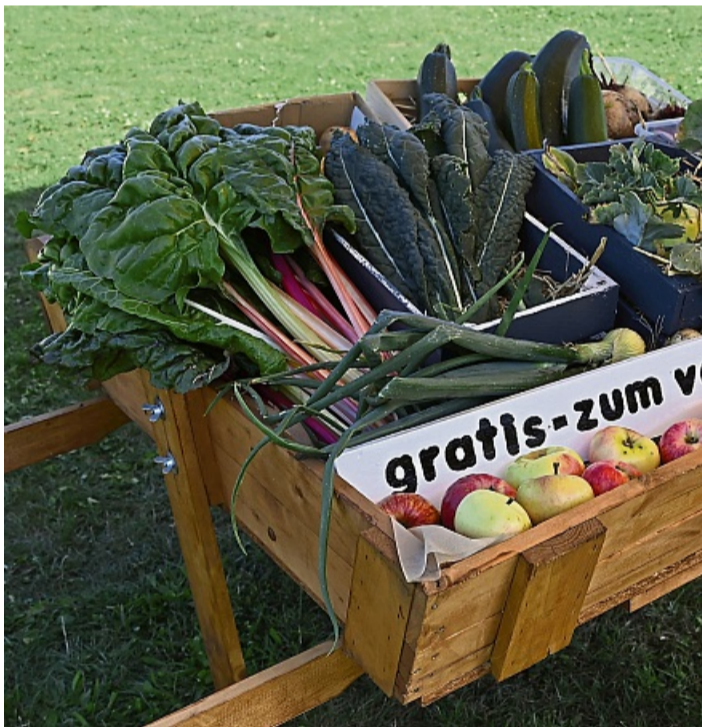
KGV Eidinghausen - Nichts verkommen lassen, lieber verschenken.

Gartenbau KURZROCK • Heckenschnitt • Pflasterarbeiten • Baumfällung & -pflege Ziegelhütte 4 • Korbach • Tel.: 05631-64628