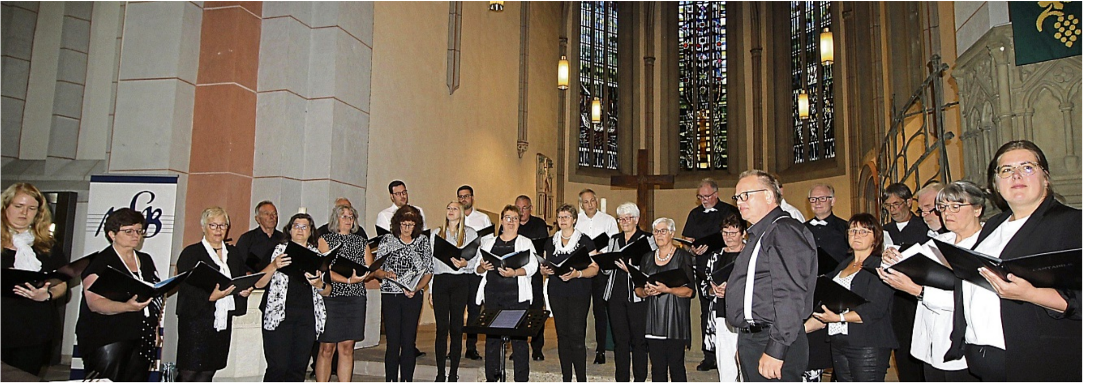
Mit dabei beim Bundeschorkonzert in Hann. Münden: Der gemischte Chor T(H)erzprung aus Birkenbringhausen. Auch der Frauenchor „Pro Musica“ aus Bottendorf, der Männergesangverein „Heimattreu“ 1926 aus Niederasphe sowie der Frauenchor „New Voices“ aus Geismar (Schwalm-Eder-Kreis) treten auf.

Bundeschorkonzert des Mitteldeutschen Sängerbundes am 22. November im Mündener Welfenschloss