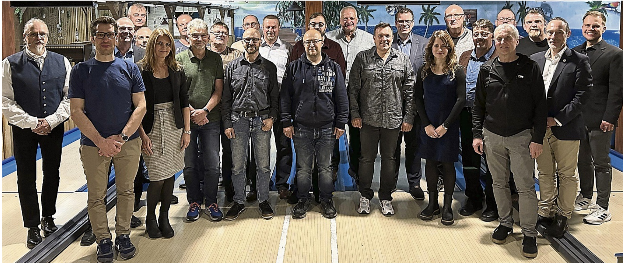
Die Mitarbeitererehrungen von Hollingsworth & Vose fanden im Restaurant „Die Esse“ in Biedenkopf statt.

Hollingsworth & Vose ehrte 42 Jubilare und verabschiedete einen Kollegen in Ruhestand