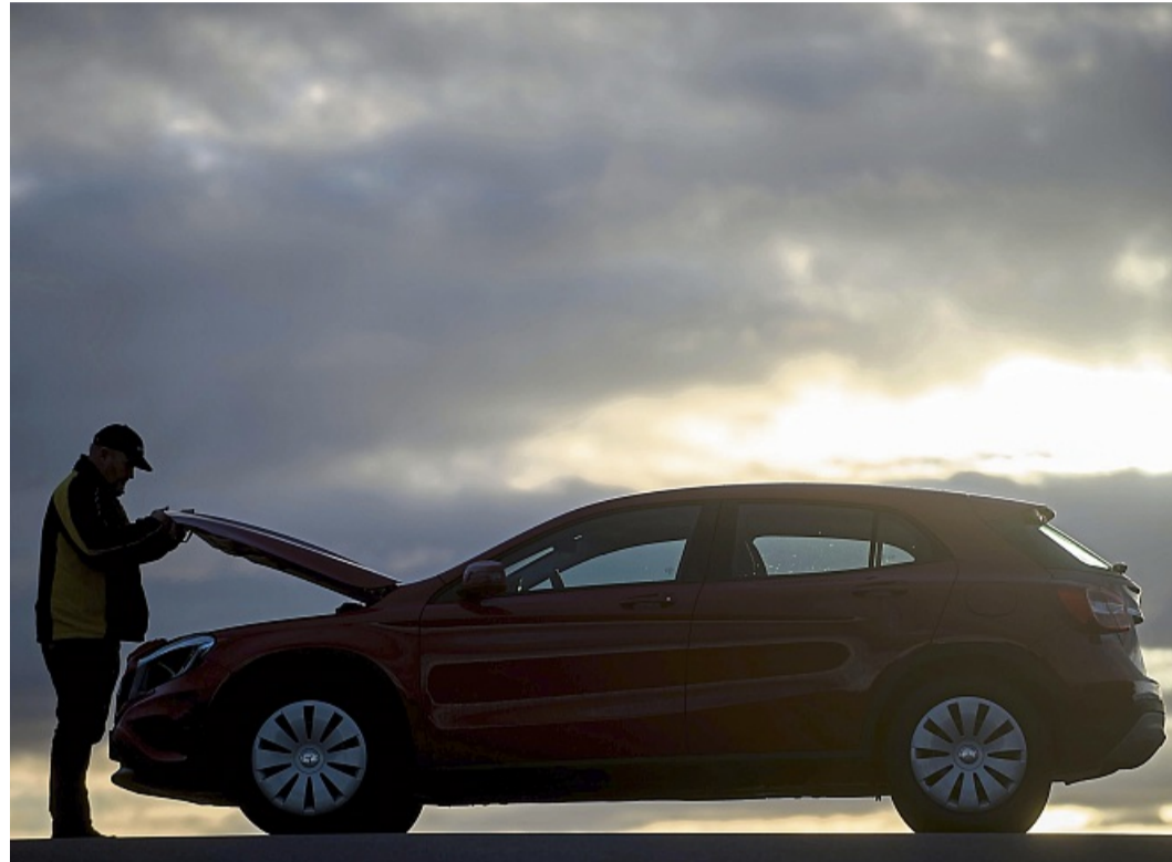
Springt der Wagen nicht an, liegt es oft an einer schlappen Starterbatterie.

Ja, während der Fahrt erzeugt die Lichtmaschine eines Ver-