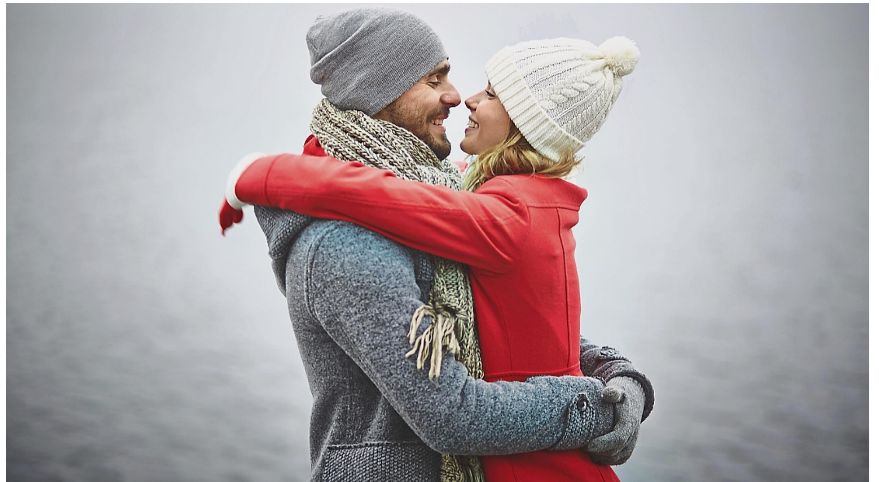
Jetzt den passenden Partner finden: Eine Anmeldung beim Datingportal partner.HNA.de kann dabei helfen.

Im ersten Schritt sollten Sie sich Gedanken machen, was Ihnen als Single auf Partnersuche die Vorweihnachtszeit verstüßen könnte. Vielleicht hätten Sie gerne mal wieder ein Date oder wünschen sich einen neuen Haarschnitt, um sich attraktiver zu fühlen. Möglicherweise