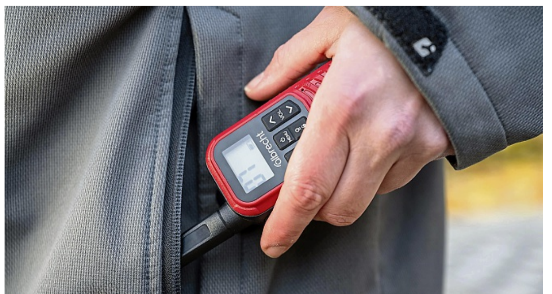
Ein digitales Walkie-Talkie: Bei diesen Geräten stört kein Rauschen mehr, aber die Stimmen klingen nicht so natürlich wie beim analogen Funk.