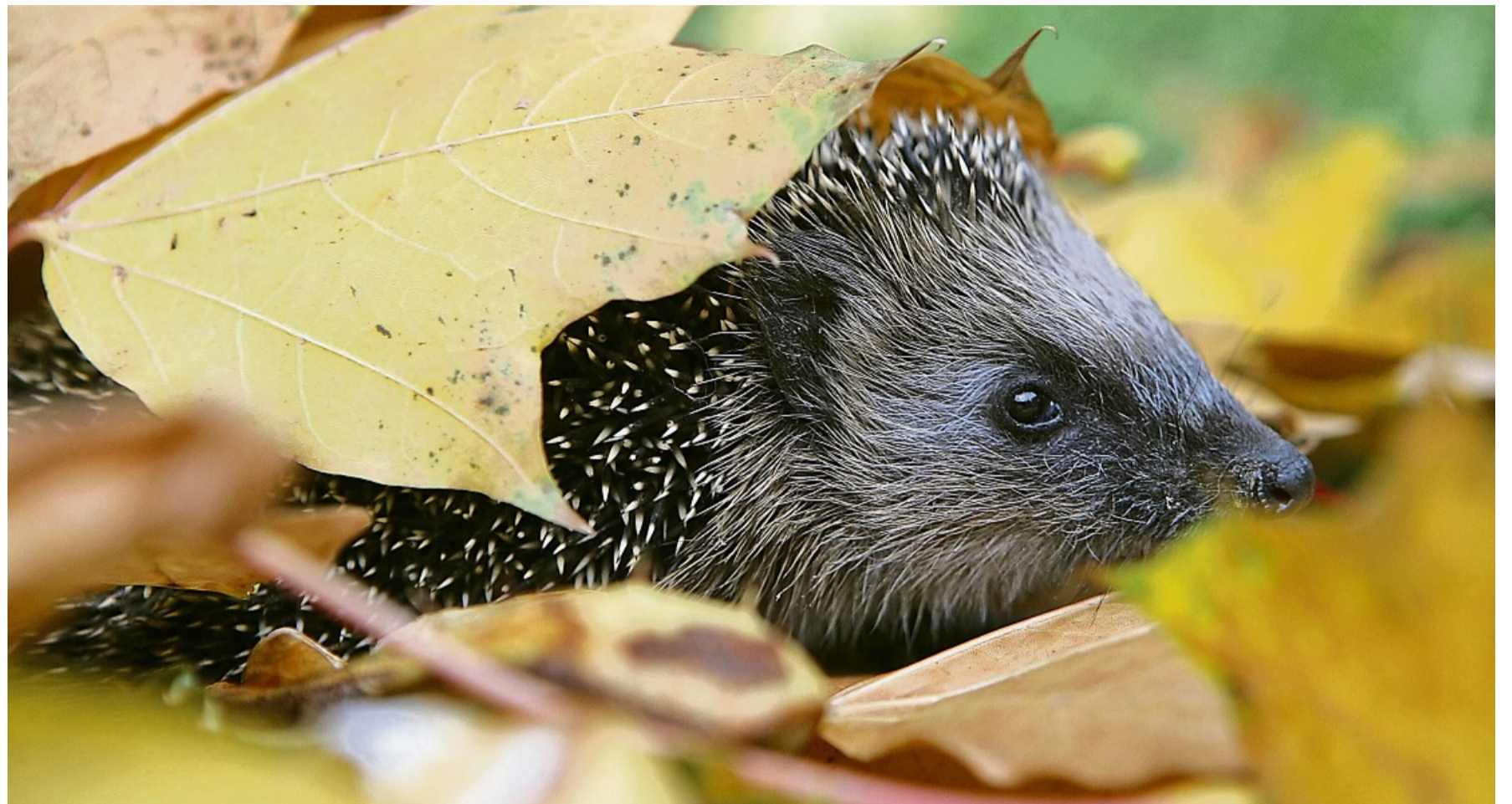
Schutz und Wärme: Igel nutzen Laubhaufen gern als Versteck.

Beobachtungen von Igel am Tag sind im Herbst nicht ungewöhnlich. Wie Sommerhage erläuterte, könne dies darauf hinweisen, dass die Tiere bei Gartenarbeiten gestört wurden oder ihr Versteck gewechselt haben. Erst wenn ein Igel apathisch wirkt, taumelt, verletzt ist oder sich nicht einrollen kann, bestehe laut Nabu Handlungsbedarf. In solchen Fällen sollten Tierärzte oder Igelauflaufstationen kontaktiert werden.