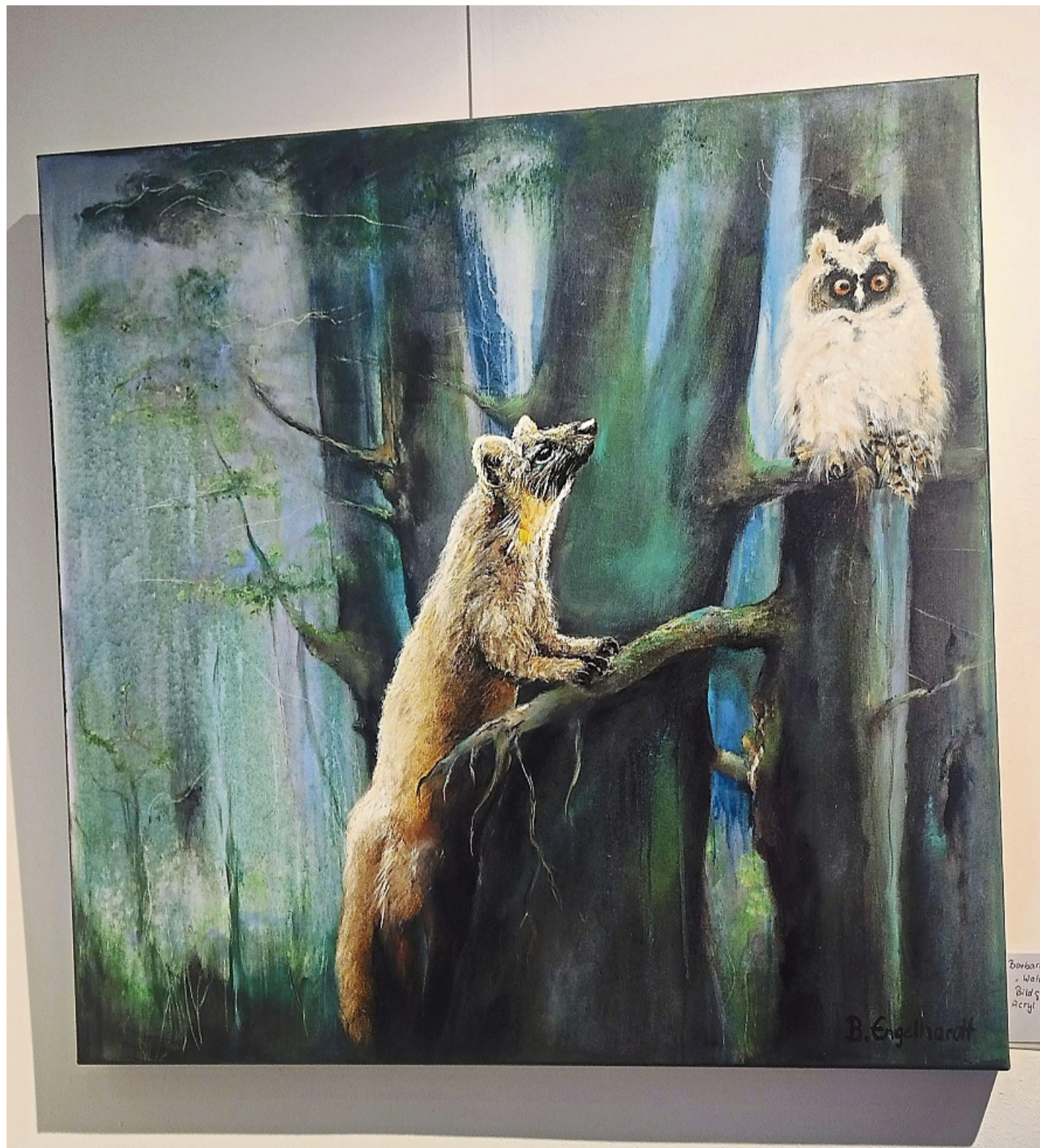
„Tiere im Portrait“ heißt die Ausstellung, die noch bis Ende Januar zu sehen ist.