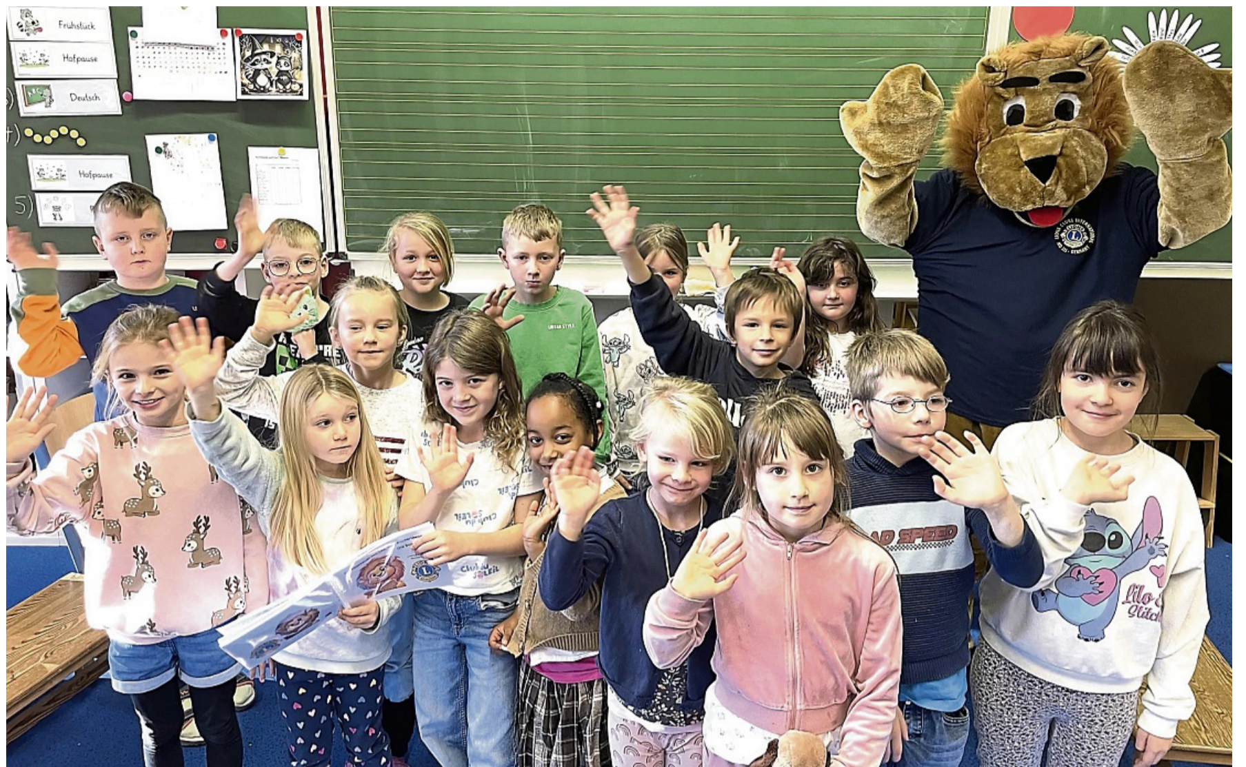
Die Mädchen und Jungen der Klasse 2a der Grundschule Königshof freuen sich über den Besuch von Leo dem Bücherlöwen.

Sieben der örtlichen Grundschulen wurden angesprochen, neben der Grundschule Königshof sind die Grundschulen Hermannshagen, Neumünden, Gimte und Hedemünden mit 15 Klassen dabei. Interessierte von zweiten und dritten Grundschulklassen, die sich bisher noch nicht zur Teilnahme gemeldet haben, können dies unter www.buecherloewencup.de nachholen.