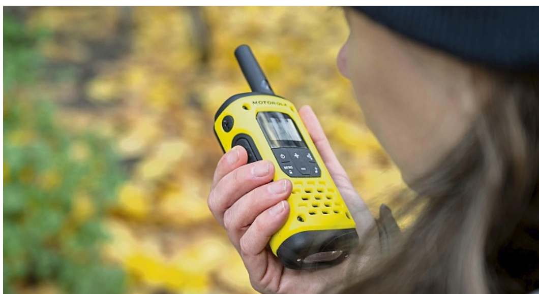
«Bitte kommen, bitte kommen!»: Funkgeräte haben ihre ganz eigene Faszination.

Walkie-Talkies sind mehr als Spielzeug und können im Alltag sehr nützlich sein. Wer sich ein wenig mit der Technik auseinandersetzt, die richtigen Geräte für den eigenen Zweck wählt und sich an die grundlegenden Regeln hält, hat damit ein robustes, netzunabhängiges Kommunikationsmittel zur Hand – das etwa gerade dann seine Stärken ausspielt, wenn das Handy streikt oder die Umgebung rauer ist. tmn