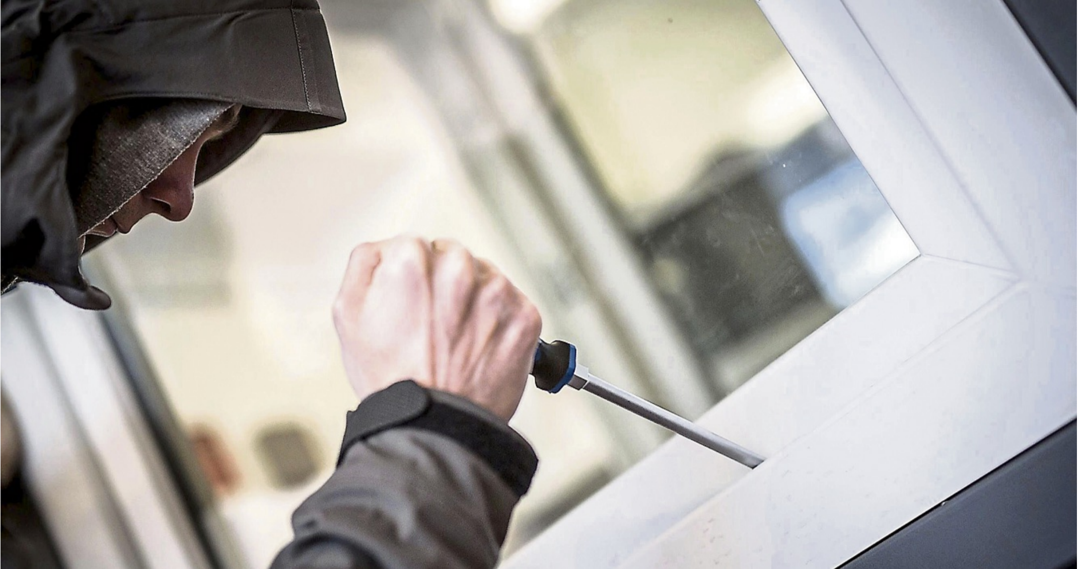
Haus und Wohnung sicherer machen: Die Polizei warnt in der dunklen Jahreszeit vor vermehrten Einbrüchen (Symbolbild).

Häuser und Wohnungen zur dunklen Jahreszeit sicherer machen