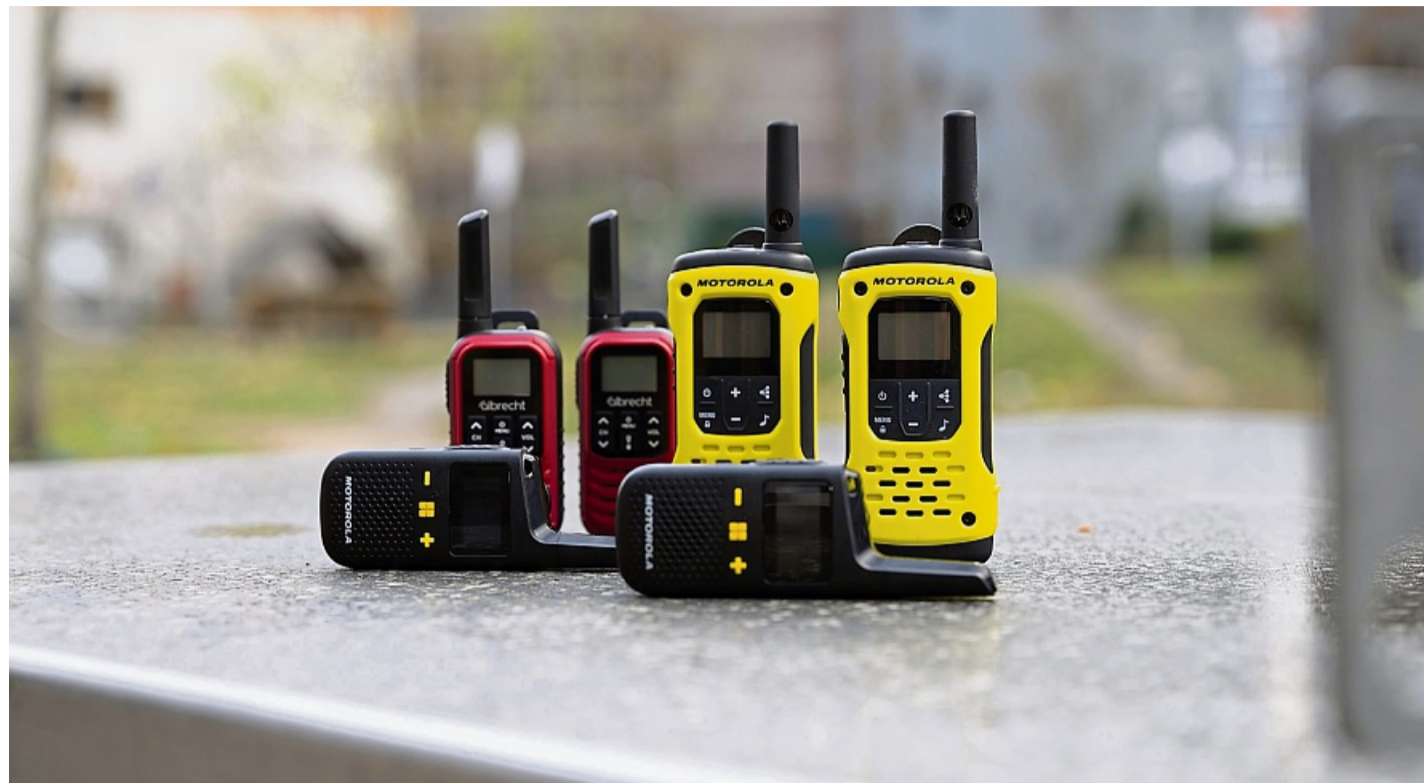
Robuster Auftritt: Anders als die meisten Smartphones fühlen sich viele Walkie-Talkies in ruppiger Umgebung wohl.

Funkgeräte, umgangssprachlich auch Walkie-Talkies genannt, die mit einer dieser vier Varianten funken, dürfen in Deutschland lizenzfrei genutzt