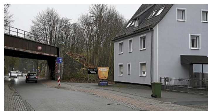
Enge Kiste: Die Zustellfahrzeuge von Post und DHL werden links vom Wohngebäude auf die Wildunger Landstraße zur Auslieferung fahren und auf der rechten Seite zum Stützpunkt zurückkehren.

Am 20. Februar 2023 waren Post und DHL aus der Poststraße in die Briloner Landstraße umgezogen. Das Problem: Der Korbacher Bebauungsplan ließ diese Art der Nutzung gar nicht zu. Der neue Mieter zeigte sich