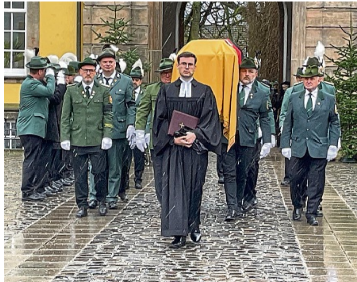
Die Chronik „von Jahr zu Jahr“ erinnert auch an den Tod von Wittekind Fürst zu Waldeck und Pyrmont im Dezember 2024.