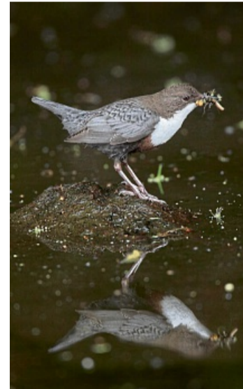
Die Wasseramsel ist gerade im Juni an der Eder anzutreffen.