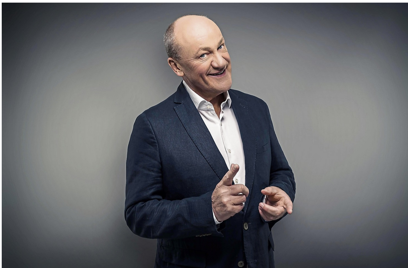
Tritt am 13. Dezember im Autohaus Schüppler in Volkmarsen auf: Bodo Bach mit seinem Programm „Das Guteste aus 20 Jahren“.

Beim Ausmisten seines Oberstübchens stellt der Comedian fest: Blödsinn wird nicht blöder, sondern sinniger. Einen ganzen Abend lang hebt er einen Sprachschatz nach dem an-