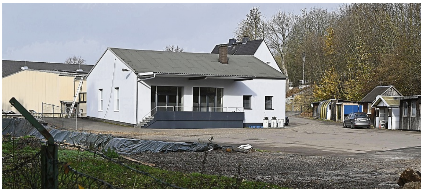
Neuer Standort: Post und DHL wollen im Jahr 2026 an die Wildunger Landstraße in Korbach umziehen.

Die technische Ausstattung soll „den höchsten Ansprüchen einer modernen Postlogistik“ genügen, sagt Kutsch. Im Grunde baue man in den bestehenden Mauern ein neues Zentrum. Und: Es sei nicht der erste Umbau dieser Art, versichert Kutsch.