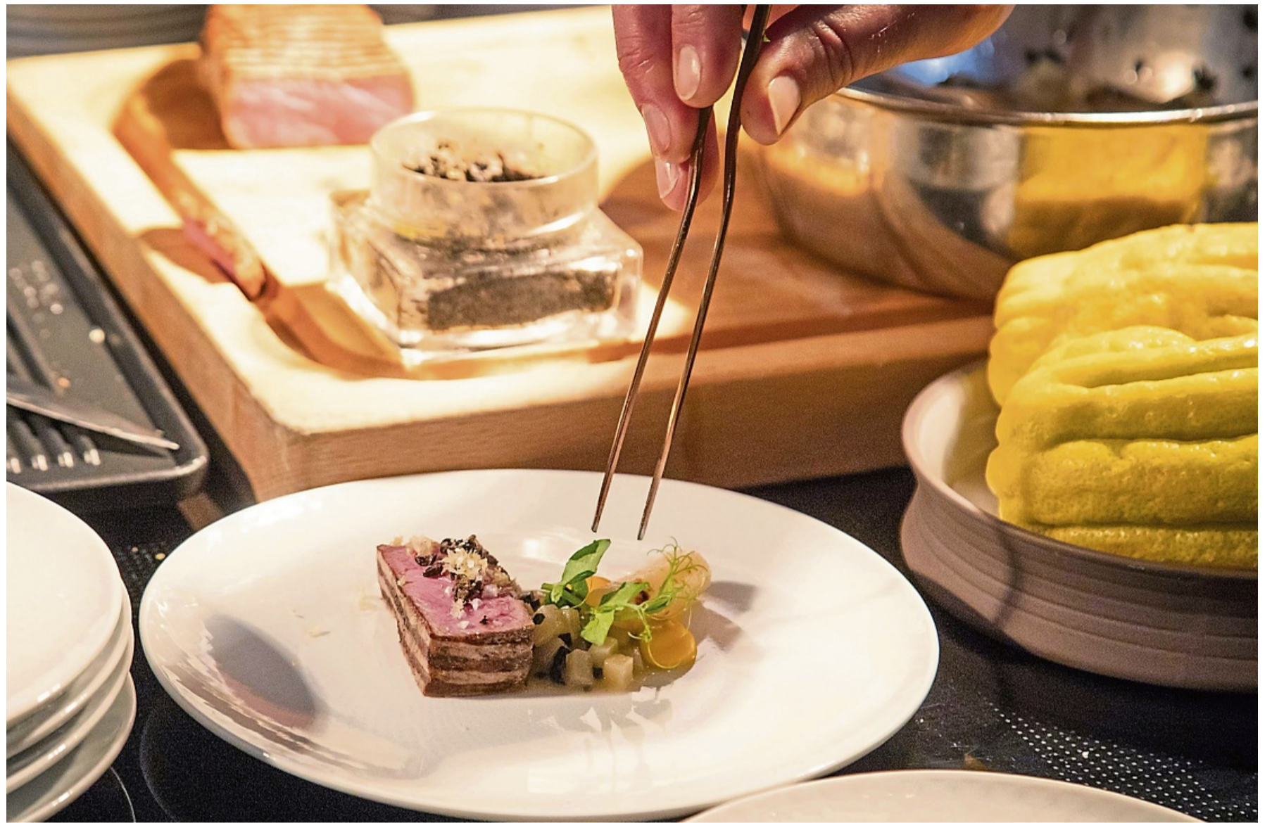
Bei Sterneköchen wird der Teller zur Leinwand. Das geht auch daheim. Beim Spiel mit Farben und Komponenten sollten Portionen filigran platziert werden, gern auch mit Pinzette. So wird der Teller zum Kunstwerk, der Koch zum Künstler.

Campanella hält es bei Gewürzen schlicht, besonders beim Fleisch: „Etwas Salz, Pfeffer oder Paprikapulver reichen.“ Für mehr Umami setzt er auf hochwertige Misopaste. Roncoroni würzt sein Wintergemüse mit wenig Garam Masala, Kurkuma oder Ingwer.