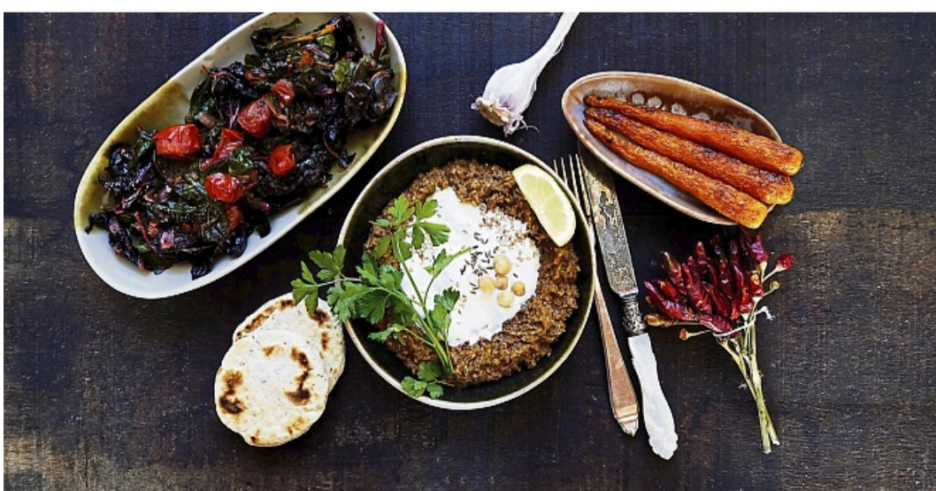
Die Auswahl der Zutaten für beispielsweise geschmorten Mangold mit Kichererbsen-Crème und Chili-Möhren folgt nach dem Prinzip: regional, saisonal, frisch vom Markt.