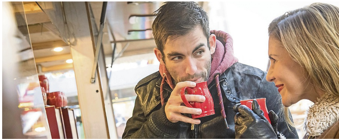
Für Punsch gibt es keine gesetzlich festgelegte Rezeptur – anders als bei Glühwein.

„Für Punsch gibt es keine gesetzlich festgelegte Rezeptur, da kann sich vieles verbergen“,