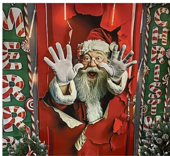
Der Weihnachtsmann hat sich Gedanken gemacht und mit dem Werbekreis Kaufpark Wehrda ein paar besondere Geschenke unter den Tannenbaum gelegt.

Die Fachmärkte decken ein breites Sortiment ab, sodass auf kurzen Wegen innerhalb des Kaufparks eine Vielzahl an Geschäften mit Waren und Dienstleistungen fußläufig oder auch mit dem Auto erreichbar ist. Die persönliche und individuel-