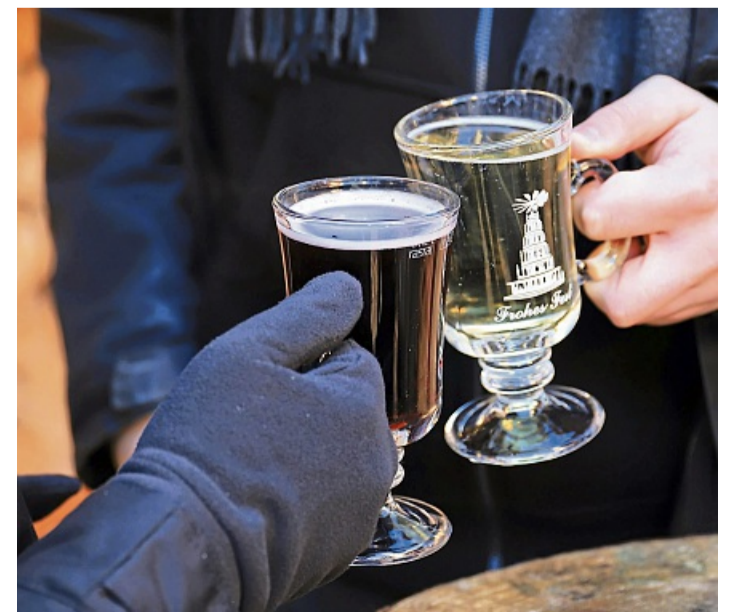
In Glühwein darf nicht alles mögliche an Zutaten, ganz im Gegenteil zu Punsch.

Der Bummel durch Marburgs größtes Einkaufszentrum lohnt sich in der Vorweihnachtszeit in diesem Jahr also wieder ganz besonders. Die Mitglieder des Werbekreises wünschen Ihnen eine besinnliche Advents- und Weihnachtszeit und einen angenehmen Einkauf im Kaufpark Wehrda – außerdem viel Glück bei Ihrer Chance auf einen der außergewöhnlichen Preise beim diesjährigen Gewinnspiel!