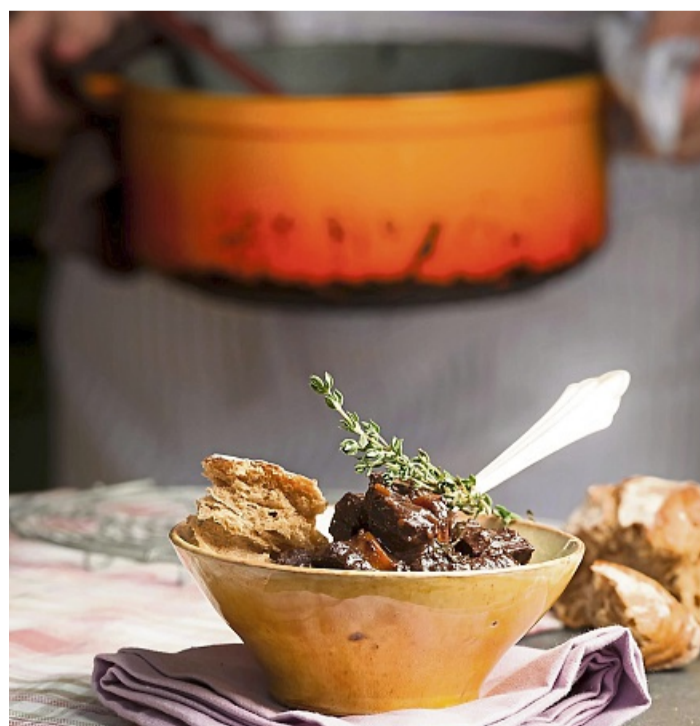
Macht gleich mehr her: Warum das Gulasch nicht mal in einem Schälchen höher bauen und dekorieren anstatt auf einem platten Teller zu servieren.