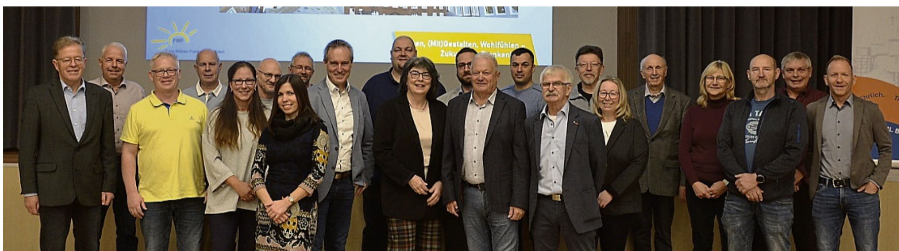
Beim Zukunftsforum der Freien Wähler Frankenberg ging es um aktuelle und künftige Themen.

Zukunftsforum der Freien Wähler Frankenberg