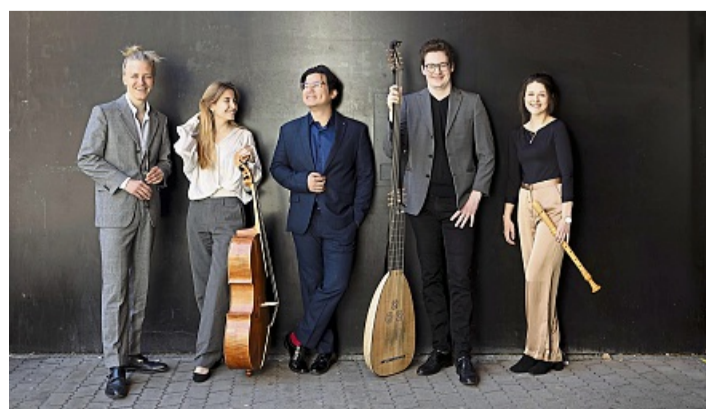
Die Matinee Junger Künstler gestaltet das Ensemble Interchange.