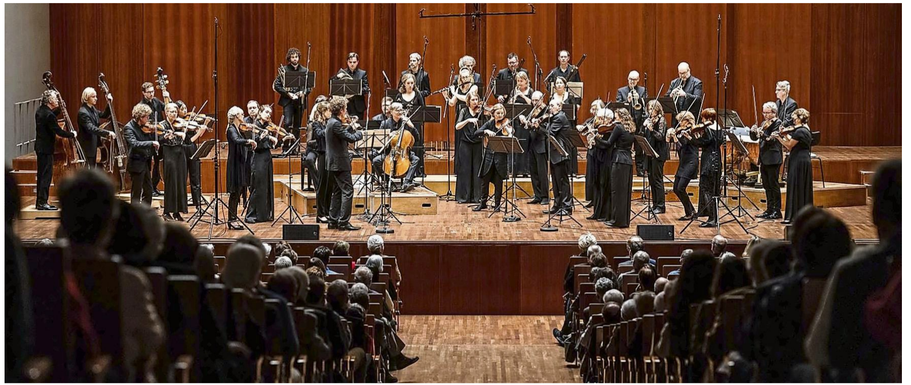
Das Freiburger Barockorchester eröffnet die Arolser Barock-Festspiele am Mittwoch, 13. Mai, in der Fürstlichen Reitbahn.