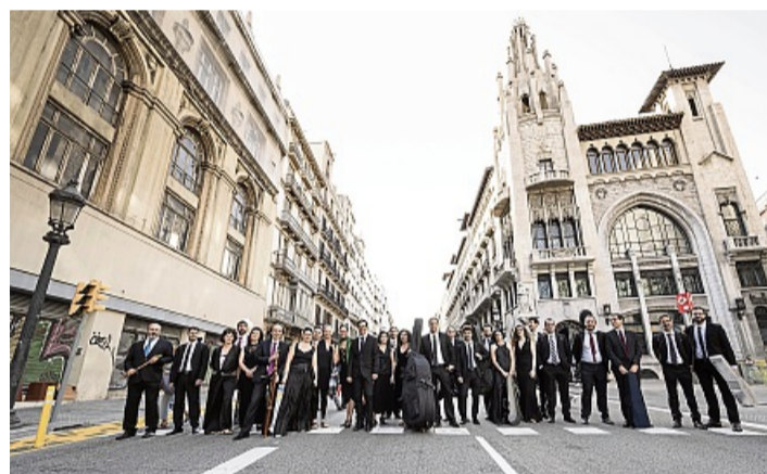
Das katalanische Ensemble Vespres d'Arnadi gestaltet das Abschlusskonzert bei den Arolser Barock-Festspielen. Ihr Auftritt wird gefördert durch teilweise Übernahme der Flugkosten durch die katalanische Regionalverwaltung.

Zu den seit Jahren festen Programmpunkten gehören die