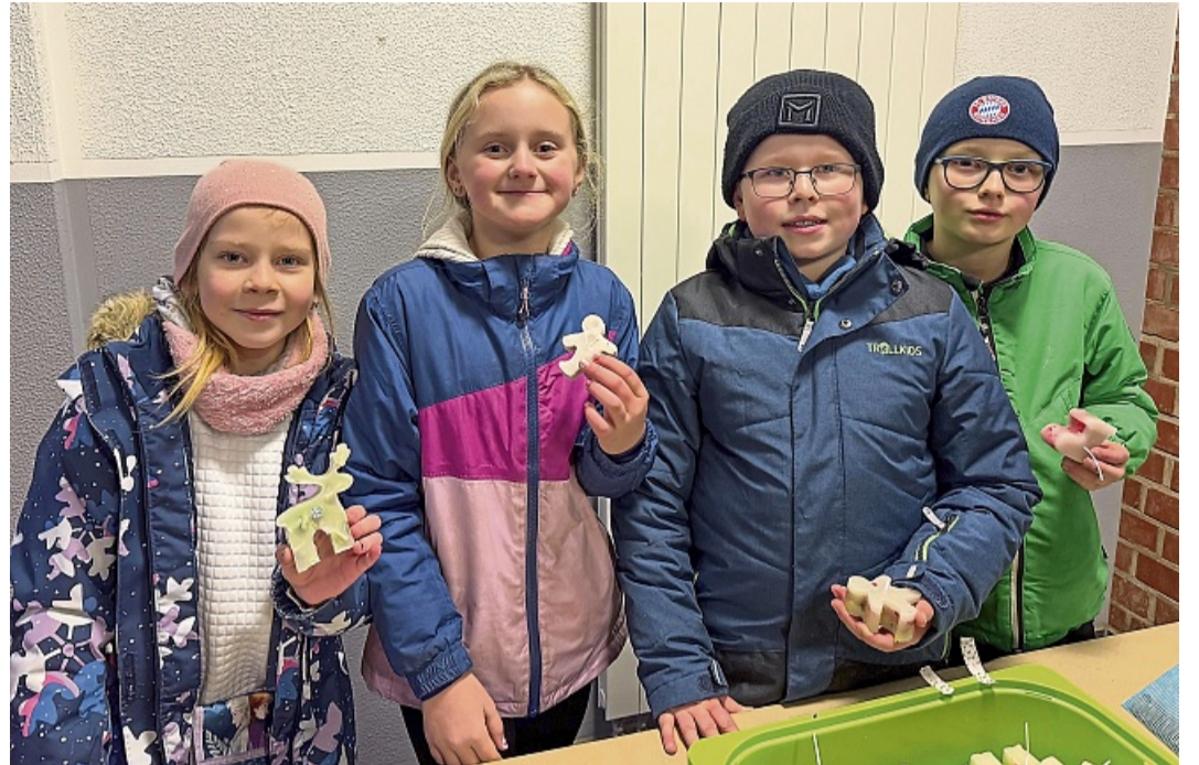
In der Kerzenwerkstatt konnten eigene Kerzen gestaltet werden.

Diemelsee-Adorf – Auf der Bühne steht ein Erstklässler, schaut suchend ins Publikum – und plötzlich hellt sich sein Gesicht auf. „Mama ist da!“, ruft er erleichtert. Kurz darauf stimmen die Kinder der ersten Klasse „Frohe Weihnacht, Merry Christmas“ an, bevor sie mit dem schwungvollen Lied „Oh wei-wei... Weihnachten!“ das Publikum überraschen. Das Lied ist eine humorvolle Nummer über einen Weihnachtsmann, der sich ein Bein gebrochen hat und trotzdem tanzt.