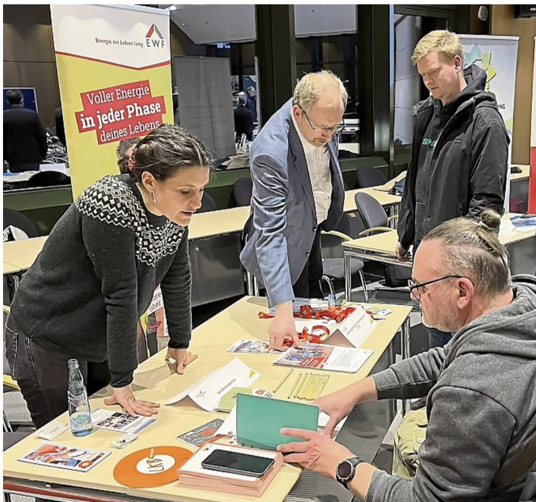
Beim „Markt der Fördermöglichkeiten“ des Landkreises Waldeck-Frankenberg informierten sich zahlreiche ehrenamtlich Engagierte über Unterstützungsangebote.

Beim „Markt der Fördermöglichkeiten“ im Kreishaus in Korbach über Fördermöglichkeiten informiert