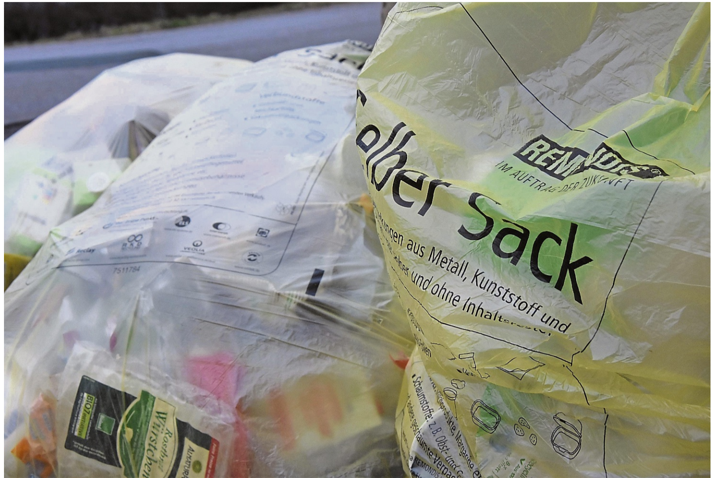
Vorteil oder Nachteil? Die Stadtverordneten diskutieren die Umstellung im Stadtgebiet von gelben Säcken auf Tonnen.