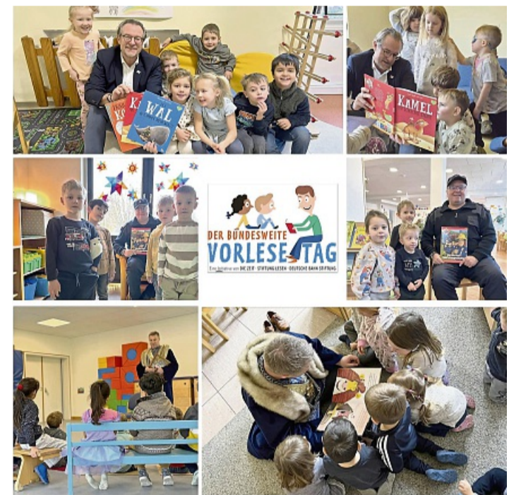
Bundesweiter Vorlesetag: Bürgermeister, Händselmeister und Stadtbrandinspektor lesen in Sontras Kindertagesstätten.

Goldankauf bei Juwelier Kunze Wir kaufen alten Schmuck, Münzen, Bestecke, Zahngold Tel. und WhatsApp 05653-643