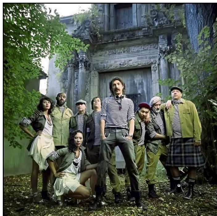
Gogol Bordello ist eine Band aus New York, die 1999 gegründet wurde.

Theaterplatz 4+7 | 99817 Eisenach landestheater-eisenach.de