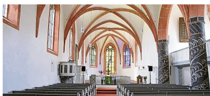
In der evangelischen Stadtkirche findet das Weihnachtskonzert statt.

Schülerinnen und Schüler sowie Lehrkräfte werden erneut mit einem besinnlichen Abend auf Weihnachten und die Weihnachtsferien einstimmen. Um eine Überfüllung der Kirche zu vermeiden, werden wieder Eintrittskarten für das Weihnachtskonzert ausgeben. Es wird in diesem Jahr kein Eintrittsgeld erhoben - beim