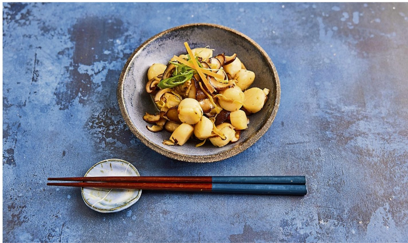
Jakobsmuscheln und Shiitake-Pilze vereinen sich zu einem feinen und aromatischen Gericht.