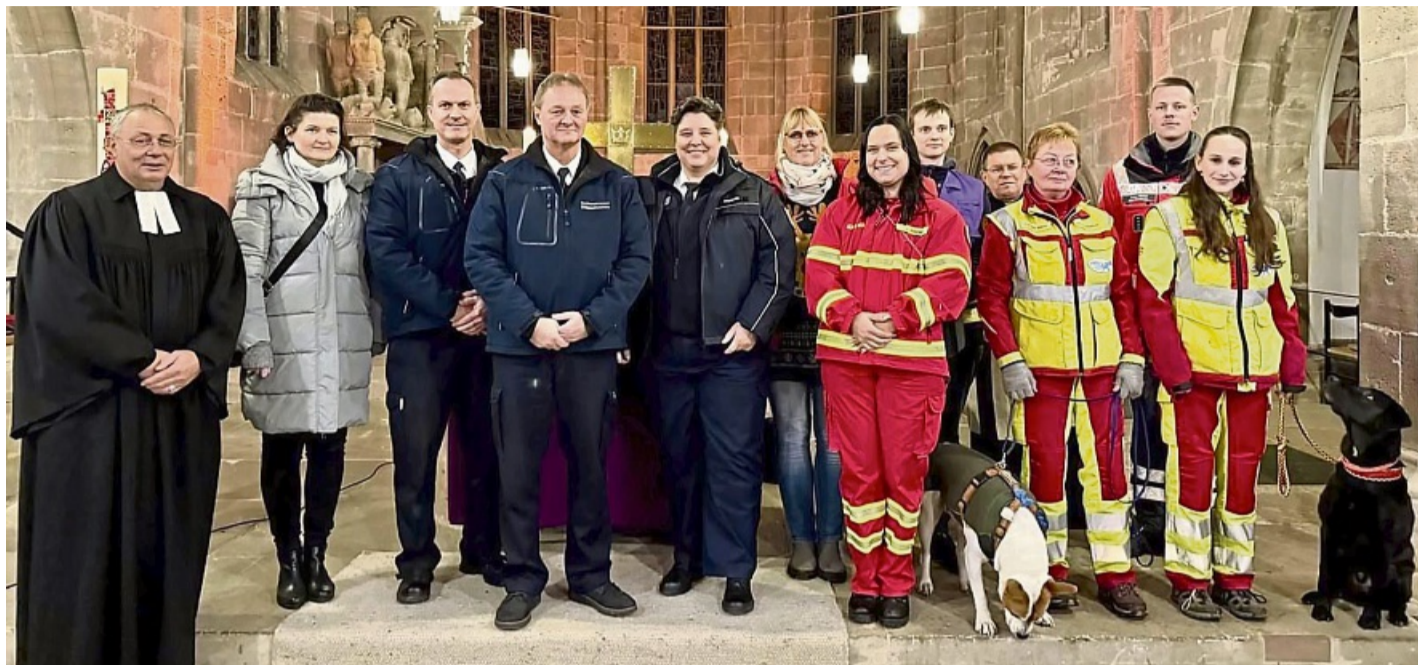
Feuerwehr, DRK, Polizei, DLRG und Notfallseelsorge vereint in der Liebfrauenkirche: ein Gottesdienst für die Menschen hinter den Einsätzen.

In der Predigt, überschrieben mit „The show must go on“, erzählte Aschenbrenner von einem Abend, an dem während eines Gottesdienstes plötzlich sein Groupalarm ertönte; erst Entwarnung, dann erneuter Alarm. „Ein winziger Ausschnitt dessen, was unsere Dienste mit uns machen“, sagte er. Mit jedem Einsatz stehe man „unter Strom“, ohne zu wissen, was einen erwarte. Zweifel keimten, Fragen blieben. Doch in all dem liege eine Zusage: „Gottes Kraft ist in den Schwachen mächtig.“ Ein Satz, der trage, wenn man sich nicht als „Superfrau oder Supermann“ fühle. Im Totengedenken versammelte sich die Gemeinde um