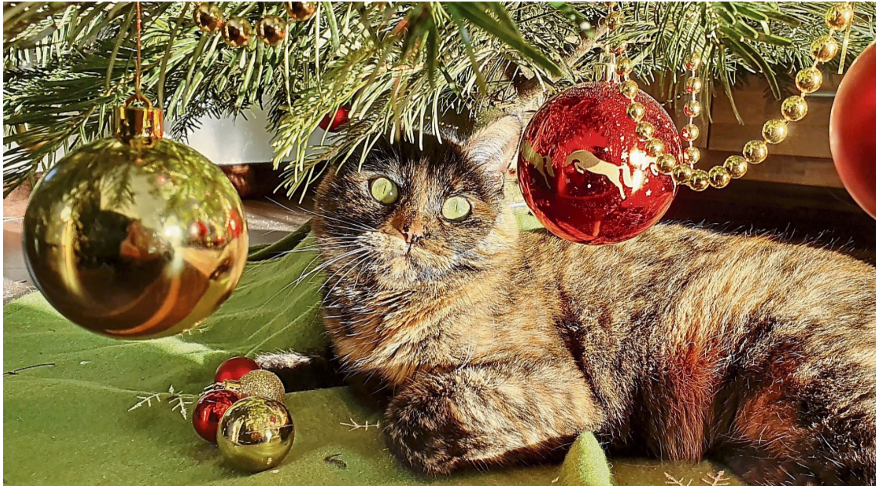
Tiere haben als Geschenk unter dem Weihnachtsbaum nichts zu suchen. Diese getigerte Katze lebte schon Jahre vorher in ihrer Familie, bevor sie unter dem Christbaum fotografiert wurde.

Vereine im Landkreis geben keine Tiere als Weihnachtsgeschenk ab