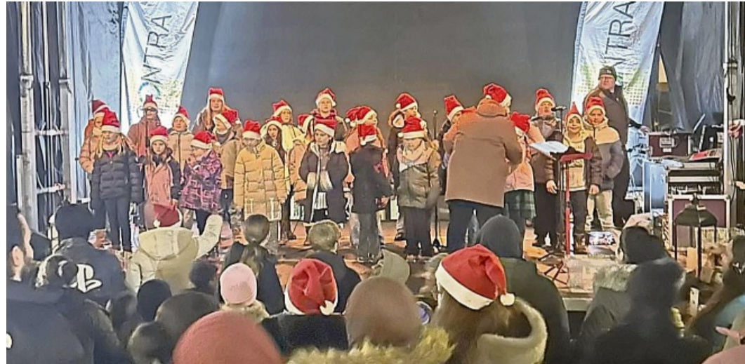
Der erste öffentliche Auftritt des Schulchores der Regenbogenschule auf dem Kupferstädter Adventsmarkt begeisterte die Besucher

„Ein riesiges Dankeschön geht an alle Helferinnen und Helfer, die HEWA-Veranstaltungstechnik, die ASH, alle Marktteilnehmerinnen und