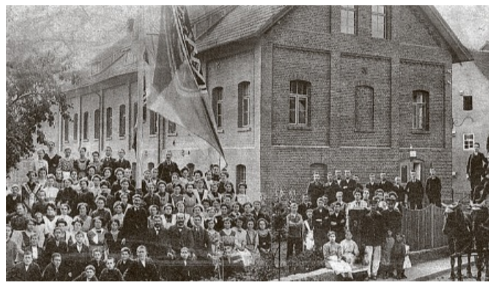
Fotos von früher: Die Einweihung der Zigarrenfabrik in Son- tra im Jahr 1912.

Das Erzähl-Café versteht sich als offener Raum für Bege- gung, in dem persönliche Ge- schichten, alltägliche Erfah- rungen und gemeinsame Erin- nerungen Platz finden. „Wir möchten Menschen zusam- menbringen – unabhängig von