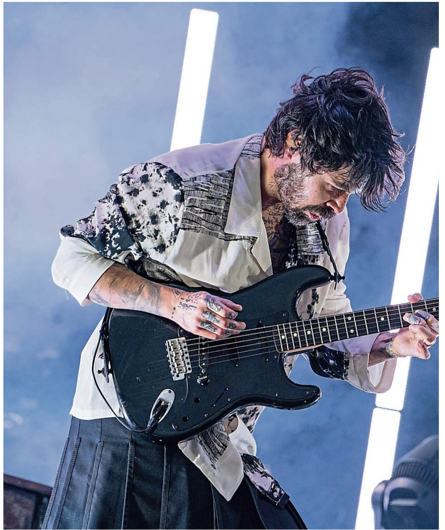
Biffy Clyro kommt nächsten Sommer zum Open Flair zurück.

Vor sage und schreibe 25 Jahren erschien auf dem Label New Noize von Papa Roach das später mit Platin ausgezeichnete Album „ANTHology“. Insbesondere mit den Single-Hits „Movies“ und „Smooth Criminal“ haben Alien Ant Farm zwischen Rock und Alternative Metal einen wahren Meilenstein in die Landschaft gepflanzt. Die Freundschaft zwischen beiden Bands währt bis heute und auch die wiederentdeckte Relevanz bei nachkommenden Generationen haben die beiden Kulttruppen aus Kalifornien ge-