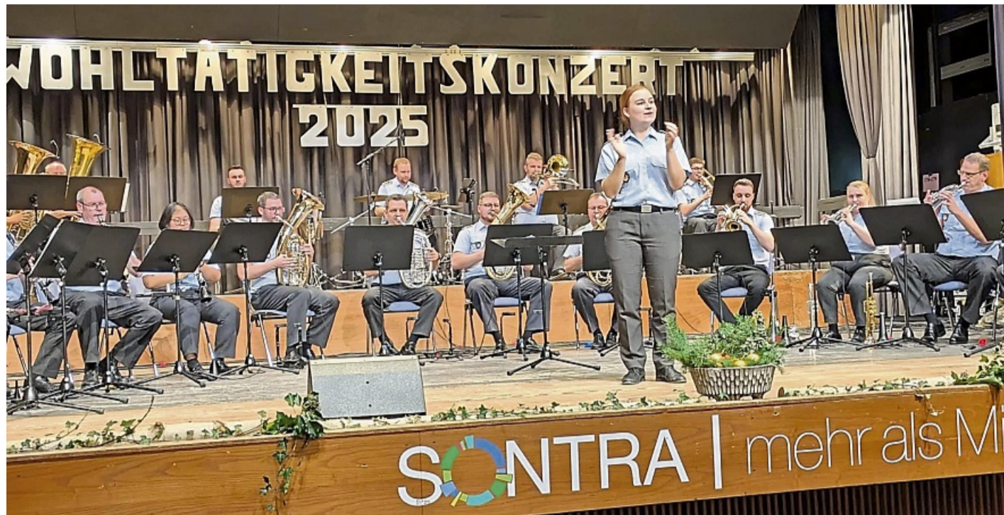
Die Egerländer Besetzung des Heeresmusikkorps überzeugte wieder einmal mit ihrem musikalischen Können.

Der gesamte Abend stand im Zeichen des großen Ernst Mosch, der in diesem Jahr 100 Jahre alt geworden wäre. Moderatorin Diana Blume kündigte daher „eine Reise in die Vergangenheit zu den Wurzeln des Meisters“ an. In den folgenden Runden erklangen abwechselnd Märsche, zarte Walzer und humorvolle Variationen typischer Polkarhythmen – darunter die schwungvolle „Paula-Polka“, eine musikalische Hymne auf eine Münchner Brauerei.