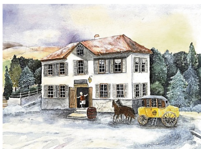
Lions-Club Eschwege-Werratal Adventskalender 2025 Alter Felsenkeller beim Schwimmbad in Eschwege