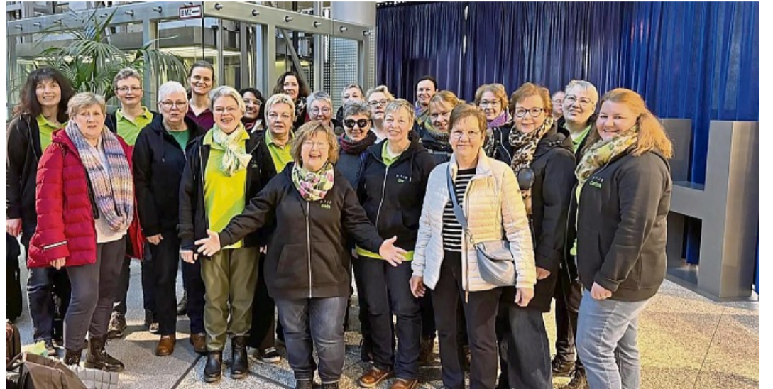
Hessens Helden: Mixed Colours – hier kann man neben Chormusik auch viel Spaß haben

Die hessischen Vereine sind ein Ankerpunkt für unsere Ge- sellschaft! Durch sie wird ange- packt, diskutiert, geholfen oder gemeinsam Sport getrieben. Dafür opfern die vielen, vielen ehrenamtlichen Vereinshelden ihre Freizeit, um sich in den Dienst der Gemeinschaft zu stellen. Ihr aufopferungsvoller Dienst für unser gesellschaftli- ches Leben ist bemerkenswert und extrem wichtig für den Zu- sammenhalt in den hessischen Städten und Gemeinden.