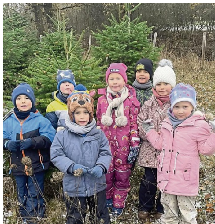
Die Vorschulkinder suchten den schönsten Baum für ihre Kindertagesstätte aus.

Mit großer Begeisterung und einer demokratischen Abstimmung entschieden sich die Kinder schließlich für ihren perfekten Baum. Der gesamte Prozess wurde liebevoll von den Er-