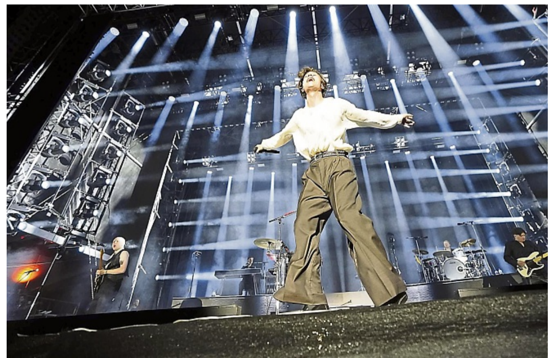
Die Giant Rooks aus Hamm werden inzwischen millionenfach gestreamt.