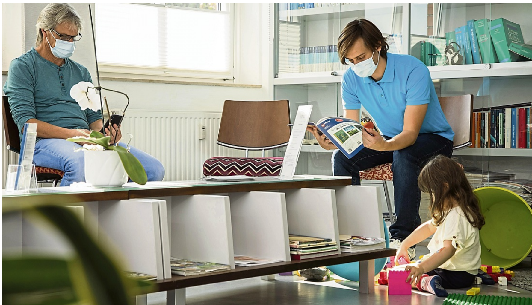
Um Kinderkrankengeld zu erhalten braucht es eine ärztliche Bescheinigung.

Voraussetzungen für das Zahlen von Kinderkrankengeld ist laut einer Sprecherin des GKV-Spitzenverbandes, dass das erkrankte Kind jünger als zwölf Jahre oder behindert und auf Hilfe angewiesen ist und keine andere im Haushalt lebende Person die Pflege übernehmen kann. Zudem muss nach Angaben einer Sprecherin des Bundesministeriums für Gesundheit (BMG) eine ärztliche Bescheinigung die Krankheit beim Kind und die notwendige Beaufsichtigung, Betreuung oder Pflege des Sprösslings bezeugen.