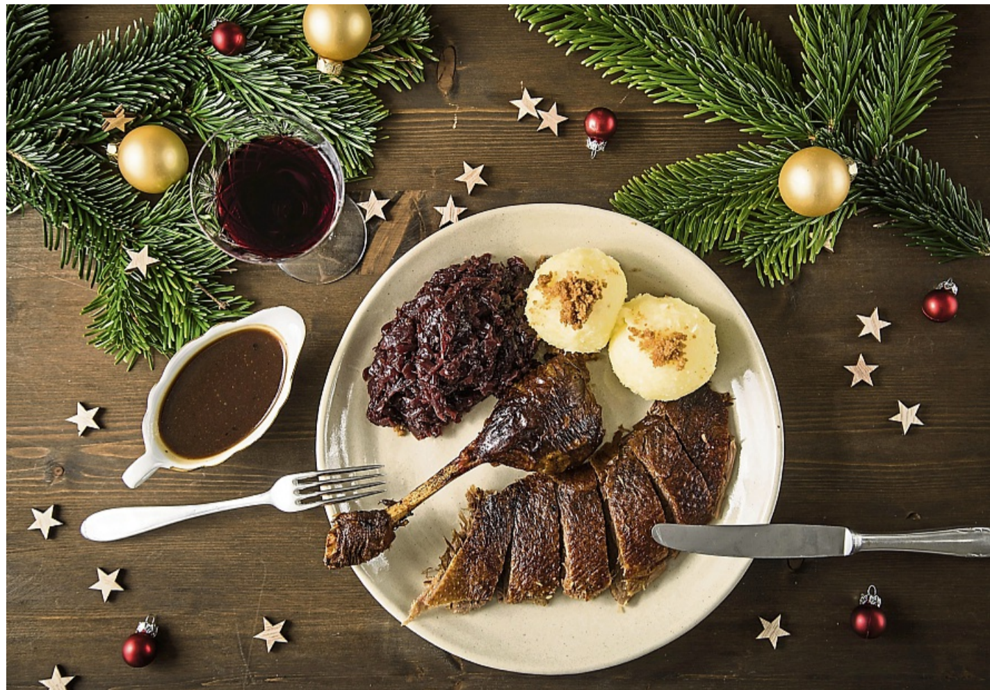
Tradition bleibt Trumpf: Geflügel steht an Weihnachten ganz oben auf dem Speiseplan.

Was die Umfrage zum Festtagsessen aber auch ans Licht brachte: Trotz wachsender ökologischer Sensibilität spielt Nachhaltigkeit beim Weihnachtsessen für 58 Prozent der Befragten eine geringere Rolle als im restlichen Jahr. An Weihnachten überwiege der Genuss. Bei den Fischessern achtet nur rund ein Drittel (30 Prozent) beim Festtagsfisch besonders auf Nachhaltigkeit.