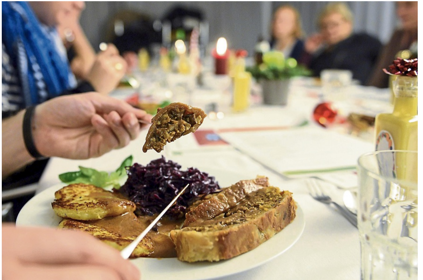
Vegetarische Gerichte mit saisonalem Gemüse wie Rotkohl, Wirsing oder Rote Bete sind günstige Alternativen zum klassischen Festtagsbraten.