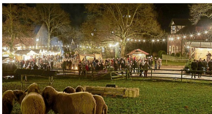
Im Lichterglanz: Das Areal rund um das Gut Hohenhaus ist Schauplatz des Erlebnis-Weihnachtsmarktes.

Für die Kinder wird es hier eine Bastelstube geben, eine uralte Märchenstunde und natürlich das Kerzenziehen mit Familie Fichtner. Und wieder können die nahe gelegenen