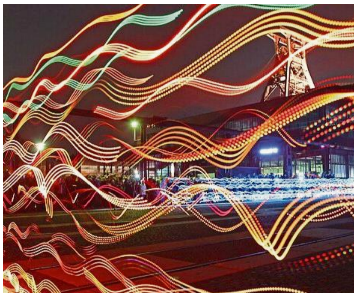
Axel M. Mosler verbindet die rein realistische klassische Art der Fotografie und die der Veränderung mithilfe des Computers.

Meist bleibt etwas übrig - aber für alle reicht es nicht mehr. Zaubern Sie aus den Resten nach dem Fest eine Gemüsepfanne oder befüllen Sie Wraps. Sind vom Raclette noch Käse und Gemüse übrig, bietet sich dieses Raclette-Risotto der Initiative „Zu gut für die Tonne“ an: Gemüsereste klein schneiden und in einer Pfanne anschwitzen, 150 g Risotto-Reis dazugeben und 3 min andünsten. Einen halben Liter Gemüsebrühe nach und nach angießen, bis der Reis weich ist. Raclette-Käse in Würfel schneiden, untermischen und cremig rühren. dpa