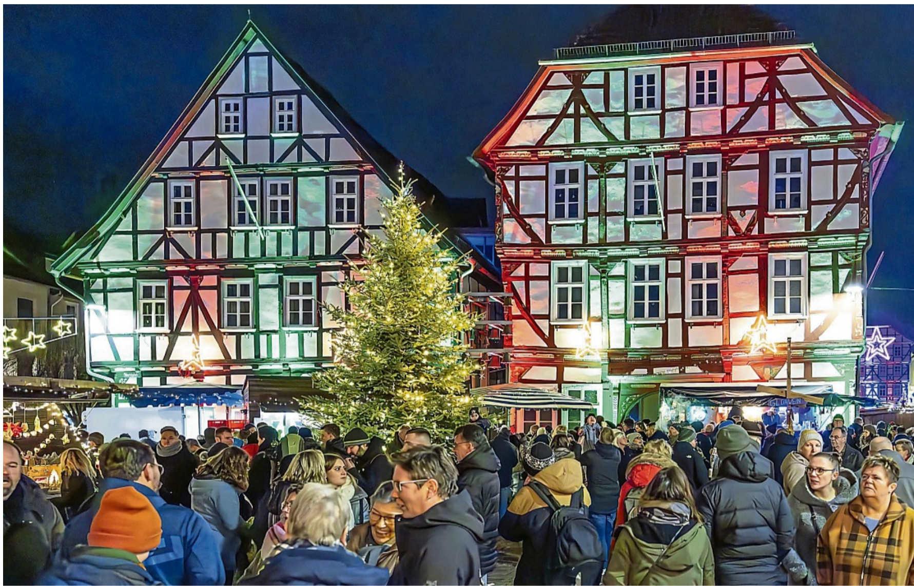
Auch in diesem Jahr hoffen die Veranstalter wieder, dass der Weihnachtsmarkt mit Flair auf dem Marktplatz in Eschwege gut besucht wird.