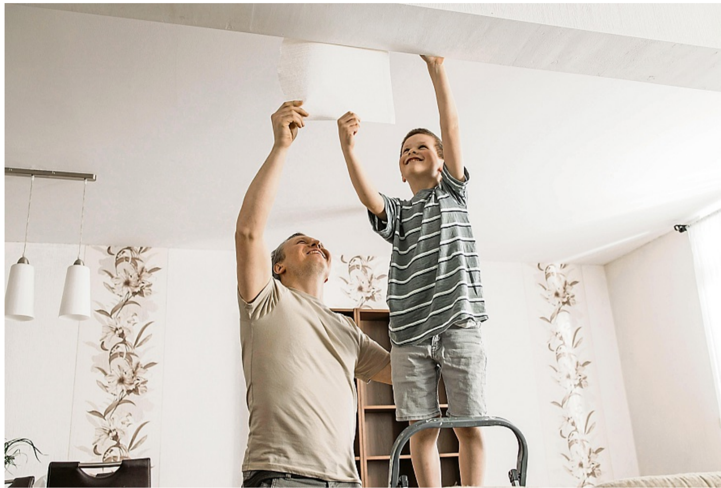
Mit Kindern heimwerken macht Freude – wenn man die passenden Projekte für die Kleinen wählt.

Für ältere Kinder, etwa ab sechs Jahren, eignen sich oft schon kleine Bauprojekte, die die Kreativität fördern. Ein paar Restabschnitte Holz, Schrauben und Unterlegscheiben und schon geht es los: Unter der Mithilfe der Eltern können Kinder so beispielsweise kleine Roboter entwerfen und zusammen-