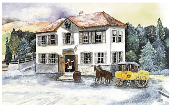
Lions-Club Eschwege-Werratal Adventskalender 2025. Alter Felsenkeller beim Schwimmbad in Eschwege

7492, 2364, 6956, 5372: 50-Euro-Gutschein für Teile oder Service (Autohaus Rabe, Eschwe-