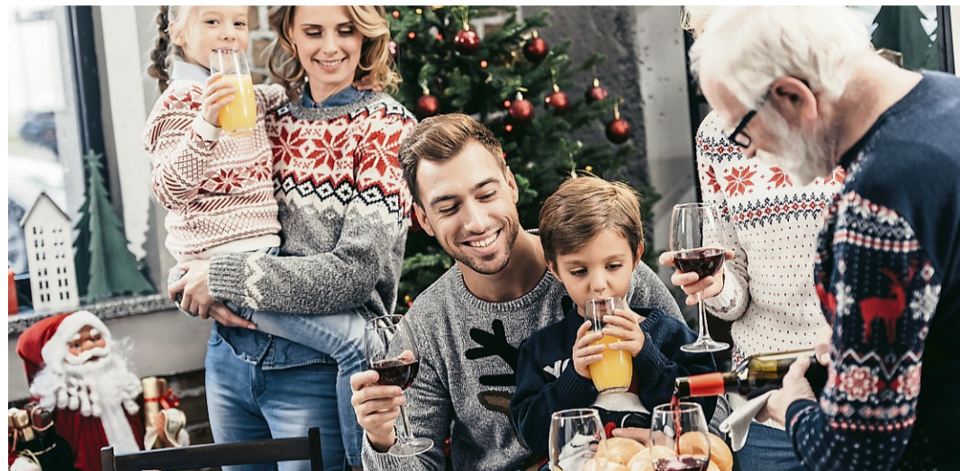
Wenn Sie zu den Singles gehören, deren Verwandtschaft aus allen Ecken anreist, um gemeinsam mit ihnen das Weihnachtsfest zu feiern, erscheint einem der Wunsch nach einer Partnerschaft vielleicht belanglos.

Wenn Sie zu den Singles gehören, deren Verwandtschaft aus allen Ecken anreist, um gemeinsam mit ihnen das Weihnachtsfest zu feiern, erscheint Ihnen der Wunsch nach einer Partnerschaft vielleicht belanglos. Denn eines ist sicher: Sie werden an Weihnachten nicht allein sein, sondern im Kreise Ihrer Liebsten. Und doch kennen auch Sie vielleicht diese kleinen Momente, in denen Sie sich trotz Gesellschaft einsam fühlen. Die regionale Online-Partnerbörse partner.HNA.de bietet Ihnen die Möglichkeit,