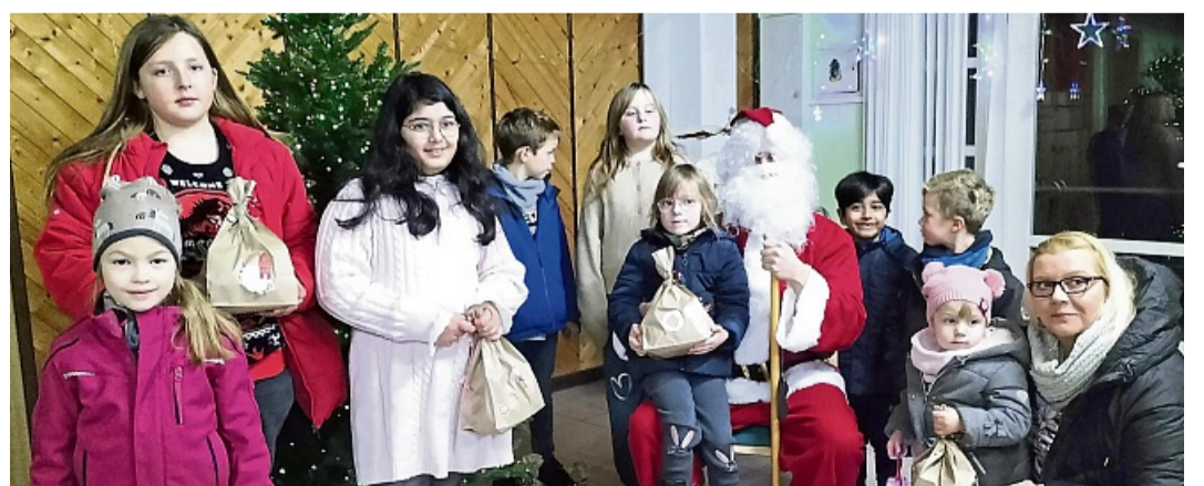
Adventsnachmittag des Schützenvereines Mitterode mit Besuch vom Nikolaus.

Danach verteilte der Nikolaus seine mitgebrachten Gaben an