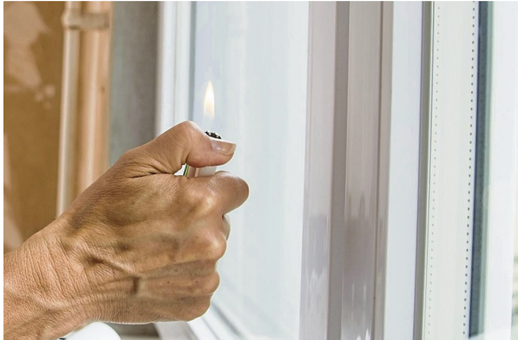
Mit dem Kerzen- oder Feuerzeugtest kann man Zweifach- und Dreifachverglasung sowie Wärmeschutzbeschichtungen erkennen: Violette Spiegelbilder deuten auf eine Beschichtung hin.

Bei einer Zweifachverglasung ohne Wärmeschutzbeschich-