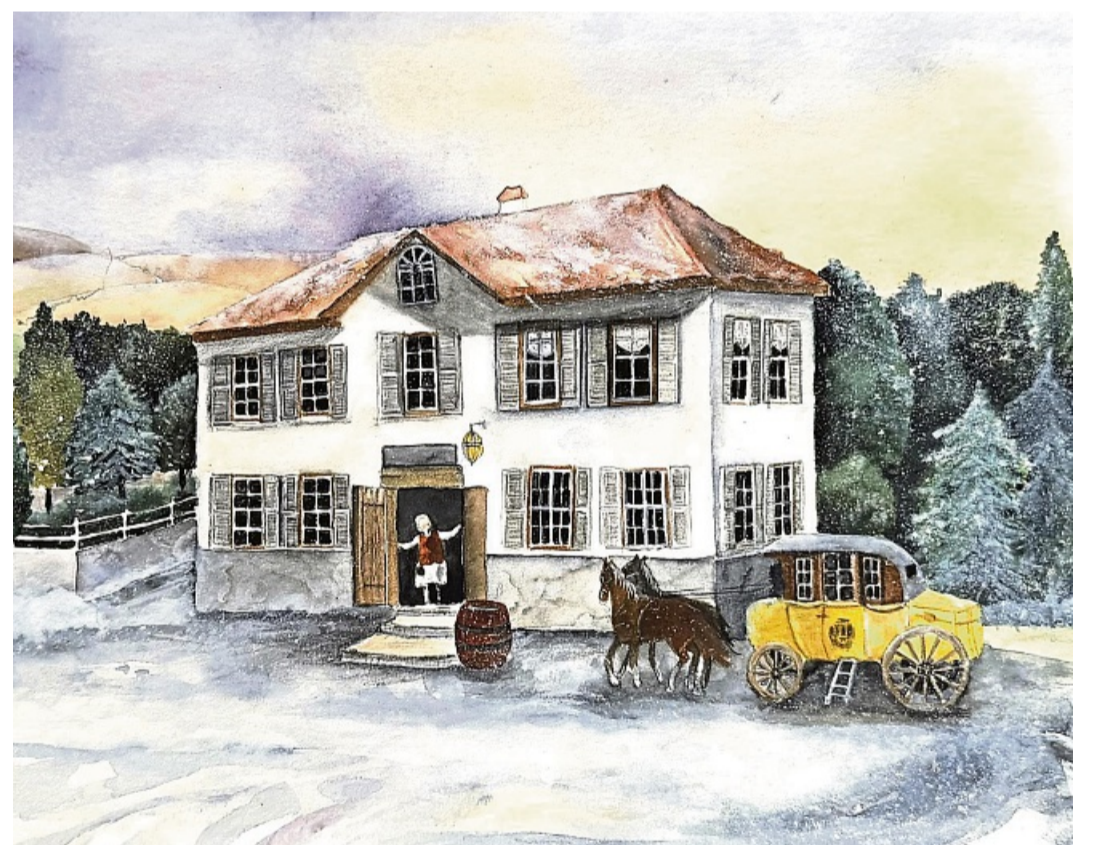
Lions-Club Eschwege-Werratal Adventskalender 2025 Alter Felsenkeller beim Schwimmbad in Eschwege Bild von Monika Aschhoff aus Wanfried

4183, 4944, 803, 4052, 7380, 3979, 6561: 50-Euro-Theatergutschein (Praxis für Physiotherapie Manuela Prof, BSA); 1091, 1892, 3680, 4107, 321, 1836, 2712: 50-Euro-Reisegutschein (Soodener Reisebüro, BSA); 2062, 5964, 1854, 2904, 4473, 227: 25-Euro-Gutschein für Bildereinarbeitung (Glaseri Zugowski, Eschwege); 5772, 4078, 2330: Trainingseinheit (Power Fitness, Eschwege); 1583, 4207, 2255, 1145, 4221, 661, 4682, 934, 6649, 3927: 20-Euro-Gutschein (Vinothek Villa