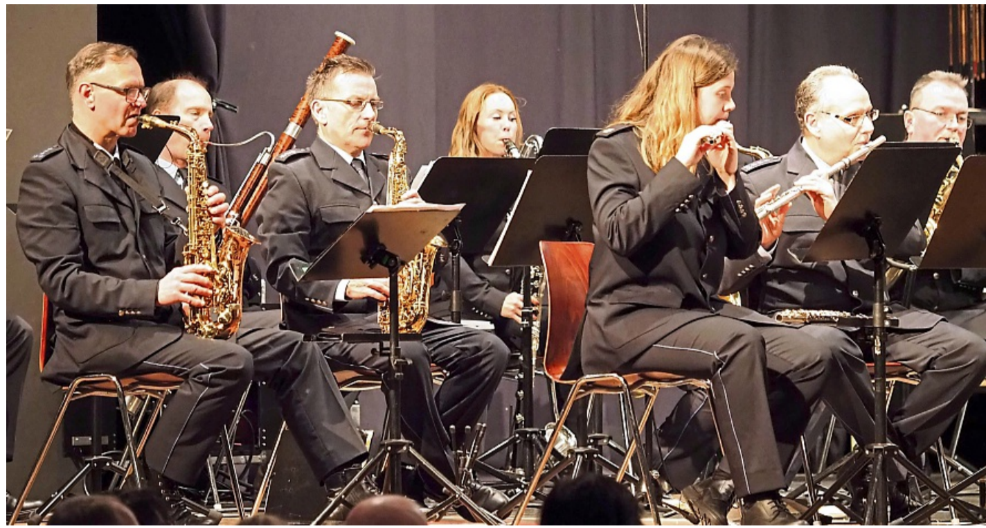
Gelungener Abend: Zum 70. Mal bestritten die Musiker ein vorweihnachtliches Wohltätigkeitskonzert in der Stadthalle.