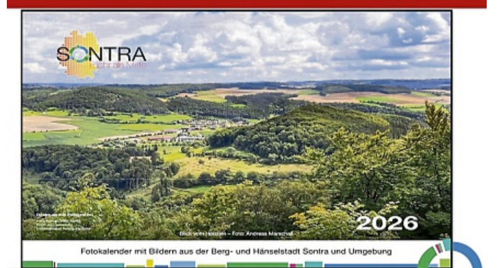
Ein schönes Weihnachtsgeschenk: Der Sontraer Fotokalender 2026.