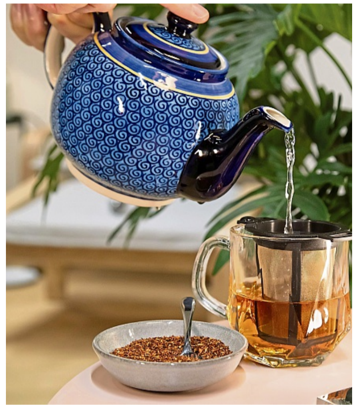
Der Tee mit besonderem Aroma: Rooibos schmeckt süßlich wie Schwarztee, ist aber koffeinfrei.